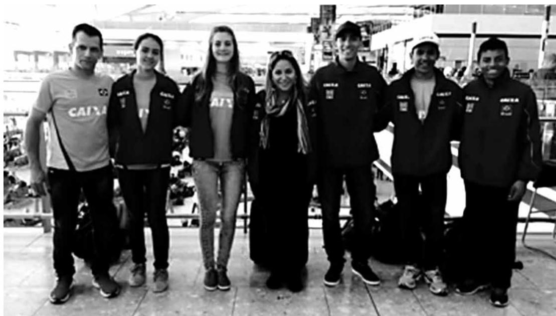
Os cinco atletas, juntamente com seus treinadores, já estão em Manchester representando o país

Os Jogos Escolares da Juventude são organizados e realizados pelo Comitê Olímpico do Brasil, correalizados pelo Ministério do Esporte.