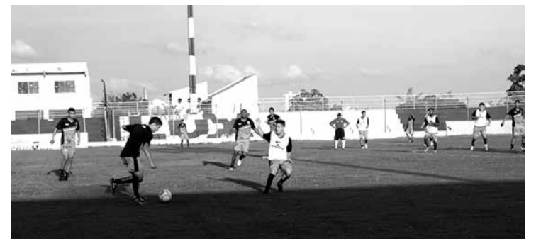
Ontem, equipe treinou forte visando o compromisso de domingo