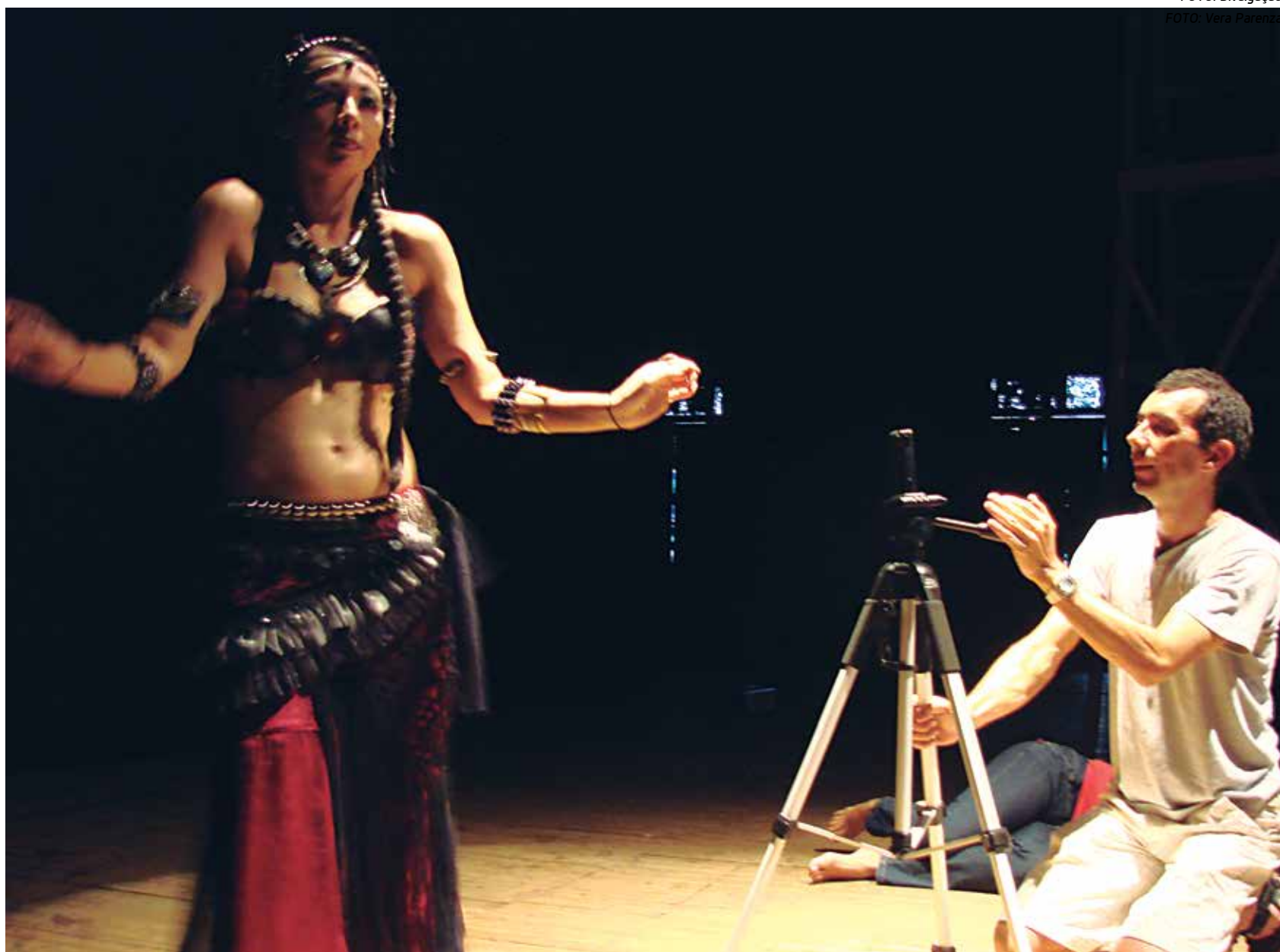
O processo de gravação de um trabalho audiovisual de videodança, uma expressão que deixa mais próximos o cinema e a dança