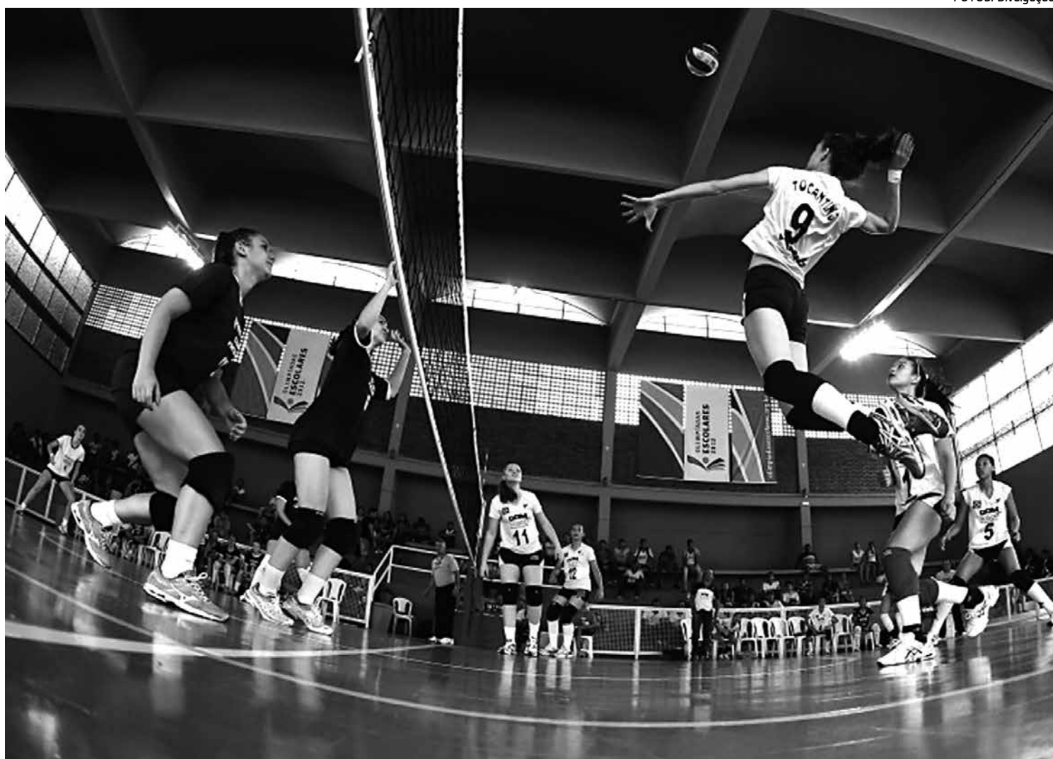
O Basquete é uma das modalidades que estarão em disputa no maior evento esportivo estudantil brasileiro, na cidade de Londrina

“Eu vejo que muitos atletas que participam dos Jogos Escolares podem chegar à Seleção Brasileira, como foi o meu caso. Temos muitos atletas talentosos, experientes, apesar da pouca idade. Os Jogos Escolares são uma base para eles”, afirmou a judoca Sarah Menezes, medalhista olímpica