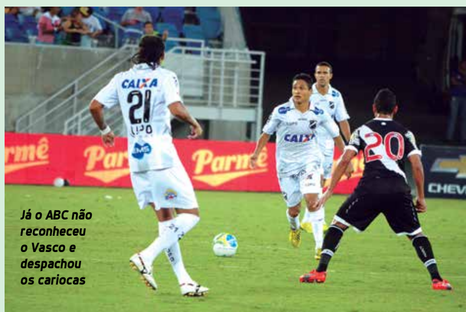
Já o ABC não reconheceu o Vasco e despachou os cariocas

Esta é a primeira vez que ABC e América-RN chegam às quartas de final da Copa do Brasil. Apenas quatro estados seguem vivos na Copa do Brasil. Além do Rio Grande do Norte, o Rio de Janeiro está representado por dois clubes: Botafogo e Flamengo. São Paulo já conta com Santos e Corinthians, e pode ganhar mais um - o Palmeiras encara o Atlético-MG nesta quinta-feira. Minas Gerais, que ainda pode ter o Galo, já tem o Cruzeiro. ABC x Cruzeiro, América-RN x Flamengo e Santos x Botafogo são os confrontos já conhecidos. O Corinthians aguarda Atlético-MG ou Palmeiras.