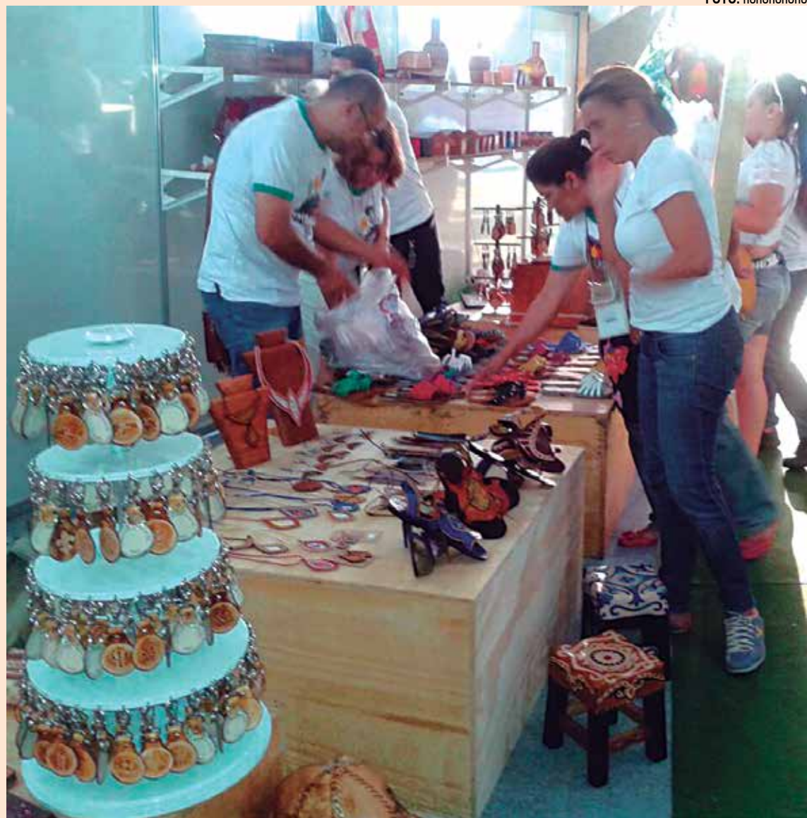
Peças artesanais de várias tipologias estão expostas em estande em feira que se encerra hoje

A Ruraltur é um evento que já faz parte do calendário nacional do turismo rural e, a partir do próximo ano, será itinerante, começando pelo Estado do Rio Grande do Norte, depois no Ceará, Pernambuco e Rio Grande do Sul. A feira ocorre na sede da Federação da Indústria do Estado da Paraíba (Fiep), localizada Av. Manoel Gonçalves Guimarães, 195 - José Pinheiro. Mais informações no site ruraltur.sebraepb.com.br ou pelo telefone 2108-1256. A entrada é franca.