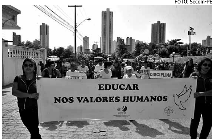
Evento reuniu usuários, reabilitados, familiares e servidores

Tradicionalmente, no desfile do 7 de Setembro, apenas 150 usuários participam, entretanto, para o desfile de ontem, todos foram convidados. Eles foram conduzidos por professores, reabilitadores e servidores da instituição. As famílias também participaram, acompanhando seus filhos. Pelas calçadas, moradores do bairro aplaudiram e vibraram com o civismo e en-