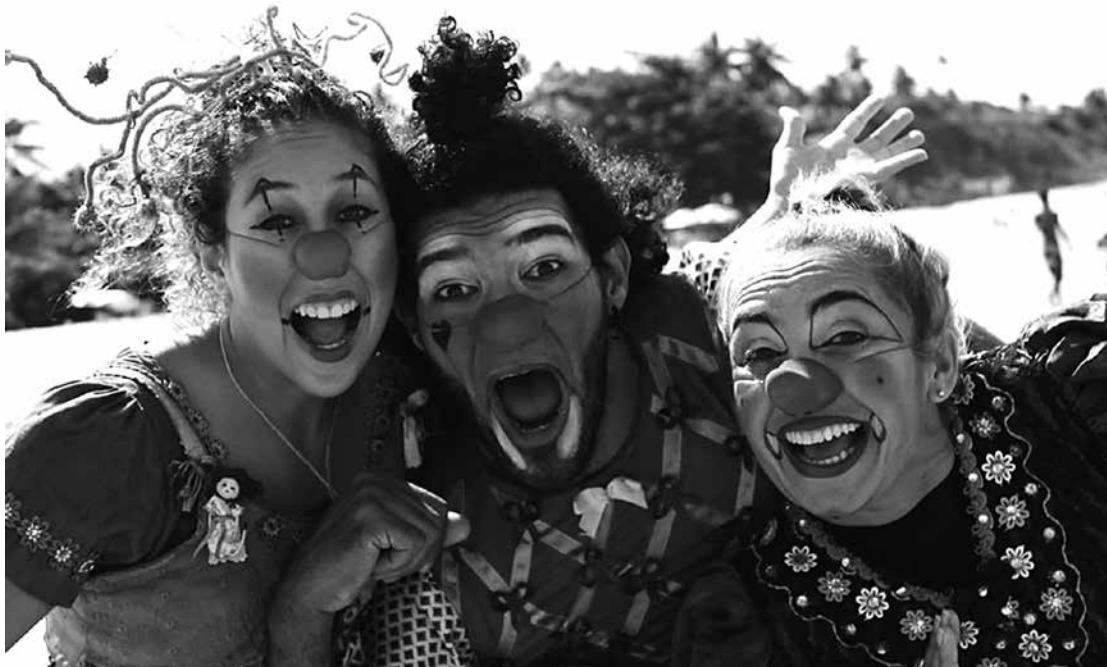
Cena do espetáculo que retrata questões humanas de uma forma muito divertida