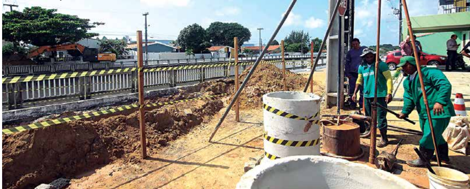
Obra faz parte do projeto para implantação na capital do Veículo Leve sobre Pneus e do Bus Rapid Transit

Prefeitura de João Pessoa inicia em Tambauzinho a construção de mais um viaduto sobre a BR-230. PÁGINA 13