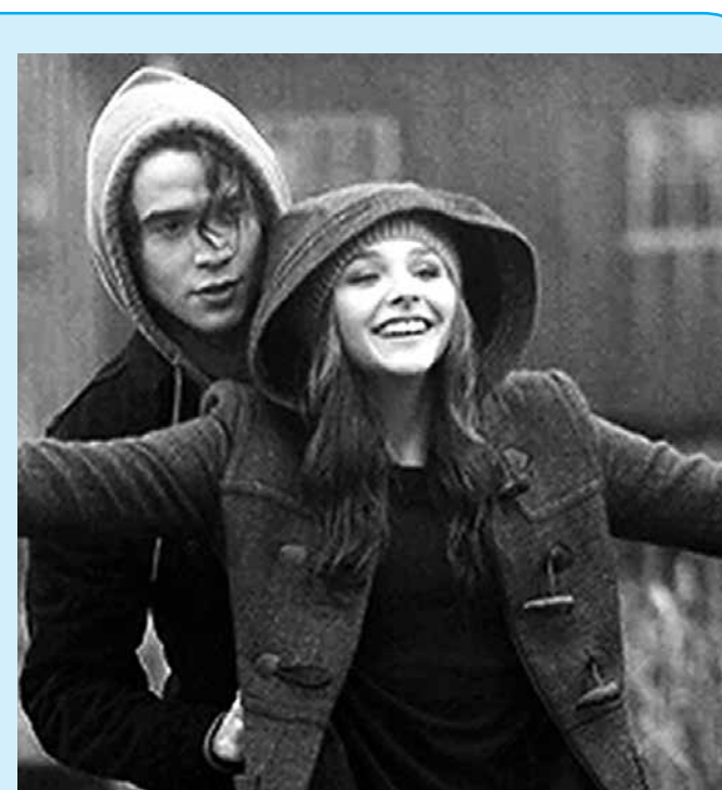
Drama aborda reflexões a respeito da vida

ANJOS DA LEI 2 (EUA 2014). Gênero: Comédia. Duração: 119 min. Direção: Phil Lord e Christopher Miller. Com Channing Tatum e Jonah Hill. Os oficiais Schmidt e Jenko têm agora uma nova missão: se infiltrar em uma faculdade local. Maneira 4 : 13h15, 15h45, 18h30 e 21h15. Tambá 4 : 14h10, 16h25, 18h40 e 20h55.