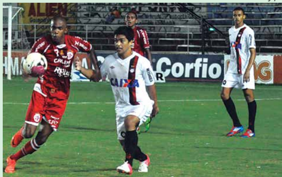
O América eliminou o Atlético do Paraná e chega de forma brilhante à nova fase

O melhor momento do Mecão na competição, porém, foi registra-