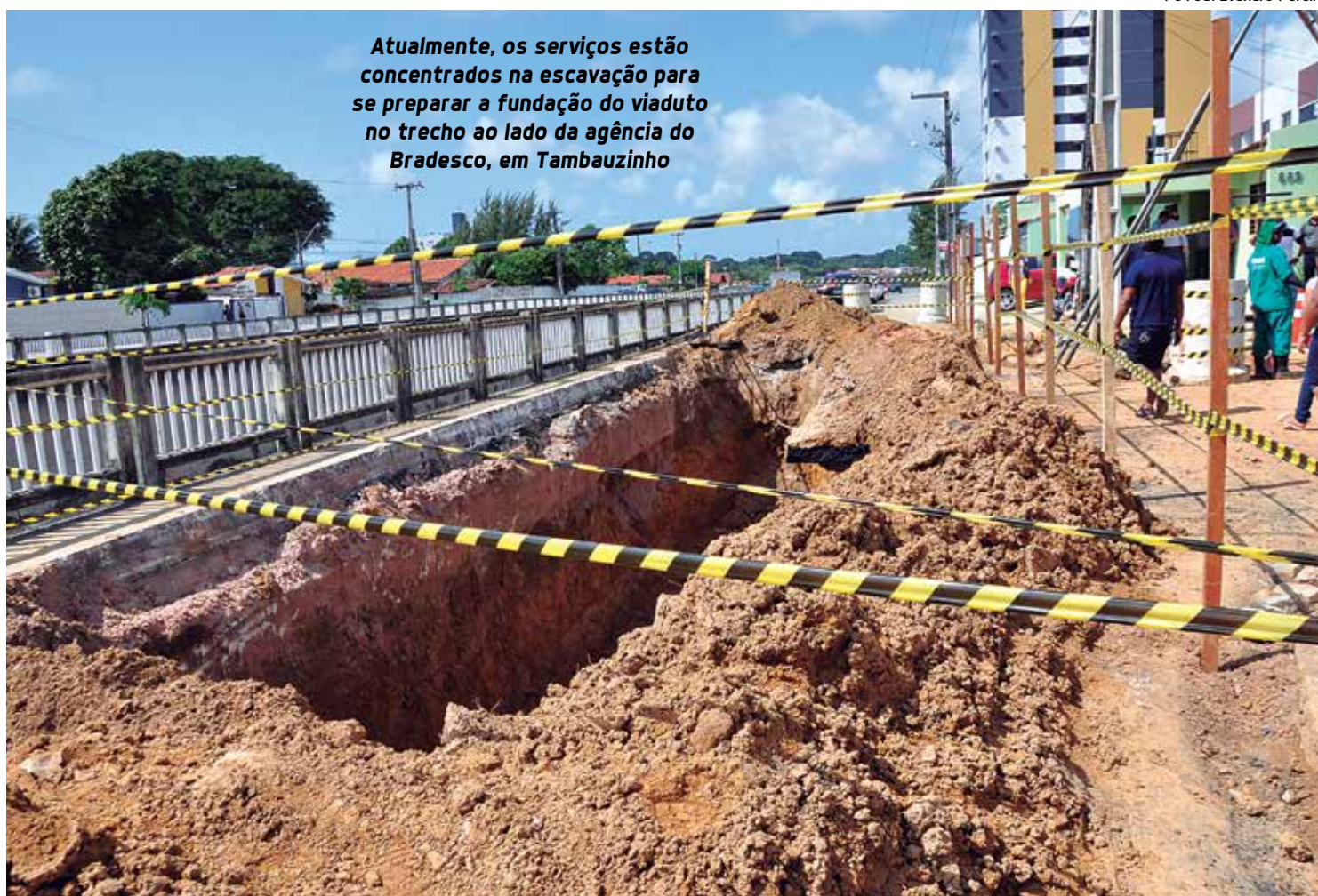
Atualmente, os serviços estão concentrados na escavação para se preparar a fundação do viaduto no trecho ao lado da agência do Bradesco, em Tambauzinho