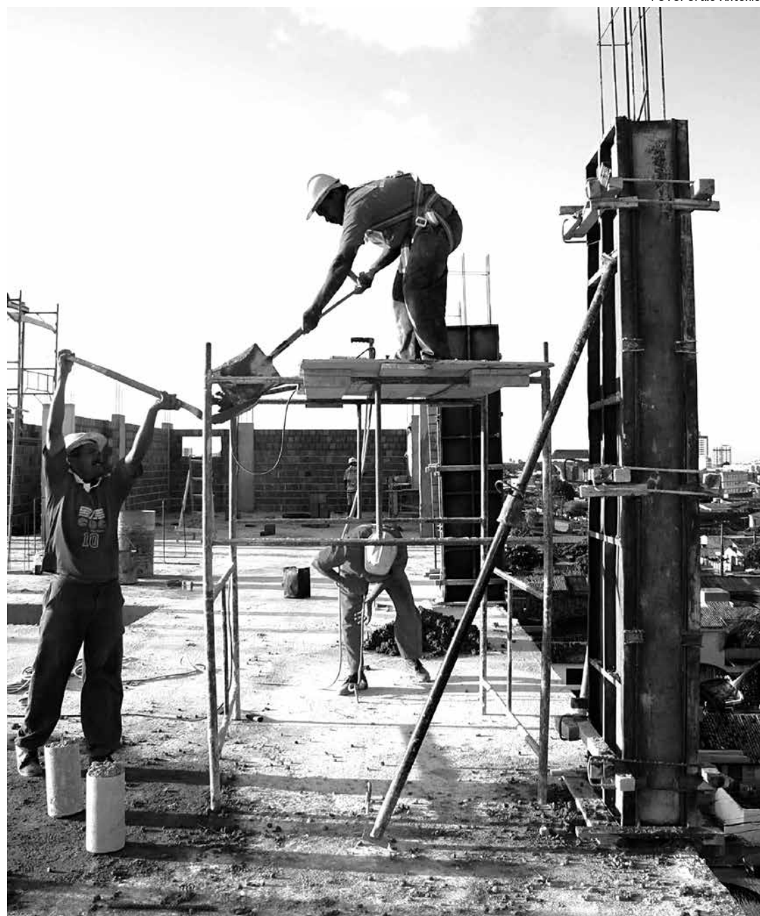
Número de pessoas empregadas no setor em 2012 foi de 36.673, com aumento de 33% em relação a 2010

Em 2012, o Sudeste continuou líder em pessoal ocupado (55,1%) e em valor das incorporações, obras e serviços da construção (62,0%), mas em relação a 2011, as regiões que mais cresceram proporcionalmente, em valor das incorporações, obras e serviços da construção foram a Sul (0,7 ponto percentual) e a Nordeste (0,6 ponto percentual).