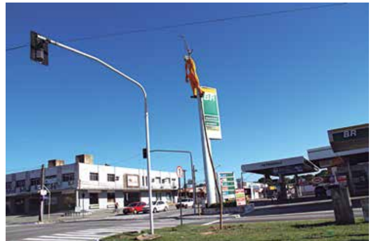
A população do bairro da Torre participou ontem da "malhação"