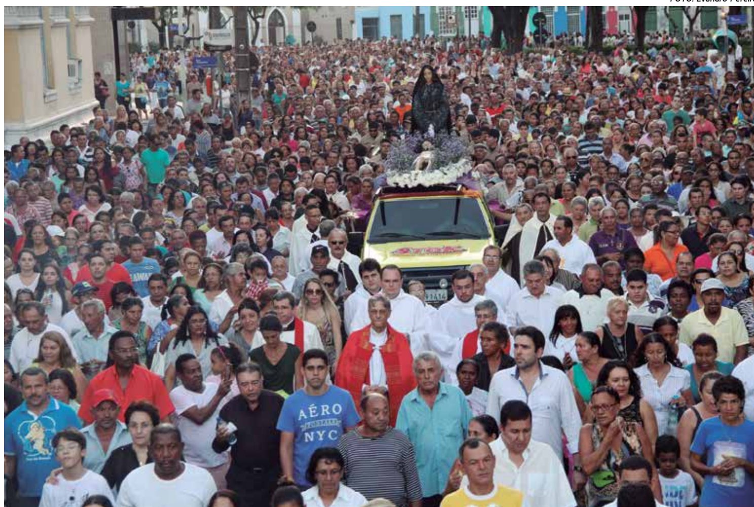
Acompanhados pelo arcebispo, os católicos seguiram as imagens do Nosso Senhor Morto e de Nossa Senhora da Soledade

As imagens de santos que cercavam o local estavam envolvidas em um pano roxo e só serão descobertos