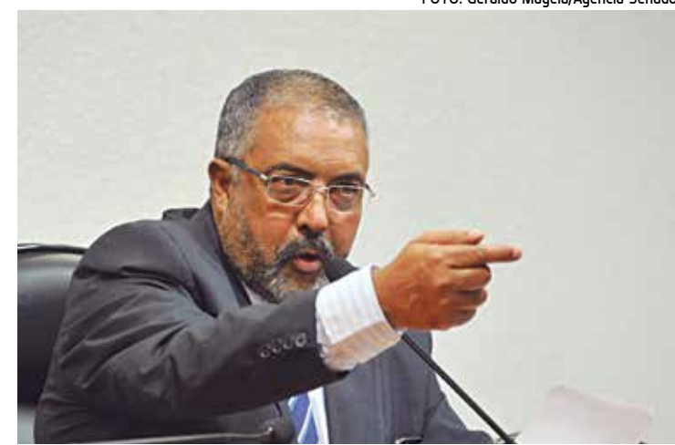
Senador Paulo Paim (PT-RS) já recebeu os dois ministros na Casa

A MP 664/2014 muda as regras de direitos previdenciários como a concessão de pensão por morte e o auxílio-doença. Com a medida, a pensão por morte passou a só ser concedida ao cônjuge que comprove, no mínimo, dois anos de casamento ou união estável. Antes não havia exigência de período mínimo de relacionamento. Também passou a ser necessário comprovar 24 meses de contribuição para a Previdência.