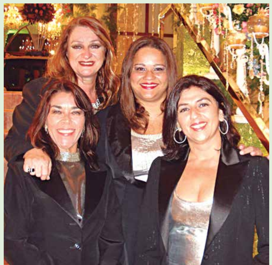
Show memorável do Grupo Nossa Voz no Paço dos Leões . O ano era 2007 e "nossas cantoras de ouro" fizeram mais uma vez bonito no evento social