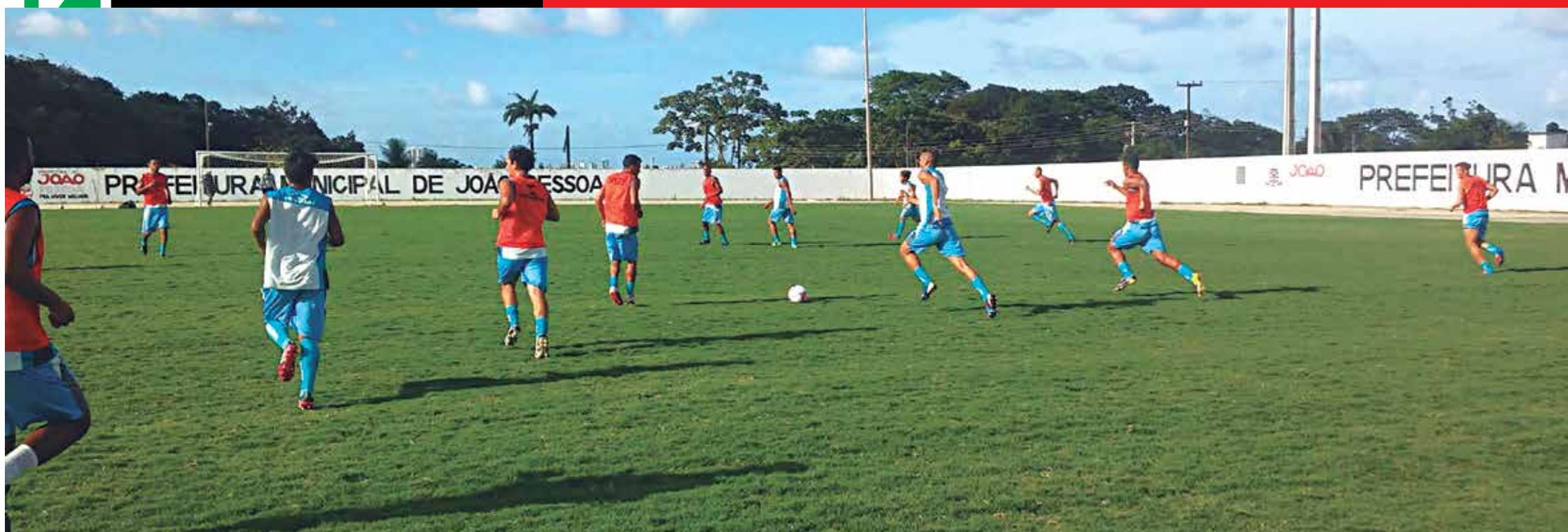
O campo do Valentina vai servir de palco para o jogo deste sábado pelo Campeonato Paraibano, onde o CSP, franco favorito, enfrenta o Miramar com chances reais de ultrapassar o Auto na classificação