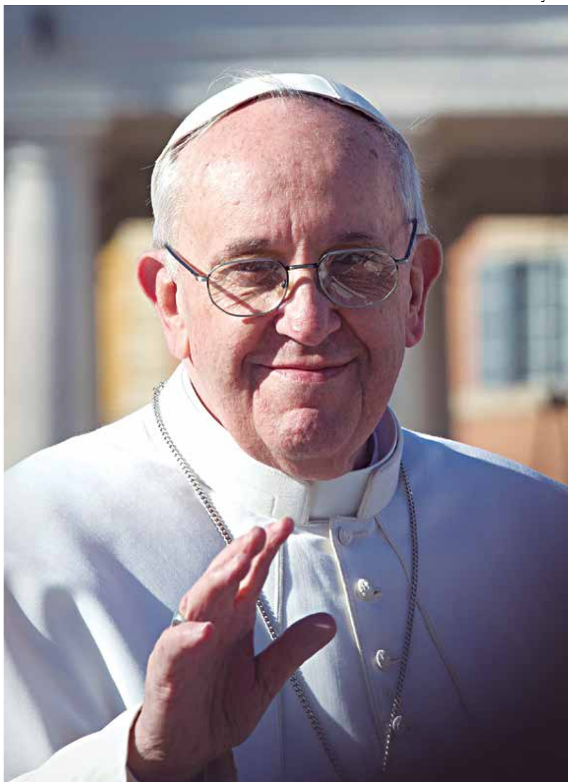
O papa Francisco expressou a sua solidariedade às famílias das vítimas do atentado terrorista