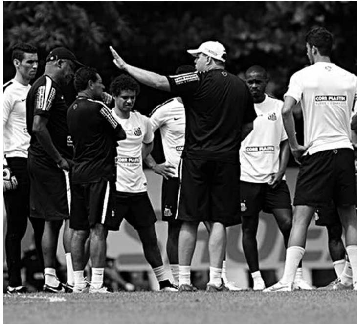
O técnico Marcelo Oliveira orienta os jogadores durante coletivo

O Santos tem um grande desafio amanhã. Às 16h, o time de Robinho e companhia encara o invicto Corinthians, em Itaquera, e que faz uma bela campanha na Libertadores. E a inegável boa fase da equipe de Tite preocupa o técnico Marcelo Fernandes, que ontem admitiu a intenção de mexer na formação do Peixe para o clássico.