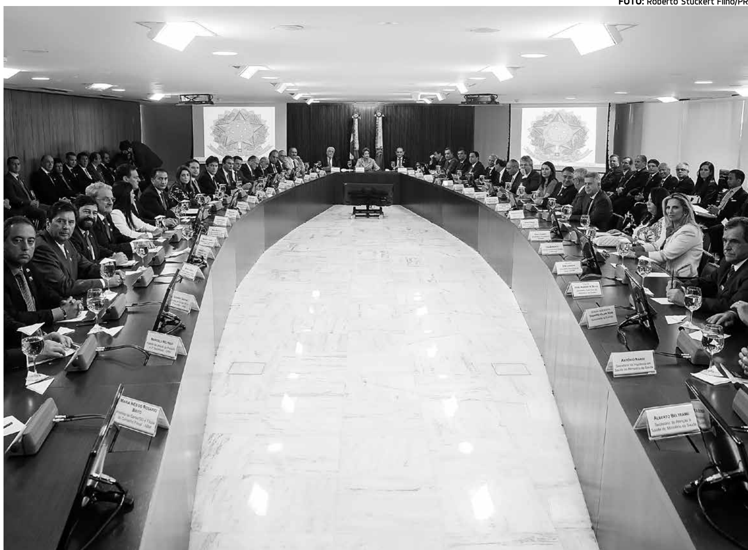
Presidente Dilma Rousseff reuniu-se ontem com todos os governadores do País para tratar sobre o combate ao Aedes aegypti

Ricardo anunciou que, nos próximos dias, apresenta o plano estadual, onde detalha a proposta apresentada na reunião em Brasília. "Estou anunciando, nos próximos dias, o plano estadual, que terá uma série de intervenções, mas propus à presidente e aos governadores algo que vai além do zika vírus e do Aedes aegypti. É um sistema de acompanhamento das gestantes e das crianças. Com isso, a gente teria não só o monitoramento em função da microcefalia, mas a diminuição drástica da mortalidade mater-