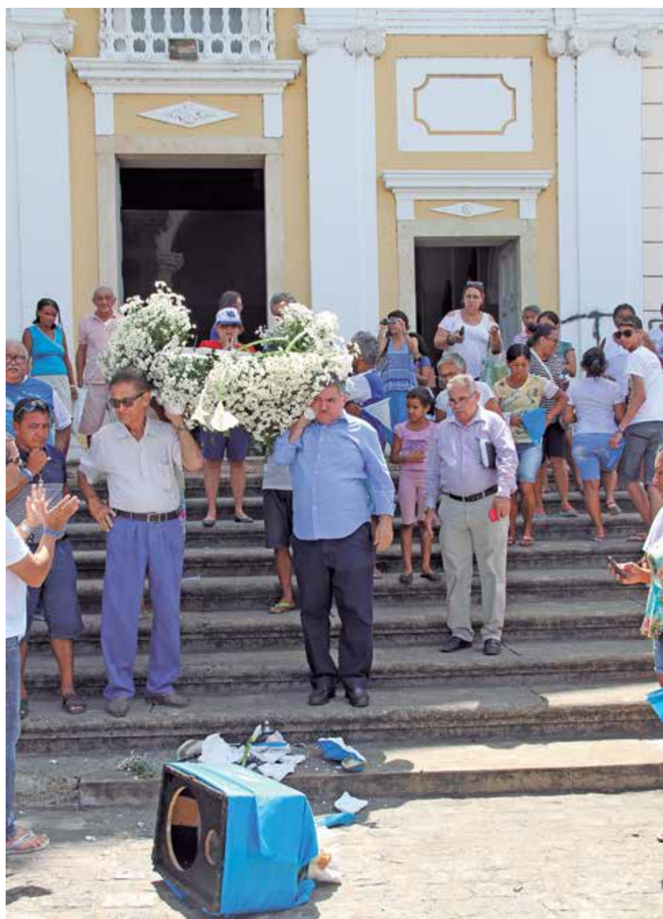
Logo após sair da igreja, queda que deixou a imagem em cacos surpreendeu os fiéis