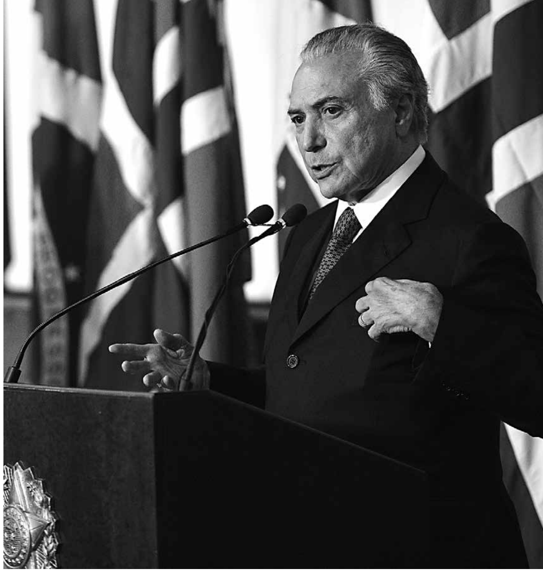
Decretos assinados por Temer em 2015 apresentaram um volume três vezes superior aos de Dilma

Os decretos assinados por Temer, somente em