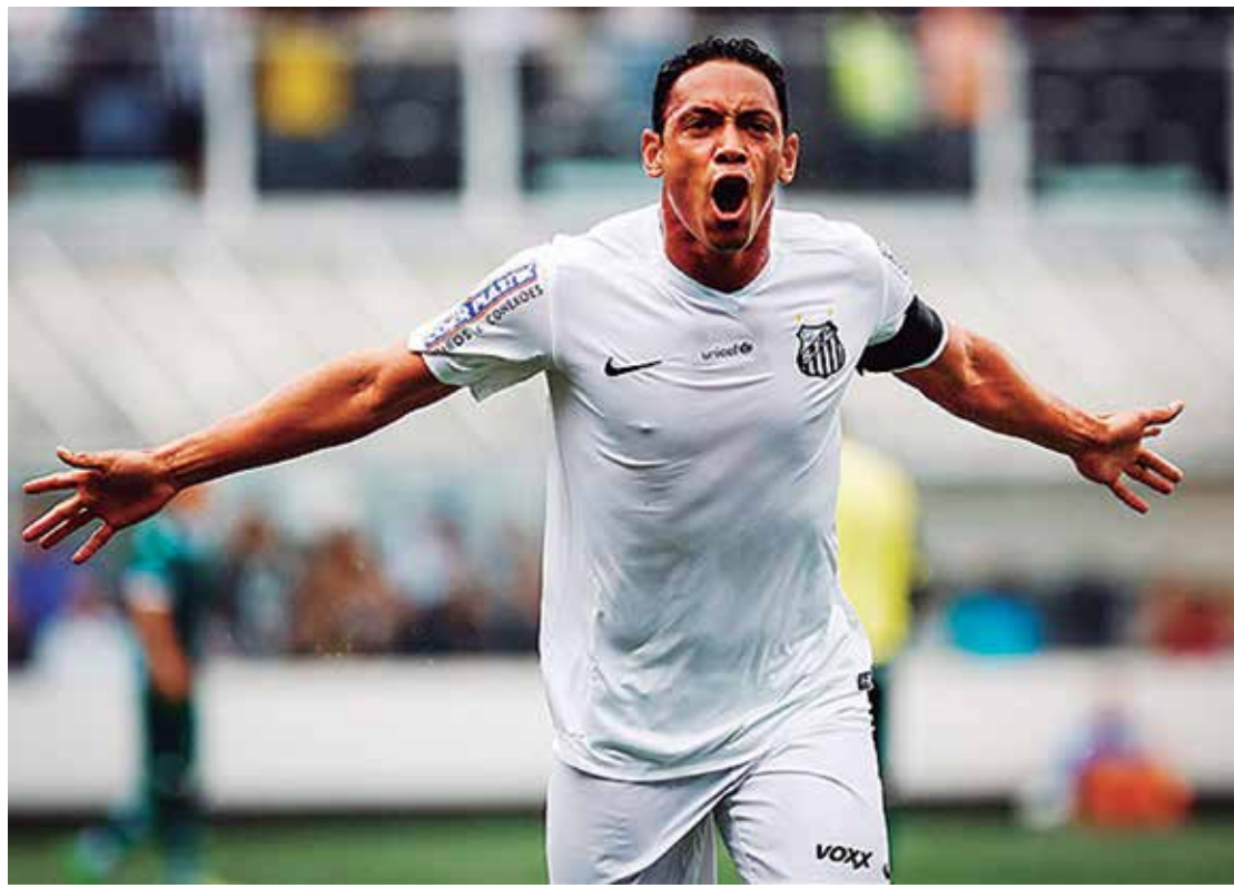
Atacante do Santos fez 20 gols no Campeonato Brasileiro, 11 no Paulistão e mais seis na Copa do Brasil

Já Kayke vestiu duas camisas para entrar no Top3. Pelo ABC, começou a temporada avassaladora, com 20 gols. Transferiu-se para o Flamengo em agosto, onde perdeu espaço como reserva de Paolo Guerrero. Ainda assim, deixou sua marca seis vezes na Série A.