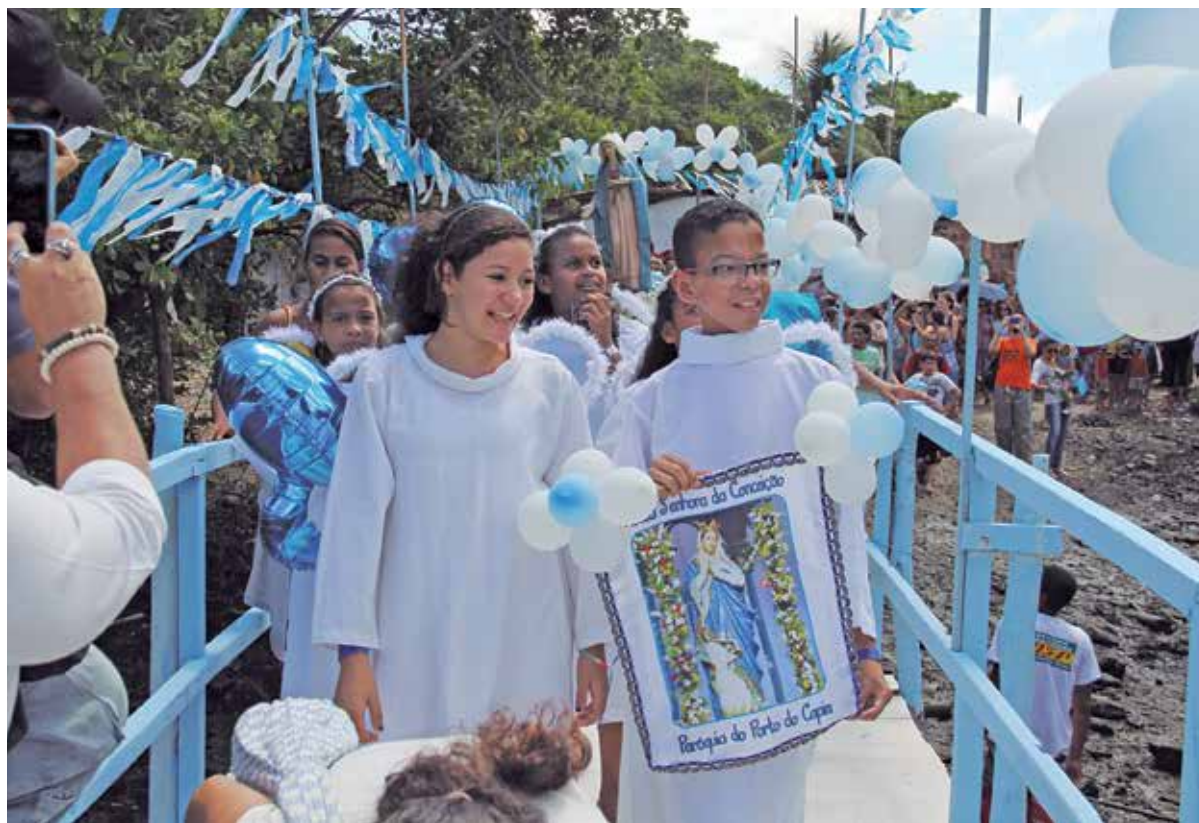
Com a substituição da imagem, a procissão chegou ao Porto do Capim, mas ainda teve que aguardar a maré alta