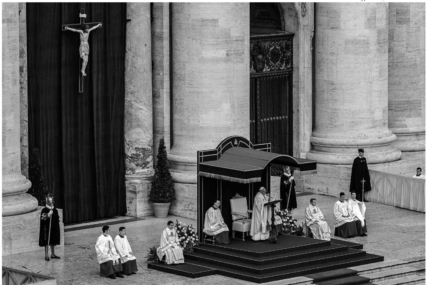
Jubileu de doze meses é lançado por Francisco para destacar o lado acolhedor e misericordioso da Igreja, tema chave em sua gestão

"Quanto mal fazemos a Deus e a sua graça quando falamos de pecados castigados por seu juízo antes de falar de que são perdoados por sua misericórdia"