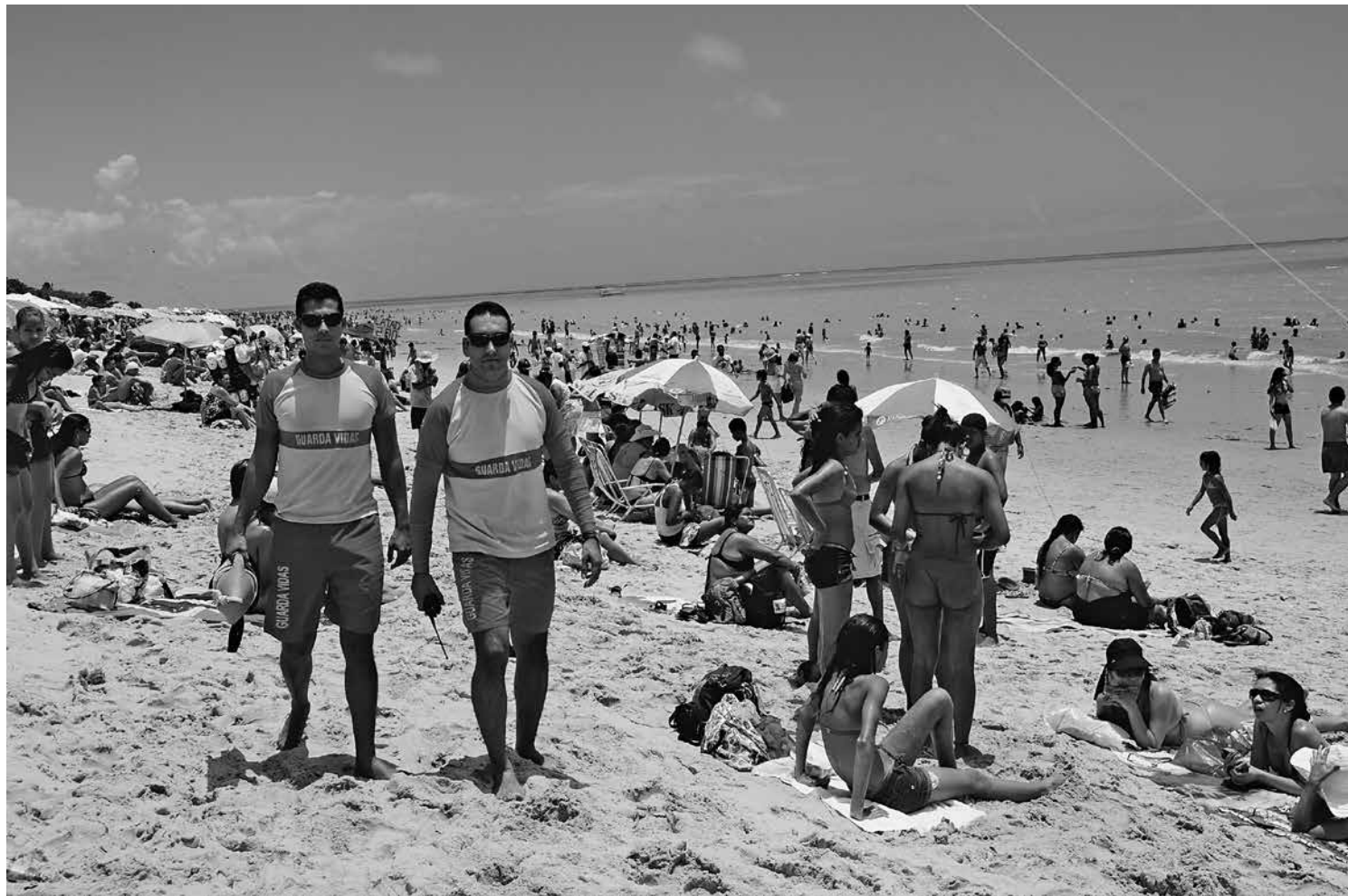
Casos de queimaduras causadas por caravelas, micoses e desidratação surgem com maior frequência durante o verão

Na maioria dos casos de conjuntivite, os sintomas e a doença passam em 10 dias, sem que seja necessário qualquer tipo de tratamento. Medicamentos (pomadas ou colírios) podem ser recomendadas para acabar com a infecção, aliviar os sintomas da alergia e também diminuir o desconforto. De acordo com o médico para a conjuntivite viral não existem medicamentos específicos, sendo assim, cuidados especiais com a higiene ajudam a controlar o contágio e a evolução da doença.