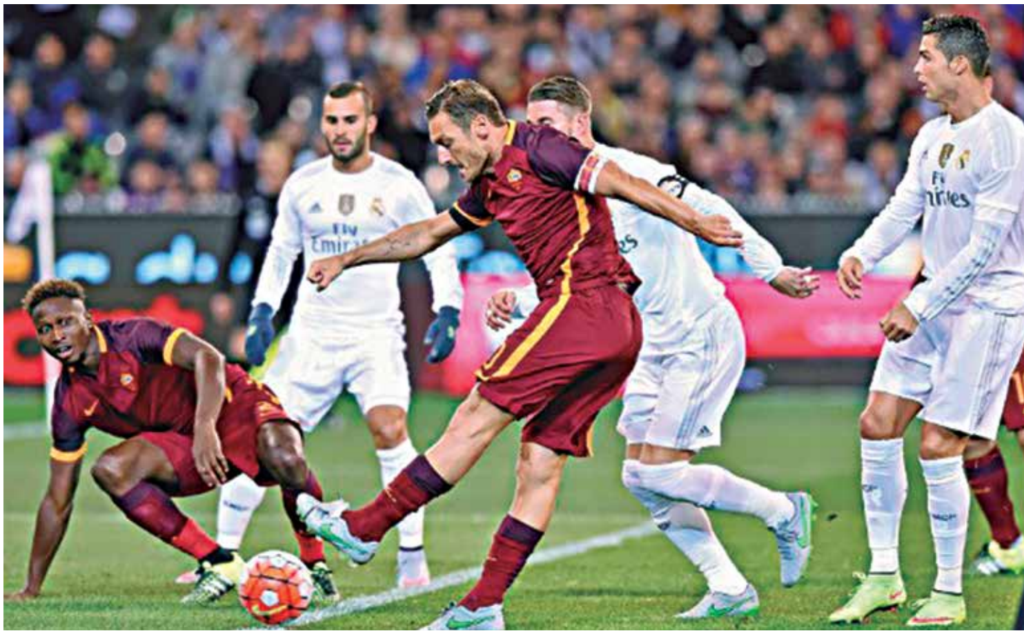
Roma e Real vão jogar entre os dias 17 de fevereiro e 8 de março de 2016. A disputa da Liga começa no dia 16 com Chelsea x PSG

A final será disputada no dia 28 de maio desta temporada em Milão, na Itália.