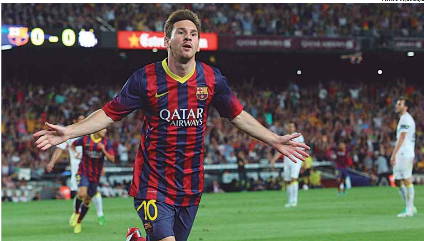
Messi se mostra bastante motivado para o seu terceiro Mundial. Nos outros dois derrotou o Estudiantes (2 a 1) e o Santos (4 a 0)

"Acho que o Gallardo é muito inteligente. Já deve saber como a gente joga e deve ter algo preparado em sua cabeça. O time dele joga muito bem. É um grande torneio e pode ser novamente muito bonito. Enfrentar o River será especial, assim como foi com o Estudiantes. Vamos tentar desfrutar e ganhar", afirmou.