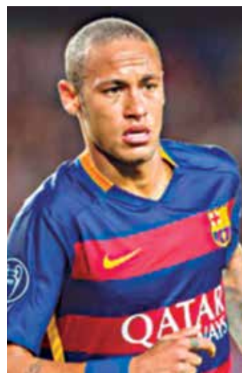
Neymar não joga na 5ª feira

Neymar estará em campo na final do Mundial de Clubes, no próximo domingo, caso o Barcelona se classifique. Quem garante é o pai do jogador, em entrevista publicada nessa segunda-feira pelo jornal catalão Sport. Segundo Neymar pai, o camisa 11 do Barcelona "certamente" estará de fora do jogo das semifinais contra o Guangzhou Evergrande. Mesmo assim, o jogador trabalha para entrar em campo no domingo, para uma eventual decisão do torneio.