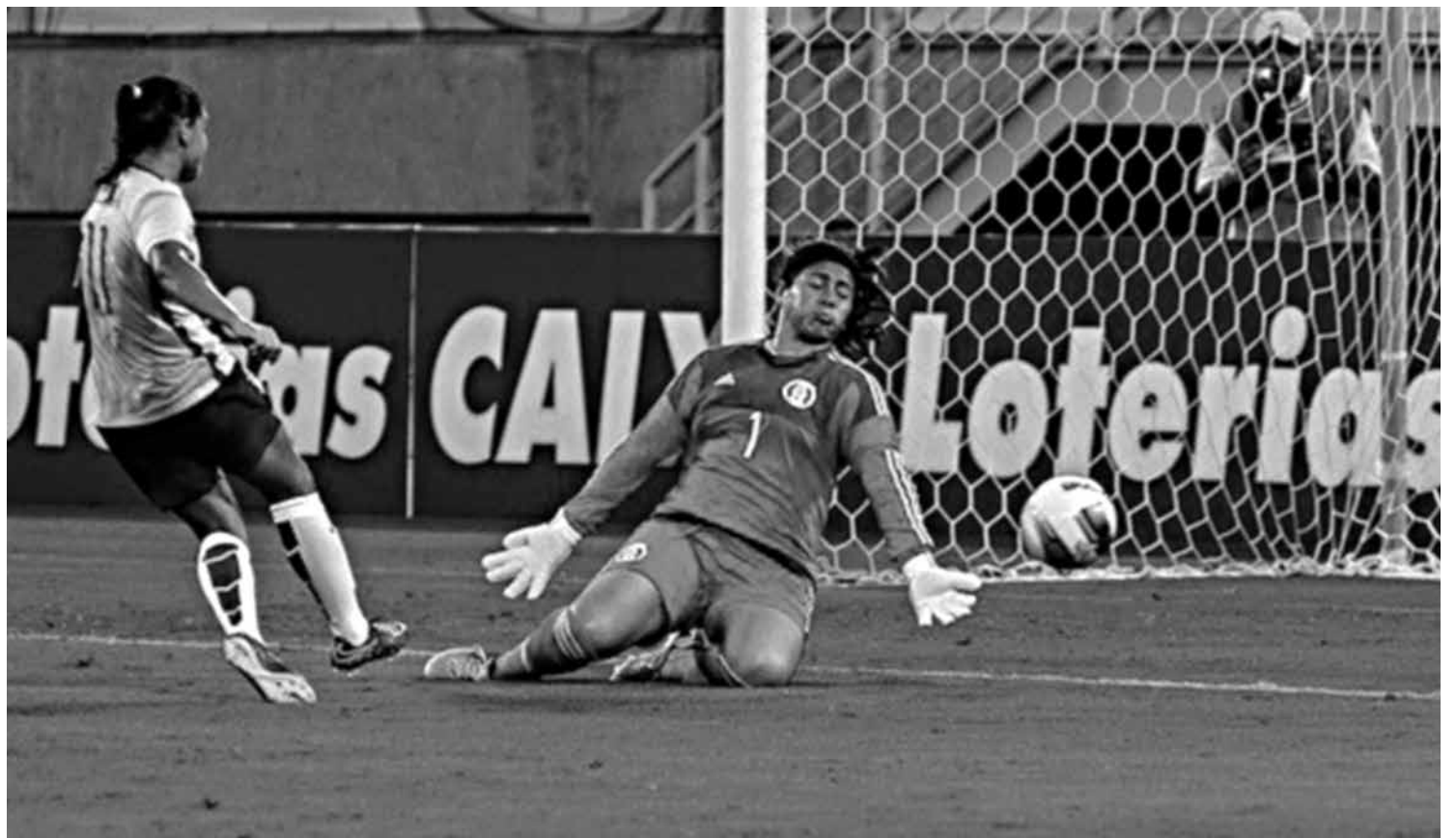
As jogadoras brasileiras marcaram 17 gols em duas partidas e jogam amanhã contra o Canadá, já pensando na decisão de domingo

“É muito gratificante ver que você realmente fez algo pelo futebol feminino na região e ser reconhecida. Venho batalhando há bastante tempo para que a modalidade cresça e essa homenagem me motiva ainda mais, contou a camisa 20 do Brasil.