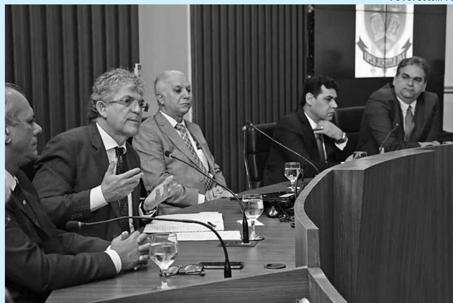
Ricardo fez explanação dos avanços realizados pelo Estado em diversas áreas

Ricardo elogiou o sistema de planejamento realizado pelo Poder Judiciário, e disse que hoje em dia é praticamente impossível administrar uma organização pública ou privada sem ter uma política de planejamento. "Estamos vivenciando momentos delicados na parte financeira e orçamentária, não por conta da Paraíba, que foi ao longo de quatro anos o melhor Estado do Nordeste em todos os indicadores econômicos, enquanto a economia nacional caiu. Mesmo assim, nós conseguimos planejar os gastos e investimentos para manter a máquina funcionando", ressaltou o governador pontuando que está implantando um sistema