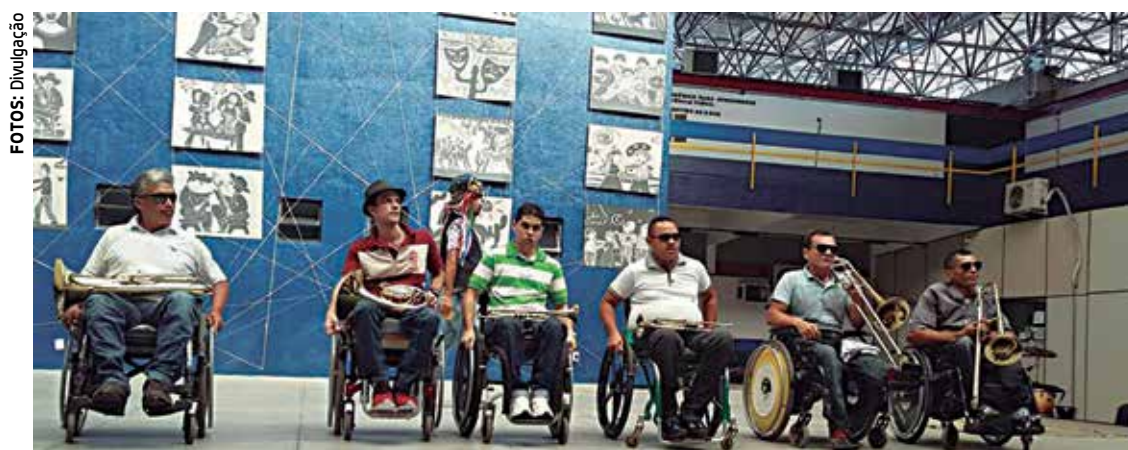
Grupo Acordes Eficientes é formado por 12 cadeirantes dentro do projeto da Funad