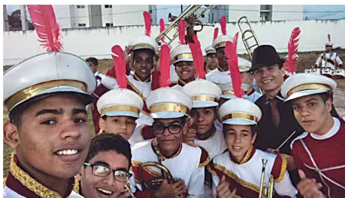
A banda marcial Durmeval Trigueiro é uma das atrações da noite do evento cultural

acrescentando que os músicos são profissionais liberais e estudantes que se interessaram pela iniciativa.