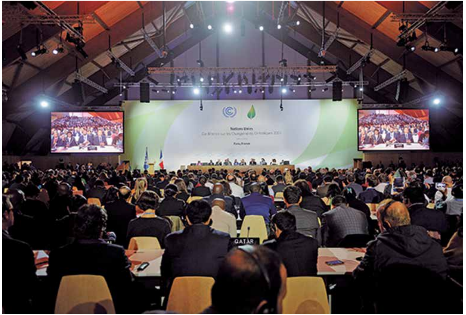
Acordo estabeleceu o objetivo de manter o aumento da temperatura média global abaixo de 2°C em relação aos níveis pré-industriais

“Grande parte do sucesso desta COP21 se deve a questões de procedimento. A estratégia das INDCs ajudou a romper a lógica binária de negociações en-