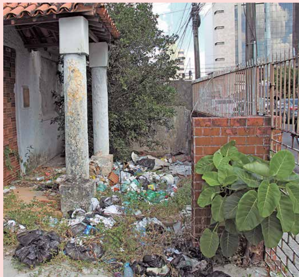
Lixo acumulado nos prédios abandonados favorece a proliferação do Aedes aegypti