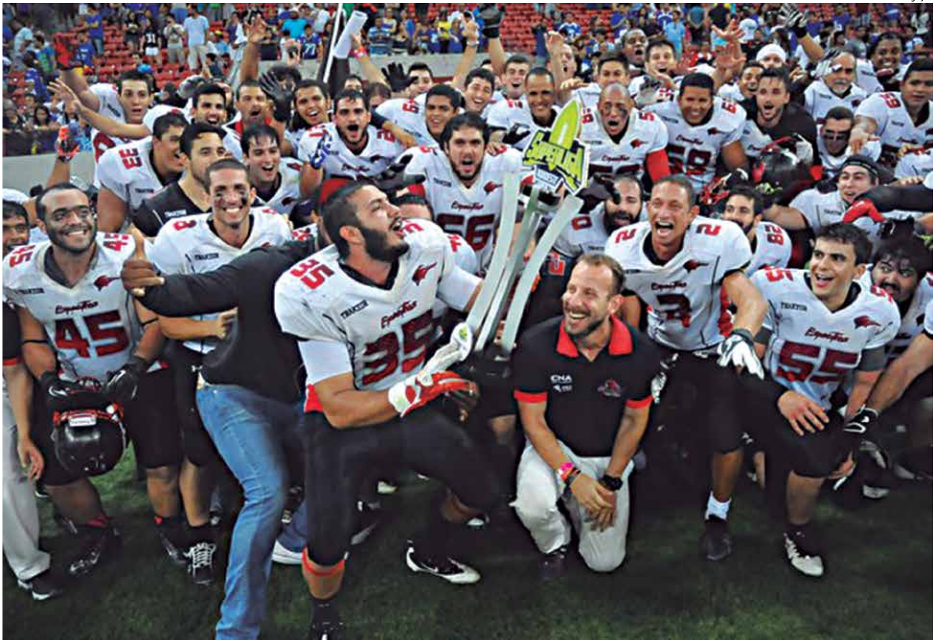
Em meio a orgulho e comemoração, o João Pessoa Espectros ergueu a taça de campeão brasileiro após derrotar o Coritiba Crocodiles em jogo que ocorreu no Almeidaão