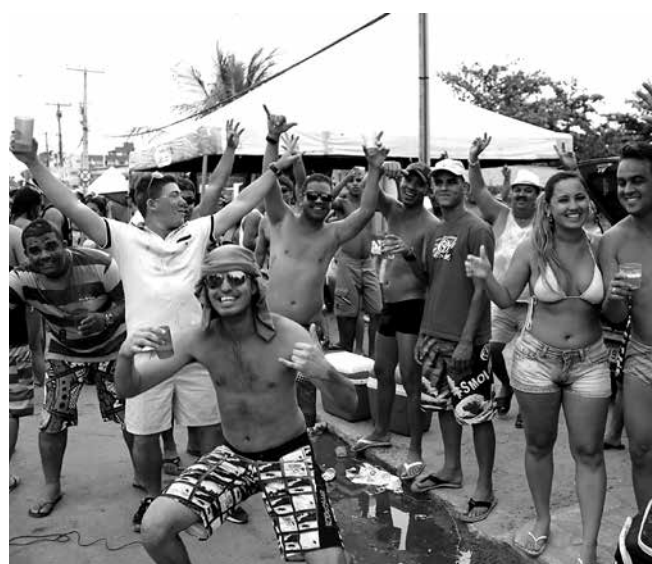
Os frequentadores da praia brincam em clima descontraído

A top Alessandra Ambrósio provou que estava curada da ressaca da noite anterior, onde apareceu sendo carregada por amigos no camarote no Barra-Ondina, e também era só sorrisos.