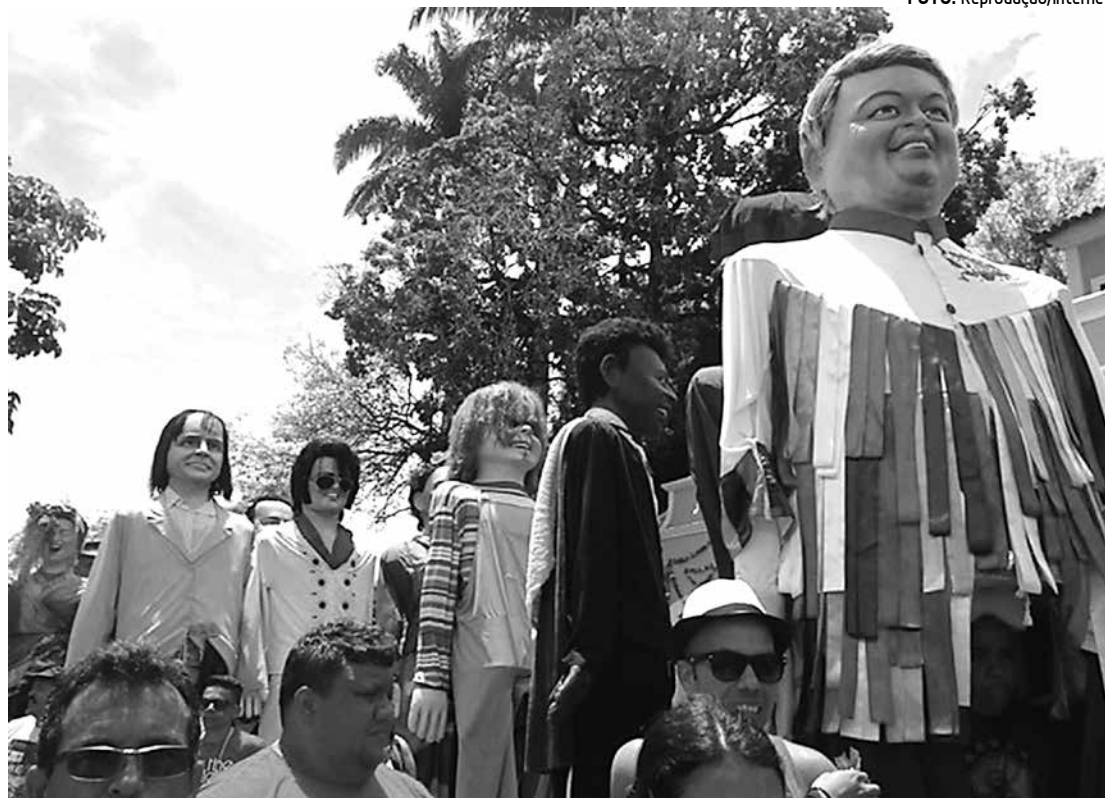
Dezenas de bonecos gigantes participaram do desfile ontem, no Carnaval de Olinda, em Pernambuco