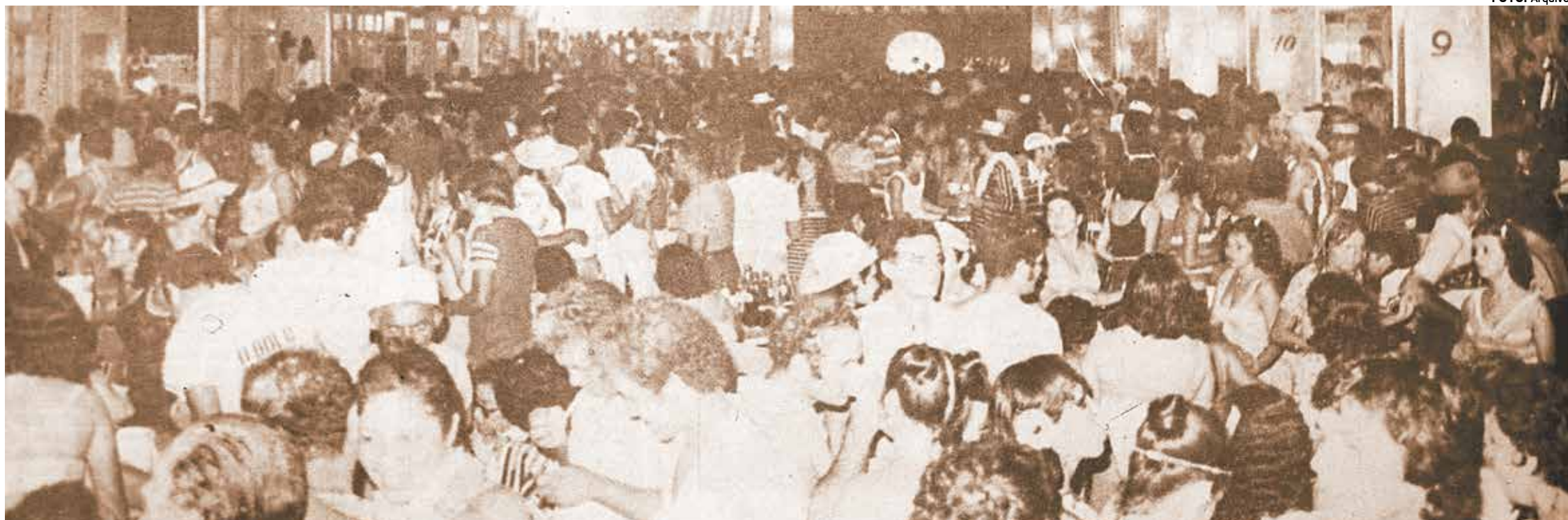
Os tradicionais bailes carnavalescos do Clube Astréa eram os mais badalados da capital, atraindo uma multidão de foliões aos seus amplos salões e o acompanhamento de orquestras tocando marchinhas