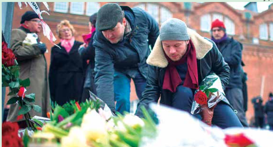
Homens colocam flores em homenagens aos mortos no local do atentado ocorrido em Copenhague

Vários pontos da capital dinamarquesa foram revistados nas últimas 24 horas, como um cibercafé a poucas centenas de metros de onde o atirador foi abatido e onde houve várias detenções, publico a imprensa, apesar de a polícia não ter dado detalhes. As autoridades confirmaram que trata-se de um