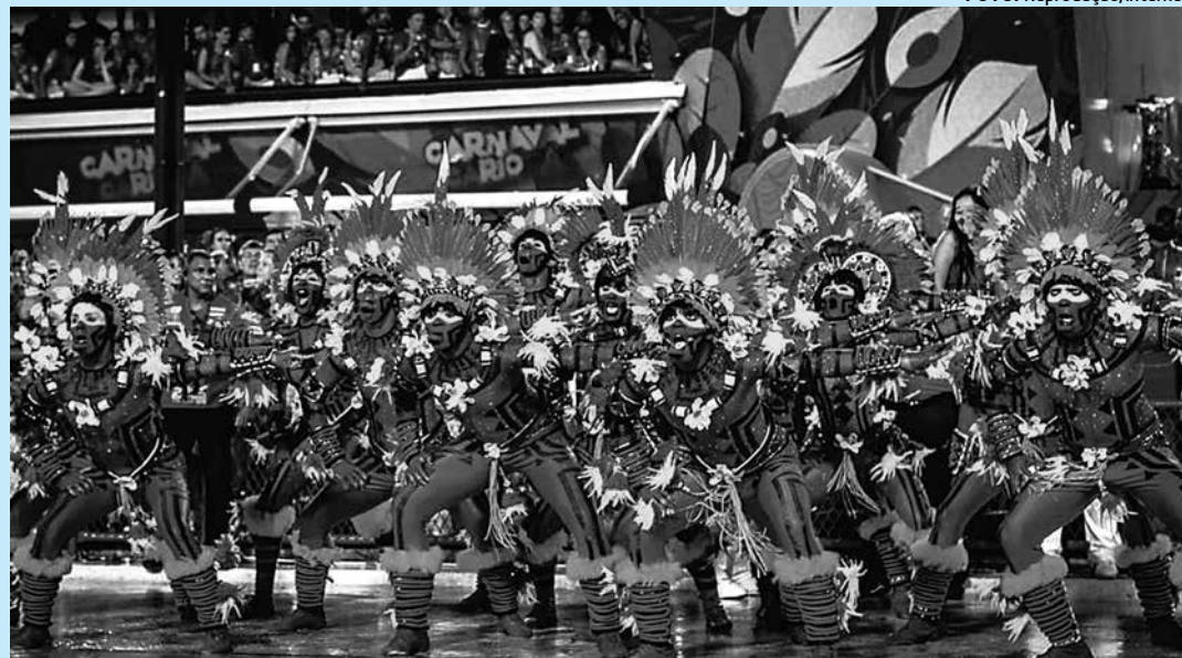
Apesar da chuva que caiu no Sambódromo, a Salgueiro deu um show com a Mocidade e Vila Isabel

No primeiro dia (chuvoso) de desfiles do Grupo Especial do Rio, não caiu água o suficiente para apagar o fogo da estreia de Paulo Barros na Mocidade. Foi uma noite de ousadia e alegria, graças aos peladões em um dos carros da escola e a uma comissão de frente incendiária. Ela pegou fogo.