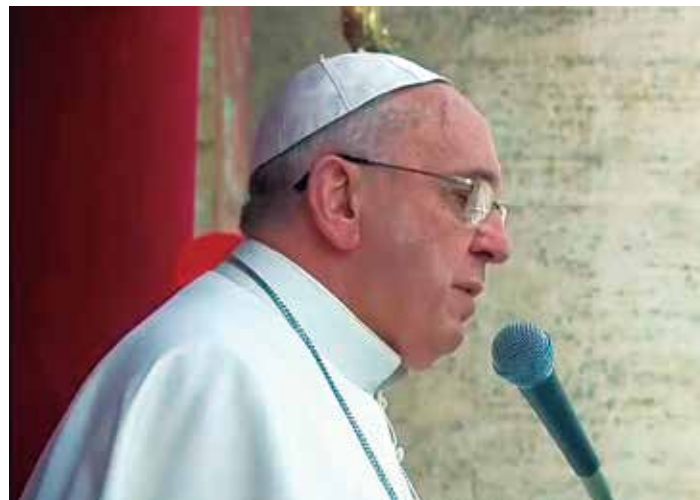
Papa condena atitude dos jihadistas do Estado Islâmico

til". O vídeo surge apenas alguns dias depois de outro em que o EI mostrava a morte por imolação de um piloto jordano capturado após o seu F-16 ter sido abatido na Síria, em dezembro. As imagens do piloto sendo queimado vivo desencadearam um sentimento de indignação global.