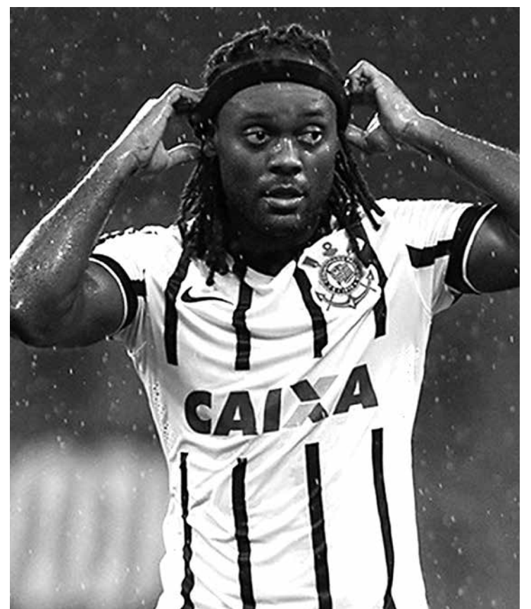
Wagner Love já está inscrito para a disputa da Taça Libertadores