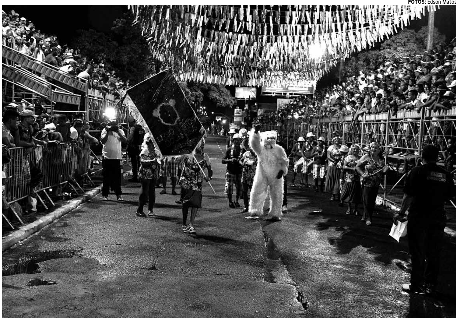
Ursos Carnavalescos encerraram com chave de ouro o terceiro dia do Carnaval Tradição, levando muita empolgação aos participantes