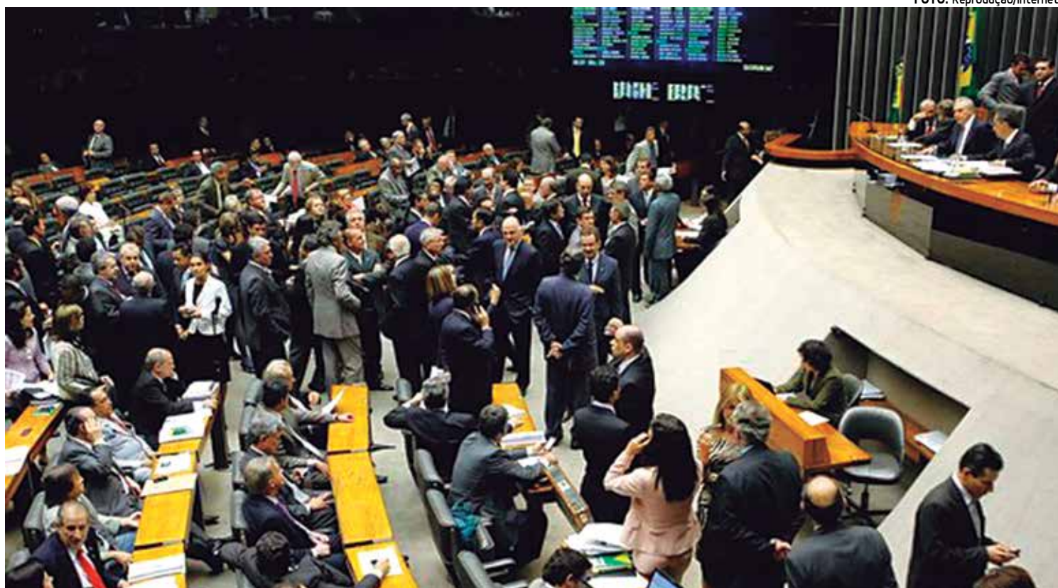
Os tucanos fazem restrições sobre regulamentação econômica da mídia e o ajuste fiscal; com 53 deputados, é o maior partido de oposição

Segundo Fonte, o partido continuará apoiando a governabilidade do país. "Continuaremos trabalhando em busca de conquistas para os trabalhadores e de melhoria na qualidade de vida do povo brasileiro. Será um ano de arrumação, em que teremos de tomar posições difíceis. Estaremos trabalhando pela governabilidade do país, colocando em primeiro lugar o nosso país e o nosso povo."