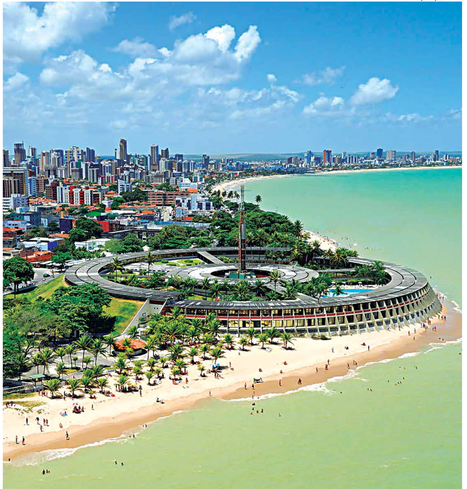
Potenciais turísticos de João Pessoa, a exemplo da beleza das praias, foram divulgados nos principais eventos turísticos nacionais