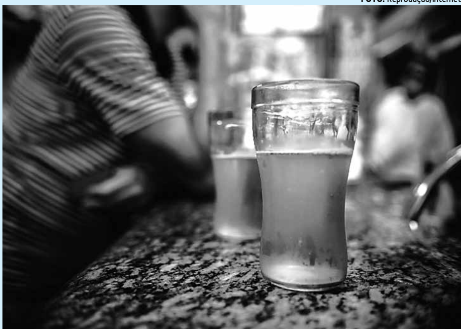
Venda de bebida alcoólica a menores é hoje uma contravenção; pena de 1 ano de prisão

A deputada Carmen Zanotto (PPS-SC), autora de uma das propostas que tramitam em conjunto com o PL 5502 e que também passaram para o regime de urgência, defendeu a agilidade na votação da matéria. "Precisamos ampliar a punição para quem comete este tipo de crime, uma vez que a bebida alcoólica é a porta de entrada para as outras drogas", afirmou. Hoje, a venda de bebida alcoó-