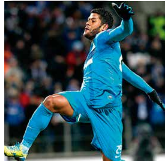
Paraibano é o jogador mais caro da Rússia