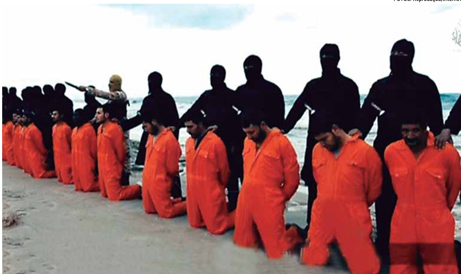
No último domingo, o grupo radical Estado Islâmico divulgou um vídeo mostrando a execução por decapitação de 21 cristãos egípcios

O ministro egípcio das Relações Exteriores, Sameh Shukri, viajou no domingo à noite para Nova York para reuniões na ONU e no Conselho de Segurança para exigir uma reação internacional.