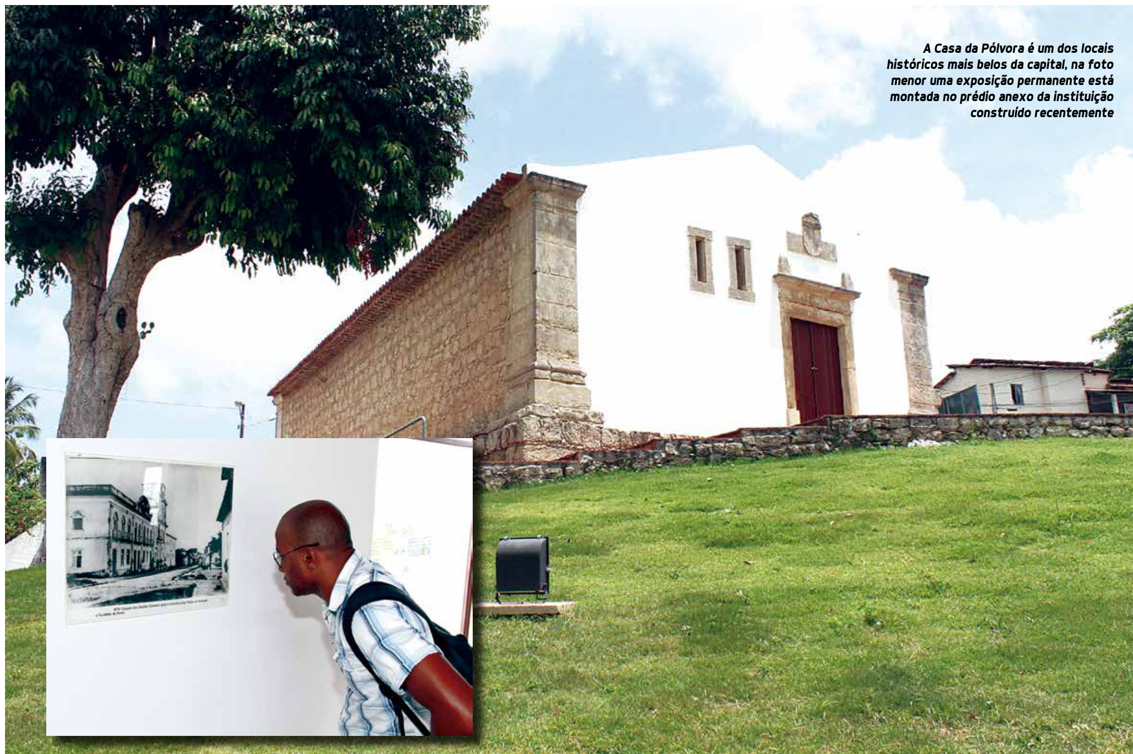
A Casa da Pólvora é um dos locais históricos mais belos da capital, na foto menor uma exposição permanente está montada no prédio anexo da instituição construído recentemente