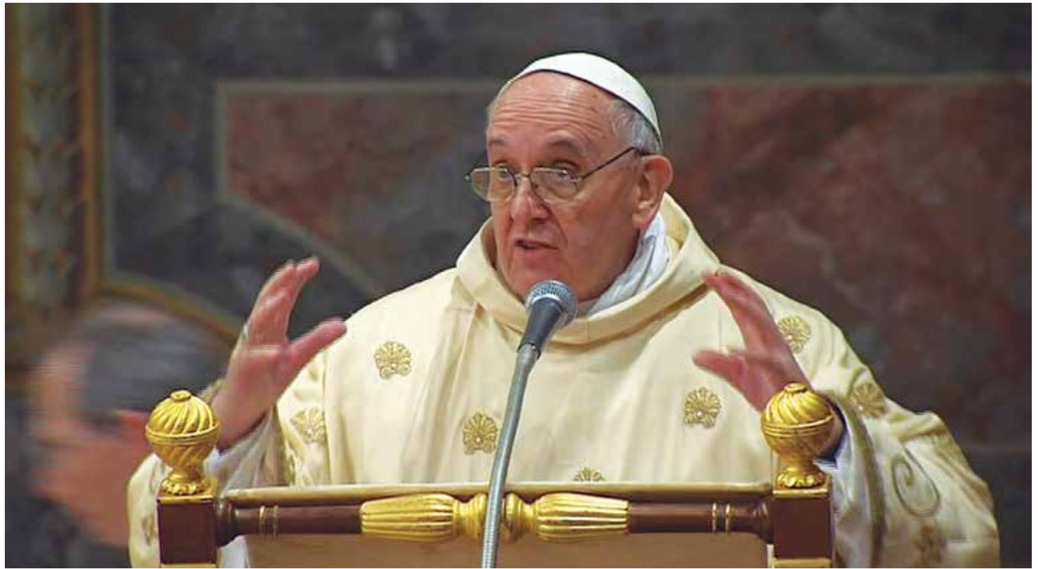
Em pronunciamento que marcou a celebração da Jornada Mundial, papa Francisco pediu ainda que os jovens sejam revolucionários

"Eu, ao contrário, peço-vos que sejam revolucionários, que sejam contra a corrente. Sim, estou a pedir-lhes que se revelem contra esta cultura do provisório, que, no fundo, crê que vocês não são capazes de assumir responsabilidades e de amar verdadeiramente", disse Francisco.