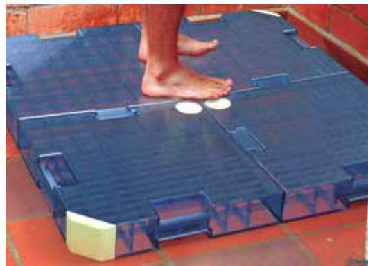
Gris (foto) é formado por plataformas com reservatórios; tem capacidade para até 40 litros

pante formada por quatro reservatórios interligados que se inclinam ligeiramente para o centro, onde entradas permitem que a água se acumule em seu interior.