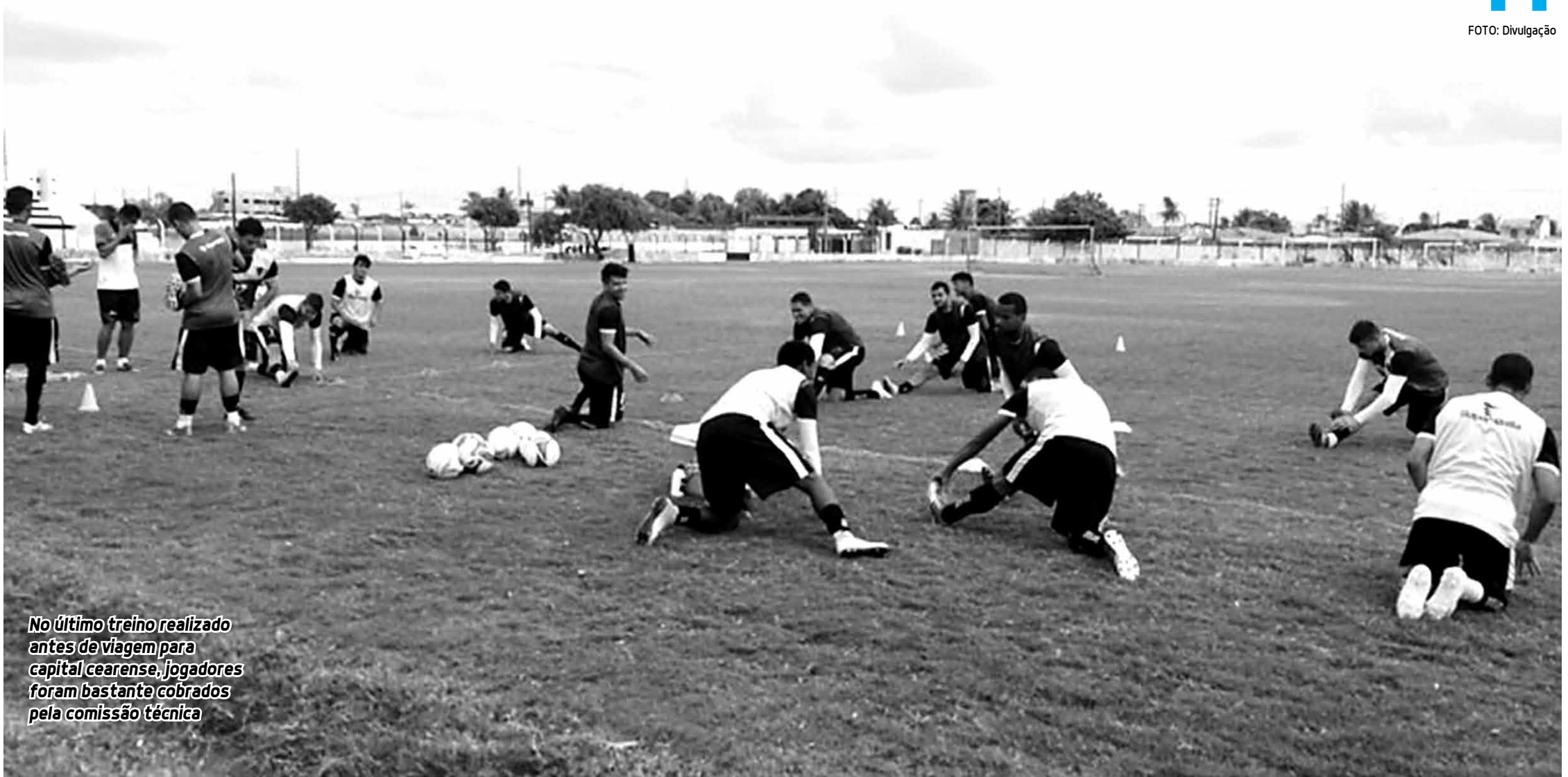
No último treino realizado antes de viagem para capital cearense, jogadores foram bastante cobrados pela comissão técnica