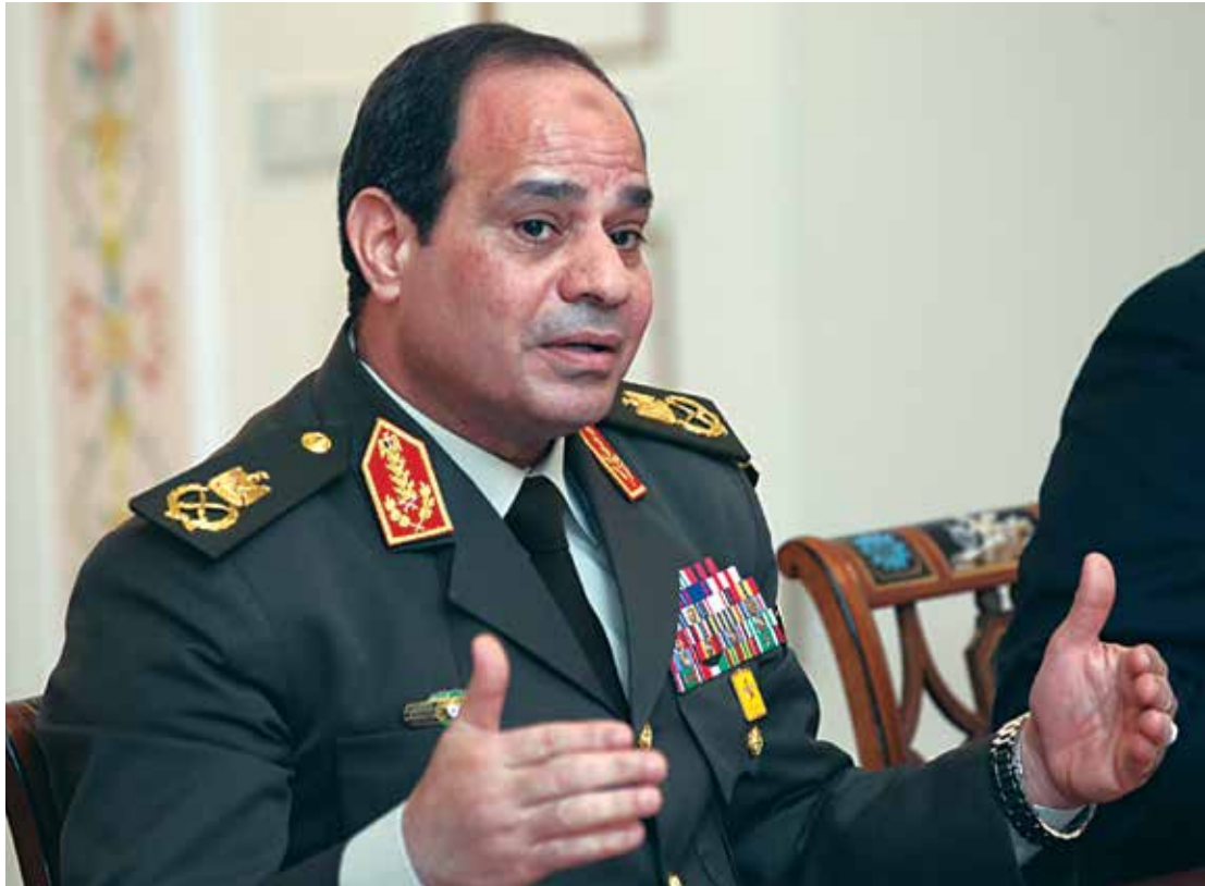
Presidente Abdel Fattah Al-Sisi quer as Nações Unidas adotando resolução de intervenção