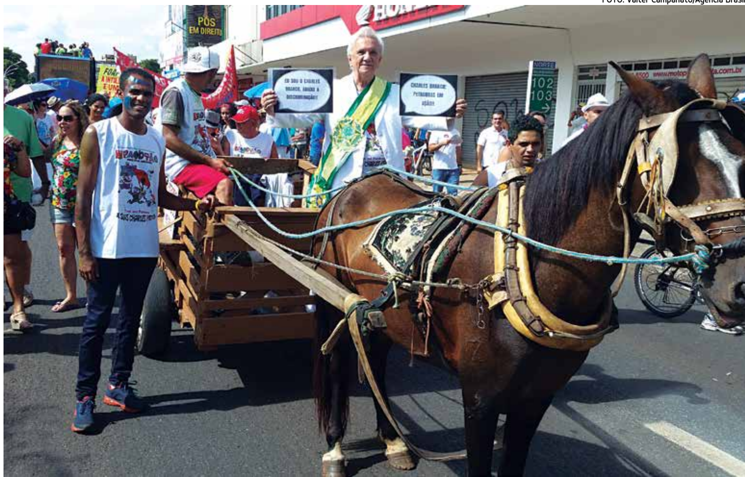
Escândalo na Petrobras e alta no preço da gasolina também foram temas usados com humor e criatividade na capital federal

Este ano, a música do Pacotão aborda a crise econômica do DF e a troca de comando no governo da capital do país. “Saíu o ‘Agnulo’ e entrou o ‘Enrolaoberque’”, diz o refrão, em referência ao ex-governador Agnelo Queiroz e ao sucessor Rollemberg.