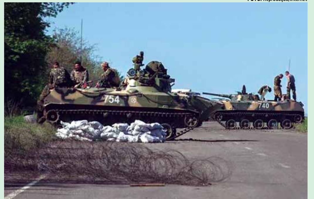
O cessar-fogo acordado no último domingo não foi cumprido e soldados ucranianos morreram