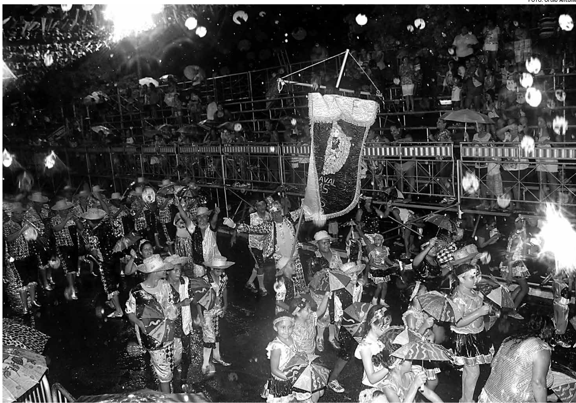
A chuva não tirou o brilho da festa nem atrapalhou os nove clubes de frevo que desfilaram ontem à noite pela Avenida Duarte da Silveira, encerrando o Carnaval Tradição