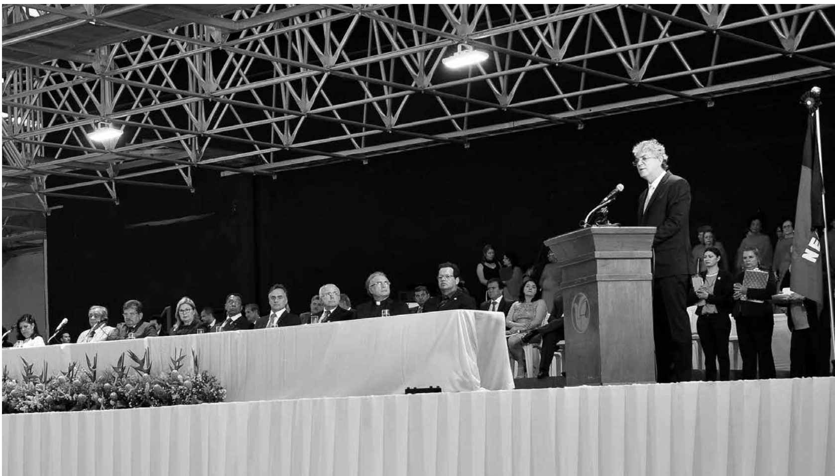
No discurso oficial, Ricardo Coutinho reafirmou a importância de seguir investindo em moradia, emprego e renda de forma republicana, para todos

É como parte efetiva da materialização desse eixo programático que começo este novo Governo anunciando a criação do Conselho Estadual de Transparência, ciente que a informação é o grande instrumento de organização de uma sociedade e que esta sociedade, mais que fiscalizar, também precisa ser corresponsável pelos avanços e recuos ocorridos na esfera pública e coletiva. Esse será um instrumento que a população tomará para si, como guardiã direta dos seus interesses. Ao lado de outros