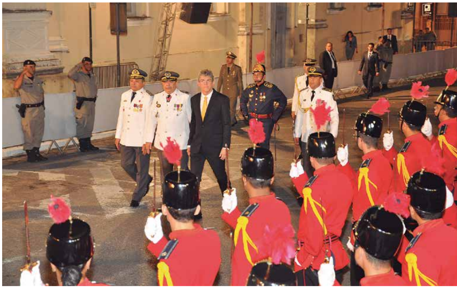
No terceiro e último momento das solenidades alusivas à posse, o governador fez revista das tropas e foi reconduzido ao cargo

O Conselho de Transparência irá permitir que subamos mais um degrau ético, técnico e político na conjunção de convivência entre governo e sociedade