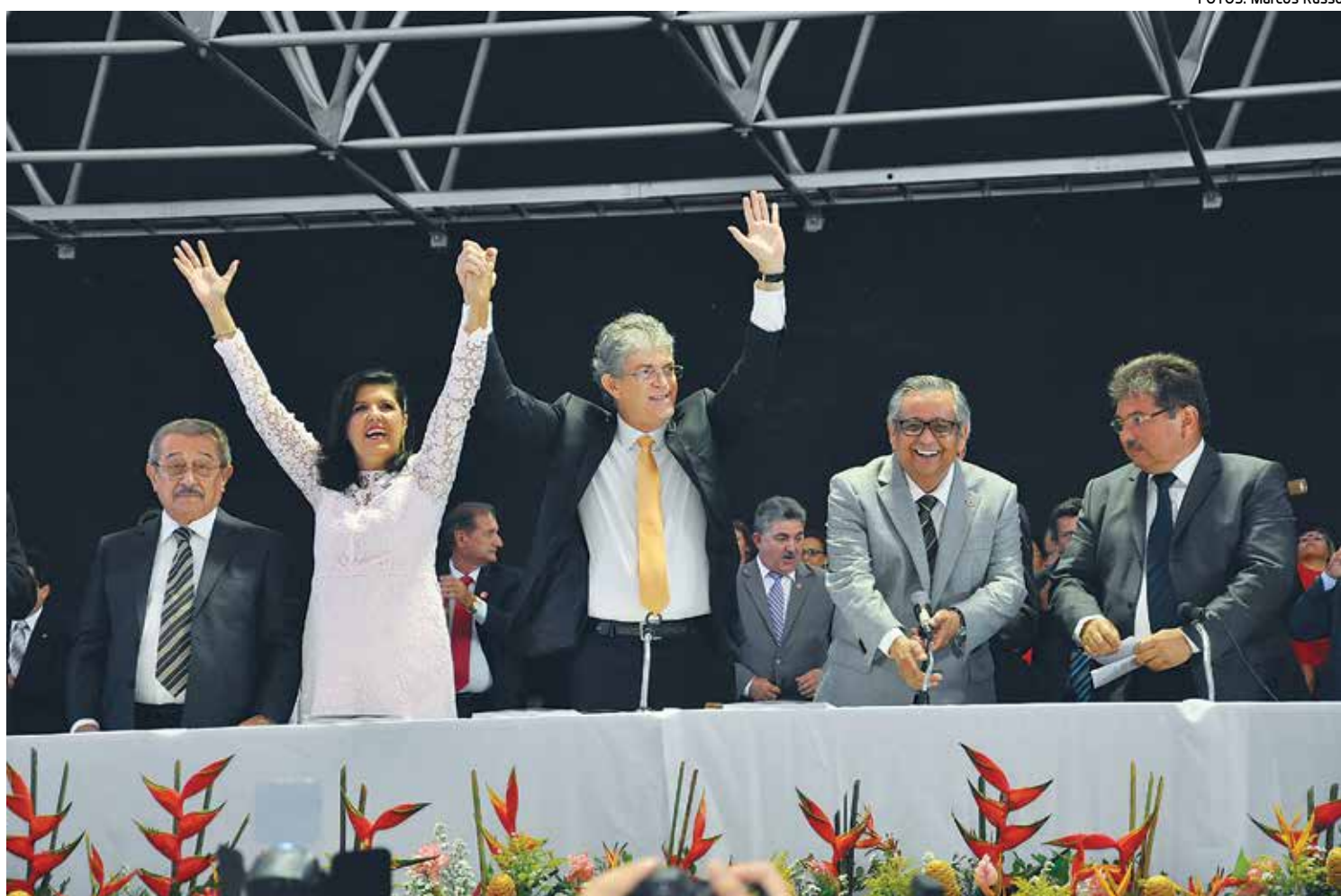
Governador reeleito e vice-governadora eleita foram empossados pela Assembleia Legislativa da Paraíba, em cerimônia no Espaço Cultural