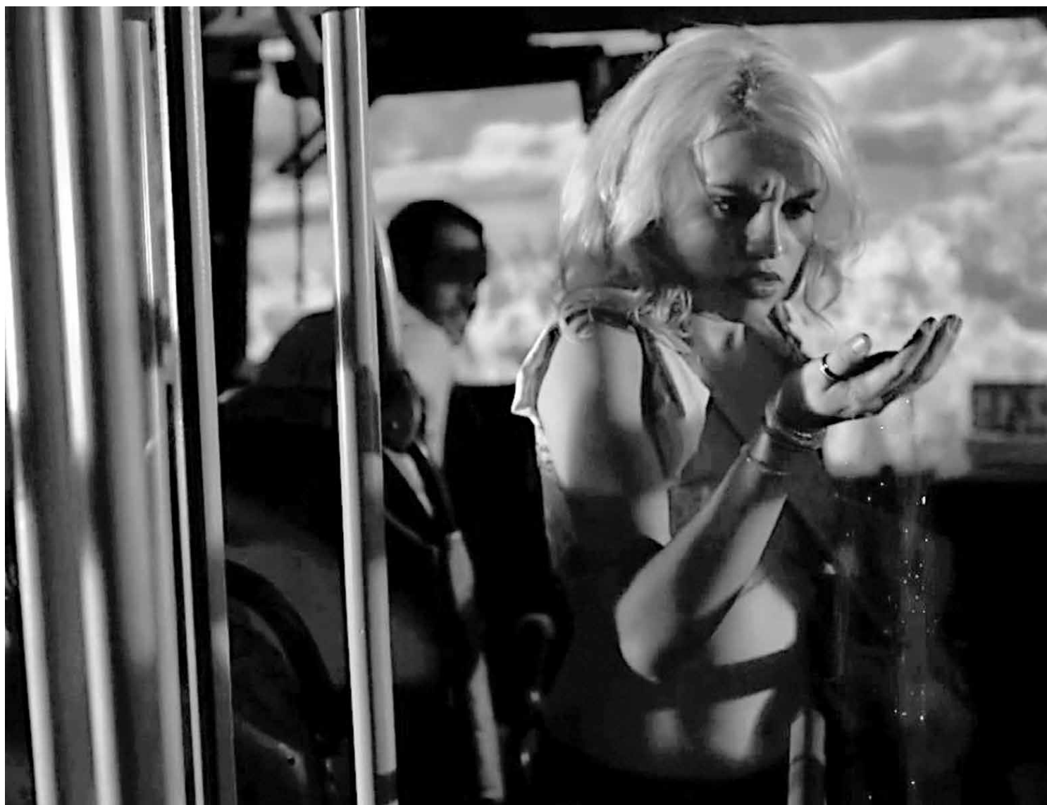
Longa retrata paisagens da cidade de Recife, mostra a cultura brega e aspectos da periferia, mesclando romantismo e sensualidade

"Praça Walt Disney", sob a codireção de Sérgio Oliveira, foi lançado no Festival del Film Locarno, em 2011, sendo premiado como melhor documentário no San Diego Latino Film Festival, nos Estados Unidos, em 2012; e com o Prêmio especial do júri no Indie Lisboa, em Portugal, no mesmo ano. Já "Estradeiros" é o título do documentário, realizado por Renata Pinheiro e também codirigido com Sérgio Oliveira, vencedor da Semana dos Realizadores, no Rio de Janeiro, em 2011.