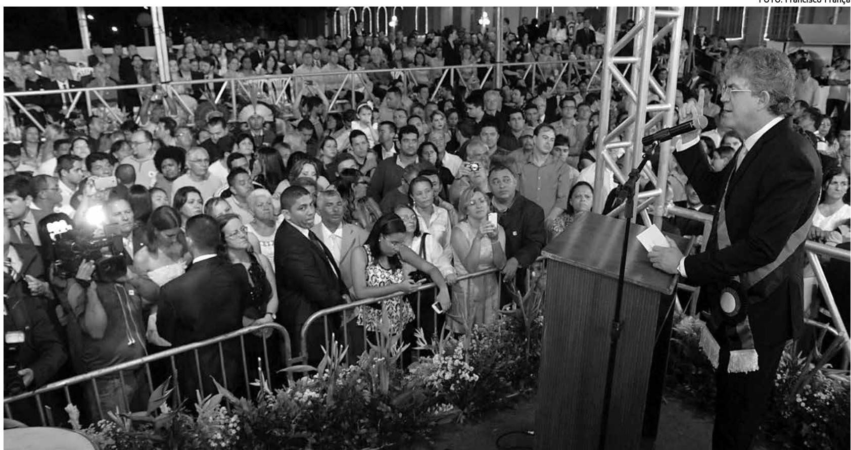
Após tomar posse, governador também discursou em frente ao Palácio da Redenção, na cerimônia de recondução ao cargo para seu segundo mandato

H á exatos quatro anos, neste mesmo local – hoje totalmente recuperado e pulsante – a população da Paraíba tomava pra si as rédeas do seu destino e inaugurava uma nova etapa em sua história. O povo chegava ao poder.