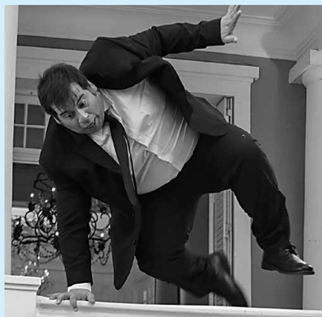
Leandro Hassum é o personagem Jorginho na comédia

UMA NOITE NO MUSEU 3 (EUA 2014). Gênero: Comédia. Duração: 98 min. Classificação: Livre. Direção: Shawn Levy. Com Ben Stiller, Robin Williams e Owen Wilson. O segurança Larry Daley (Ben Stiller) segue com seu inusitado trabalho no Museu de História Natural de Nova York. Determinado dia, descobre que a peça que faz os objetos do museu ganharem vida está sofrendo um processo de danificação. Com isso, todos dos amigos de Larry correm o risco de não ganharem mais vida. Para tentar salvar a turma, ele vai para Londres pedir a orientação do faraó (Ben Kingsley) que está em exposição no museu local. Maneira 1: 13h, 15h15, 17h30, 19h50 e 22h. Maneira 4: 12h15, 14h15, 16h30, 18h45 e 21h. CinEspaço 2: 14h20, 16h40, 19h e 21h20.