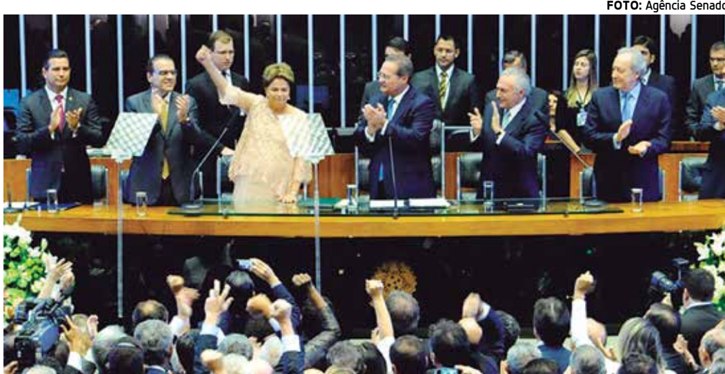
A presidente Dilma Rousseff é saudada por parlamentares e outras autoridades em Brasília

Aquisição de helicópteros para a Polícia Militar, construção do Centro de Convenções e do Condomínio Cidade Madura em Campina Grande, instalação do curso de Medicina da UEPB, criação do Conselho Estadual de Transparência, teatro do Centro de Convenções entre outras obras foram anunciadas ontem pelo governador. ESPECIAL