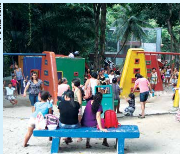
O parque infantil da Bica foi bastante procurado pelas crianças