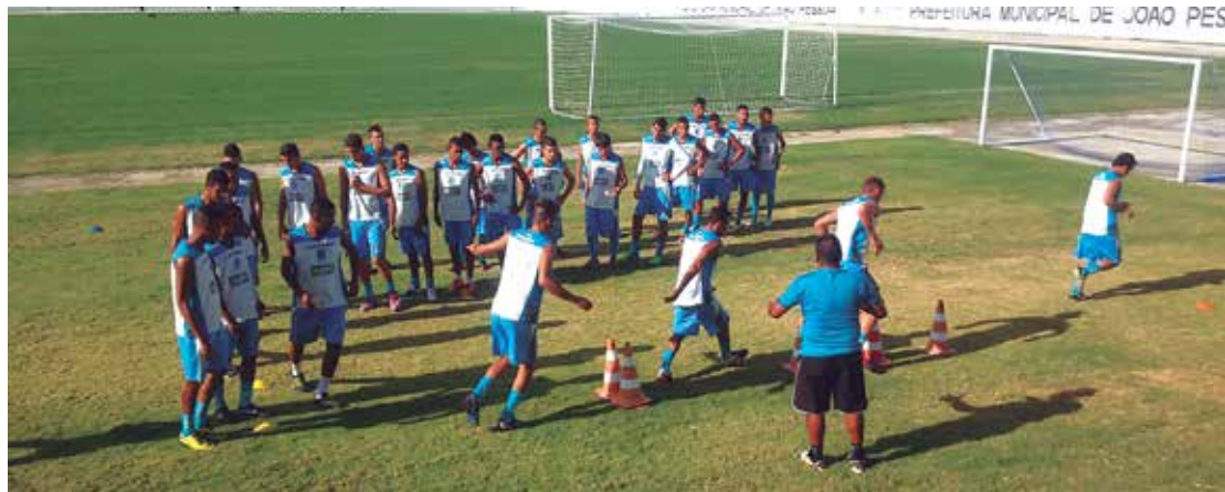
Para o Centro Sportivo Paraibano, nem tudo está perdido e acredita na vaga para a grande decisão