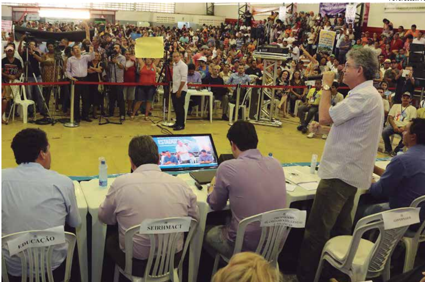
O governador Ricardo Coutinho participou da audiência do ODE, em Esperança, que teve um público recorde de 2.680 pessoas

O recorde de público representou um aumento de 88% na participação na região, com relação ao ano anterior, e em todas as demais plenárias já realizadas pelo Governo do Estado, por meio do Orçamento Democrático. A plenária também elegeu a Barragem de Camará (80,5%), como a obra de maior relevância já realizada pelo governo na região, seguida das obras de restauração e pavimentação da PB-121 - Estrada da Batatinha