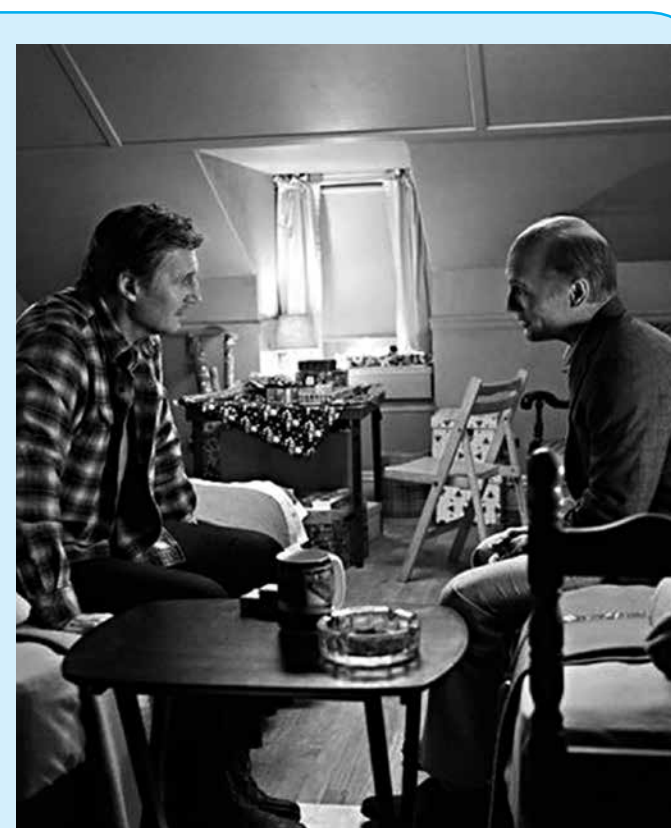
Ação tem vários acontecimentos durante uma noite