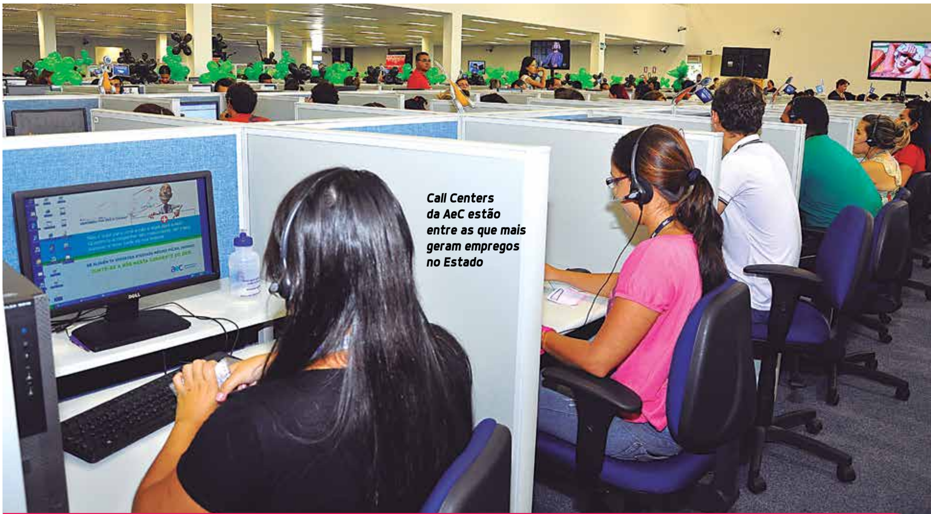
Call Centers da AeC estão entre as que mais geram empregos no Estado

Embora 2015 seja reco-nhecido um ano de es-tagnação econômica, o secre-tário se mostra confiante em criar condições para que o crescimento continue acon-tecendo. "Estamos incre-mentando a infraestrutura do Estado, com o Caminho da Paraíba, promovendo a interiorização com a exten-são da rede de fibra ótica, inaugurando escolas téc-nicas estaduais e temos a pers-pectiva de entregar o Distrito Industrial de Caaporã", elen-ca Tár-cio Pessoa.