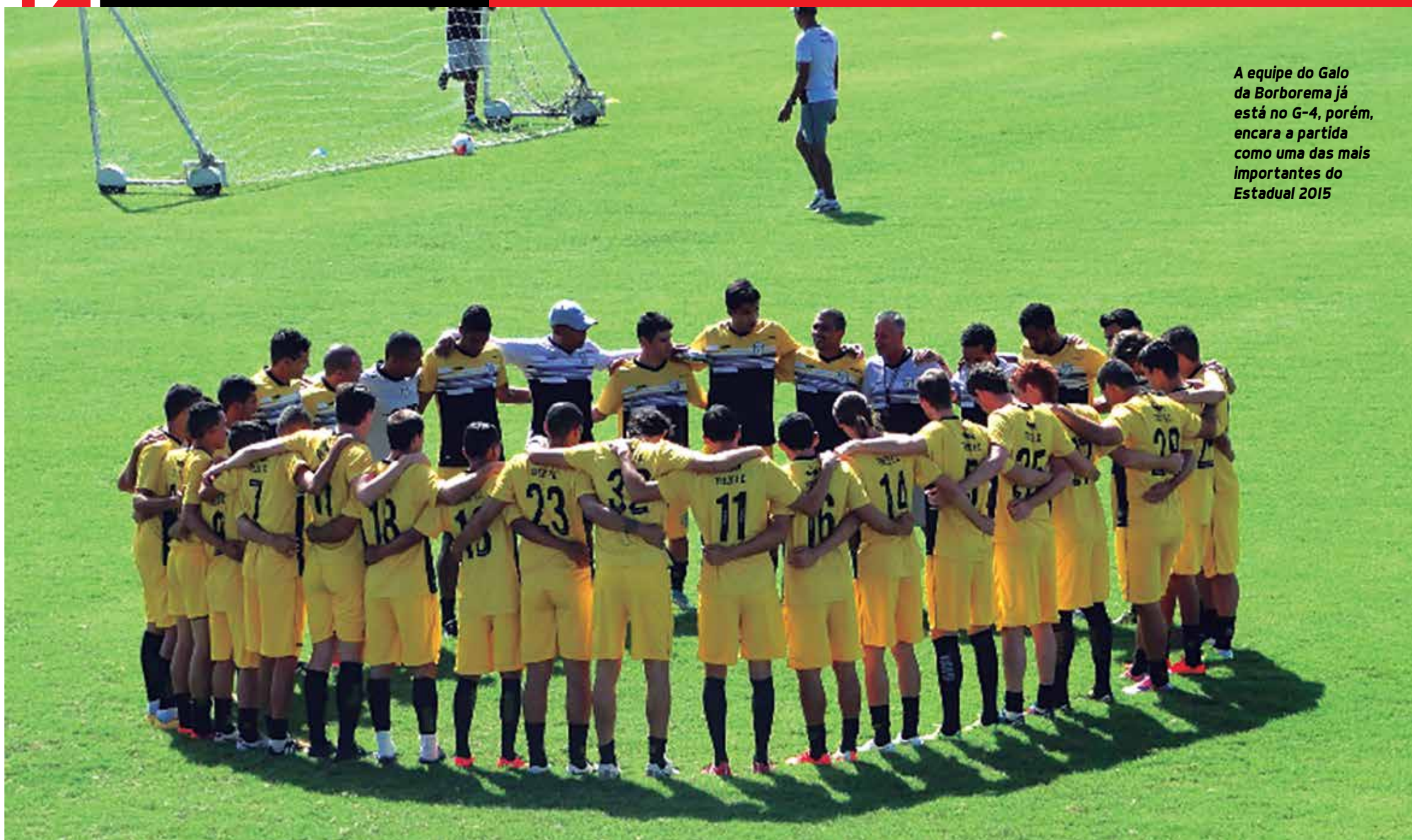
A equipe do Galo da Borborema já está no G-4, porém, encara a partida como uma das mais importantes do Estadual 2015