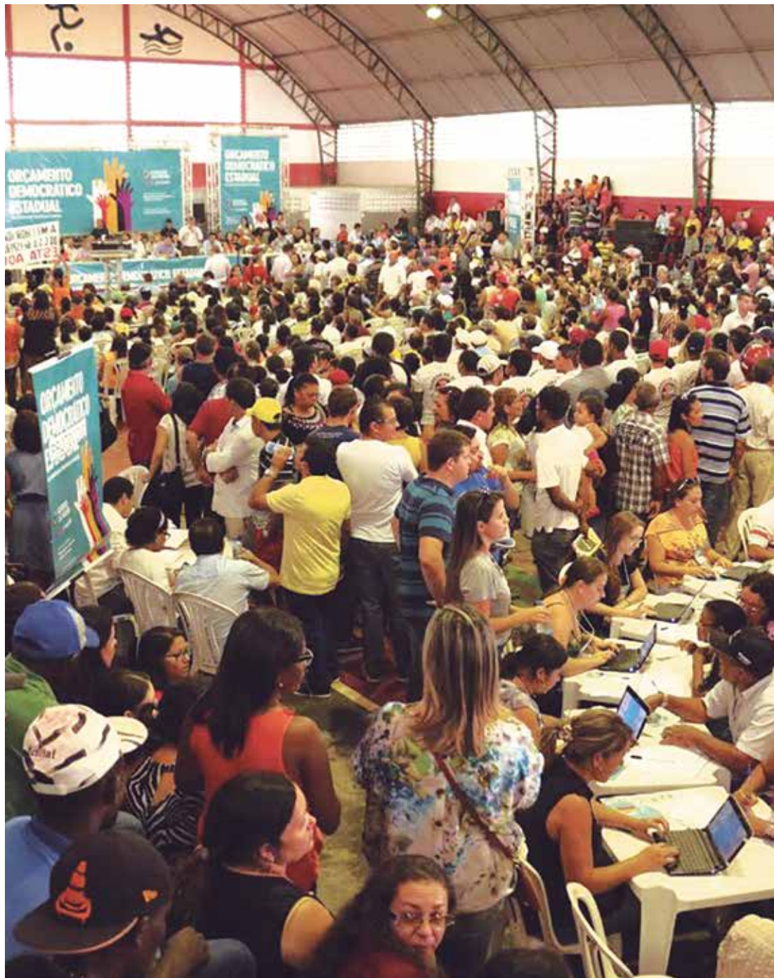
Multidão prestigia plenária do Orçamento Democrático Estadual realizada ontem em Esperança