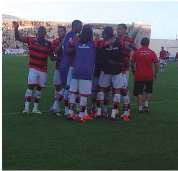
A Raposa faz uma boa disputa na temporada do Estadual 2015