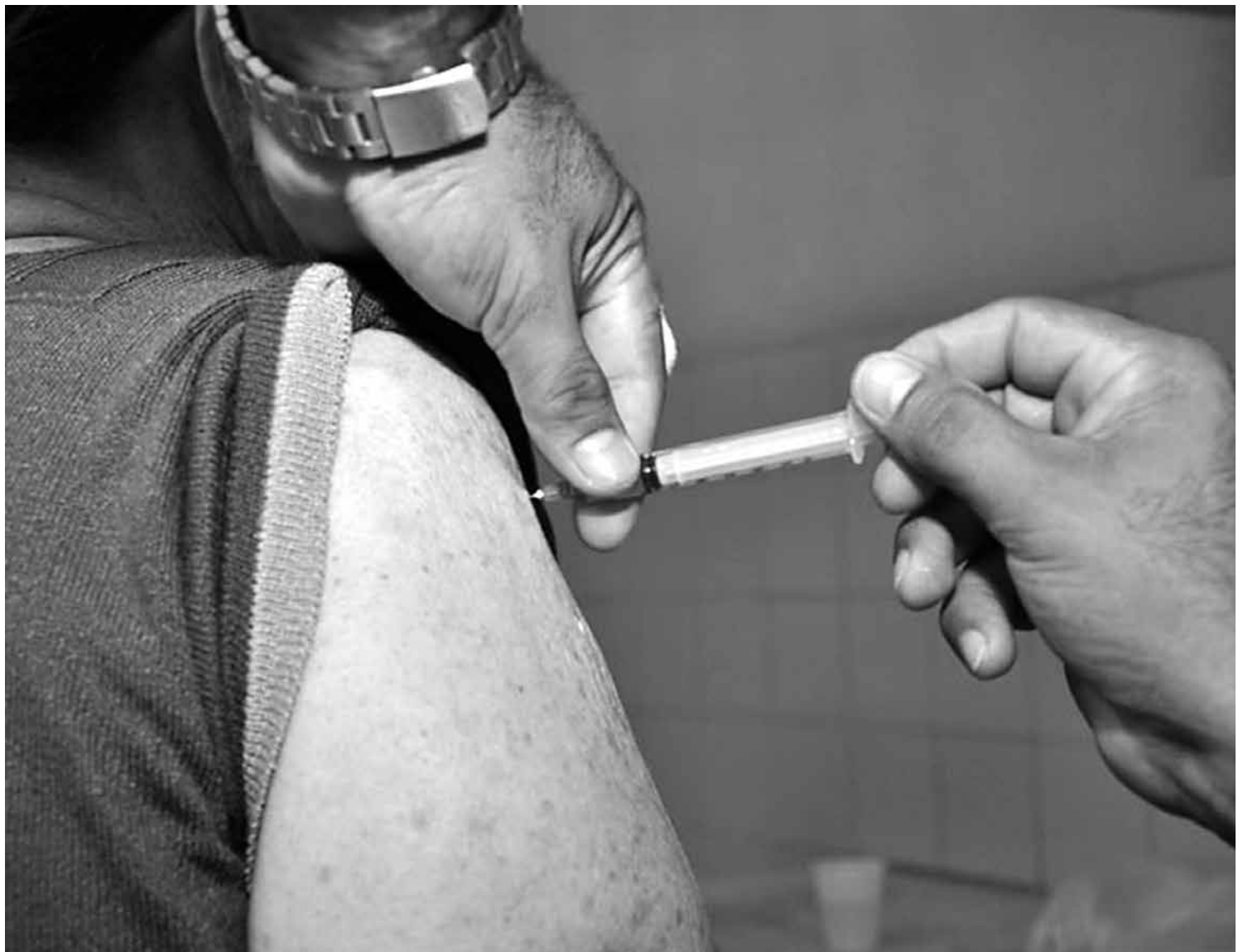
A vacina será oferecida nas Unidades Básicas de Saúde, hospitais, abrigos e presídios; público-alvo deve levar o cartão de vacinação

A vacina será oferecida nas Unidades Básicas de Saúde e em hospitais, abrigos e presídios. O público-alvo deverá levar o cartão de vacinação e uma recomendação médica para receber a vacina. As pessoas que apresentaram problemas após receber a imunização em anos anteriores devem evitar passar pelo procedimento, assim como aquelas que têm histórico de alergia a ovo de galinha, em função de a vacina ser desenvolvida por meio deste componente. Algumas reações como vermelhidão, dor e enrijecimento do local da injeção e até febre são consideradas normais e podem durar até 48 horas.