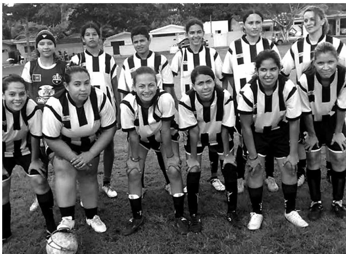
Time do Kashima está em renovação e hoje será atração na cidade de Lucena, no Litoral Norte da PB

O jogo vem gerando grande expectativa para os desportistas da cidade de Lucena e será o primeiro compromisso do time da casa visando as disputas da Copa Paraíba. Para o Kashima, time da capital, atual campeão estadual de futebol feminino, o amistoso representa mais um