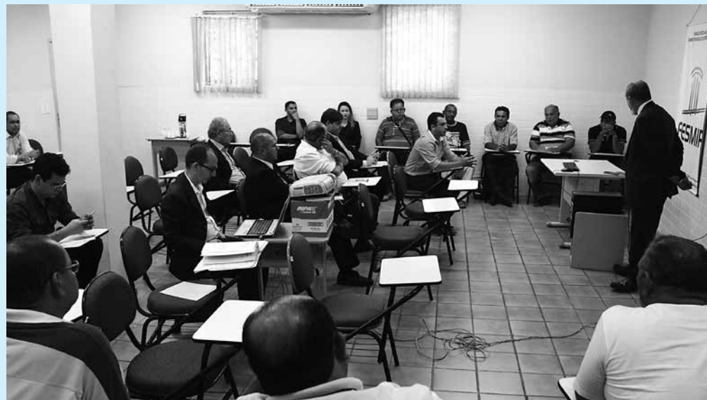
Representantes da Semob e do Ministério Público na reunião da Curadoria do Consumidor

No caso do Bradesco e do Banco do Brasil, eles não apresentaram medidas que pudessem reduzir substancialmente o número de ocorrências.