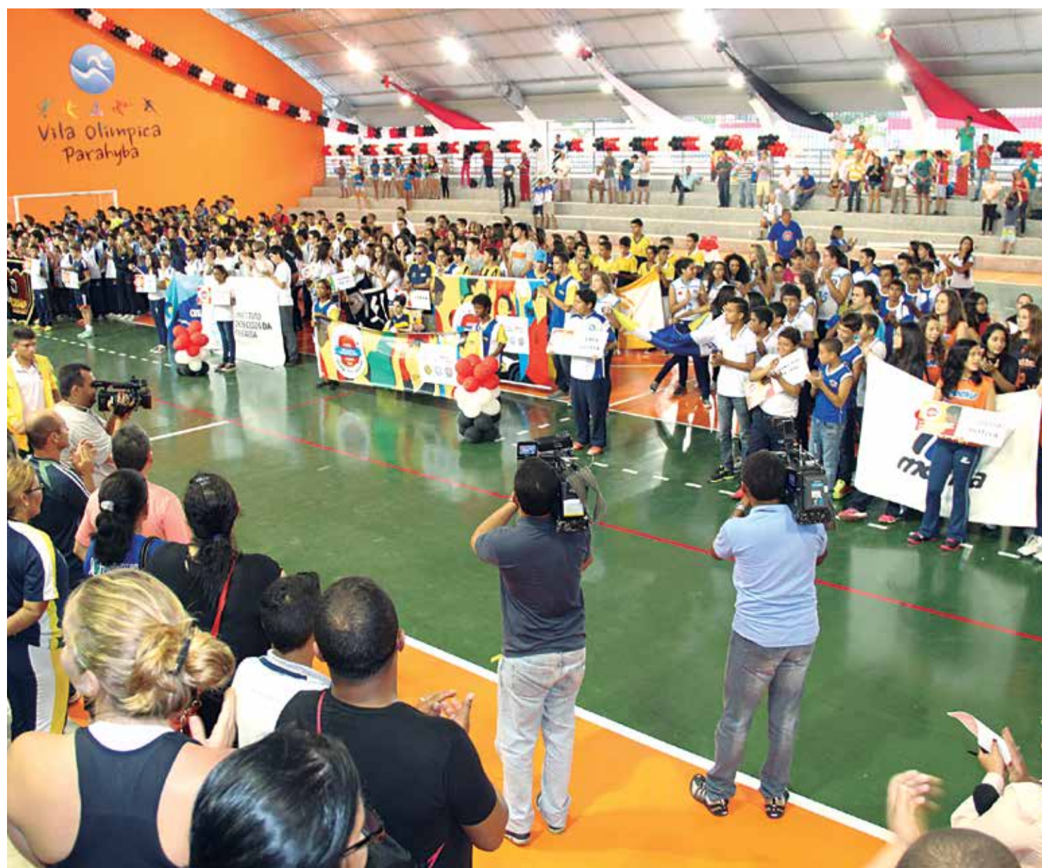
Após desfiles, os atletas das escolas participantes ficam em filas para cantar o Hino Nacional Brasileiro na Vila Olímpica