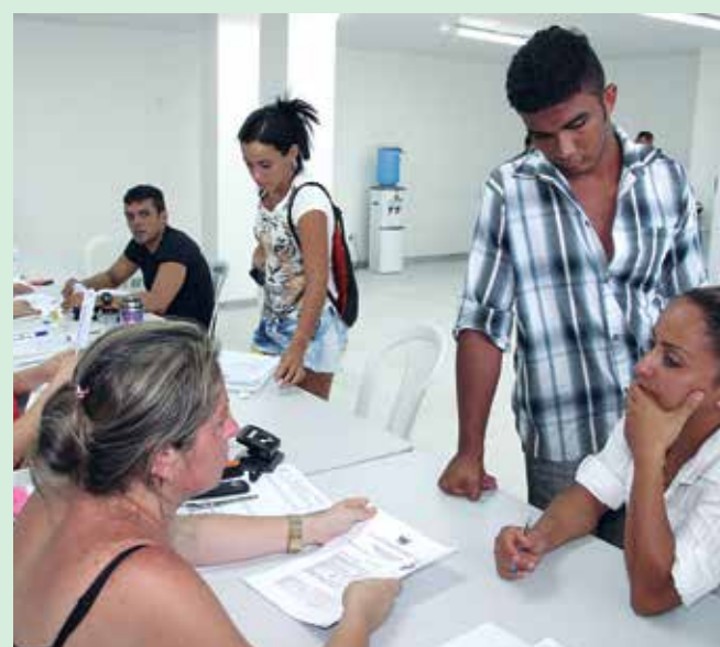
Até ontem, segundo a Sejel-PB, 225 atletas pediram inscrições

Para este ano o investimento do Bolsa Atleta é de mais de R$ 2 milhões e 300 mil, oriundos de recursos próprios do Governo do Estado. A grande novidade é a inclusão de modalidades não olímpicas, que até então não vinham sendo contempladas pelo programa. Atualmente existem seis modalidades de Bolsa Atleta. A de rendimento internacional; rendimento nacional; a Bolsa Estudantil; a Bolsa Institucional; a representatividade; além da técnica, para os treinadores.