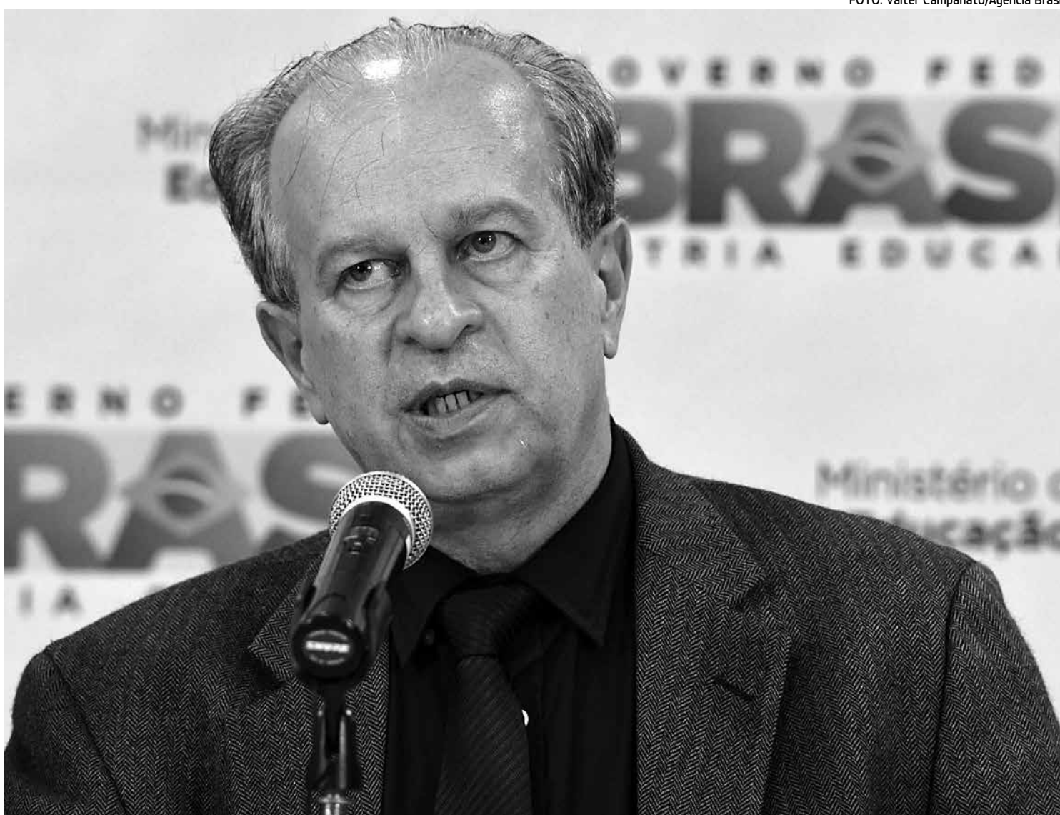
O ministro da Educação, Renato Janine, afirmou que o reajuste da taxa equivale à inflação no período e que ele será mais frequente

O Ministério da Educação (MEC) anunciou também que será rigoroso com os estudantes isentos que não comparecerem para fazer o exame. De acordo com o órgão, quem não apresen-