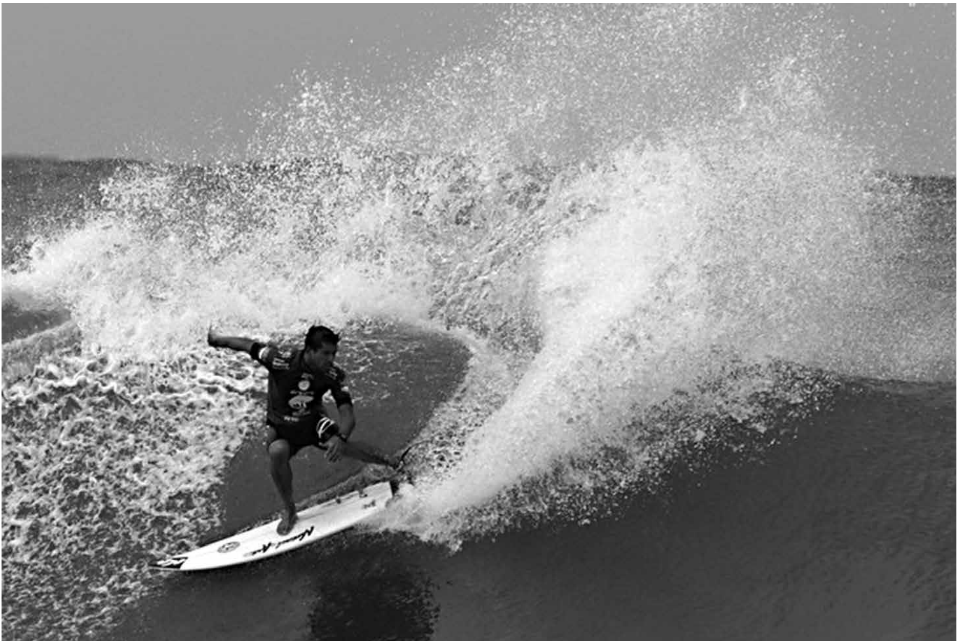
Alex Ribeiro registrou uma baixa pontuação e não conseguiu passar na repescagem do Mundial de Surf que está acontecendo na Barra da Tijuca, no Rio de Janeiro

Enquanto surfistas e torcedores esperavam a próxima chamada da WSL para o Rio Pro, Gabriel Medina foi a grande atração da manhã de ontem na Barra da Tijuca. Sem medo da forte correnteza, o atual campeão mundial foi um dos poucos que se arriscou no mar mexido no Postinho. Ondas boas eram raras. Mas quando apareciam, eram de se respeitar. Após levar algumas "vacas", Medina emplacou um longo tubo que percorreu quase toda a extensão do palanque, arrancando gritos e aplau-