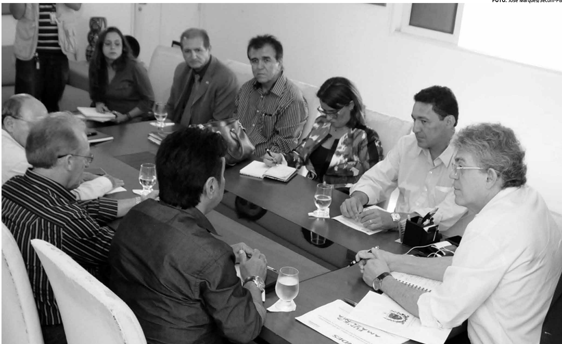
O governador Ricardo Coutinho recebeu os dirigentes do Sindicato dos Trabalhadores e Trabalhadoras em Educação do Estado da Paraíba, na Granja Santana

O governador Ricardo Coutinho explicou que o Projeto de Lei a ser encaminhado à AL concede reajuste automático, por antecipação, de 20% em janeiro de 2016, janeiro de 2017 e janeiro de 2018. "Automaticamente, o piso estadual do Magistério será acrescido de 20% e o restante da carreira nós vamos discutindo, continuando com