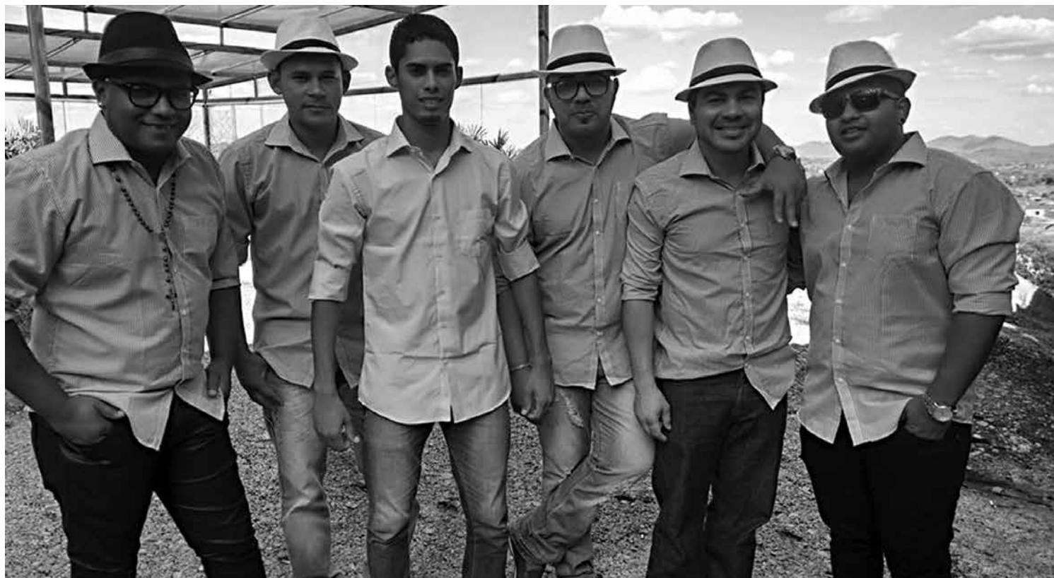
O Clube do Samba é idealizador e produtor do evento e promete movimentar o público com clássicos do gênero