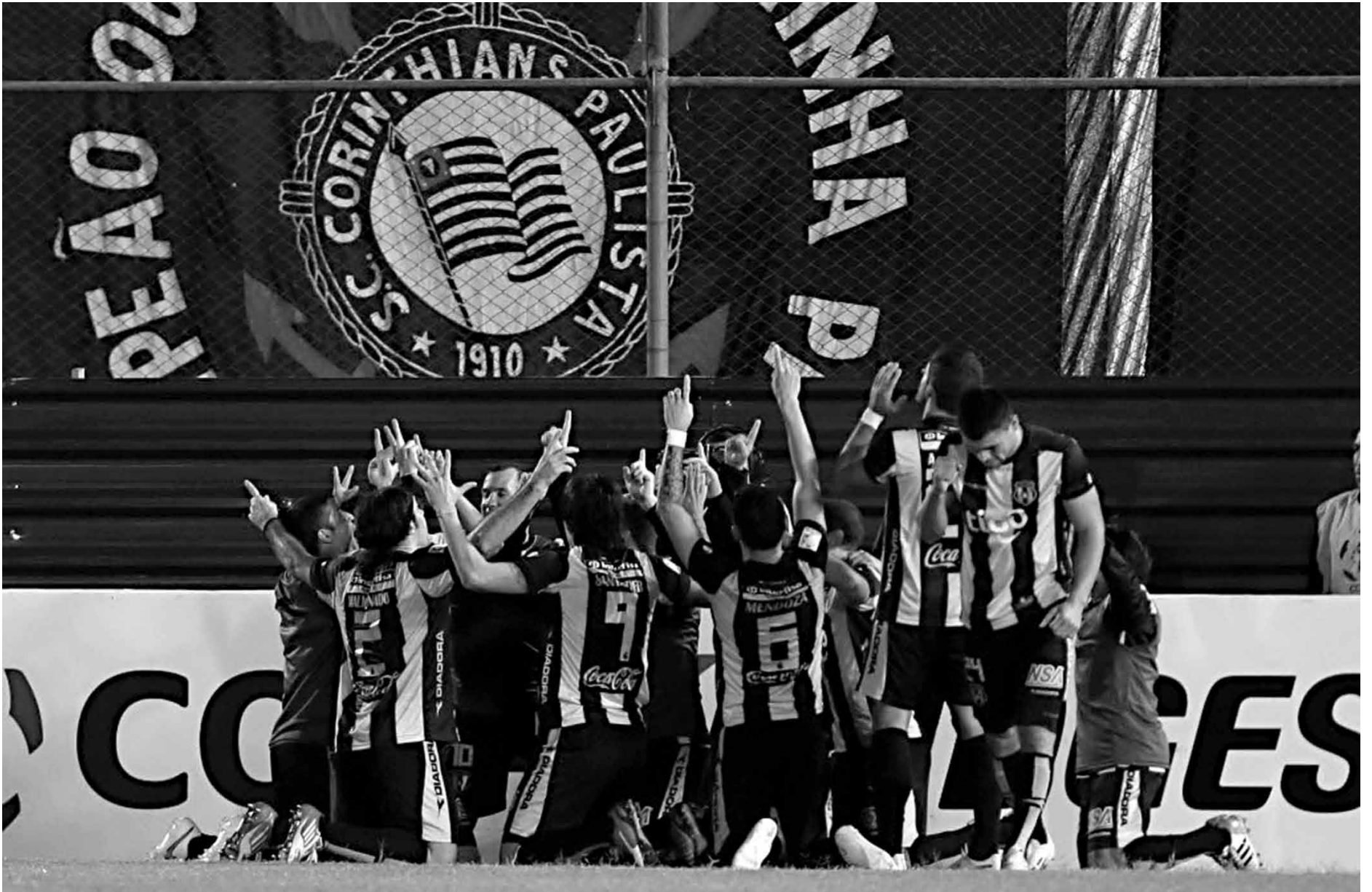
Jogadores do Guarani comemoram no Estádio Itaquerão, de propriedade do Corinthians, a classificação para as quartas de final da Taça Libertadores de 2015

A incomum entrevista coletiva do presidente corintiano na véspera da eliminação, assim como a presença de praticamente todos os dirigentes no treinamento, elevaram o tom sobre a importância da classificação. Foi a diretoria corintiana que optou por uma atividade na véspera com 7 mil torcedores na Arena Corinthians. Quando a bola rolou de fato, o time mostrou dificuldade para conviver com a pressão. Nervoso ao extremo, terminou o jogo com nove.