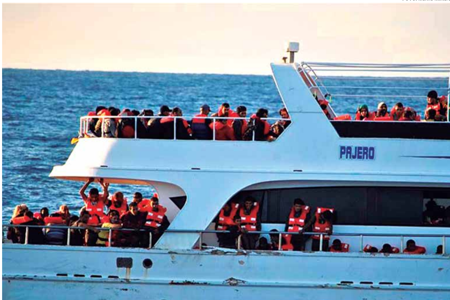
O governo italiano está enfrentando um sério problema por ser um dos países europeus que mais recebem imigrantes ilegais

Os protestos no Burundi, um dos países mais pobres da África, começaram há cerca de duas semanas, quando Nkurunziza anunciou que iria concorrer a mais uma re-eleição. De acordo com a legislação do país, um presidente só pode ter dois cargos consecutivos. Considerando a atitude irregular, o Exército tentou aplicar um golpe de Estado. O atual presidente completará 10 anos no poder em 2015.