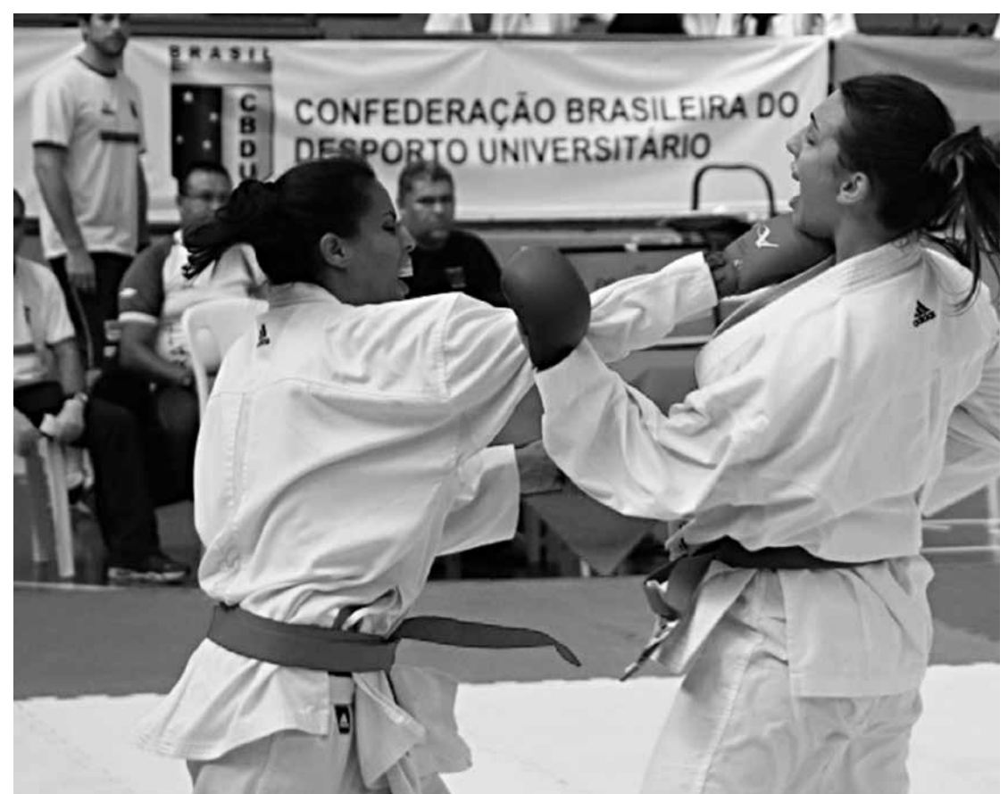
Lutas de taekwondo vão acontecer em Brasília com vistas as disputas da Universíade de 2015

A Liga do Desporto Universitário de Lutas (LDU) contará com a participação de 200 alunos-atletas (homens e mulheres) de 17 estados: Amazonas, Amapá, Acre, São Paulo, Espírito Santo, Distrito Federal, Rio de Janeiro, Santa Catarina, Rio Grande do Norte, Paraná, Pernambuco, Goiás, Rio Grande do Sul, Mato Grosso