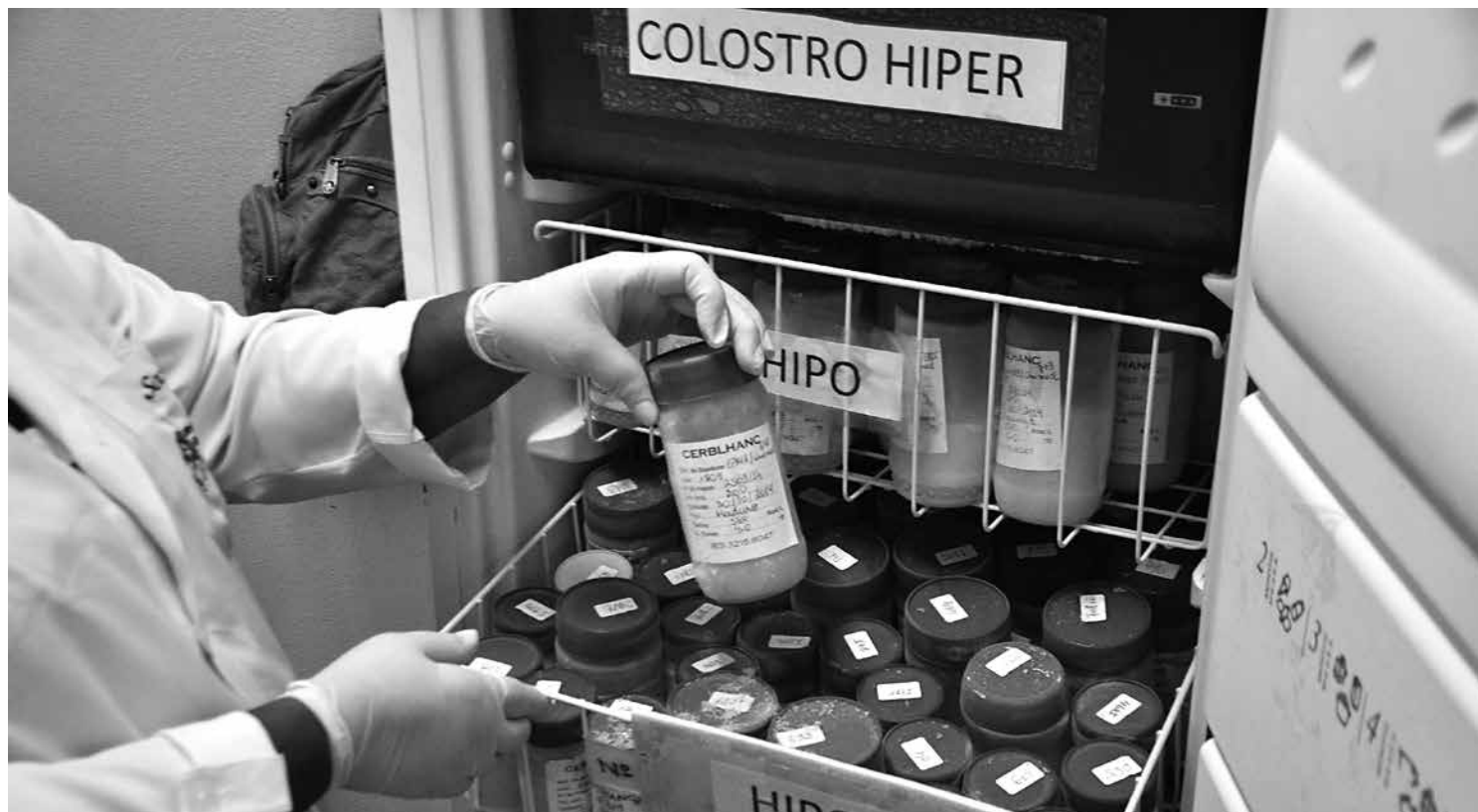
Com a unidade de coleta do Hospital de Mamanguape, a Paraíba terá 19 postos e seis bancos de leite distribuídos por todo o Estado