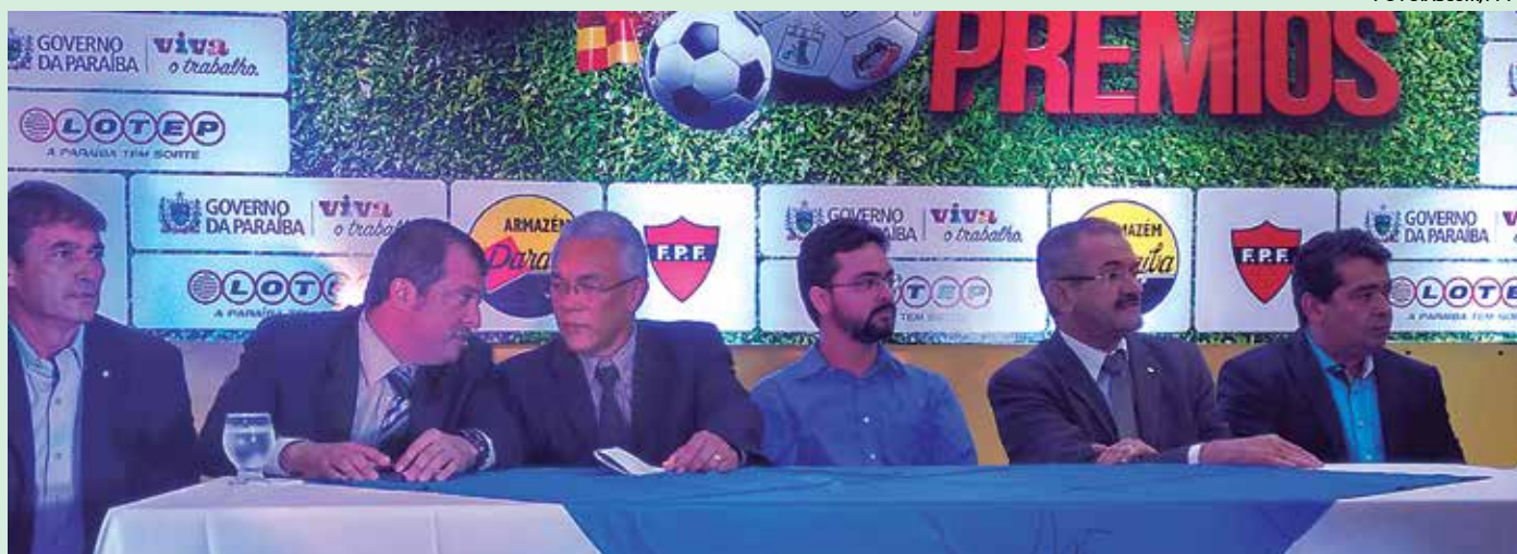
Várias autoridades prestigiaram o lançamento do Campeonato Paraibano de Prêmios, ontem pela manhã, na sede da Lotep