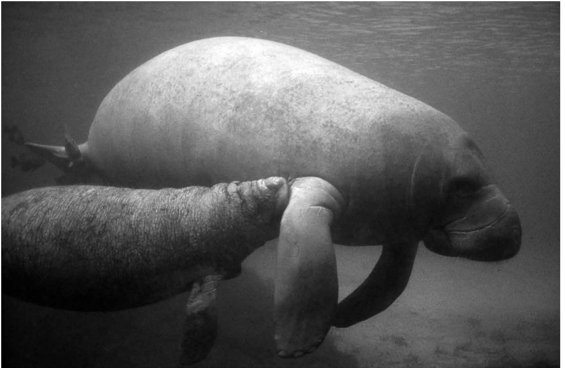
Estudo do Instituto Nacional da Amazônia utiliza tecidos celulares para entender a biologia reprodutiva e conservar as espécies que estão ameaçadas de extinção

Mudanças climáticas extremas põem em risco a capacidade da floresta