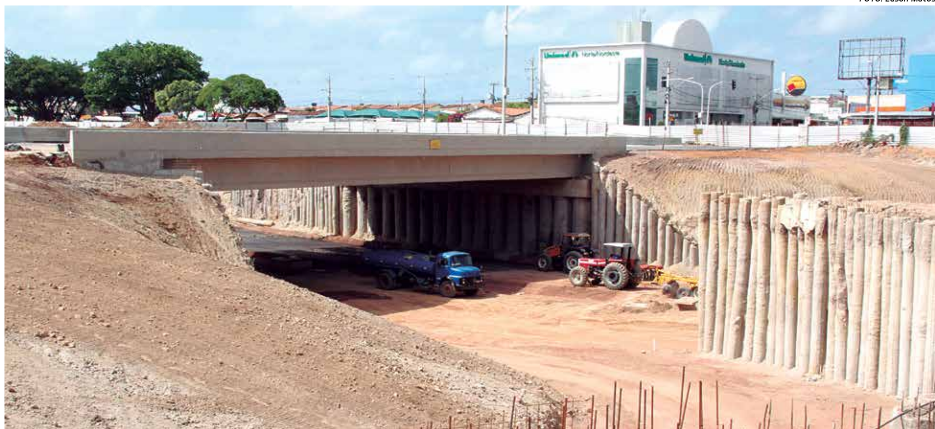
Vista parcial da Avenida Hilton Souto Maior sob o vão central do viaduto ligando o bairro dos Bancários ao bairro de Mangabeira onde o asfaltamento já foi iniciado

Na construção do Trevo de Mangabeira o Governo do Estado está investindo R$ 21,6 milhões, que além de