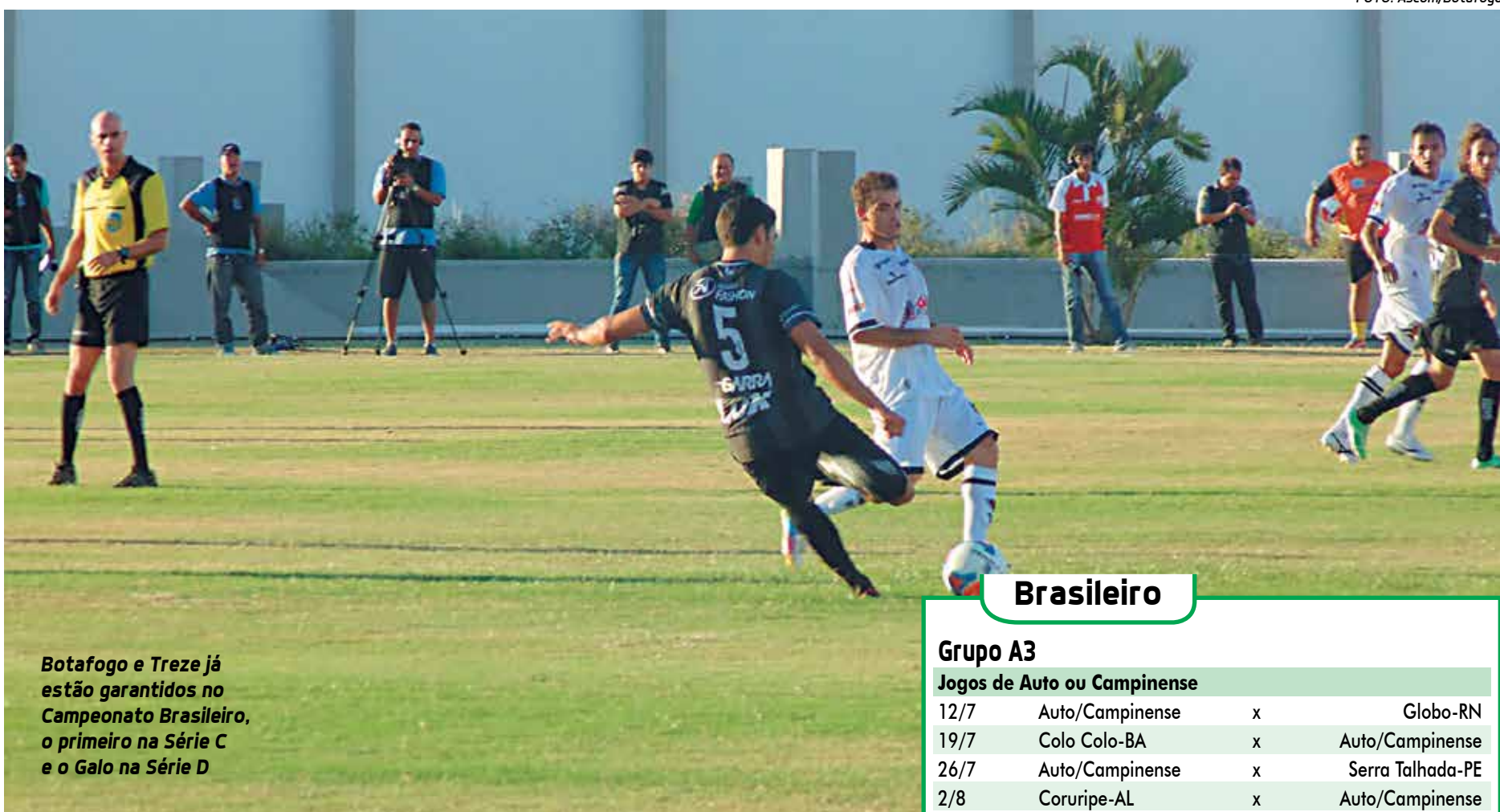
Botafogo e Treze já estão garantidos no Campeonato Brasileiro, o primeiro na Série C e o Galo na Série D

No caso do Galo, no Grupo A4, os demais adversários são Jacuipense-BA, Central-PE e Goianésia-GO. Pela tabela básica, a competição em sua primeira fase vai até o dia 13 de setembro quando serão conhecidos os 16 classificados. As finais estão previstas para os dias 8 e 15 de novembro.