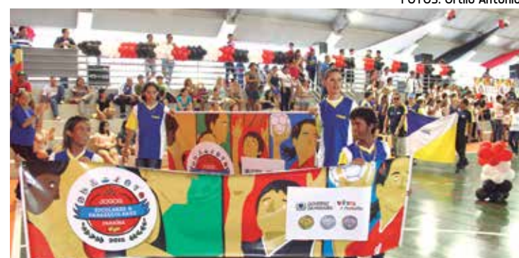
Os alunos da Funad foram aplaudidos de pé pelo público presente