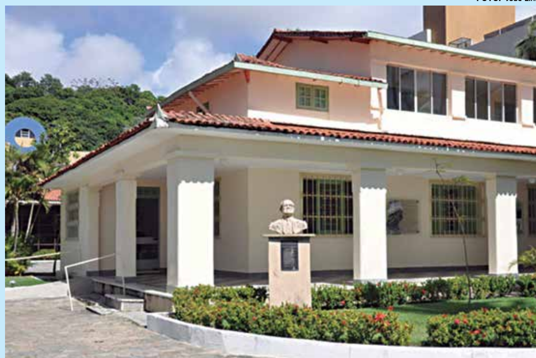
Sede da instituição fica localizada na Praia do Cabo Branco, em João Pessoa