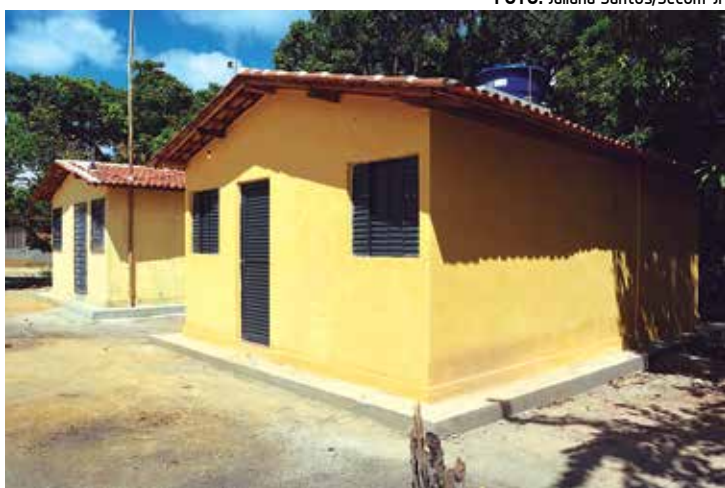
Cada uma das 68 casas tem 40 metros quadrados de área total

O presidente da Frente Parlamentar da Água da ALPB, deputado Jeová Campos, se reuniu na noite de quarta-feira, 13, na sede da Famup, com outros parlamentares, assessores, técnicos e o diretor de Expansão da Cagepa, Leonardo Brasil, para definir a formatação do documento que conterá um resumo das ações da Frente durante as audiências públicas e visitas às obras, além das propostas da Frente em relação a recuperação, preservação, manutenção e destinação das águas do Estado, a fim de assegurar uma maior segurança hídrica para os paraibanos.