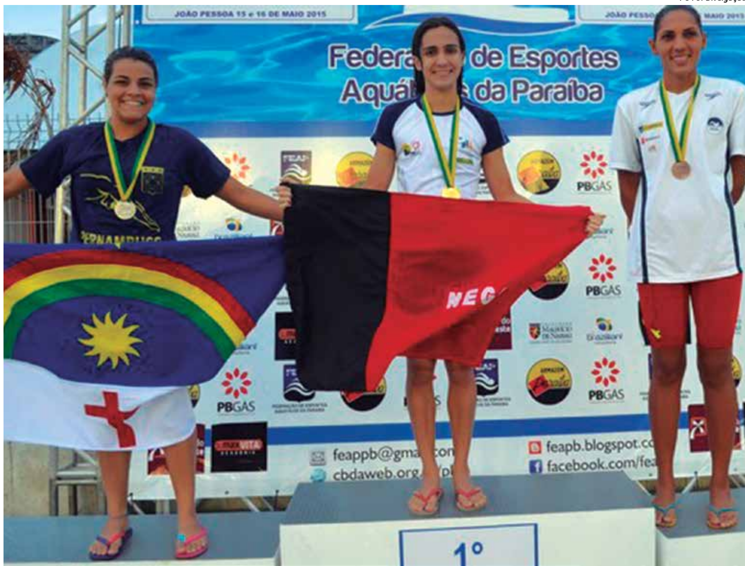
Paraibana ergue com orgulho a bandeira do seu Estado após subir no lugar mais alto do pódio durante competição no fim de semana

A disputa aconteceu na última sexta-feira, se encerrando no sábado, no Parque Aquático da Vila Olímpica Parahyba, com a presença dos Estados da Paraíba, Bahia, Sergipe, Alagoas, Pernambuco, Rio Grande do Norte, Ceará, Pará, Amazonas, Maranhão e Roraima. O desafio foi organizado pela Federação Paraibana de Desportos Aquáticos (FPDA), com apoio do Governo do Estado, que fez parte do calendário nacional da Confederação Brasileira de Desportos Aquáticos (CBDA).