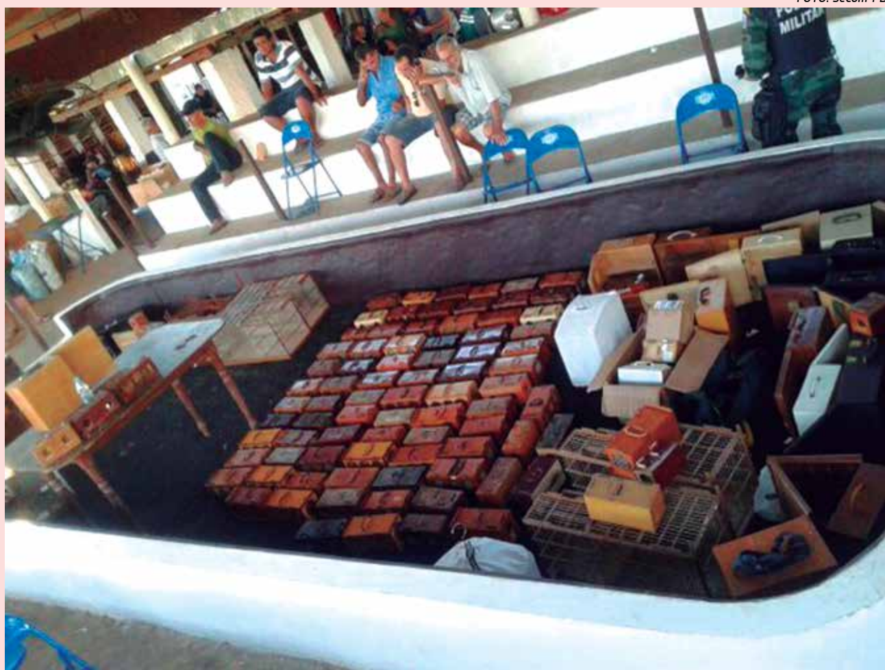
No local foram apreendidos três galos e 205 aves silvestres, entre elas, 199 canários, além de um tiziu e um curió

O Batalhão de Polícia Ambiental desarticulou, no domingo (17), uma rinha de canários que funcionava no Sítio Várzea Grande, na cidade de Mari. No local, foram apreendidas 205 aves silvestres e três galos. Trinta e seis pessoas foram conduzidas para a Delegacia da Polícia Civil em Sapé, onde foram autuadas por maus-tratos, sendo oito delas também por manter em cativeiro, sem autorização, animais da fauna silvestre.