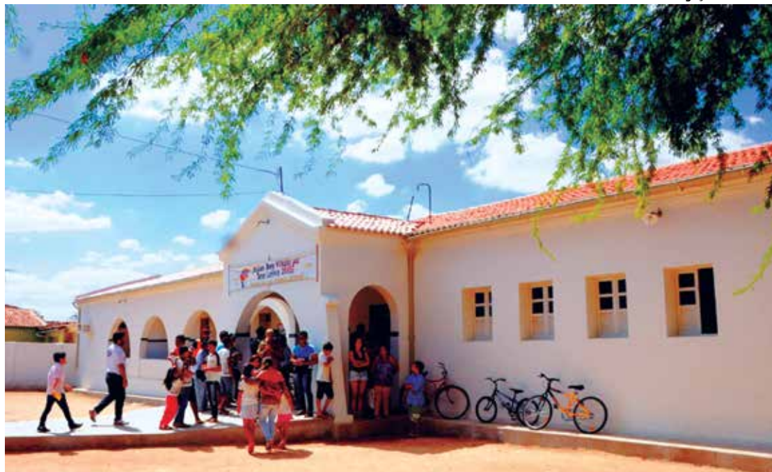
Escola em Barra de Santa Rosa recebeu mais de R$ 500 mil em investimento para 214 alunos

O governador Ricardo Coutinho entregou, no sábado, 16, a reforma e ampliação da Escola de Ensino Fundamental e Médio Severino de Holanda Cavalcanti, na zona rural do município de São Miguel de Taipu. A escola, que atende mais de 200 alunos nos três turnos, tinha apenas duas salas de aula e passou a contar com oito salas de aula, um investimento de aproximadamente R$ 500 mil.