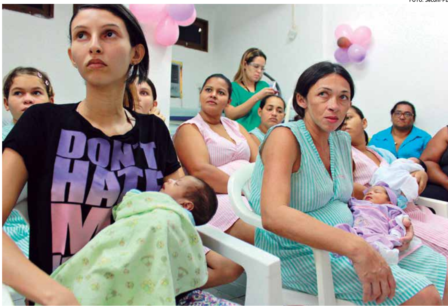
Durante a atividade, mães e bebês receberam homenagens, ganharam lembrancinhas e participaram de um café da manhã