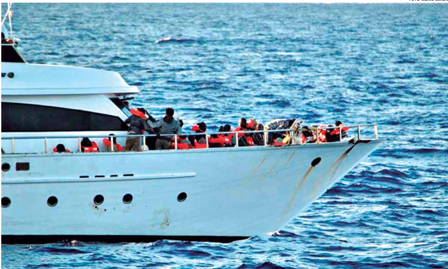
A morte de centenas de imigrantes no Mar Mediterrâneo obrigou as autoridades da União Europeia a tomar medidas urgentes contra o tráfico de seres humanos

“Compartilhar a responsabilidade do que fazemos com as pessoas que salvamos é parte integrante