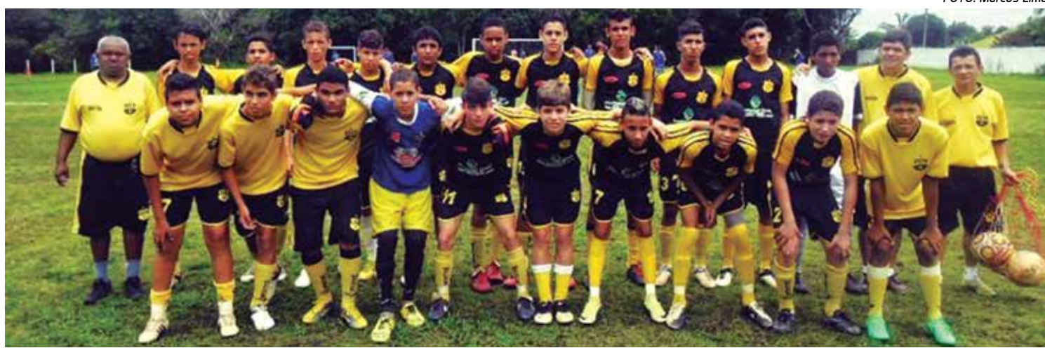
A equipe do Kashima, do bairro do Cristo Redentor venceu o Picolé de Manga por 3 a 1, em mais uma rodada da Copa Paraíba Sub-15