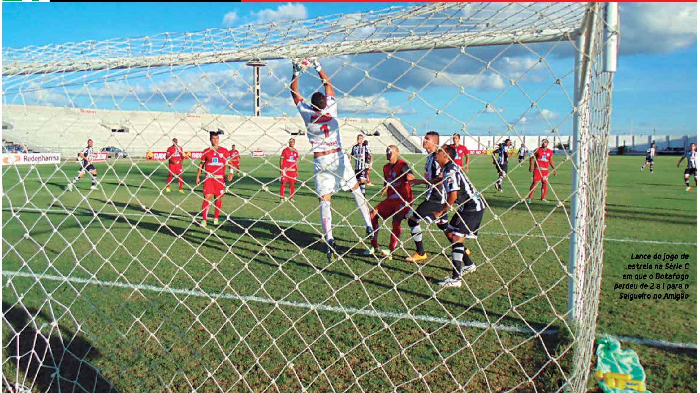
Lance do jogo de estreia na Série C em que o Botafogo perdeu de 2 a 1 para o Salgueiro no Amigão