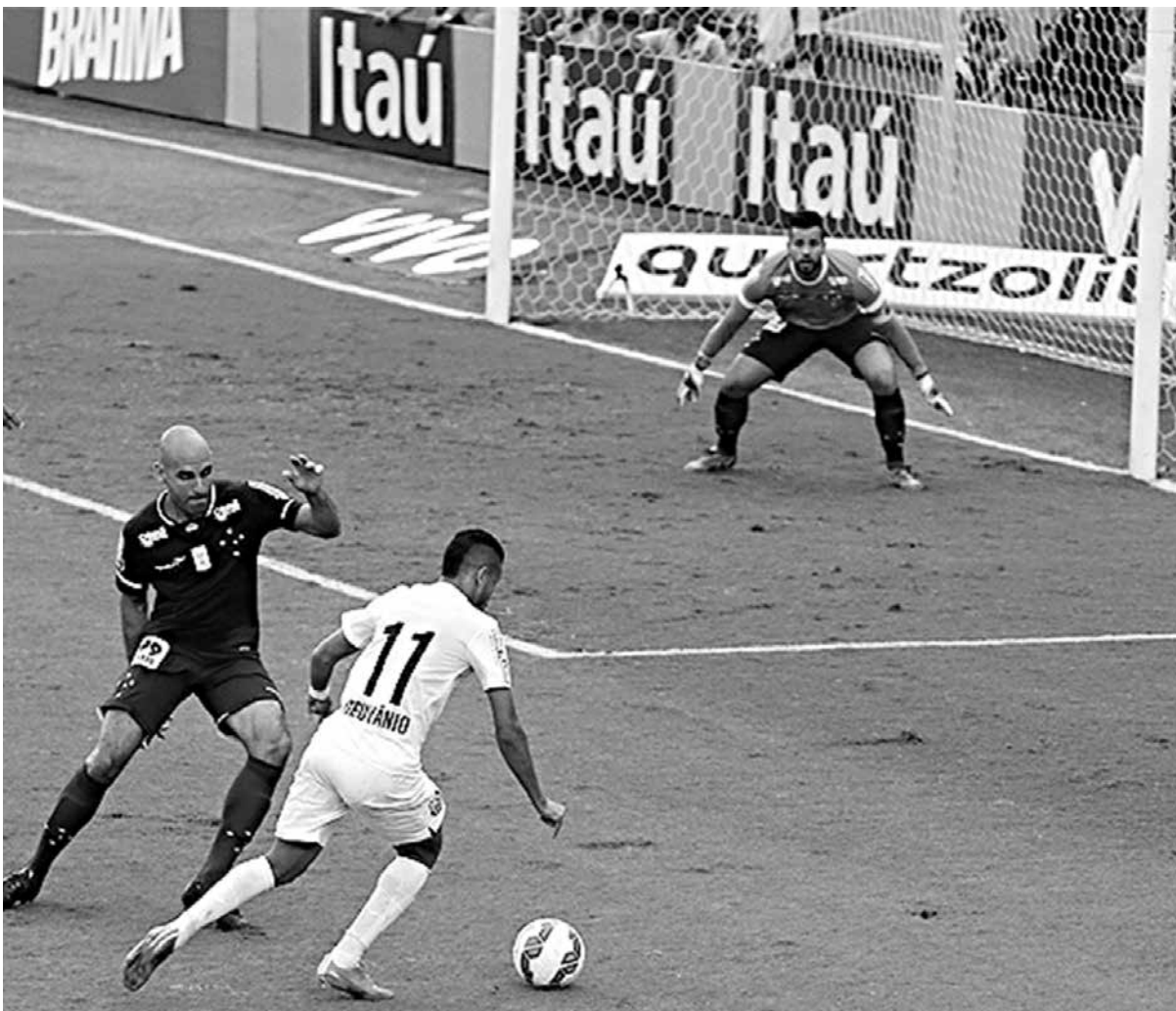
O Santos venceu o Cruzeiro na Vila Belmiro por 1 a 0 e decretou a segunda derrota do campeão de 2014

O torcedor cruzeirense tem uma sensação estranha ao olhar a tabela de classificação do Campeonato Brasileiro. Depois de ser líder por 55 rodadas em 76 possíveis, somadas as edições de 2013 e 2014, a equipe celeste está na lanterna do Brasileiro 2015, algo inédito na história dos pontos corridos. Por mais que o time esteja focado na Copa Libertadores e seja apenas o começo da competição, ser o único time da Série A sem pontuar é algo que preocupa.