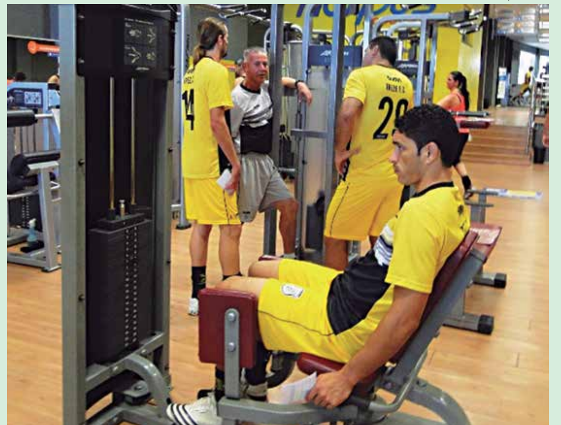
Jogadores do Treze aprimoram a forma física em academia de Campina Grande