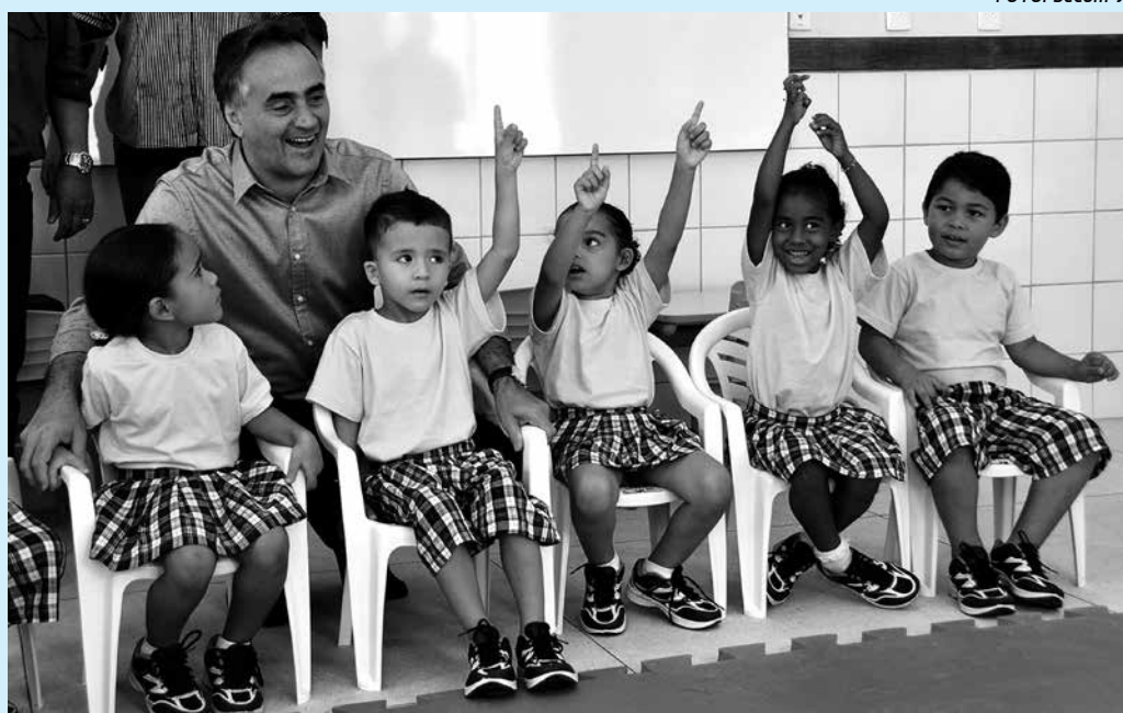
Nova unidade foi entregue pelo prefeito Luciano Cartaxo e vai atender 80 crianças

O Crei conta com anfiteatro, playground, sala de informática, fraldário, lactário e sala de repouso, além de refeitório, vestiários, lavanderia e pátio coberto. Os investimentos são da ordem de R$ 1,250 milhão, sendo R$ 1,1 do Governo Federal, por meio do Programa Brasil Carinhoso, e R$ 150 mil de contrapartida da PMJP, para a compra de mobília, aparelhos eletroeletrônicos, brinquedos e todos os