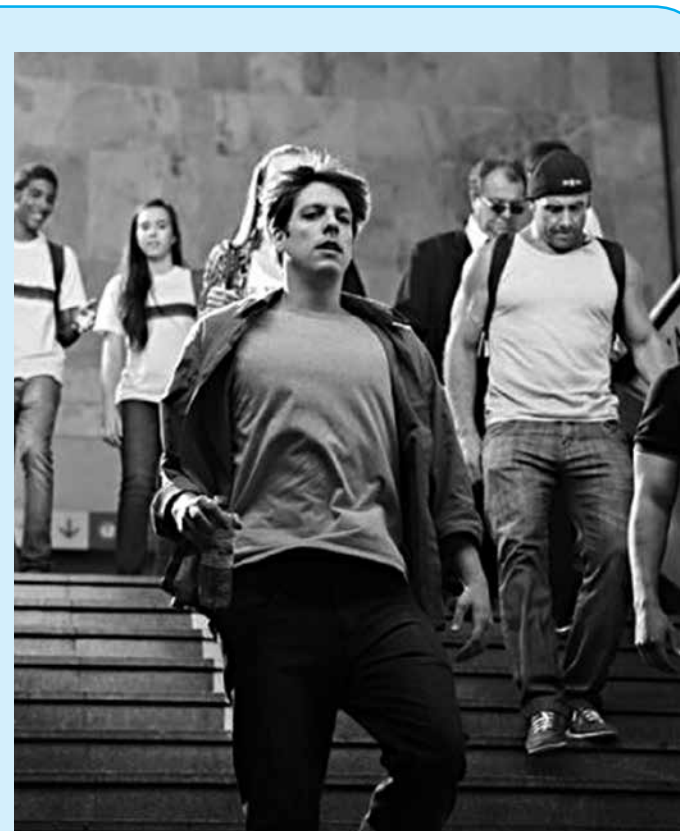
Drama brasileiro conta história de um editor de imagens

Sinceramente, o que fica deste fato é que as pessoas tem uma espécie de necessidade perversa de ver o "circo pegar fogo". E, do outro lado, quem tem medo tende a propagar esse sentimento criando um círculo vicioso no qual quem sai perdendo é a sanidade de uma sociedade cada vez mais combatida no que diz respeito à segurança pública.