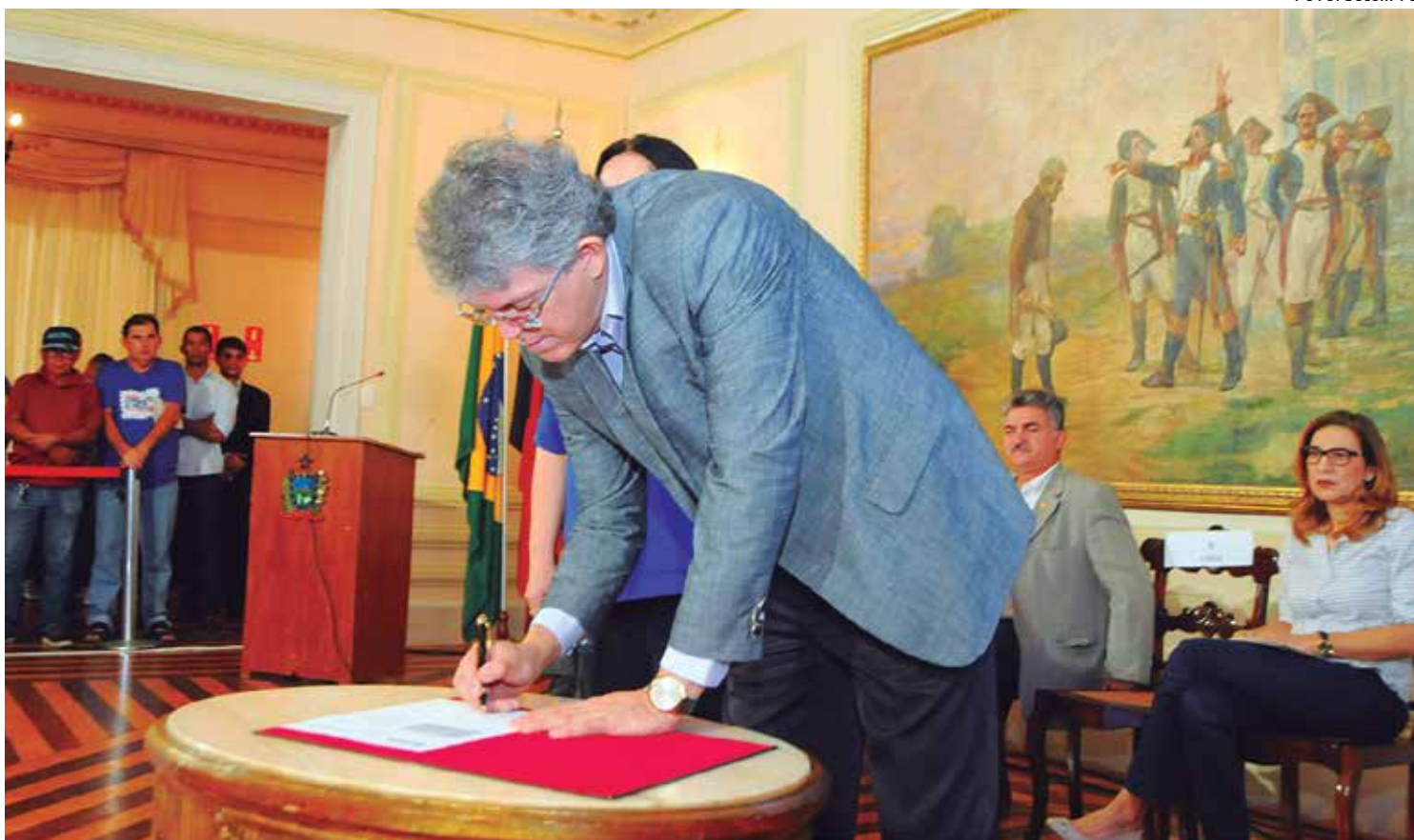
O governador autorizou a abertura de licitação para construção do primeiro conjunto habitação consciente, com 140 moradias, em Sousa

"Manual Construção Consciente" foi lançado ontem em João Pessoa