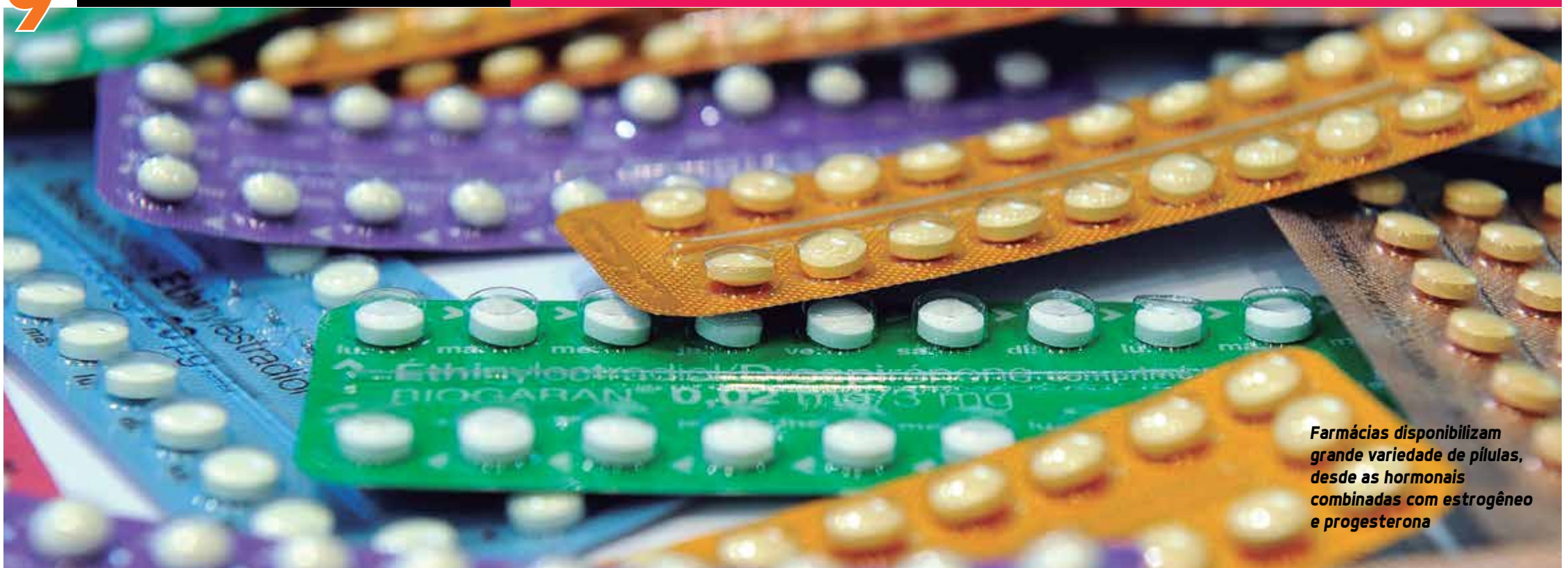
Farmácias disponibilizam grande variedade de pílulas, desde as hormonais combinadas com estrogênio e progesterona