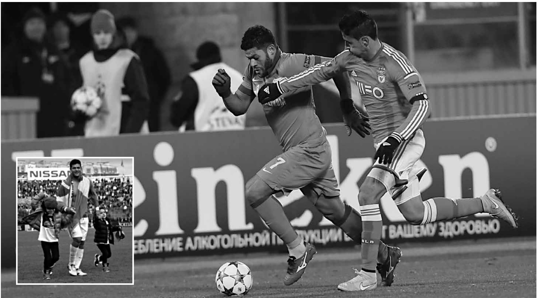
O atacante paraibano Hulk foi o grande nome no empate contra o Ufa que deu o título ao Zenit, bastante comemorado com os filhos - no detalhe - no último domingo

Na penúltima rodada, o Zenit joga novamente fora de casa contra o Amkar Perm, no próximo sábado, às 7h (horário de Brasília). Já o Ufa, continuará tentando escapar do rebaixamento na mesma data, diante do Spartak Moscou, fora de casa, ao meio-dia.