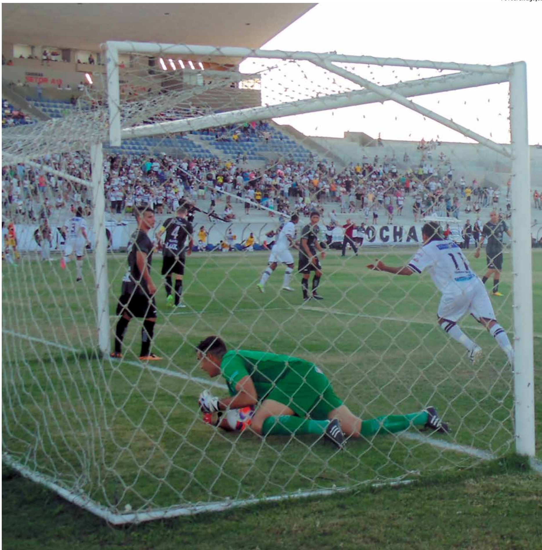
Na última vez em que se enfrentaram, jogo realizado no Estádio Amigão, em Campina Grande, pela fase classificatória, o Botafogo levou a melhor e venceu a partida por 2 a 1

Sem fazer segredos, o técnico Everton Goiano já escalou o Galo, para enfrentar o Belo, com a seguinte formação: Léo Rodrigues, Júnior Gaúcho, Marcelo Goldri, Tiago Sala e Alexandre Bindé; Edmar, Magno, Rodrigo Celeste e André Belezinha; Preto e Nonato.