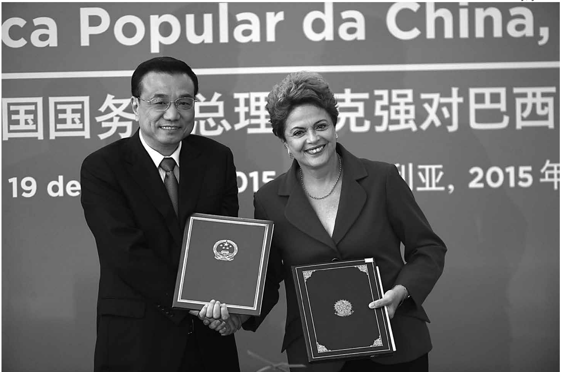
A presidente Dilma Rousseff e o primeiro-ministro da China, Li Keqiang, assinaram um plano de cooperação até 2021 que envolve 35 acordos entre os dois países

Na lista, está o acordo para retomada das exportações de carne brasileira para a China, interrompidas desde julho de 2012. Durante a visita do presidente chinês, Xi Jinping, em julho do ano passado, o fim do embargo chinês à carne brasileira foi anunciado, mas faltava a assinatura de um protocolo sanitário.