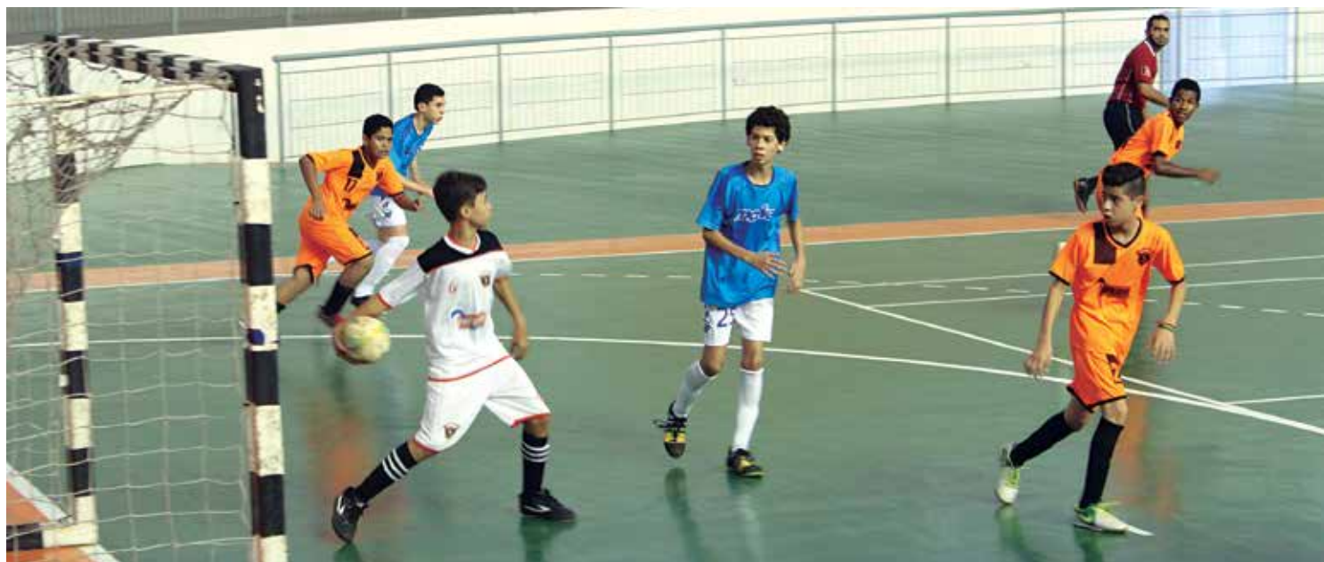
Ontem, no Ronaldão, na capital, garotos de várias escolas disputaram partidas de futsal e, hoje, o ginásio sedia jogos de handebol