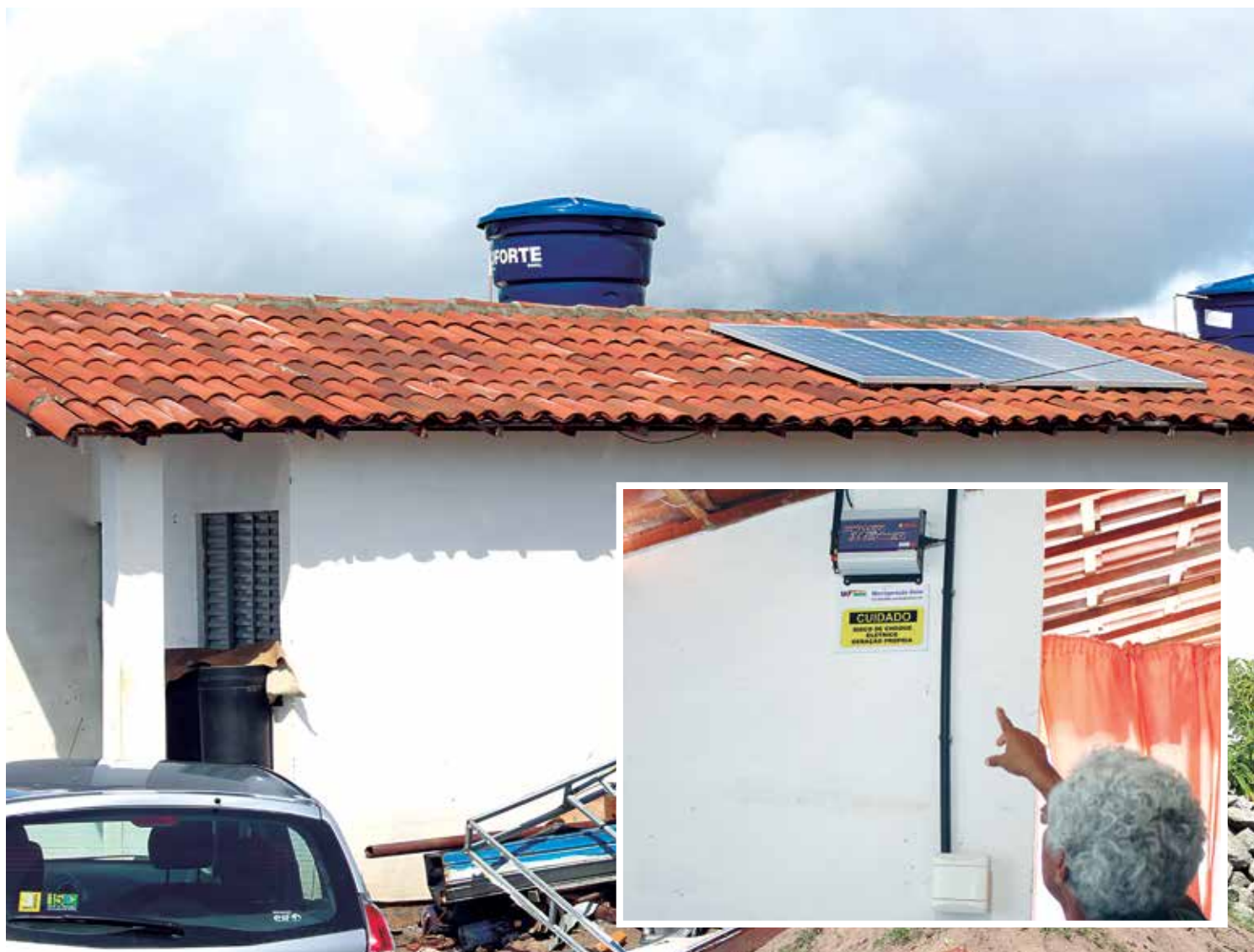
Nas casas são instalados painéis solares e um equipamento chamado inversor, que é ligado diretamente na rede elétrica convencional

Agora, a Cehap está preparando projetos para que mais unidades possam ser construídas já com o sistema. "O projeto piloto foi implantado para estudar os efeitos positivos e negativos do sistema. A gente está tirando todas as lições desse projeto e a previsão é que a gente vai ter uma