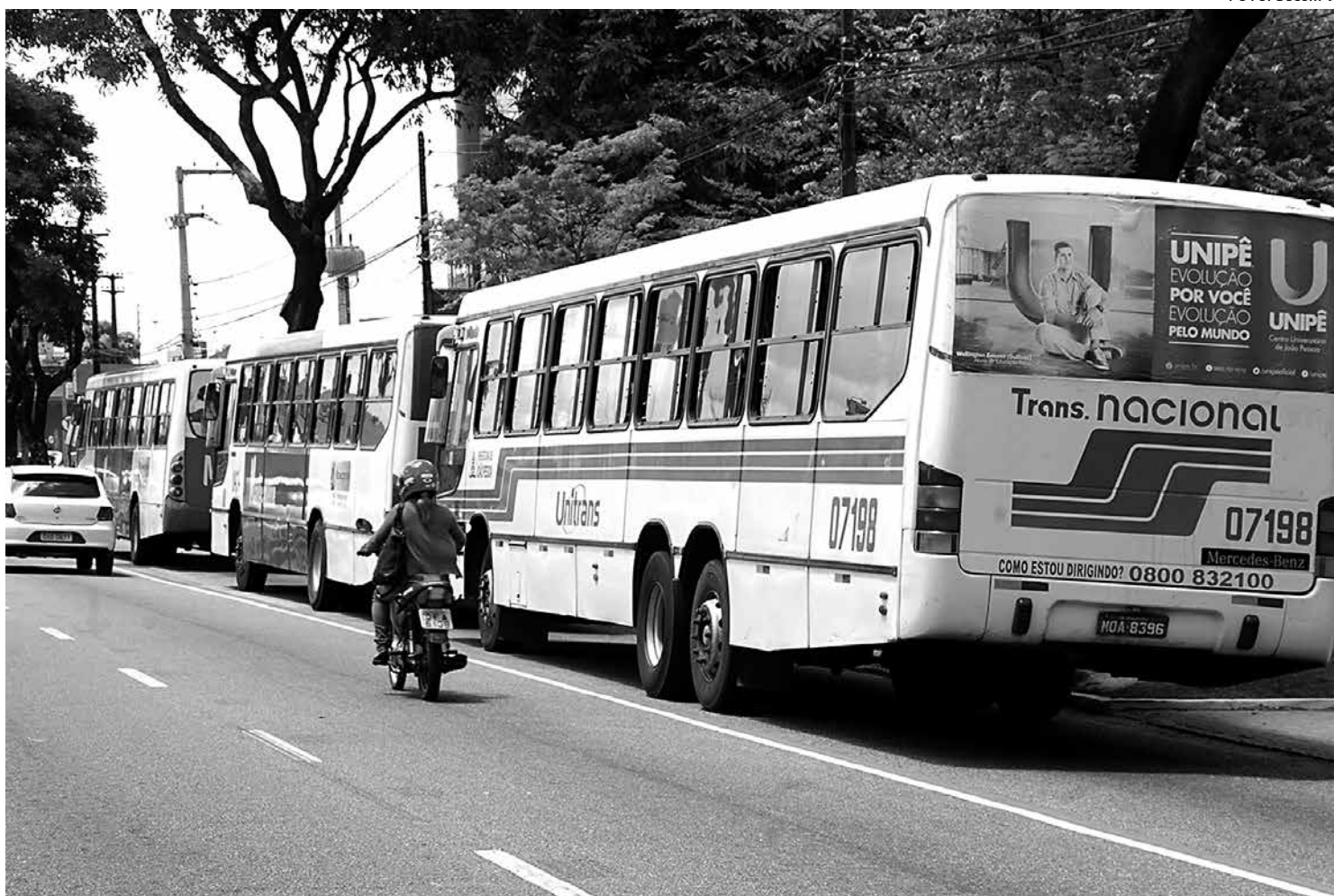
Motoristas de ônibus que circularem fora da faixa e de veículos particulares que invadirem a área pagam multa e perdem pontos na CNH

Após a fase educativa, a partir da próxima segun-