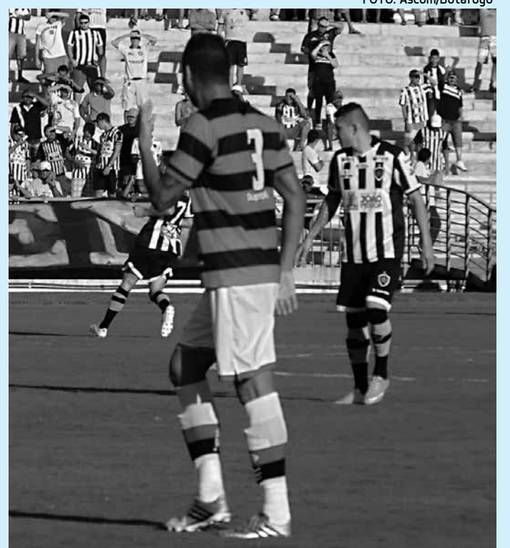
Campinense e Botafogo se enfrentam na próxima quarta-feira