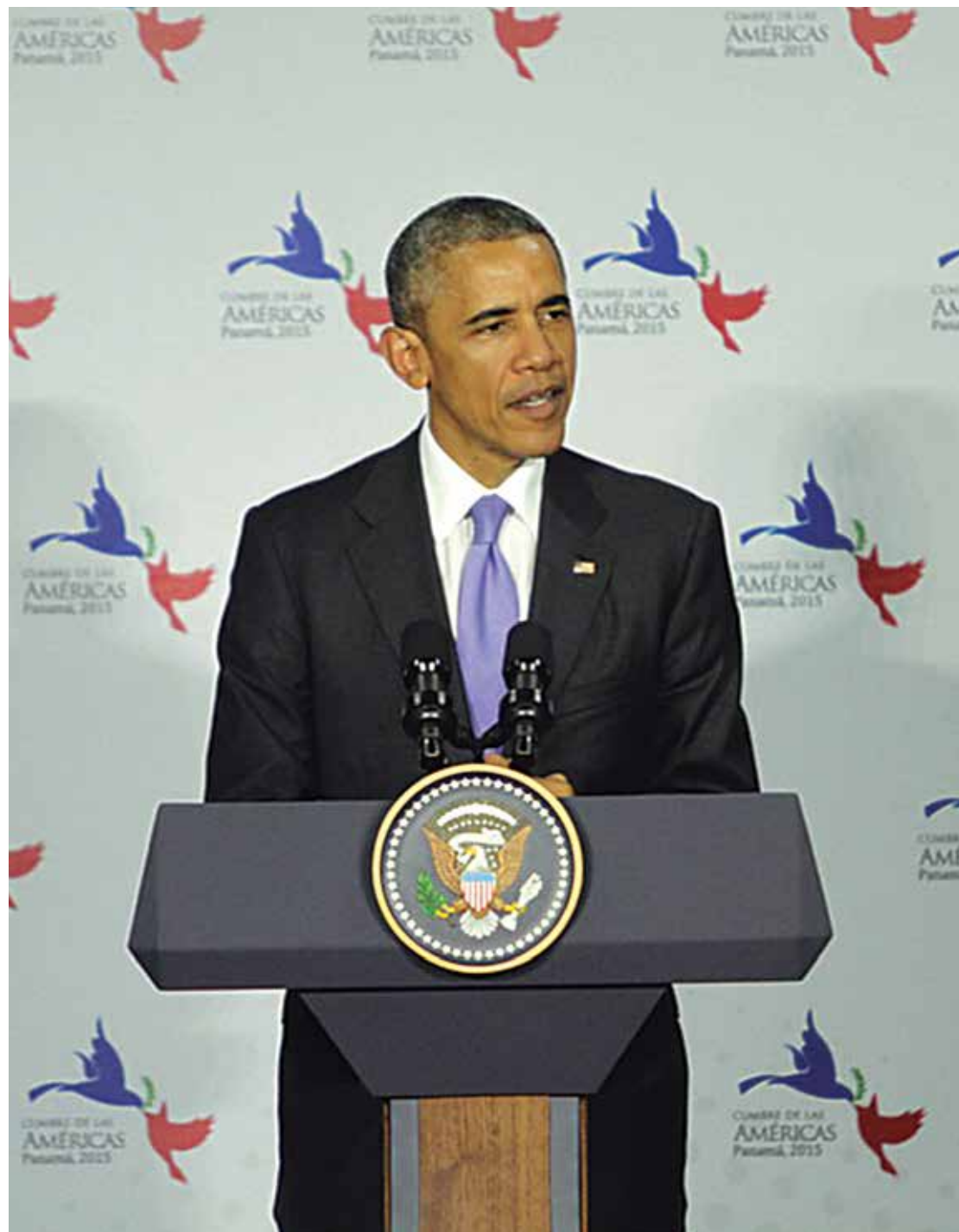
Barack Obama reconhece a força do Estado Islâmico, mas afirmou que a guerra não está perdida

"Lamentamos essas mortes, apesar de não terem sido intencionais", afirmou o comunicado.