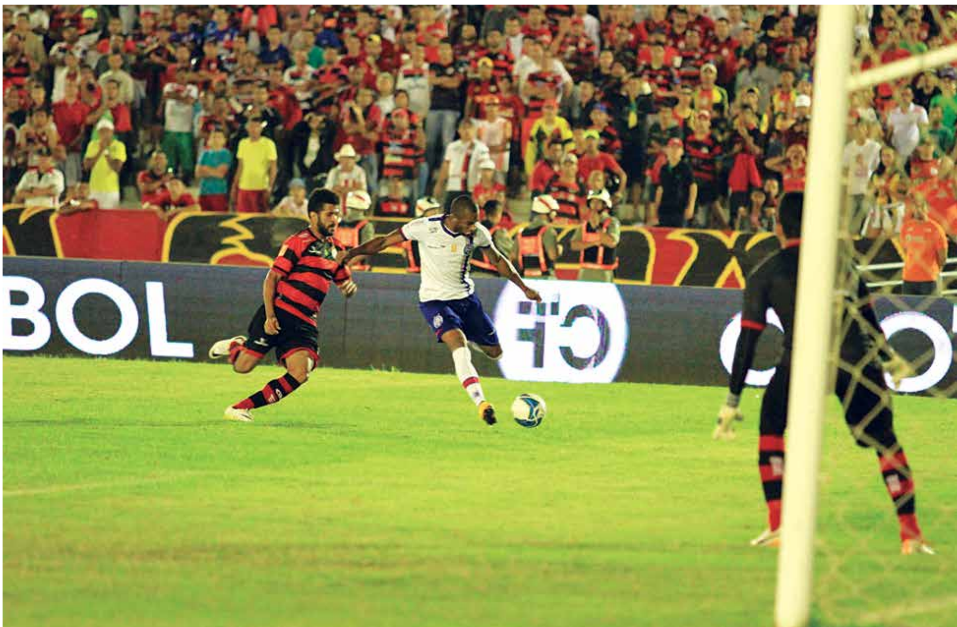
Na última quarta-feira as equipes não conseguiram marcar, deixando o jogo aberto para este sábado no Estádio da Fonte Nova quando Bahia ou Campinense será eliminado

O Tricolor da Boa Terra deverá entrar em campo com a seguinte formação: Douglas Pires, Tony, Thales, Titi e Patric; Pittoni, Souza e Tiago Real; Maxi, Léo Gamalho e Kieza.