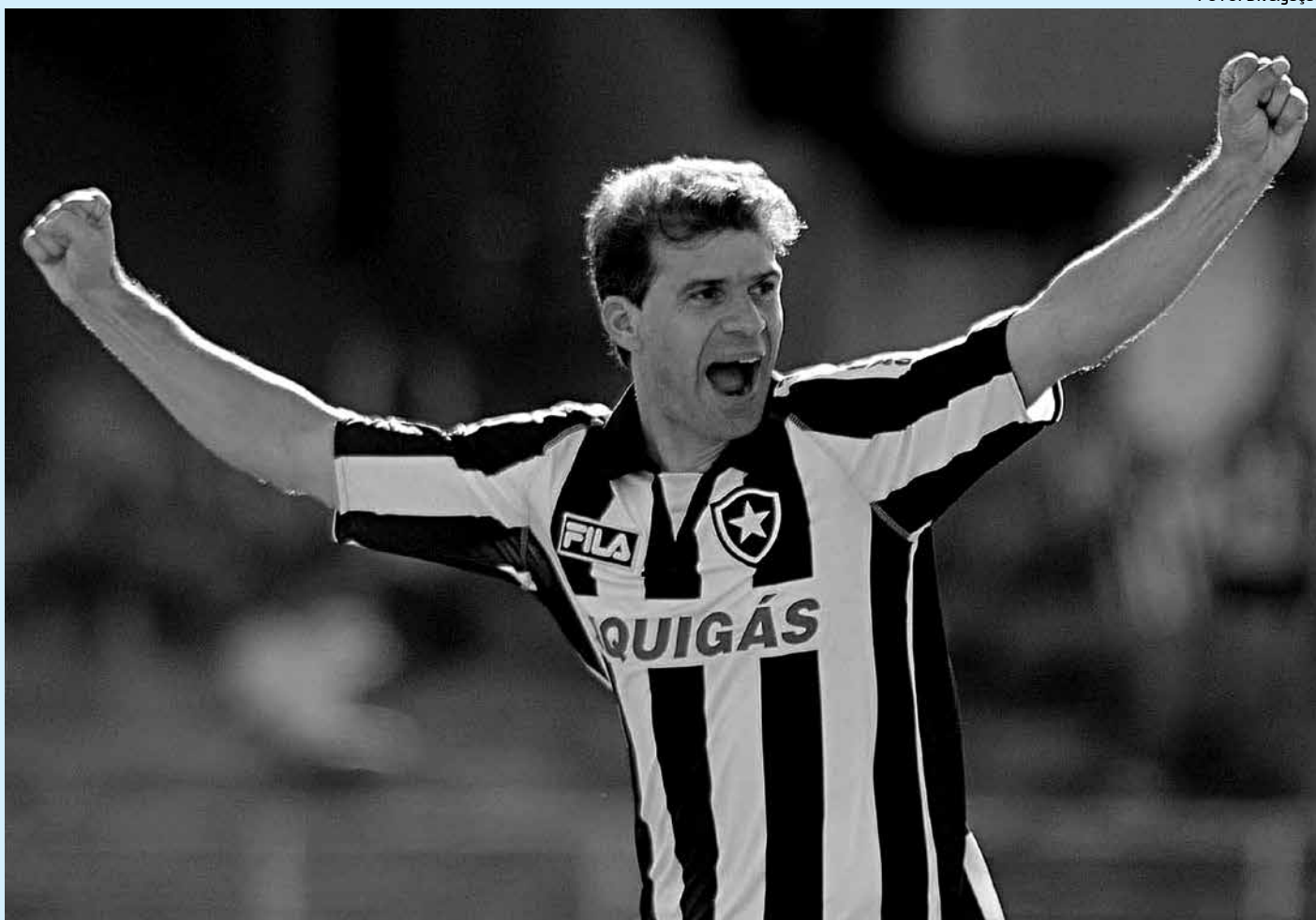
Túlio Maravilha foi artilheiro por todos os times por onde passou e vinha lutando para alcançar o tão sonhado gol 1.000