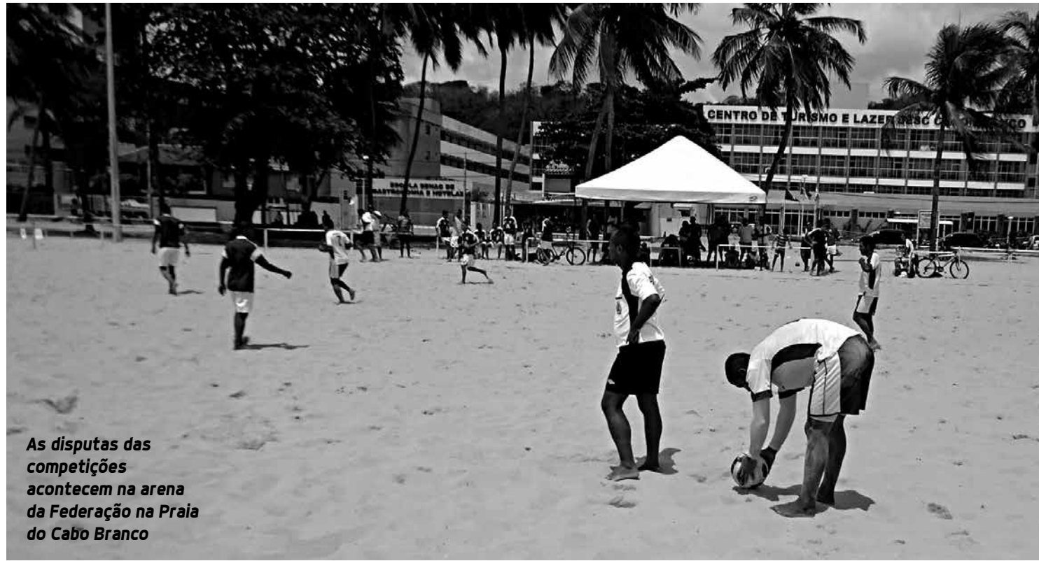
As disputas das competições acontecem na arena da Federação na Praia do Cabo Branco