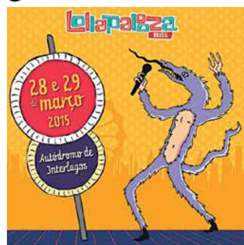
Arte do cartaz da edição 2015 do festival