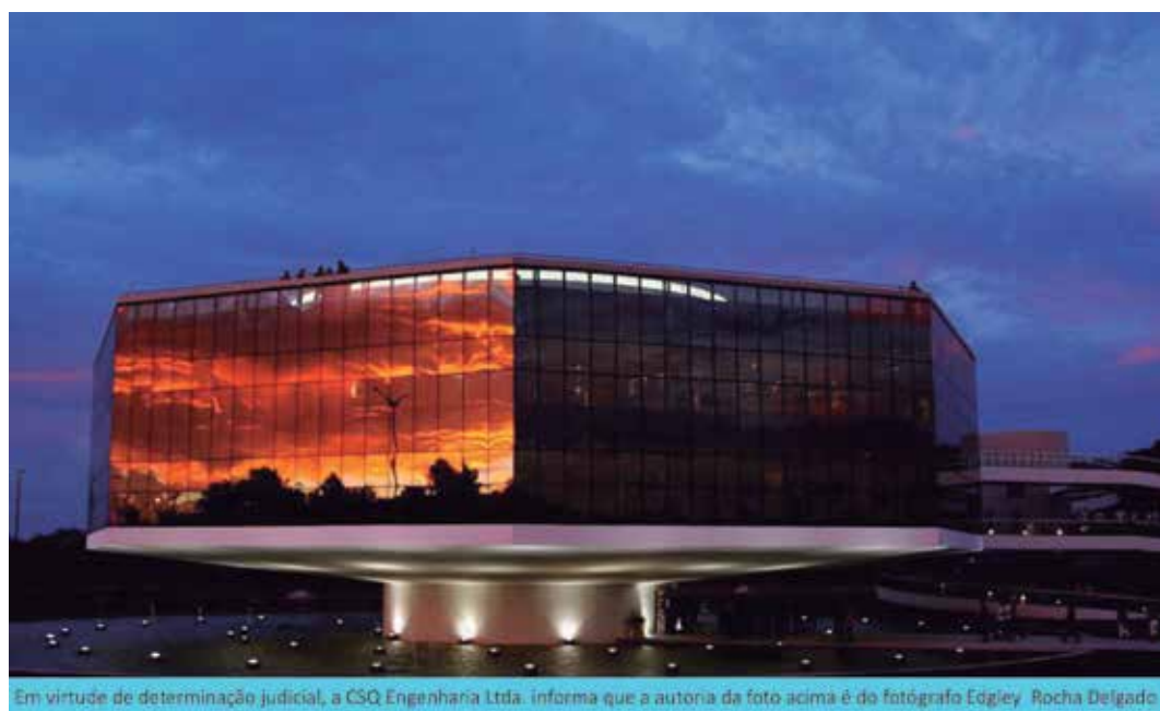
Em virtude de determinação judicial, a CSQ Engenharia Ltda. informa que a autora da foto acima é do fotógrafo Edgley Rocha Delgado.