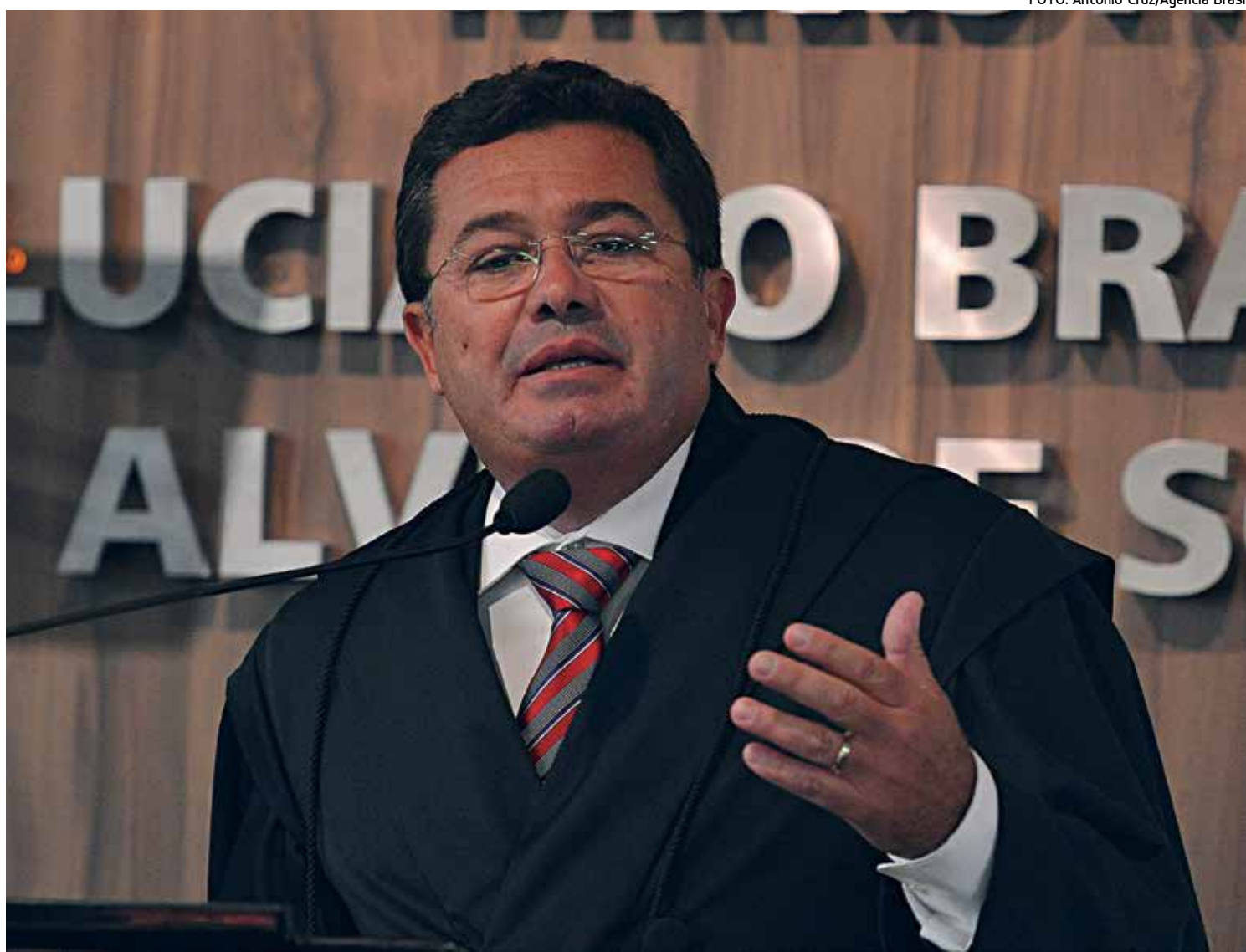
O ministro Vital do Rêgo, relator da matéria, disse que propostas de melhoria não modificam a apuração de irregularidades na estatal

Segundo o ministro Vital do Rêgo, relator da matéria, as propostas de melhoria não modificam a apuração de irregularidades constatadas em procedimentos licitatórios da Petrobras que já foram ou estão sendo objeto de ações de controle específicas, bem como a responsabilização dos gestores e das