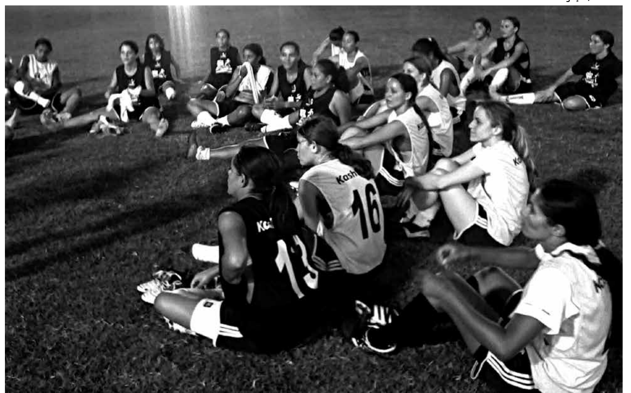
As atletas do Kashima começam as atividades deste ano com um amistoso na cidade de Bayeux amanhã

Por outro lado, a equipe de futsal do Kashima decide hoje, às 16h30, a Taça Paraíba de Futsal nas Comunidades. Vai enfrentar o time do Galáxi, de Cruz das Armas, em partida que ocorrerá na quadra esportiva do Bairro do Rangel, em João Pessoa. A competição reuniu 40 equipes de vários bairros de João Pessoa ao longo de três meses. A organização é do Núcleo Esportivo do Rangel.