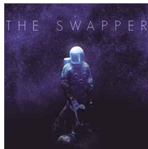
Jogo tem ambientação e roteiro futurista