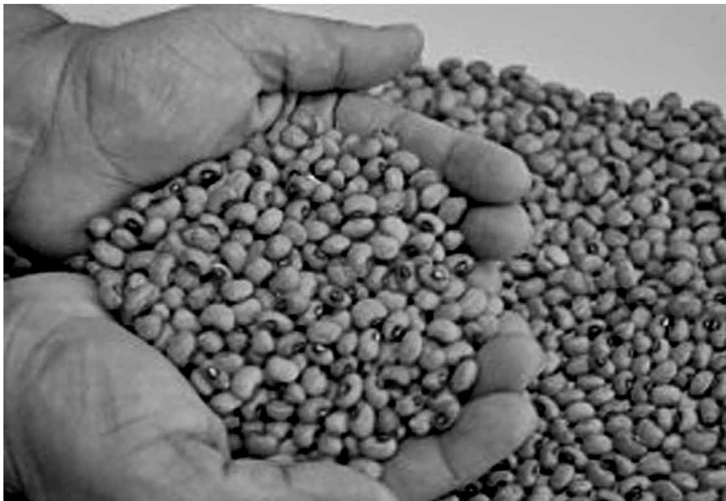
Ao todo serão distribuídos nesta safra 350 toneladas de milho; 250 de feijão macassar; 100 de feijão carioquinha (foto) e 60 de sorgo

O gerente executivo de Abastecimento da Sedap e presidente da Comissão do Programa de Distribuição de Sementes Certificadas,