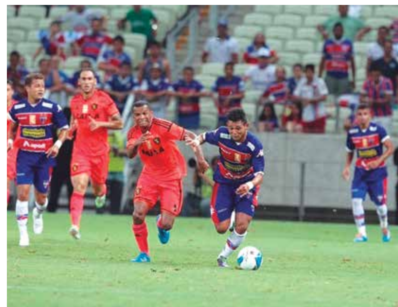
Fortaleza e Sport voltam a jogar amanhã na Ilha do Retiro

ção no ranking de público (3.340). Não por acaso, o confronto entre potiguares e baianos contabiliza média de só 2.911 testemunhas.