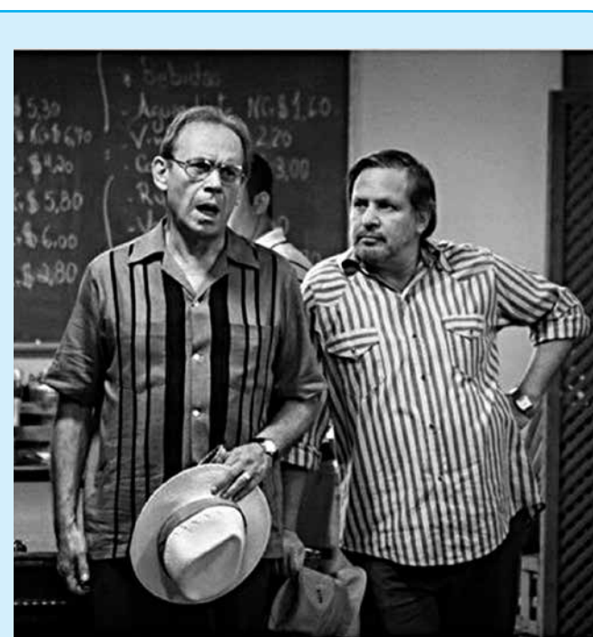
O saudoso José Wilker e Joaquim de Almeida

PARA SEMPRE ALICE (EUA 2015). Gênero: Drama. Duração: 101 min. Classificação: 12 anos. Direção: Richard Glatzer, Wash Westmoreland. Com Julianne Moore, Alec Baldwin, Kristen Stewart. A Dra. Alice Howland (Julianne Moore) é uma renomada professora de linguística. Aos poucos, ela começa a esquecer certas palavras e se perde pelas ruas de Manhattan. Ela é diagnosticada com Alzheimer. A doença coloca em prova a a força de sua família. Enquanto a relação de Alice com o marido, John (Alec Baldwin), fragiliza, ela e a filha caçula, Lydia (Kristen Stewart), se aproximam. Manairá1: 16h15 e 21h40 CinEspaço1: 14h10