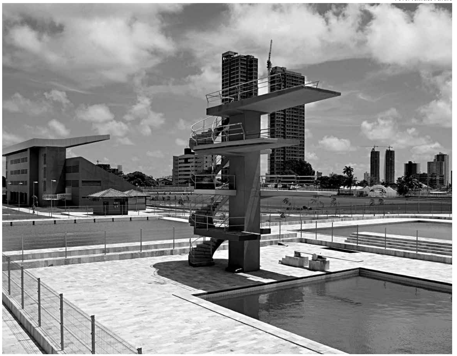
Além das piscinas e da pista de atletismo, a população vai poder praticar diversas atividades físicas na Vila Olímpica Parahyba