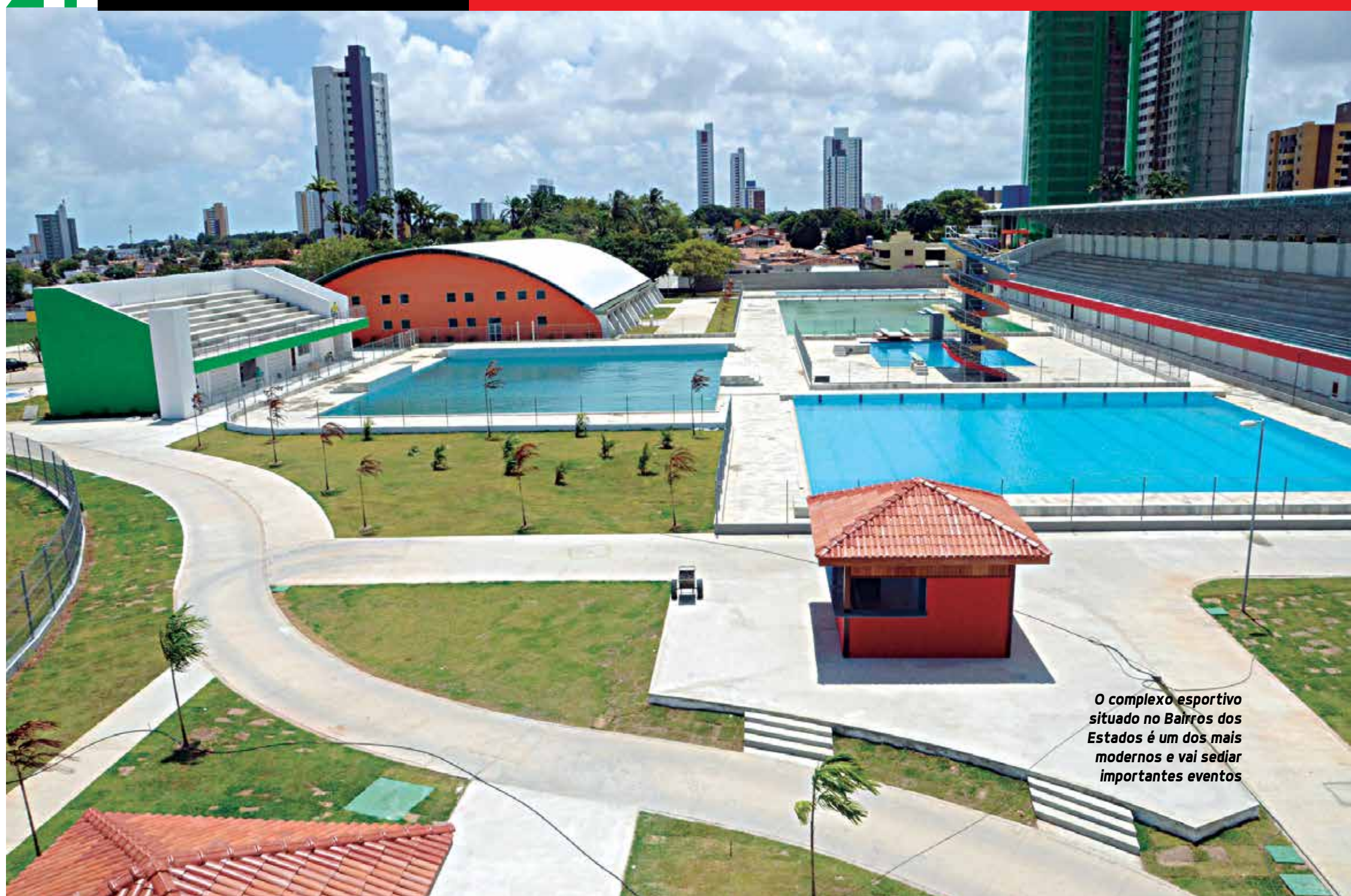
O complexo esportivo situado no Barros dos Estados é um dos mais modernos e vai sediar importantes eventos