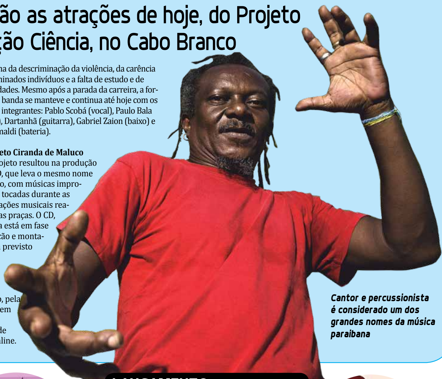
Cantor e percussionista é considerado um dos grandes nomes da música paraibana

O projeto resultou na produção de um CD, que leva o mesmo nome do projeto, com músicas improvisadas e tocadas durante as apresentações musicais realizadas nas praças. O CD, que ainda está em fase de gravação e montagem, está previsto para ser lançado no dia 21 de maio deste ano, pela internet, em uma plataforma de shows online.