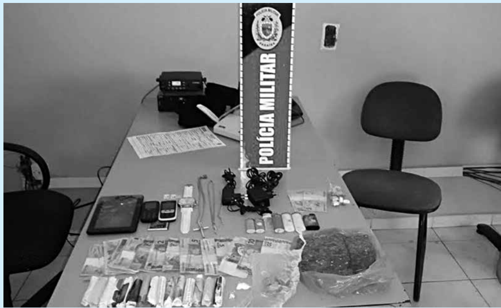
A maconha estava prensada e dividida em cigarros prontos para a venda; também havia crack

Com essa ação, a Polícia Federal busca refletir sobre o compromisso com a sociedade paraibana e demais órgãos de persecução penal no combate ao tráfico de drogas e crimes correlativos.