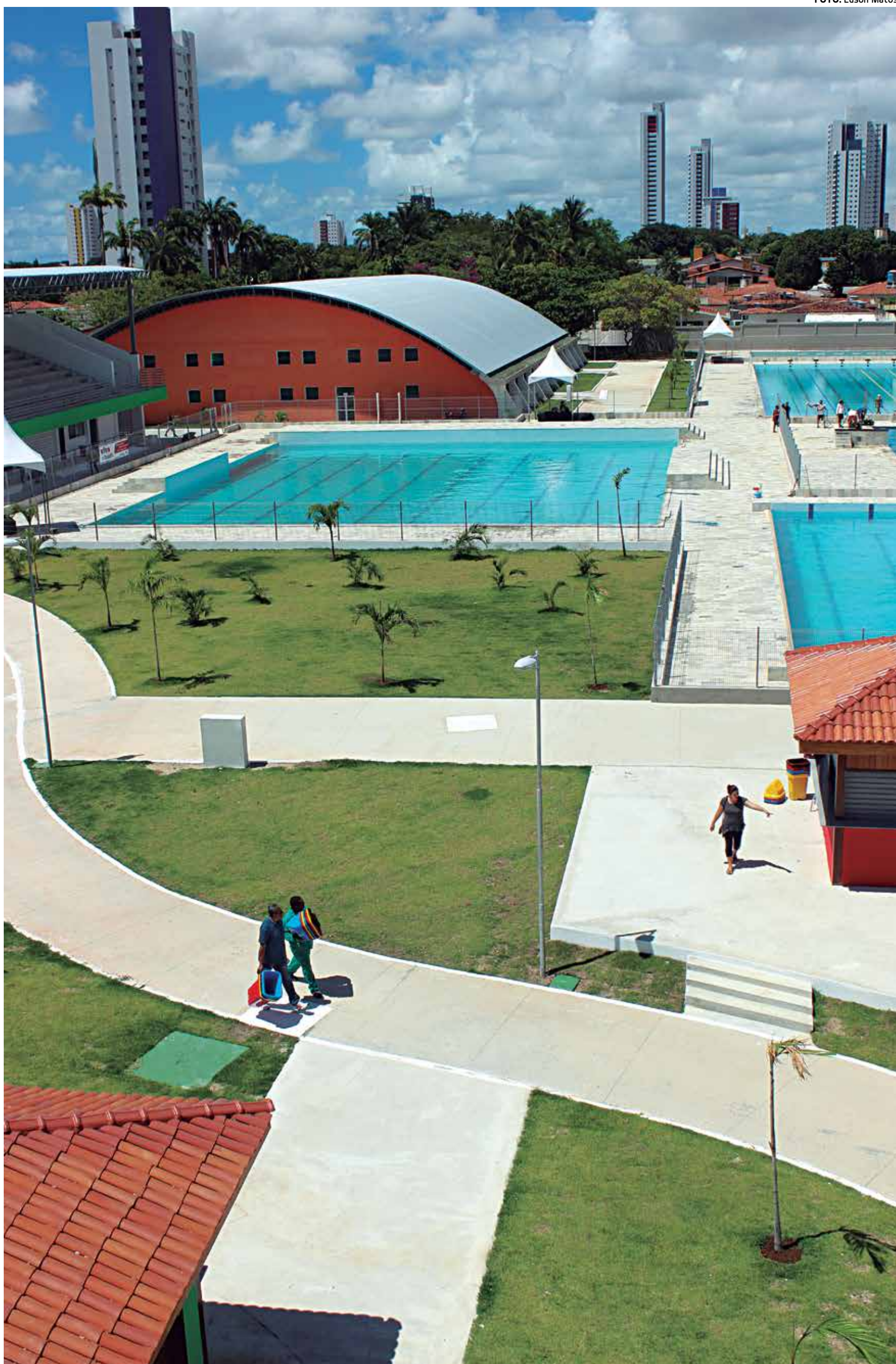
A Vila Olímpica Parahyba estabelece a partir de hoje no Estado um novo padrão nacional para as práticas esportivas

Programação começa às 6h com série de eventos. Ontem, convidados de expressão mundial, a exemplo de Vanderlei e Giba, chegaram para a inauguração. PÁGINAS 3, 21 E 22