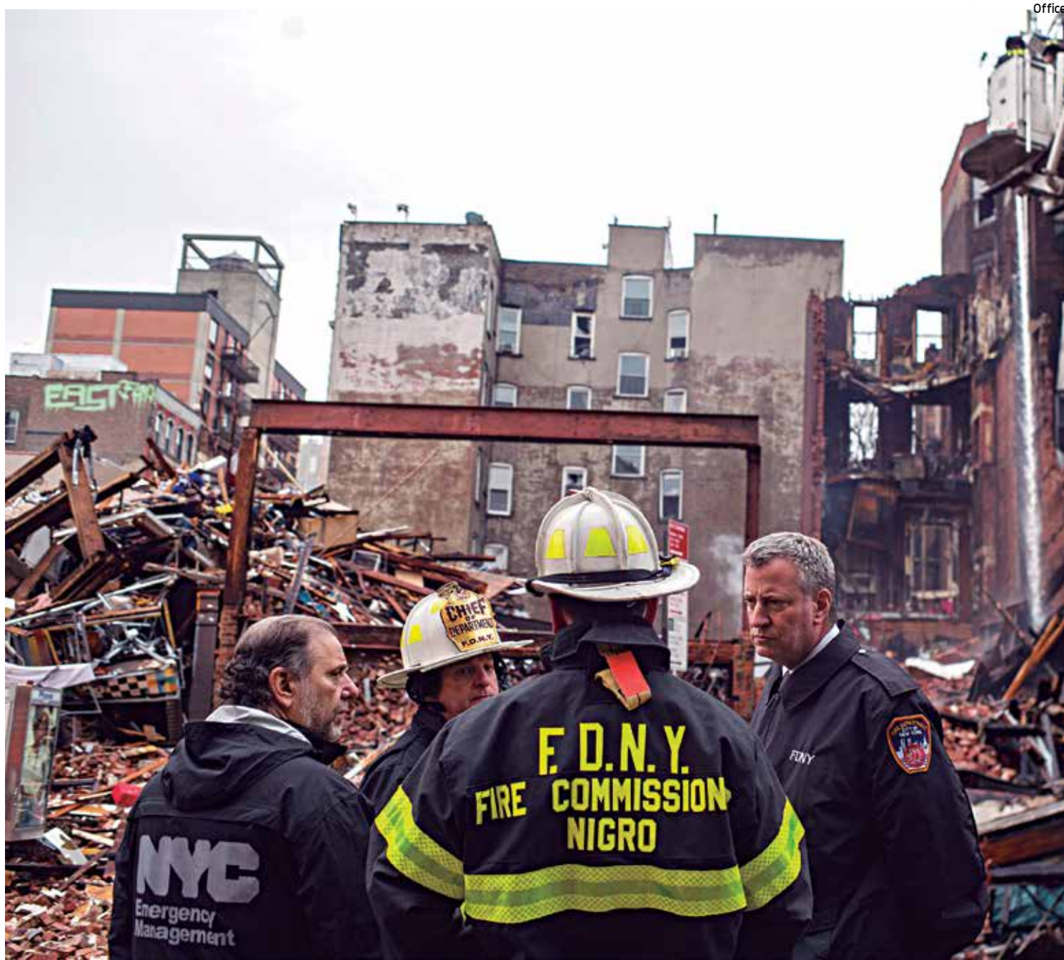
O prefeito de Nova York, Bill de Blasio, visitou o local onde um prédio desabou após explosão, que deixou 25 pessoas feridas

"Gaza é o resultado do fracasso da comunidade internacional. Já que os governos falharam, nós estamos buscando as pessoas e os movimentos sociais para pressionar os Estados a cumprir seus compromissos com a Palestina", disse.