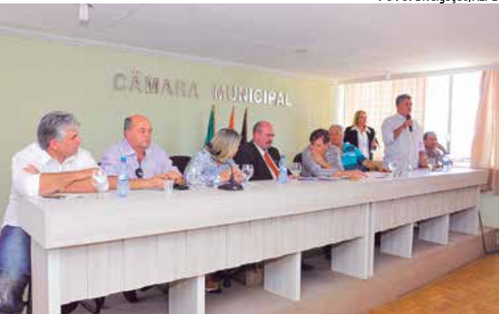
Deputados defendem medidas para amenizar os efeitos da seca