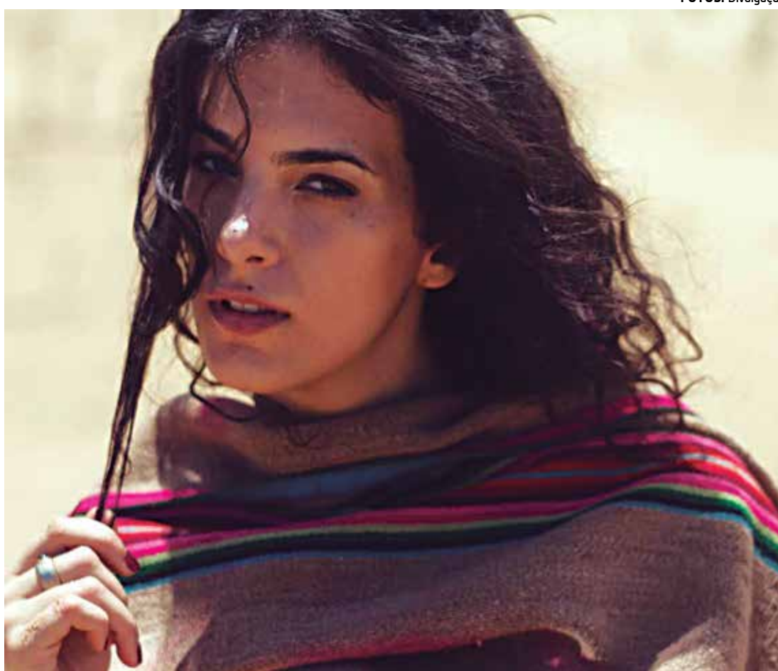
Cantora é reconhecida internacionalmente pela performance musical e a voz suave

Maria do Céu Whitaker Poças, ganhou projeção nacional e internacional no circuito da música em 2005, adotando o nome artístico Céu. Num estilo que une MPB, Bossa Nova e batidas eletrônicas, Céu conquistou as plateias do Brasil, de países da Europa e também dos EUA. Seu primeiro álbum, Céu, (2005, Warner Music) vendeu mais 150 mil cópias nos EUA e 500 mil no total. Ao longo da carreira ela coleciona 1 indicação ao Grammy e 3 indicações ao Grammy Latino e vários outros prêmios dentro e fora do Brasil.