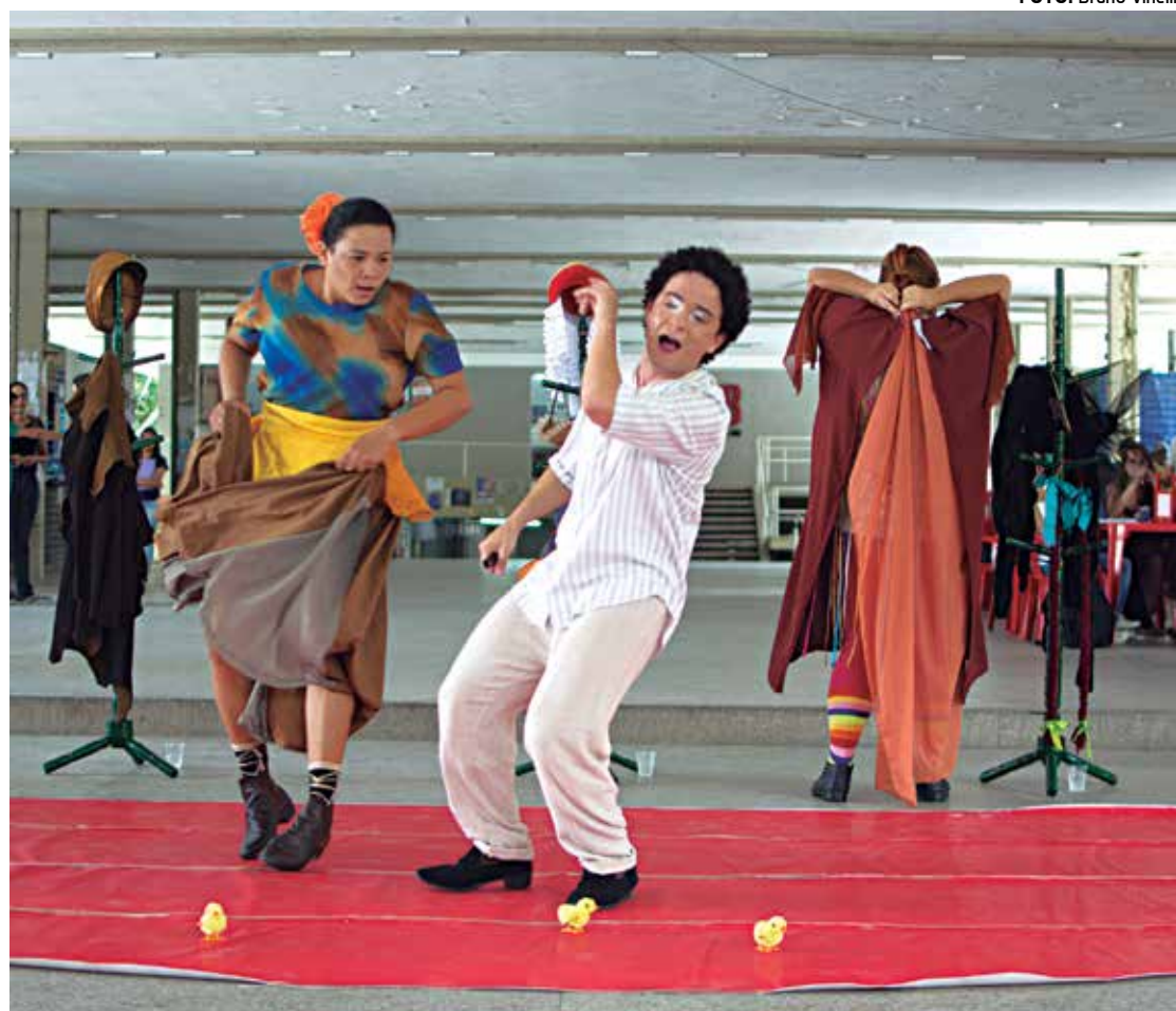
Peça é resultado de uma pesquisa que enveredou pela contação de histórias e poesias encenadas