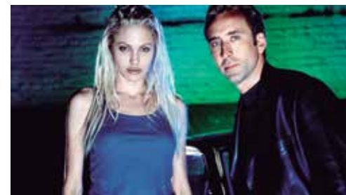
Angelina Jolie contracenava com Nicolas Cage