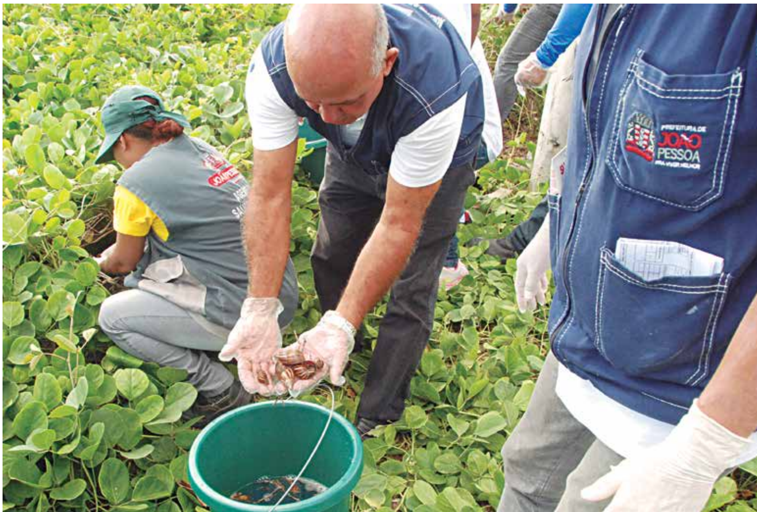
Agentes da Vigilância Ambiental fazem a catação do molusco e orientam a população sobre os perigos do manuseio indevido