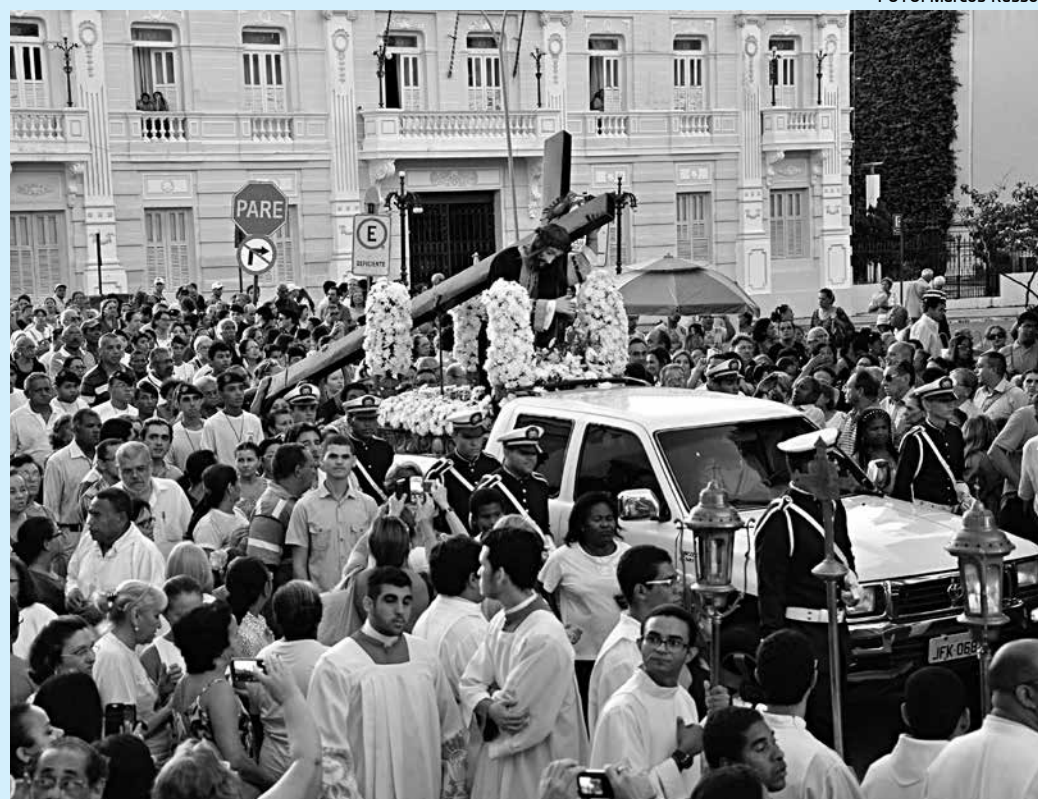
A procissão representa o encontro de Jesus com sua mãe, Maria, na via sacra percorrida por Cristo