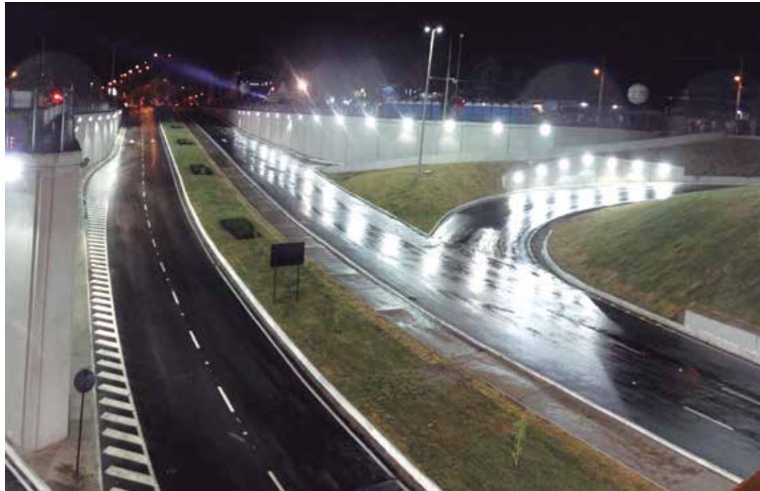
A fotografia registra o Trevo das Mangabeiras momentos antes de ser liberado ao tráfego