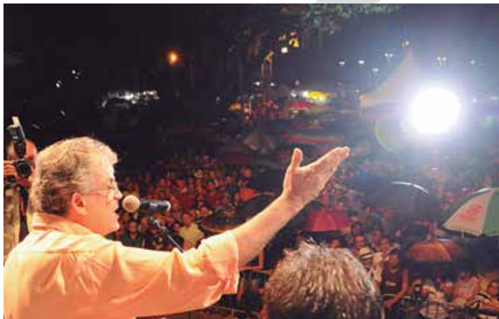
O governador Ricardo Coutinho em discurso emocionado ontem indicou o caráter histórico da obra que beneficia 200 mil pessoas