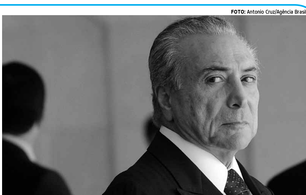
Vice-presidente da República criticou o número excessivo de partidos políticos no Brasil

Segundo o ministro do Planejamento, uma das ações que o governo pretende fazer para reduzir o déficit prevê a atuação nos chamados gastos obrigatórios da União. "(São) aqueles gastos que são determinados por lei. Qualquer atuação sobre aquele gasto necessita de uma proposta legal, de lei ou de emenda constitucional, ou seja, precisa ser construída com a sociedade e principalmente com o Congresso Nacional", afirmou. "Nós estamos trabalhando em propostas para melhorar gradualmente a situação fiscal do País", completou.