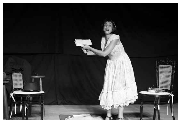
Cenas dos espetáculos "Rei arco íris" e "As cartas de Anayde", da Cia. de Teatro Soluar, que é idealizadora da iniciativa cultural

pela arte", disse ele, que espera o apoio de instituições para a estrutura do evento.