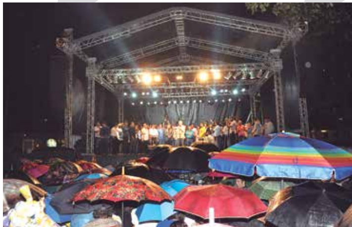
A multidão enfrentou a chuva para viver a emoção do evento de inauguração da obra. O investimento superou R$ 25 milhões