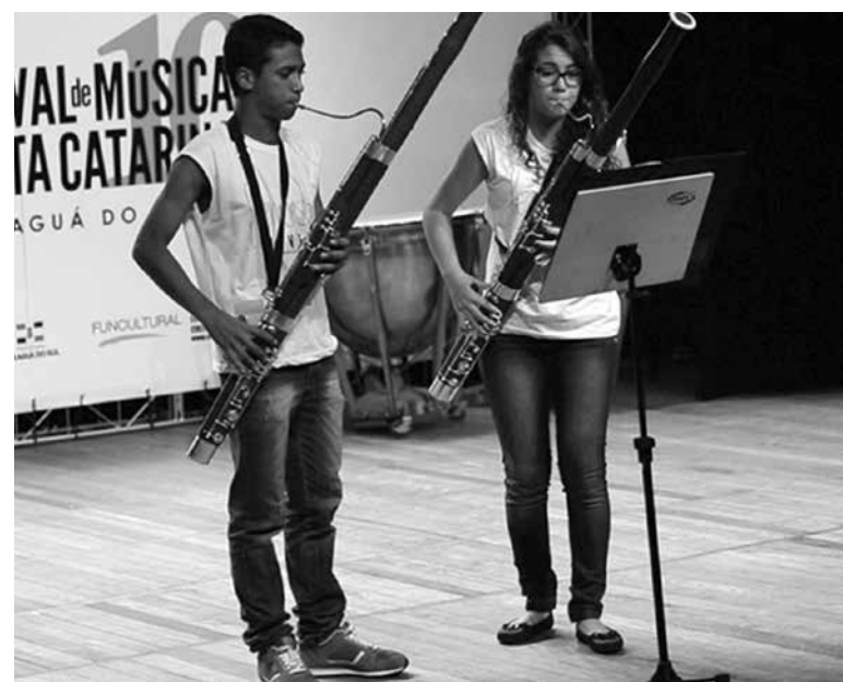
Seqüência de fotos em apresentações diversas retratam o Concerto oficial, o Concerto de Natal e participação no Festival de Música de Santa Catarina

de polos como Bairro dos Novais, Mandacaru, Cabedelo e Cajazeiras”, acrescentou “Para a apresentação em Brasília, no último sábado foi uma preparação de quatro meses, é um orgulho estar participando de um diálogo nacional, a Paraíba é um Estado que marca, durante a apresentação no Mapa Educação muita gente se emocionou com a apresentação dos jovens”, finalizou para a reportagem de A União .