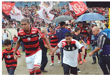
O Campinense Clube vive uma boa temporada e elevando o futebol da Paraíba

Além da questão financeira, tem também uma outra premiação que está mexendo com a cabeça dos dirigentes e torcedores. É que de acordo com o regulamento da Copa do Nordeste, caso a Raposa seja campeã, terá direito a uma vaga na Copa Sul-Americana. Se isto ocorrer, será a primeira vez que um clube paraibano chegará a esta Copa.