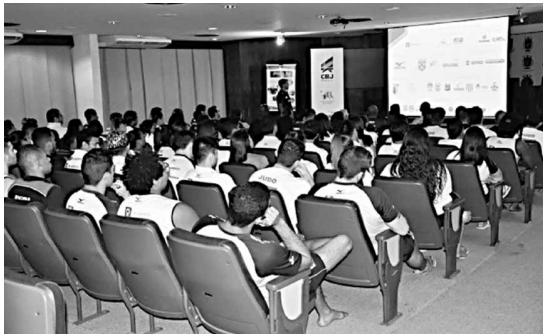
O treinamento de campo conta também com palestras e debates no Centro de Formação Física