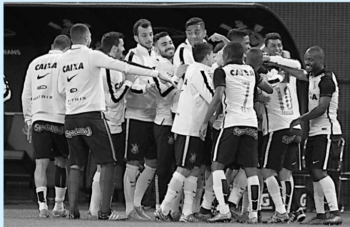
A equipe corintiana segue se reforçando com a contratação de jogadores milionários visando uma boa temporada este ano

"Agora é mudar a chave. Temos um jogo difícil diante do Fluminense e não se trata mais de quartas de final ou semifinal, mas, sim, de uma final. E final não se ganha só com a técnica, mas também com o coração, raça, e essa é a cara do Atlético-PR. Agora é focar completamente neste jogo de amanhã", afirmou.