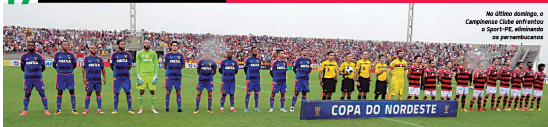
No último domingo, o Campinense Clube enfrentou o Sport-PE, eliminando os pernambucanos