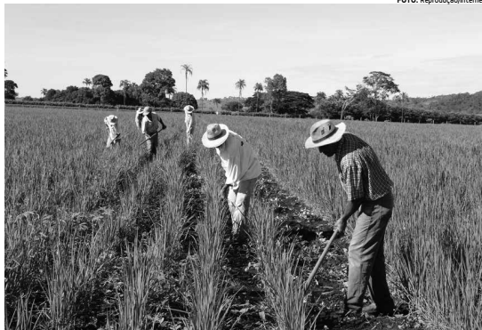
Agricultores familiares são contemplados com cursos de capacitação em várias regiões paraibanas

O processo de escolha e construção destas propostas contaram com o apoio e assessoria dos Nedets. No território do Seridó paraibano, citamos como exemplo a parceria entre Nedet e Fórum Territorial como fundamental para construção da proposta que irá fortalecer os vários grupos produtivos de mulheres do território. O projeto contempla o fortalecimento, através da aquisição de equipamentos, três cozinhas comunitárias e uma unidade de beneficiamento