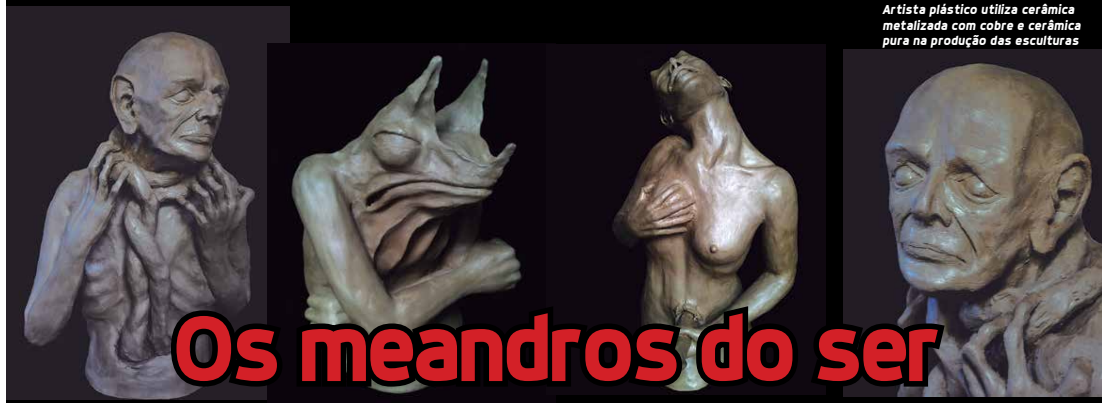
Artista plástico utiliza cerâmica metalizada com cobre e cerâmica pura na produção das esculturas