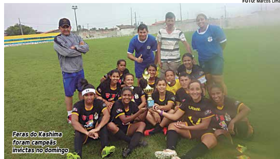
Feras do Kashima foram campeãs invictas no domingo