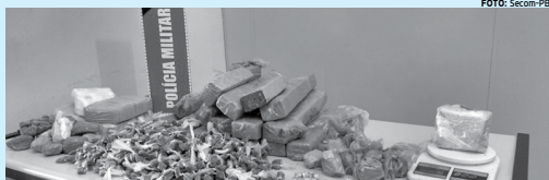
Maconha prensada, trouxinhas de crack, além de pasta base de coca e uma balança de precisão

A abordagem verificou que uma motocicleta que estava em poder dos suspeitos circulava com restrição de roubo. Durante a busca, foram encontrados a droga e outros produtos roubados.