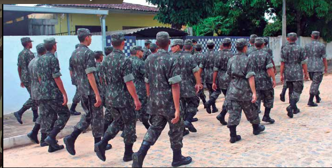
A Secretaria de Estado da Saúde concluiu ontem a capacitação de 210 militares do 16º Batalhão que vão atuar nas ações de controle do Aedes aegypti. PÁGINA 8