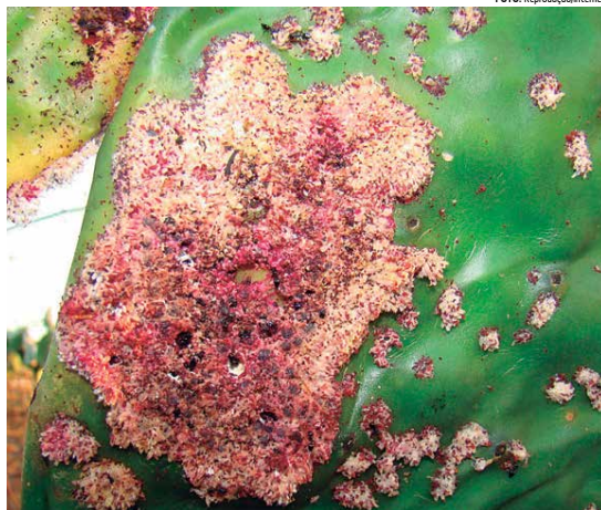
Cochonilha do Carmim tem atacado raquetes de palma forrageira de lavouras de várias regiões do Nordeste

Em um momento econômico onde os investimentos em pesquisa científica são reduzidos a cada ano, o financiamento coletivo mostra-se como uma alternativa viável. O pesquisador lembra que "cada vez mais a ciência tem se tornado colaborativa - conceito Citizen Science - onde pesquisadores colaboram junto à sociedade em questões relativas à pesquisa em larga escala. Assim, a população financeira diretamente agiu e acredita ter mais relevância e os cientistas podem trabalhar com mais independência, para chegar a resultados que beneficiem a sociedade como um todo".