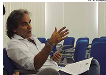
Vereador destacou incoerências dos deputados federais

O parlamentar acrescentou que não se justifica nem o voto daqueles que alegaram "dizer sim contra a corrupção" ou dizer que "vota sim, mas Cunha é corrupto". "Essas foram disparidades que