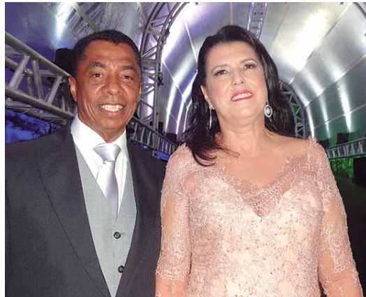
Deputado federal Damiano Feliciano e vice-governadora Lígia Feliciano, ela é a aniversariante de hoje

O edital está disponível para consulta no portal confap.orb.br e o prazo para submissão das propostas é 27 de junho deste ano.