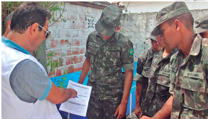
Capacitação para os militares do Exército no combate ao mosquito foi realizada pela SES-PB, na Vila Militar, na cidade de Bayeux

Ele adiantou que os militares que receberam a capacitação entraram em maio no processo de enfrentamento ao mosquito. "Hoje iniciamos