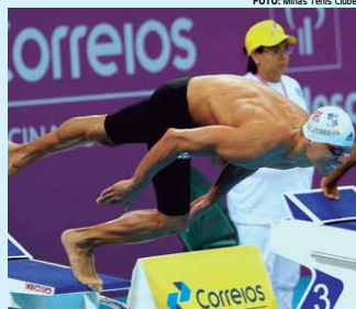
César Cielo obteve o tempo de 21s91 nos 50m livre