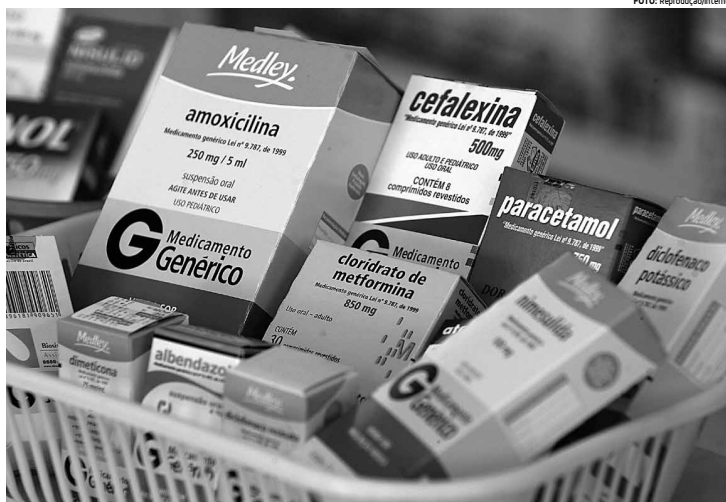
Medicamentos se destacaram no grupo Saúde e Cuidados Pessoais em pesquisa feita pelo Instituto Brasileiro de Geografia e Estatística

O grupo Saúde e Cuidados Pessoais teve a maior alta em abril depois de Alimentação e Bebidas (1,35%). Já Habitação registrou recuo (-0,41%), puxado pela queda na energia elétrica. Houve, por outro lado, elevação de 0,98% na taxa de água e esgoto, influenciada pelas Regiões