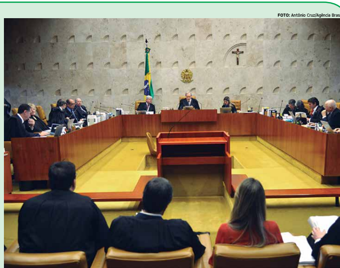
Os ministros decidiram adiar a análise para julgar em conjunto outras duas ações que chegam ao Supremo Tribunal Federal

Ressaltando que o MST foi um dos primeiros a criticar o segundo governo Dilma por sua política de ajuste fiscal, Stédile avaliou que, mesmo que consiga barrar o impeachment, o governo Dilma de 2014 e 2015 estará "acabado", dando lugar a um governo "Lula 3", no qual o ex-presidente terá papel central na formação de um novo gabinete de ministros e na implantação de uma nova agenda econômica.