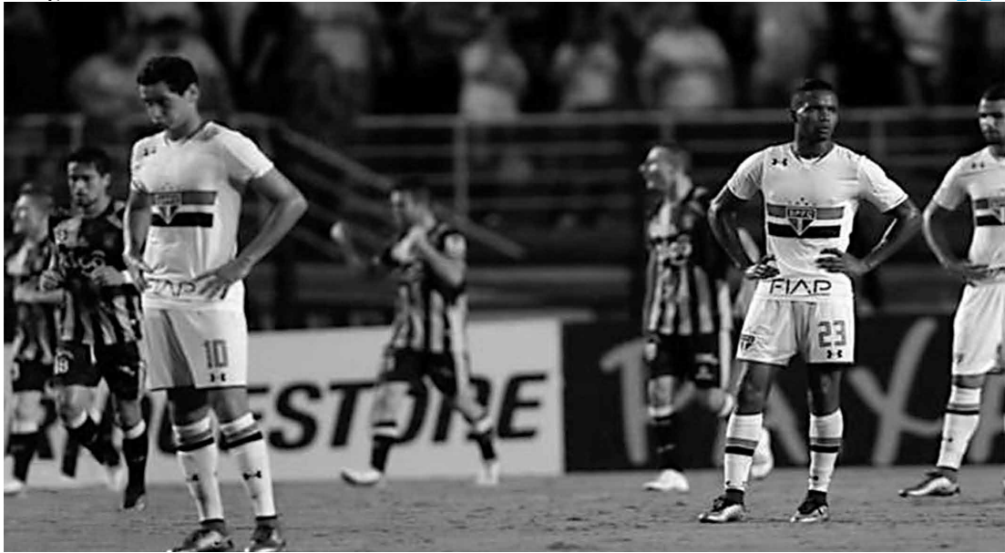
Time de Paulo Henrique Ganso precisa apenas de um empate na partida de hoje à noite, na Bolívia, para seguir na competição e continuar fazendo história entre equipes brasileiras na disputa