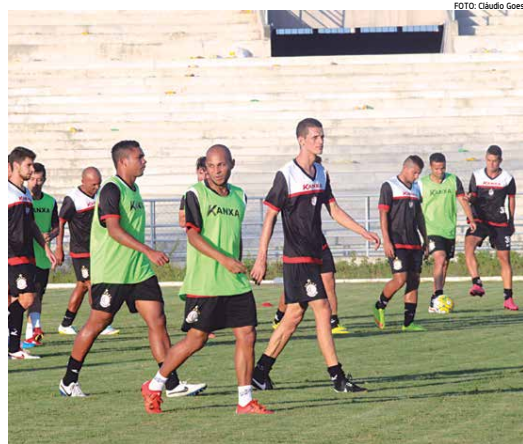
Campinense mantém ritmo acelerado de treino devido a sequência de jogos que vem disputando