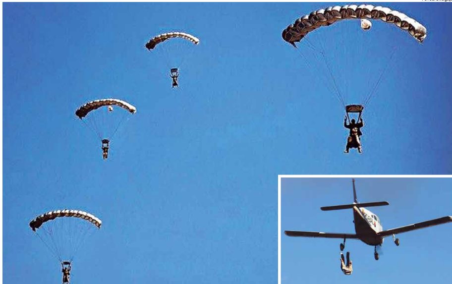
Como ocorre anualmente, os paraquedistas proporcionarão aos presentes momentos de muita adrenalina e descontração durante os seus saltos

Cada atleta fará três saltos numa tentativa de acertar o alvo de 10 centímetros