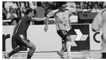
Falcão mais uma vez deverá brilhar com a Seleção Brasileira

A Seleção Brasileira de Futsal desembarca em Uberaba/MG, para a disputa do Desafio Sul-Americano de Futsal. A competição ocorre do dia 5 a 8 de maio, no Ginásio da Universidade.