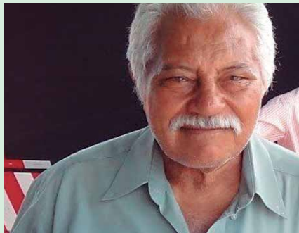
Cronista faleceu este ano e sempre ajudou o esporte amador na PB