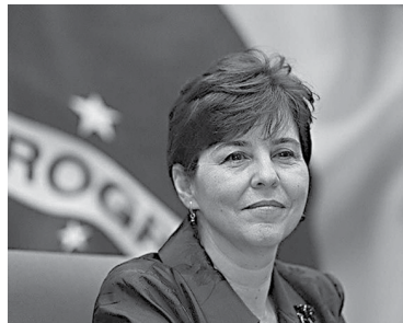
Tereza Campello é ministra do Desenvolvimento Social e Combate à Fome

Para que o Programa de Aprendizagem tenha resultados positivos, devemos investir na implantação de um sistema identificado com a modernidade e utilizando os recursos didáticos mais atrativos para esta clientela específica.