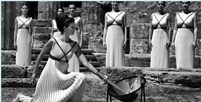
Durante ensaio da cerimônia, uma atriz acendeu a tocha usando o calor de um raio de sol refletido em um espelho parabólico