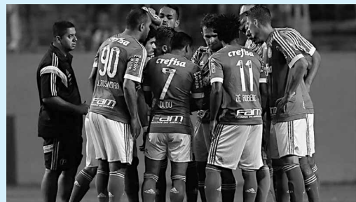
O Verdão terá jogadores de volta, no entanto não quer permanecer com eles no elenco

A ideia da diretoria é incluir alguns desses jogadores na negociação do Palmeiras com o Criciúma envolvendo a contratação do atacante Róger Guedes.