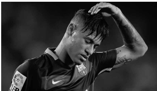
Atacante brasileiro deverá desfalcar seleção em partidas dos Jogos Olímpicos devido cansaço

Com oito pontos no Grupo 1 da Libertadores, o time está um à frente do adversário, que vem de derrotas para River Plate e Trujillanos, os mesmos rivais derrotados em sequência pelo Tricolor. Com um empate, o time assegura vaga nas oitavas, enquanto os donos da casa precisam de uma vitória simples para confirmar a passagem.