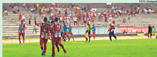
Santa Cruz e Auto Esporte fazem jogo no sábado que pode garantir as equipes na elite do futebol

"Não ganhamos nada ainda, e não estamos ainda na Primeira Divisão. O Auto Esporte está na mesma situação e vem para um jogo de seis pontos. Não podemos nos empolgar com a vitória sobre o Atlético. Os garotos têm de ter a mesma determinação para conseguir fazer o dever de casa. Já falei para os atletas que temos de ter os pés bem no chão, para alcançarmos nosso objetivo", afirmou. (L.M)