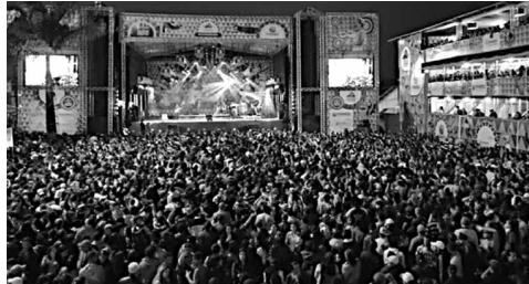
O evento reúne milhares de pessoas de todo o Brasil e até mesmo do exterior a cada edição

As atividades são divididas nas seguintes categorias: artes visuais, audiovisual, circo, cultura popular, dança, design e moda, fotografia, literatura, música, patrimônio cultural, teatro e formação cultural (com os temas artesanato, economia criativa, gestão cultural, produção cultural e comunicação e cultura digital).