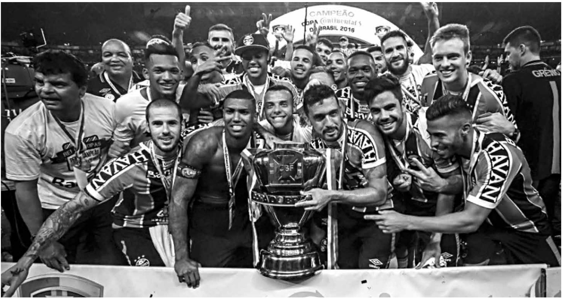
Jogadores do Grêmio comemoram a conquista da Copa do Brasil após o empate de 1 a 1 contra o Atlético Mineiro na última quarta-feira na Arena gaúcha

A próxima edição da Libertadores ainda terá a estreia da Chapecoense, que se classificou com o título da Copa Sul-Americana concedido pela Conmebol nesta semana. Ao todo, oito clubes brasileiros jogarão o campeonato continental em 2017.