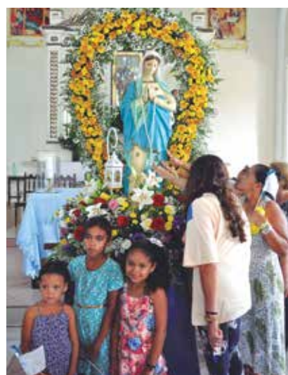
Missa de Nossa Senhora aconteceu no Varadouro; devotos de Iemanjá realizaram cerimônias na orla

Católicos e umbandistas celebraram ontem, com atividades na capital, o dia de Nossa Senhora da Conceição e de Iemanjá. PÁGINA 4