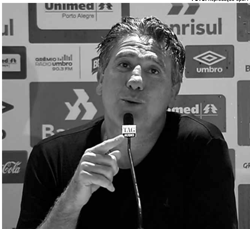
Renato Gaúcho diz que não caiu de paraquedas no seu retorno ao Grêmio

"Eu gosto de ser, às vezes, aquele Renato que foi na entrevista dessa quarta, mas infelizmente no nosso país algumas pessoas interpretam de maneira diferente. Você começa a fazer alguma brincadeira, que acho que é bom para o futebol, não só por parte do treinador, mas até por parte dos jogadores, porque o torcedor gosta disso, e muita gente interpreta mal, começa achar que é brincadeira, que não leva o futebol a sério, que não tem perfil para treinador, fica difícil. Eu gosto