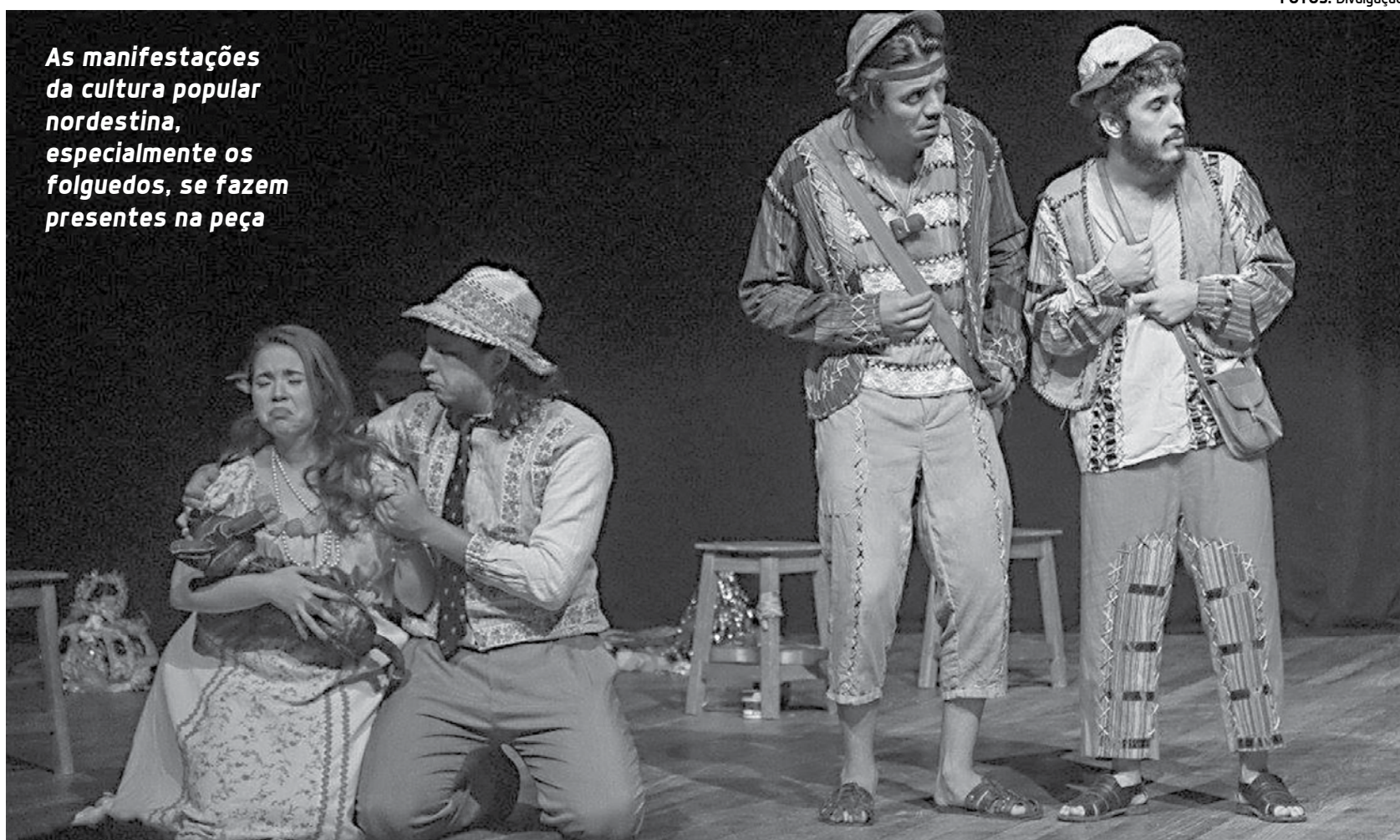
As manifestações da cultura popular nordestina, especialmente os folguedos, se fazem presentes na peça

“Nunca nos apresentamos na cidade de Taperoá, então o espetáculo é encarado como retorno, mas retorno do texto que foi escrito no local. Além disso, a ideia de se apresentar onde tudo começou é muito especial porque