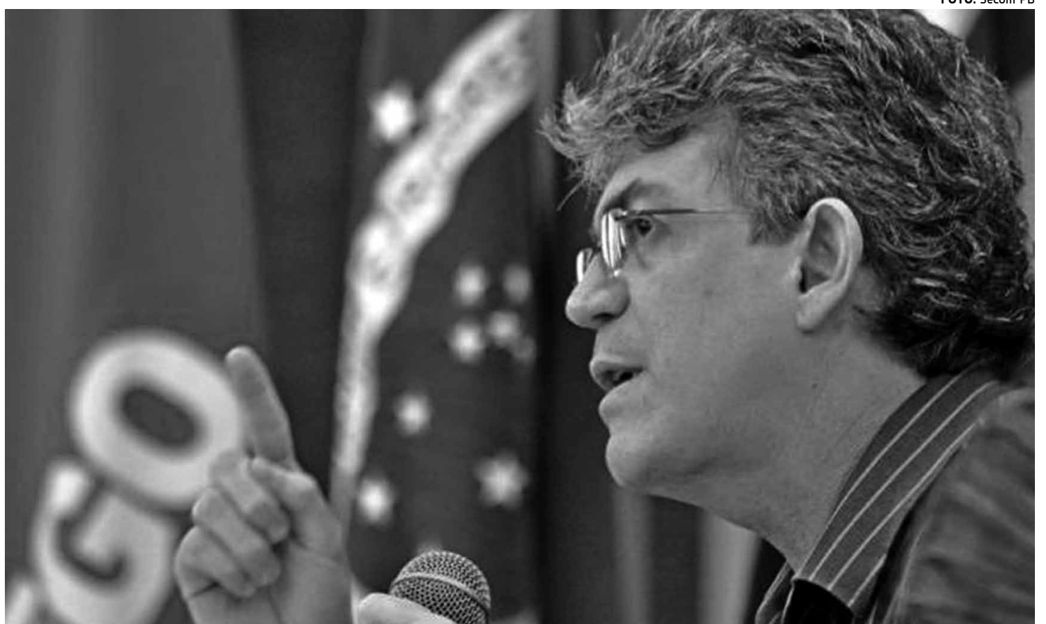
Governador Ricardo Coutinho fez o anúncio do pagamento da 5ª edição do Programa Abono Natalino por meio de sua conta no Twitter

Para ter acesso ao Abono Natalino é necessário que o beneficiário apresente documento como CPF, documento com foto como identidade e o Cartão do Bolsa Família que tem o Número da Inscrição Social.