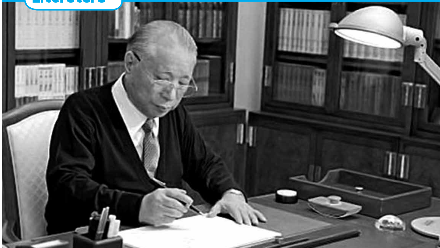
Daisaku Ikeda tem 88 anos e é uma das maiores personalidades mundiais na área da educação, além de escritor, poeta e filósofo budista