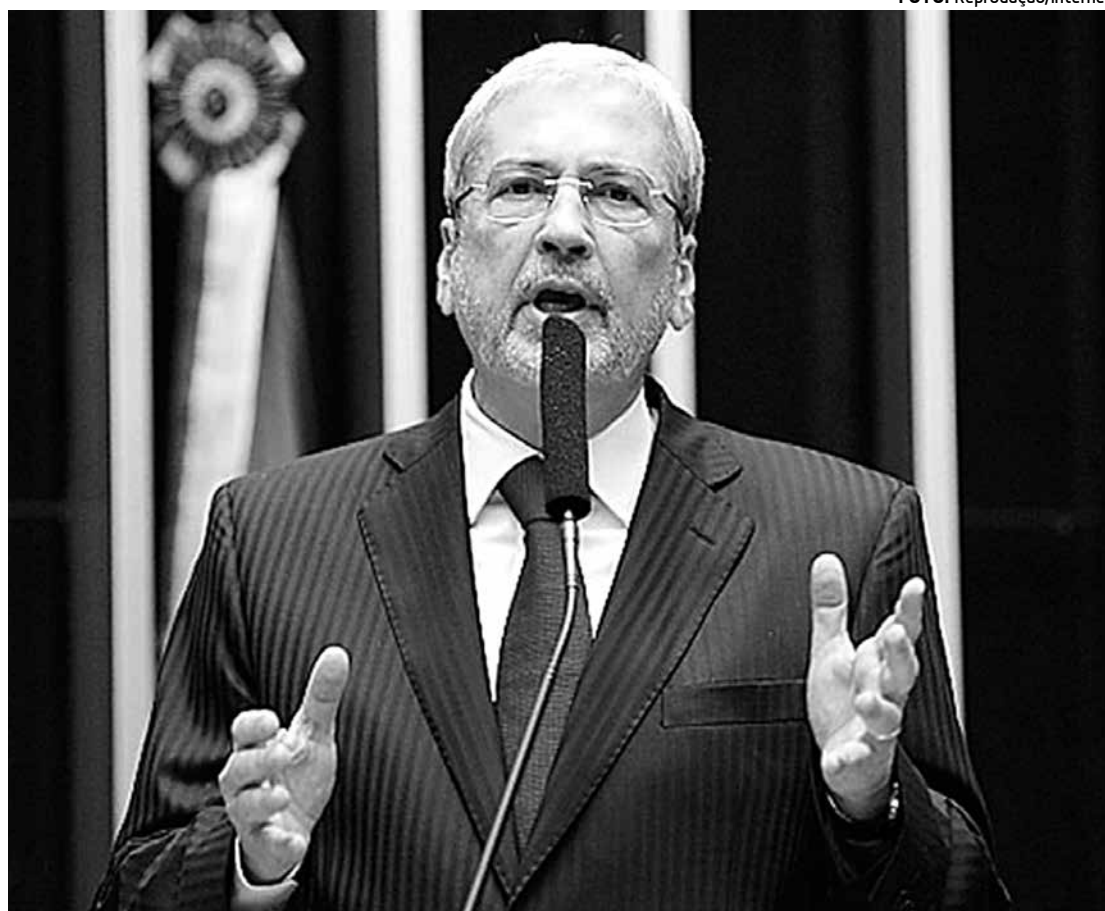
O novo secretário assumirá relação com movimentos sociais, papel do ex-ministro Gilberto Carvalho

Em sua nova configuração, a pasta vai cuidar, além da