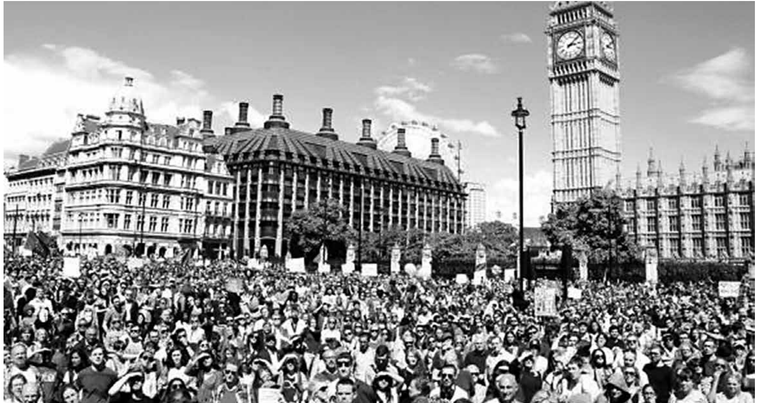
Em referendo histórico, 51,9% dos britânicos votaram a favor da saída do Reino Unido da União Europeia no dia 23 de junho de 2016

O governo entrou então com um recurso alegando que é o Executivo quem tem a prerrogativa de tomar as