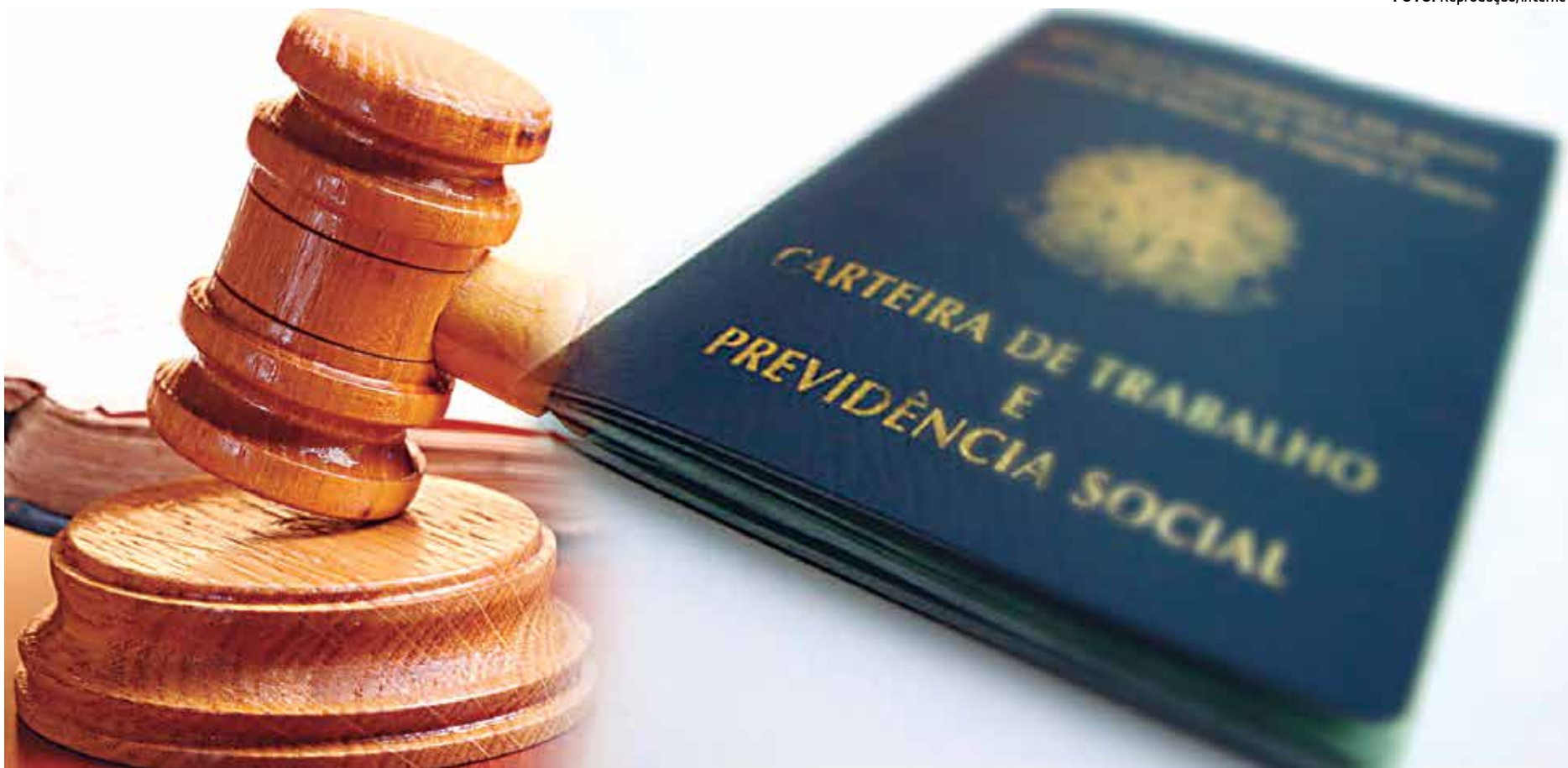
Volkswagen, que emprega 18 mil pessoas, é uma das empresas mais acionadas na Justiça, com cerca de 30 mil processos; em seguida vêm BB, Bradesco, CEF, Itaú/Unibanco e Santander

Com telefonemas para a residência, envio de e-mails, presença nas portas das fábricas e distribuição de panfletos, esses escritórios argumentam que sempre há formas de ganhar uma ação, ainda que