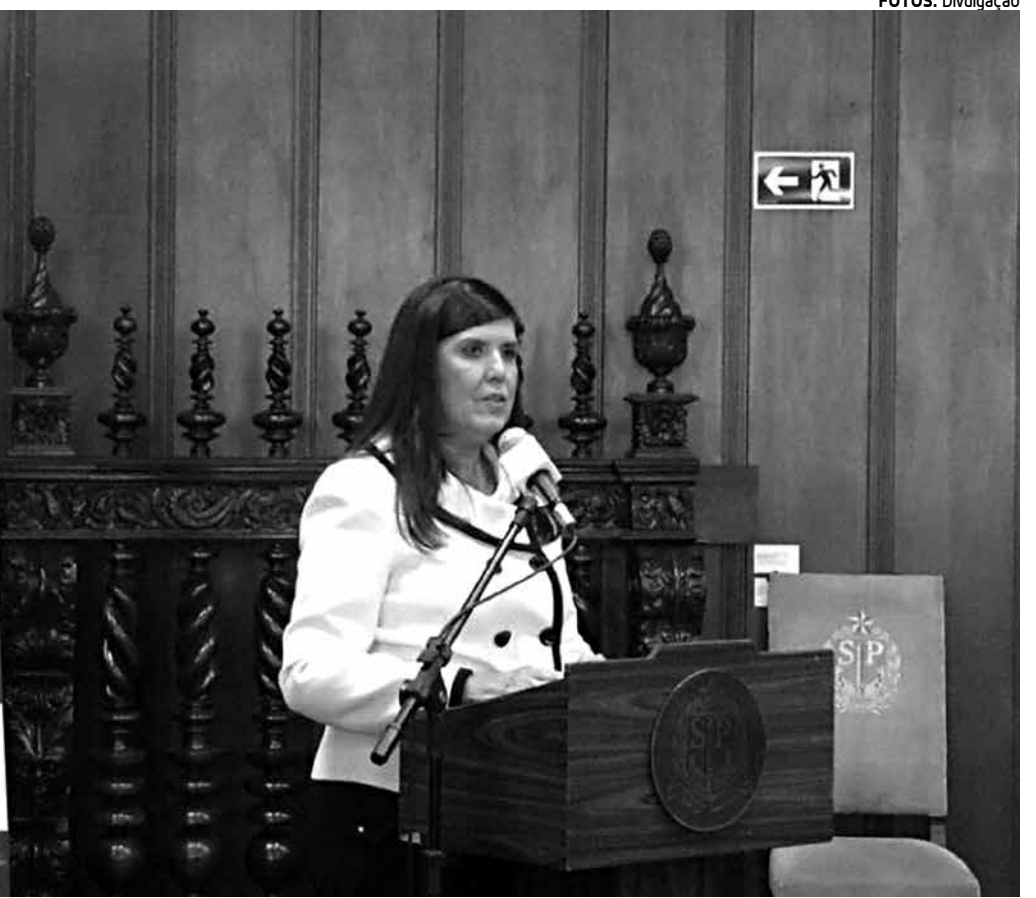
Vice-governadora Lígia Feliciano, ontem, durante a assinatura de cessão de uso não onerosa com o Governo do Estado de São Paulo