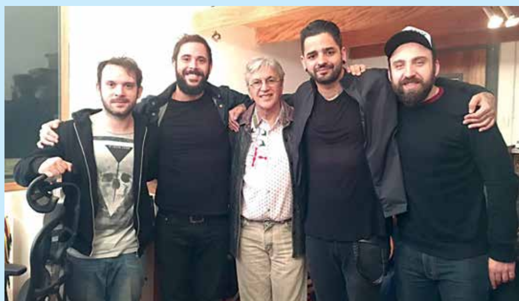
Os integrantes da banda Fresno com Caetano Veloso, que faz parte desta parceria