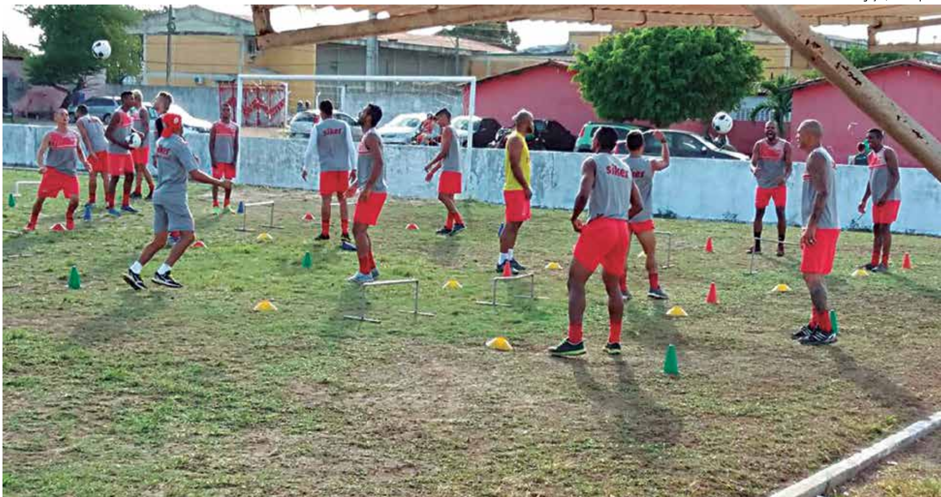
Jogadores em treino com bola no Mangabeirão. Os preparativos seguem acelerados visando as disputas do Campeonato Paraibano que começa na primeira semana de janeiro

"Os jogadores conseguiram por em prática o que nós treinamos. Claro que faltam alguns ajustes ainda, sobretudo na parte ofensiva, onde apresentamos mais falhas. Esperamos