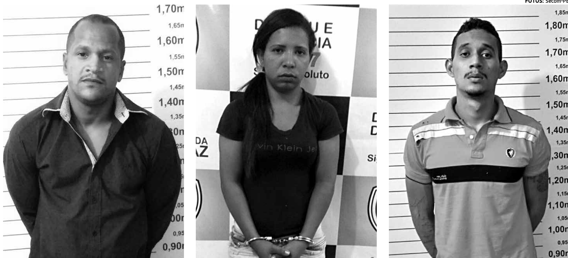
Trio suspeito de integrar quadrilha especializada em explosões a caixas eletrônicas foi encaminhado à Delegacia de Roubos e Furtos de Campina Grande

Os veículos eram então adulterados e vendidos por R$ 7 mil ou R$ 8 mil