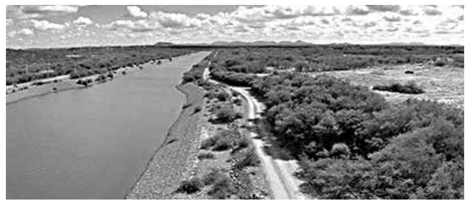
Equipamento cedido consiste em quatro conjuntos de potentes bombas flutuantes

O equipamento cedido consiste em quatro conjuntos de bombas flutuantes, cada um com capacidade de bombear até 2.000 litros de água bruta por segundo, e será levado ao canteiro de obras do Projeto São Francisco, em Floresta (PE) para ser instalado dentro do reservatório de Braúnas, onde as bombas vão elevar as águas do São Francisco para abastecer o próximo reservatório, de Mandantes, no mesmo município. A previsão é de que esse procedimento acelere o caminho da água e encurte em até 30 dias a chegada das águas ao município de Monteiro, primeira cidade paraibana a ser beneficiada. De Monteiro, as águas seguirão pelo