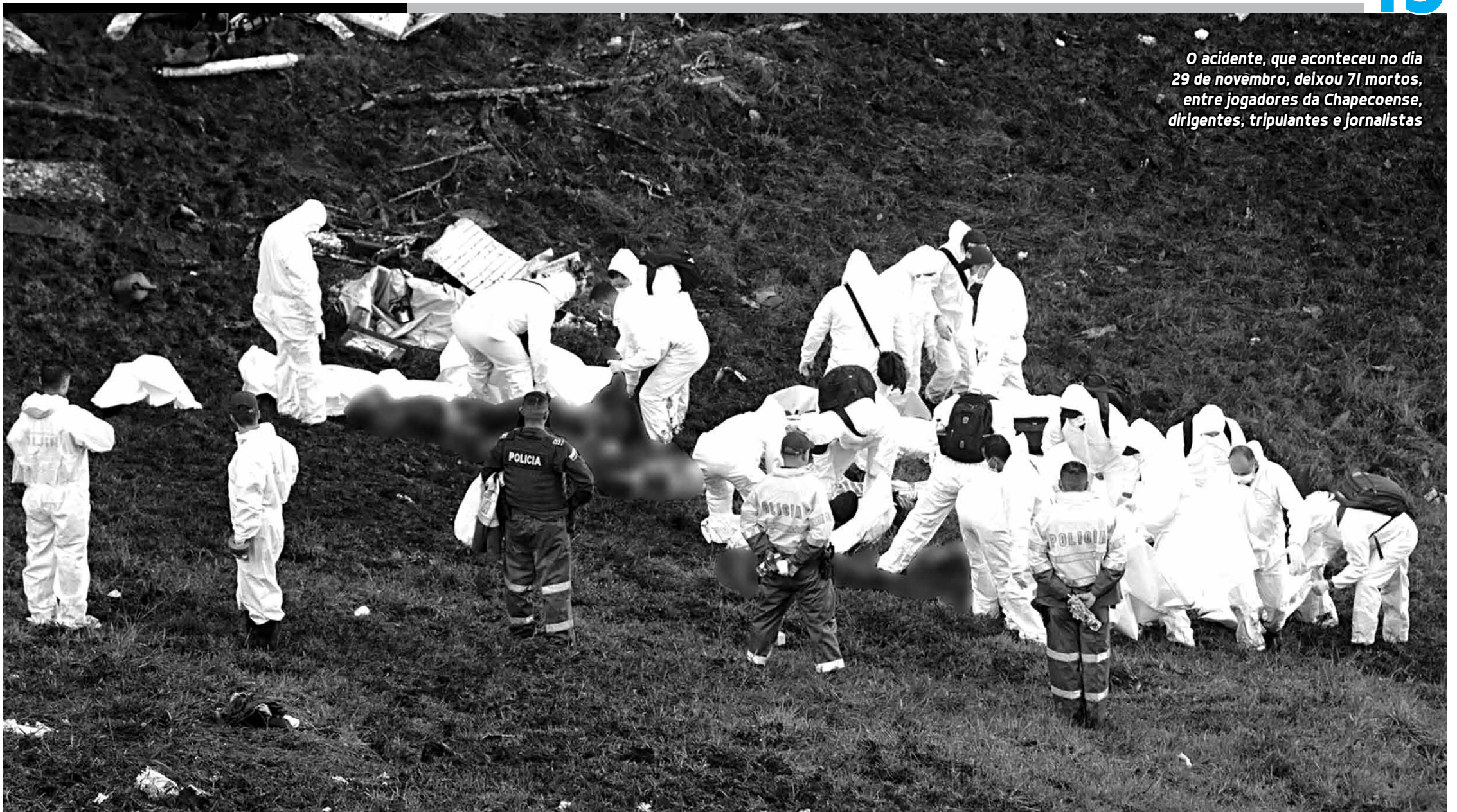
O acidente, que aconteceu no dia 29 de novembro, deixou 71 mortos, entre jogadores da Chapecoense, dirigentes, tripulantes e jornalistas