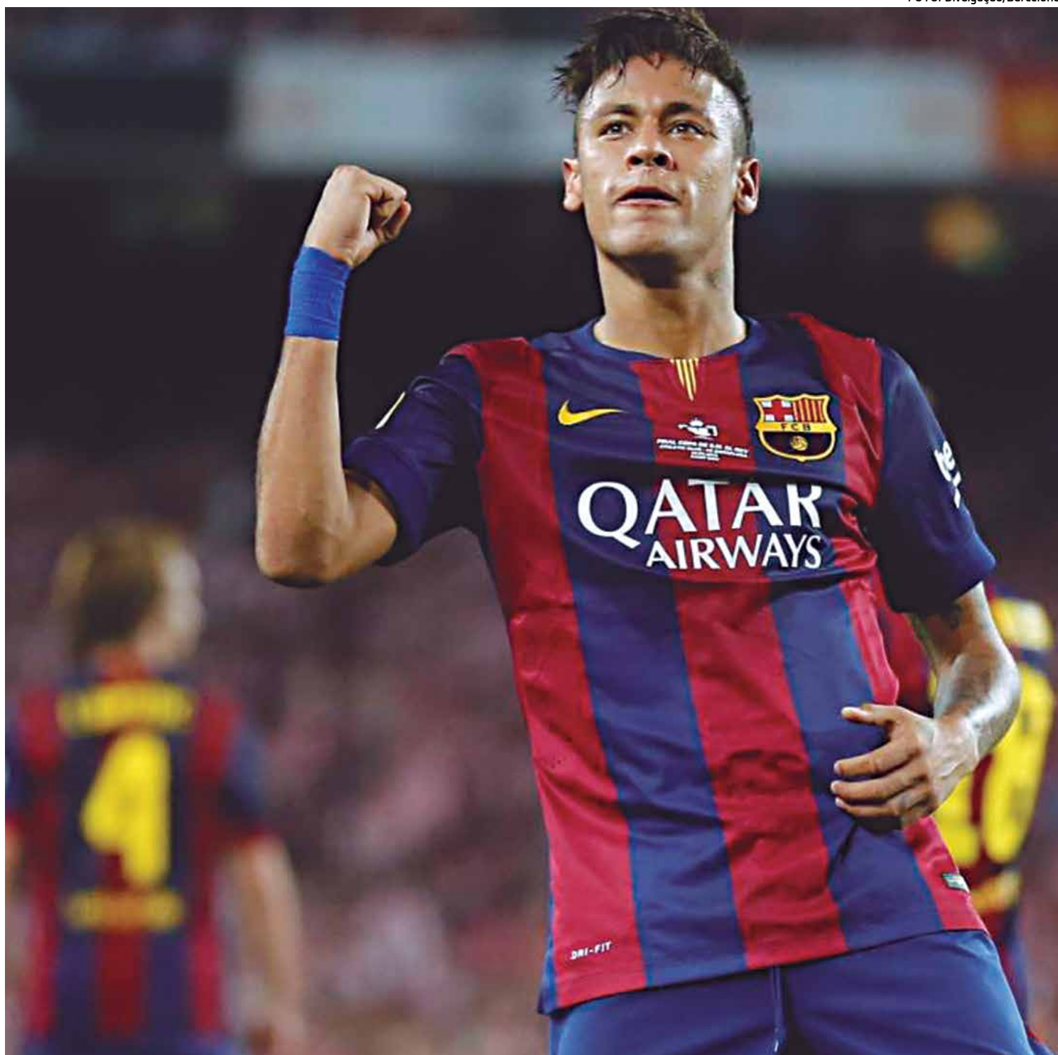
Neymar aceitou o convite de Zico e prestigiará o jogo das estrelas que fará homenagens as famílias das vítimas da tragédia com a Chape