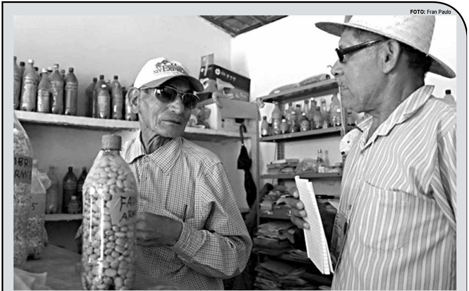
Agricultor guarda semente a fim de protegê-la da contaminação por transgênico e do risco de desaparecimento

"Se o produto entrar em promoção ou liquidação depois que a compra foi efetuada, o valor a ser considerado na troca deve ser o que foi pago pelo cliente. O lojista não pode trocar por outro produto de valor inferior."