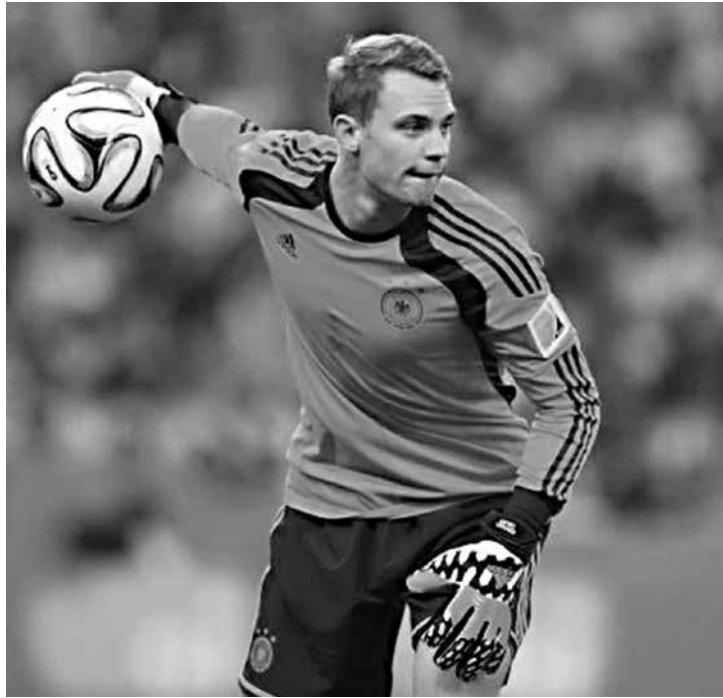
Goleiro Neuer faz grande sucesso no Bayern e na Seleção Alemã

O goleiro alemão Manuel Neuer ganhou mais um troféu para sua coleção. Com o final do ano, a Federação Internacional de História e Estatística do Futebol (IFFHS) elegeu o camisa 1 do Bayern de Munique e da seleção da Alemanha como o melhor goleiro do mundo. O jogador conquistou o prêmio pelo quarto ano consecutivo.