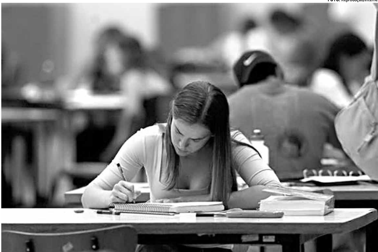
Estudantes devem renovar contratos do Fies a cada semestre e o pedido de aditamento é realizado pelas instituições de educação superior

“Quem procurou os agentes financeiros e não conseguiu fazer o aditamento na semana passada pode se dirigir novamente às instituições financeiras, porque os gargalos já foram todos solucionados”, disse. O FNDE, órgão vinculado ao MEC e responsável