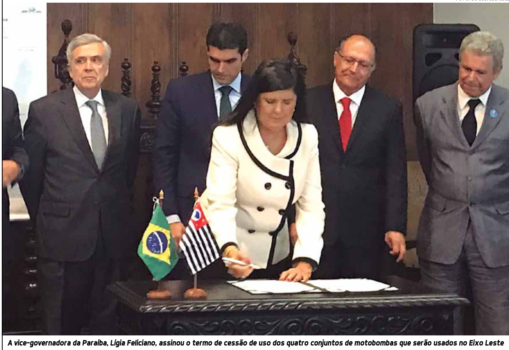
A vice-governadora da Paraíba, Lígia Feliciano, assinou o termo de cessão de uso dos quatro conjuntos de motobombas que serão usados no Eixo Leste

EM NOVEMBRO Governo Central registra o pior déficit desde 97