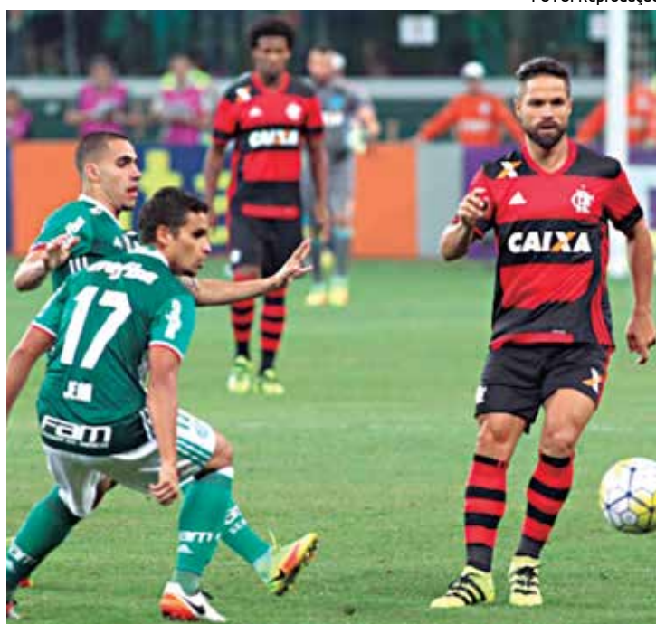
Palmeiras e Flamengo com mais exposição de jogos na TV aberta