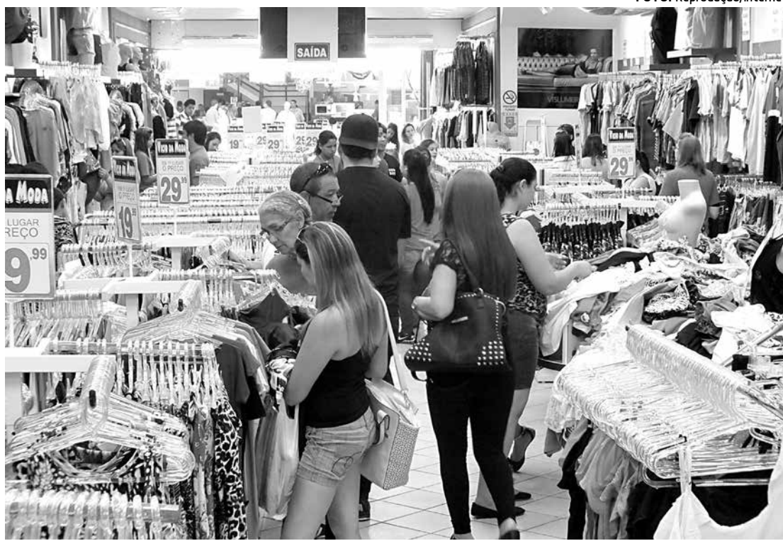
Em caso de reclamações, o consumidor deve procurar primeiro o vendedor ou o fabricante