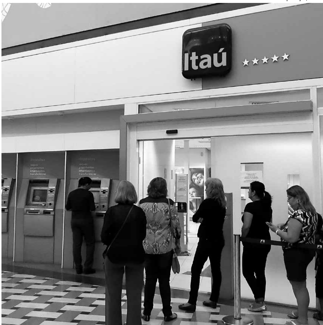
Número de queixas contra os serviços do Itaú, em dezembro, superou as 537 ocorridas em novembro

O Bradesco manteve a segunda colocação no ranking de queixas em dezembro. A instituição recebeu 647 reclamações consideradas procedentes, o que levou o banco a receber 8,39 pontos, ante 9,17 pontos re-