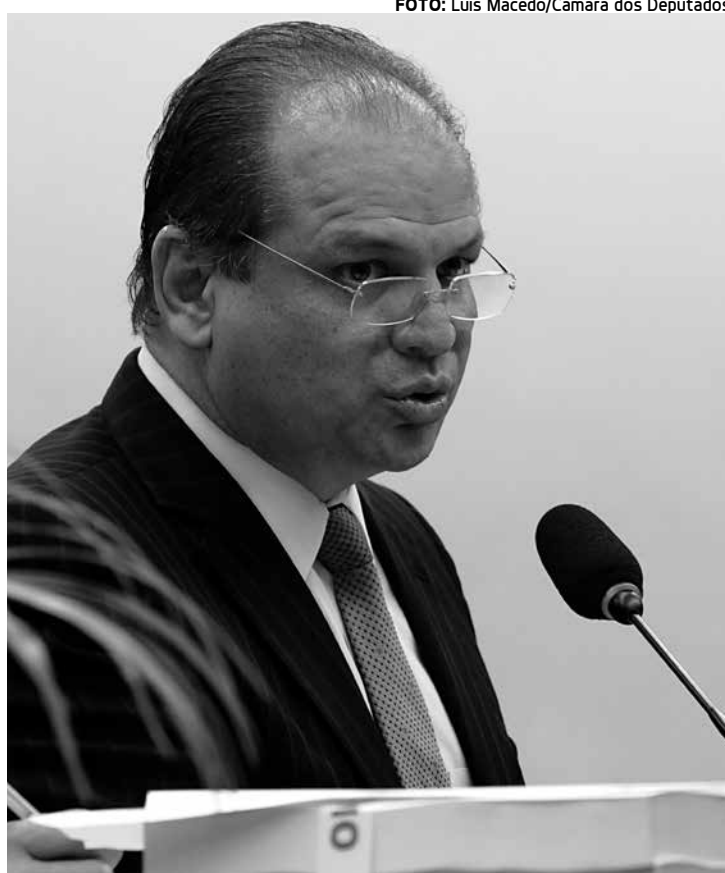
Relator prevê necessidade de contingenciamento de R$ 100 bilhões

Uma das maiores esperanças do governo está na arrecadação advinda da regularização de ativos de brasileiros no exterior não declarados ao Fisco, sancionada na quinta-feira, 14, por Dilma. O orçamento prevê um aumento de receita de R$ 21 bilhões com a "janela" que deve vigorar de março a outubro deste ano, embora especialistas, que consideram o cálculo do governo conservador, dizem que a arrecadação