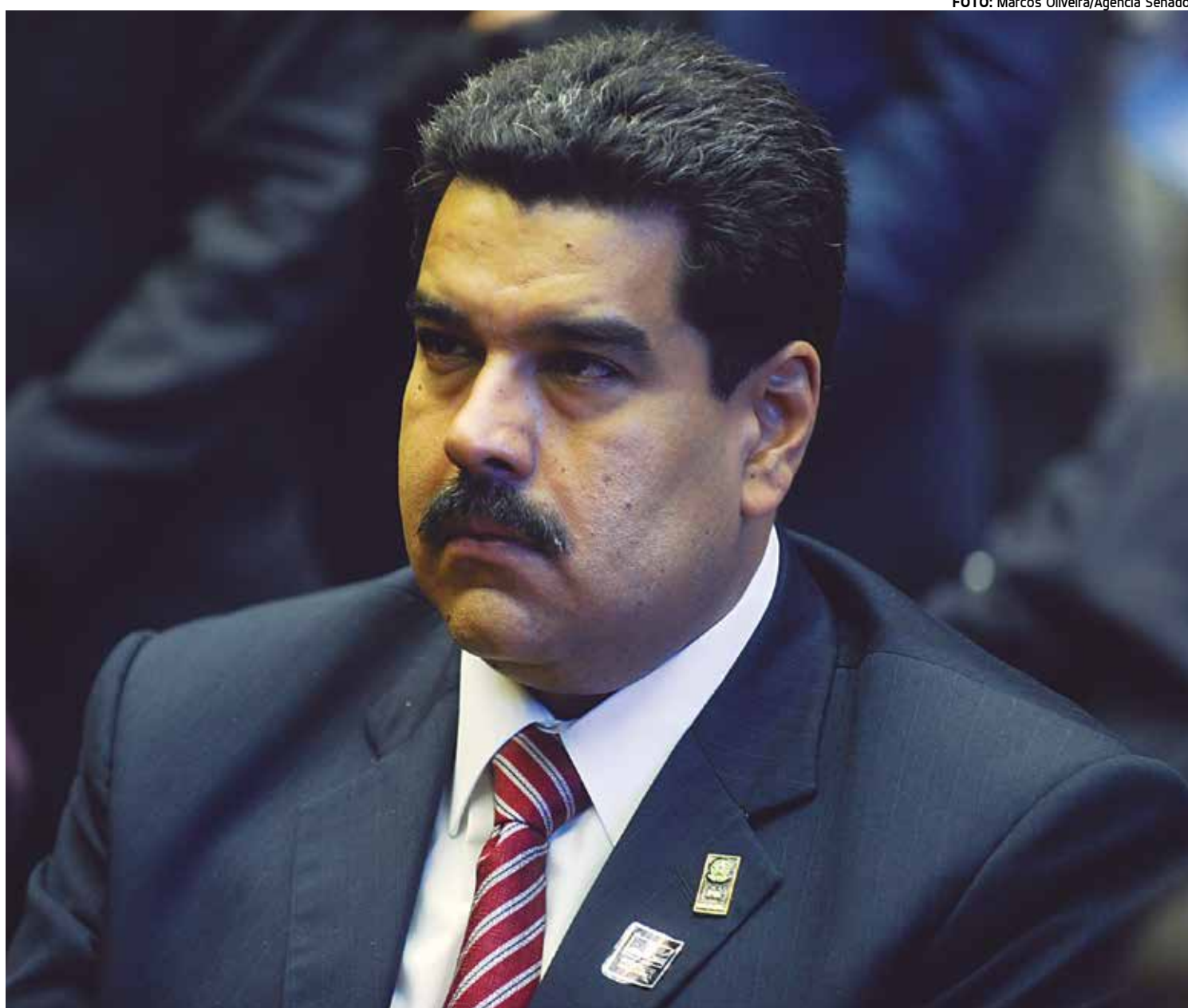
O presidente Nicolás Maduro enfrenta uma grave crise político-econômica, com altos índices de inflação e escassez de itens básicos

Também ontem o Banco Central venezuelano publicou indicadores econômicos do país pela primeira vez em um ano. E os índices são preocupantes: a inflação anualizada do país foi de 141,5% em outubro de 2015 (em comparação, a brasileira, já considerada elevada, ficou em 10,67% no acumulado do ano passado) e o Produto Interno Bruto (PIB) caiu 7,1% no terceiro trimestre do ano passado.