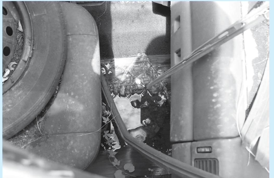
Poças d'água foram encontradas dentro de carros no posto da Polícia Rodoviária, em Bayeux