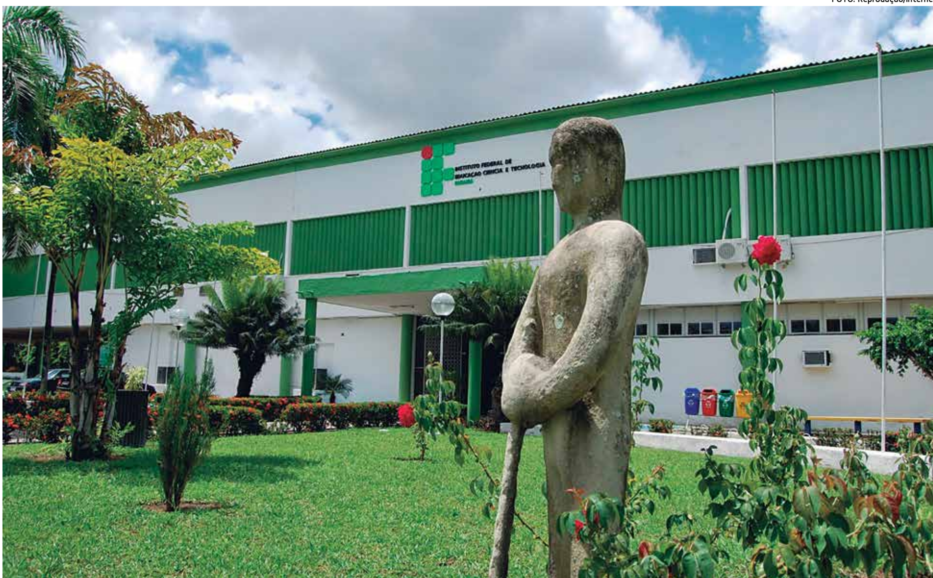
Instituto Federal da Paraíba oferece 1.260 vagas em 35 cursos superiores presenciais, entre os quais se encontram Engenharia da Computação e Ciências Biológicas

O ProUni oferece a estudantes brasileiros de baixa renda bolsas de estudos integrais (100%) e parciais (50%) em instituições particulares de educação superior. Os candidatos são de Ensino Médio da rede pública ou da rede particular; estes na condição de bolsistas integrais da própria escola, e as pessoas com deficiência.