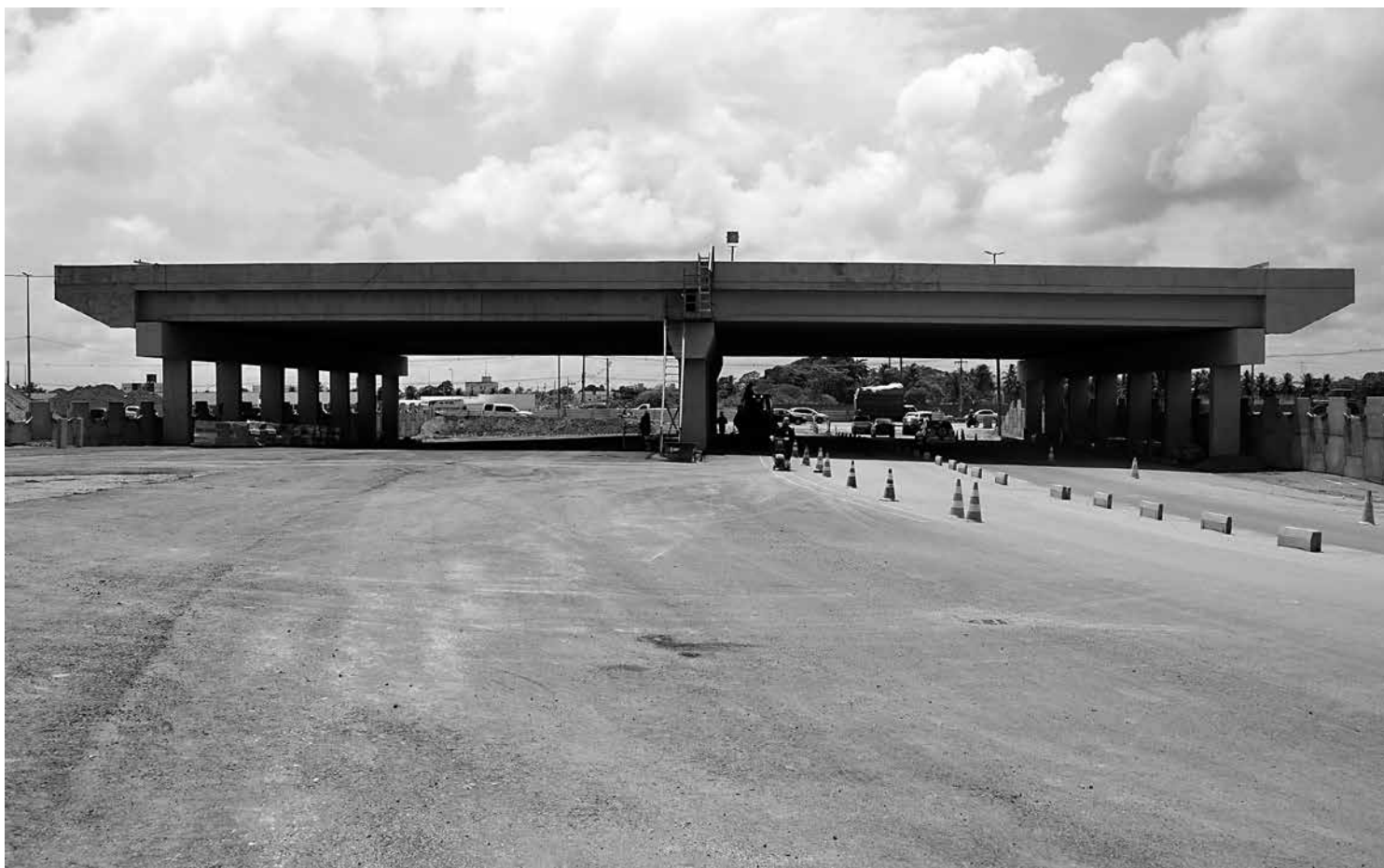
Vista parcial do vão de concreto da BR-230 por onde vão passar os carros nos dois sentidos da rodovia quando a obra for concluída

De acordo com informações da Suplan, entre os serviços preliminares realizados para a construção do viaduto destaca-se a instalação de 2,2Km de rede de drenagem, além de mais de 103 mil M 3 de terraplenagem e pavimentação, incluindo aterro, sub-base e base. Com relação à pavimentação asfáltica, já foram executados 23.817 M 2 de