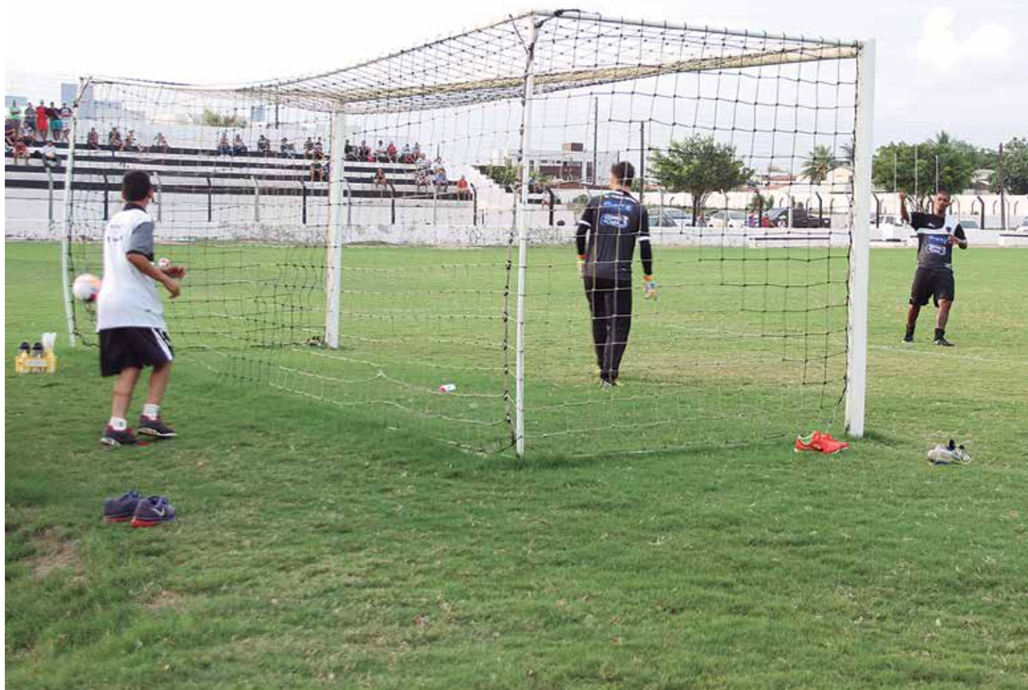
Durante a semana, os jogadores botafoguenses foram muito cobrados pela comissão técnica, visando compromisso de hoje