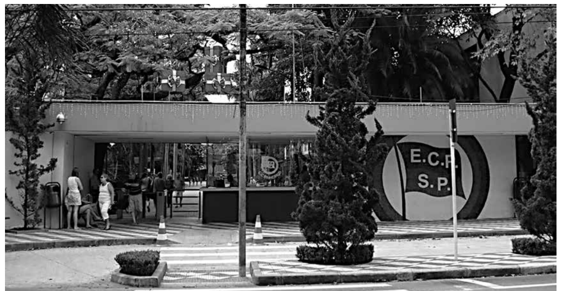
Comitê Olímpico da China escolheu o Clube Pinheiros, após negociação que durou cerca de 1 ano

de medalhas, no total de ouro, em Pequim 2008, e foi vice, em Londres, 2012. Antes de fechar com o Pinheiros, o Comitê Olímpico Chinês visitou também o Paulistano, outro clube tradicional da cidade. Porém, como não houve acordo, desde o início, as negociações não avançaram.