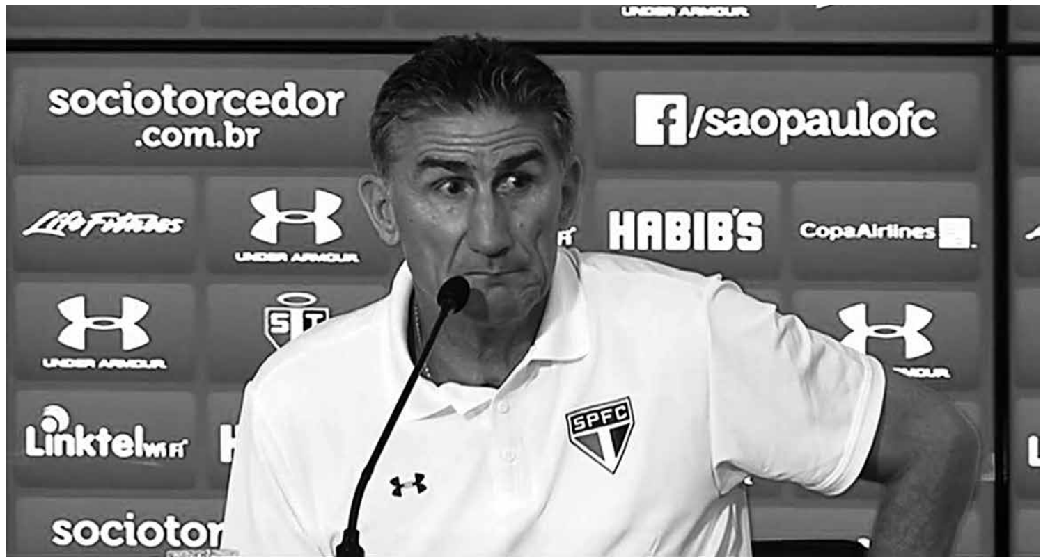
Treinador tricolor admite ainda fragilidade no time visando conquistas de títulos e quer mais jogadores para compor o seu elenco

O comandante tricolor quer também outros reforços. Em especial na defesa e no meio, além do ataque, como disse anteriormente. “Estamos buscando um jogador por linha. Outro zagueiro central. Um volante e um atacante. Estamos em conversações, por isso não podemos falar sobre nomes. Tudo é difícil, mas quero mais três jogadores”, falou o técnico.