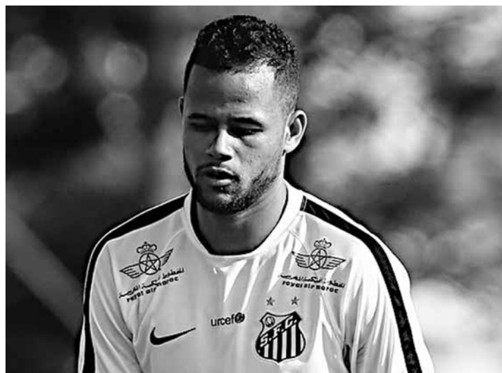
Santos e atacante recusaram proposta de R$ 48 milhões

A diretoria santista acredita que pode lucrar mais