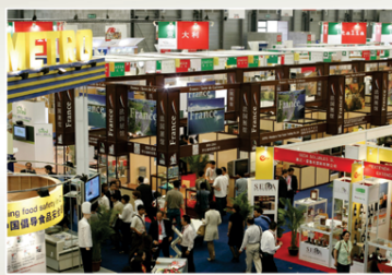
Vista panorâmica de um dos pavilhões da SIAL China