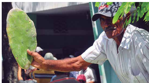
Implantação de 560 campos de palma forrageira resistente à cochonilha vão beneficiar agricultores

Ele acrescenta que o Procace também visa replicar e difundir tecnologias sociais que propiciam a convivência com o Semiárido. "Os investimentos atuais na implantação de 560 campos de produção de palma forrageira resistente à cochonilha do carimim, sub irrigados a partir de água de poços tubulares ou barragens subterrâneas, usando a ener-