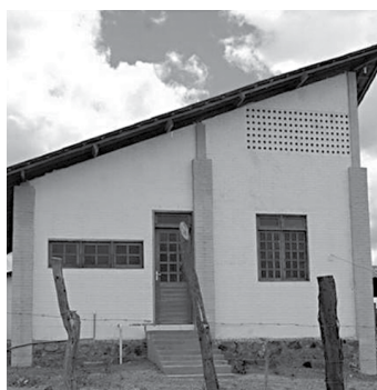
Estrutura da cobertura das casas ajuda a captar água da chuva

Cinco teses de doutorado e três de mestrado subsidiaram o projeto das residências ecologicamente corretas de Ribeira de Cabaceiras. Uma delas tem por título "Estudo de Conforto Térmico das Eco Residências". Mediante esse estudo, chegou-se ao melhor padrão de ventilação natural de cada casa. Todas as unidades são construídas com tijolo aparente e cobertas com telhas comuns.