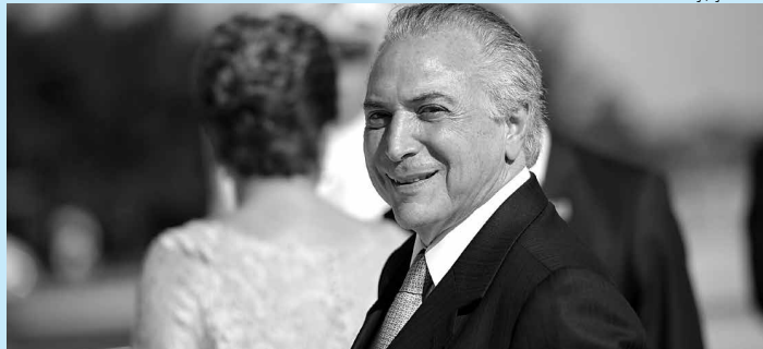
Vice-presidente da República não esperou o fim do processo de impeachment contra Dilma e já articula equipe ministerial

Com o processo de impeachment da presidente Dilma Rousseff (PT) avançando para apreciação do Senado, a reportagem foi às ruas para perguntar quais as expectativas sobre o possível governo Michel Temer, que já conversa nos bastidores para montar sua equipe de ministros. As respostas foram divididas com alguns achando que o País tende a afundar mais ainda, enquanto que outros acreditam que o Brasil poderá sair da crise econômica e voltar a crescer. Também existem pessoas que acreditam que o País só melhoraria com o povo indo às ruas para escolher o novo presidente através do voto. Veja as opiniões de dez paraibanos.