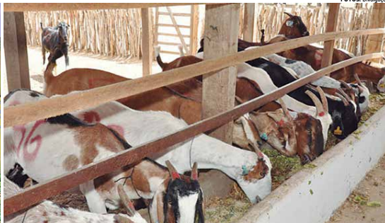
Estado tem investido em infraestrutura, arranjos produtivos e recursos hídricos destinados a agricultura familiar; agropecuária emprega cerca de 490.716 pessoas e ocupa área de 3.787.404 hectares