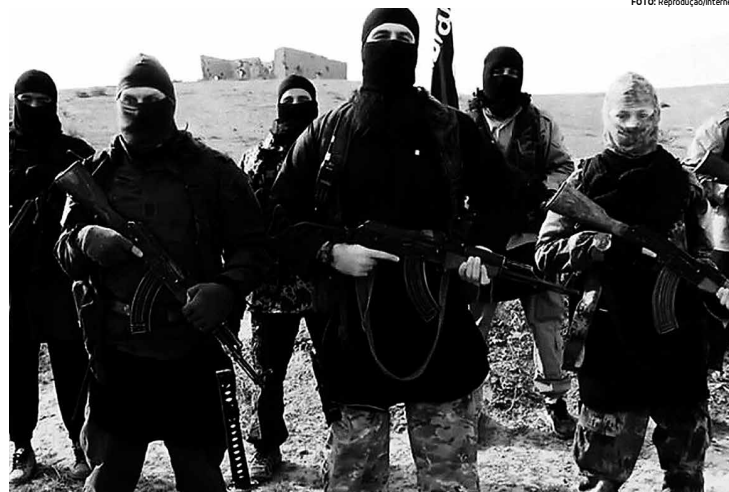
O grupo Estado Islâmico se tornou uma ameaça ao mundo, sendo preciso medidas urgentes para conter os seus atos de barbárie