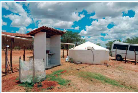
Projeto da UFCG constrói casas ecológicas para a população do Semiárido paraibano. PÁGINAS 7 E 8