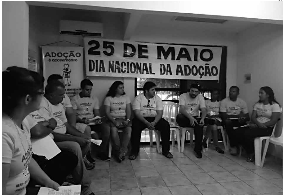
Grupo de Estudos de Apoio à Adoção de João Pessoa se reúne sempre na primeira terça-feira de cada mês no Conselho Tutelar Norte, no bairro dos Estados