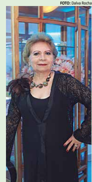
"Quem deixaria numa ilha deserta? Ora, os corruptos, embora hoje em dia e do jeito que as coisas vão neste País, cada dia aparecendo mais deles, a ilha não iria ficar mais deserta..."

Um ARREPENDIMENTO: tenho um grande arrependimento de não ter construído a casa dos meus sonhos num terreno que nós temos na Praia do Seixas. Não há um nascer do sol mais bonito do que o da Praia do Seixas e sempre gostei muito daquele lugar. Mas não tivemos coragem suficiente para ir morar por lá e agora mais velhos, perdi a chance de realizar esse meu sonho.