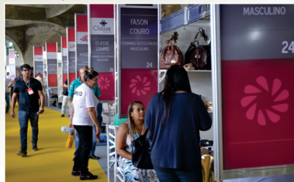
O Gira Calçados é uma das mais importantes feiras do setor calçadista do Norte/Nordeste. Acontece anualmente no Centro de Convenções da FIEP

O maior evento calçadista do Nordeste, "Gira Calçados", realizará a sua 5ª edição entre os dias de 10 a 12 deste mês, na Federação das Indústrias do Estado da Paraíba (FIEP), em Campina Grande. Como vem acontecendo a cada ano o evento está crescendo, neste ano participarão mais de 70 empresas, que exporão expondo mais de dois mil produtos.