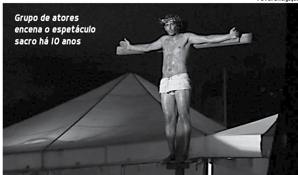
Grupo de atores encena o espetáculo sacro há 10 anos

“Gostaríamos de despertar que diante de tantas angústias e incertezas em um mundo cada vez mais egoísta, individual e com todas as