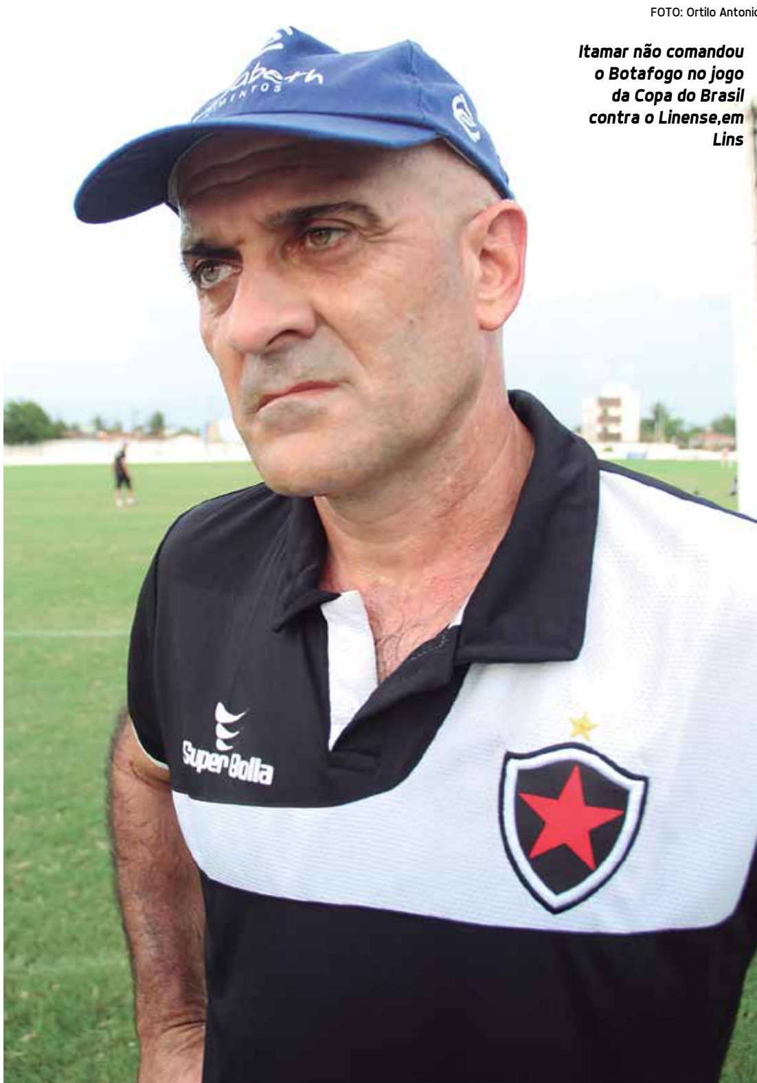
FOTO: Ortilo Antonio Itamar não comandou o Botafogo no jogo da Copa do Brasil contra o Linense, em Lins

O treinador ficou muito satisfeito com o desempenho da equipe diante do Linense, quando conseguiu um empate em um a um. De acordo com o regulamento da Copa do Brasil, o Belo tem a vantagem para o jogo da volta, programado para o dia 19 de abril, de até poder empatar outra vez, desde que seja sem gols. Se o placar se repetir, a decisão da vaga para a segunda fase da competição será nos pênaltis. Caso haja um empate, com dois ou mais gols, a vaga fica com o time visitante. A mesma coisa acontece, se o Linense vencer a partida aqui no Al-