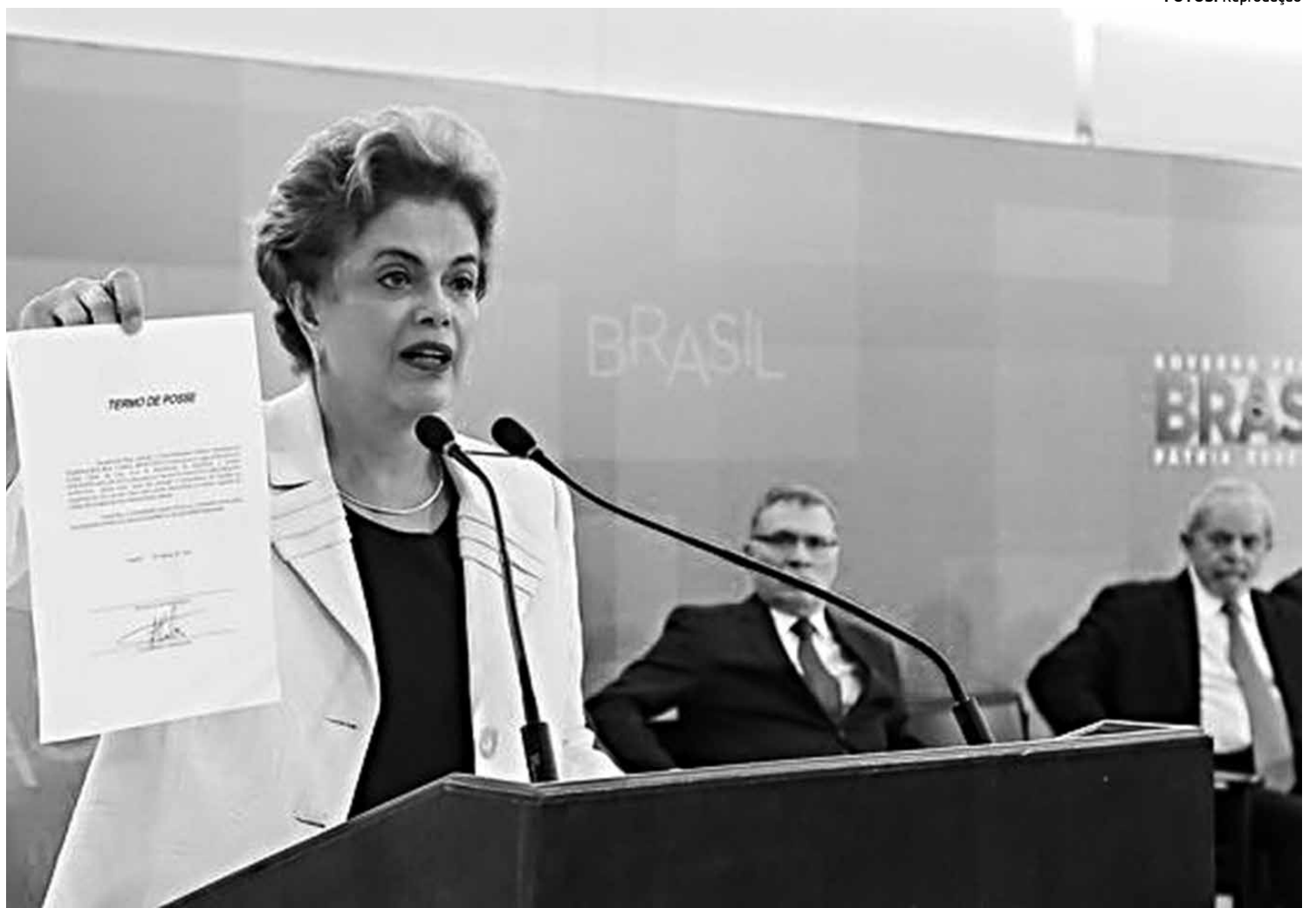
Presidente Dilma Rousseff mostra o termo de posse do ex-presidente Lula na Casa Civil e fala sobre a organização dos Jogos Olímpicos

"A portaria ainda vai ser completada em uma edição extra. Então, hoje uma edição extra do Diário Oficial completa o conjunto de medidas que atendem todas as exigências da Wada. Portanto, o Brasil manterá a sua conformidade com o Código Mundial Antidopagem. Hoje foi dado um enorme passo na luta contra a dopagem no esporte no Brasil e fica assegurado o LBCD (Laboratório Brasileiro de Controle de Dopagem) como o laboratório dos Jogos Olímpicos e Paralímpicos Rio 2016 - disse o secretário nacional para a Autoridade Brasileira de Controle de Dopagem (ABCD), Marco Aurelio Klein.