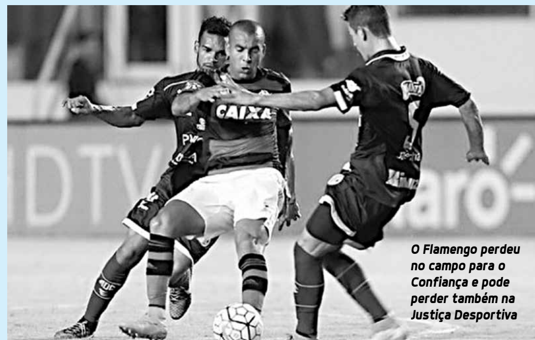
O Flamengo perdeu no campo para o Confiança e pode perder também na Justiça Desportiva

Válido pela segunda rodada da Taça Guanabara, o duelo entre Flamengo e Fluminense acontece às 16h no Pacaembu. Este será apenas o segundo encontro dos rivais em terras paulistas. O primeiro foi em 1942 e acabou sem gols.