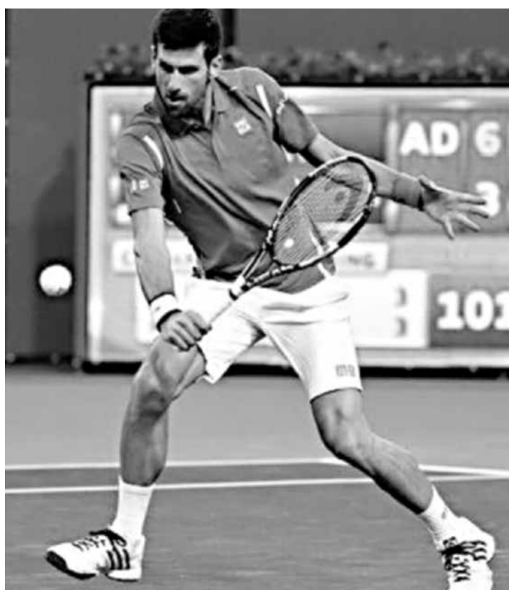
O sérvio Novak Djokovic venceu o espanhol Feliciano López

Depois de sobrar contra os adversários nas primeiras semanas do ano, o sérvio Novak Djokovic teve um pouco mais de trabalho em sua campanha no Masters 1000 de Indian Wells. Só que ontem, ele enfim teve um jogo mais tranquilo, batendo o espanhol Feliciano López em sets diretos, com duplo 6/3 em apenas 65 minutos.