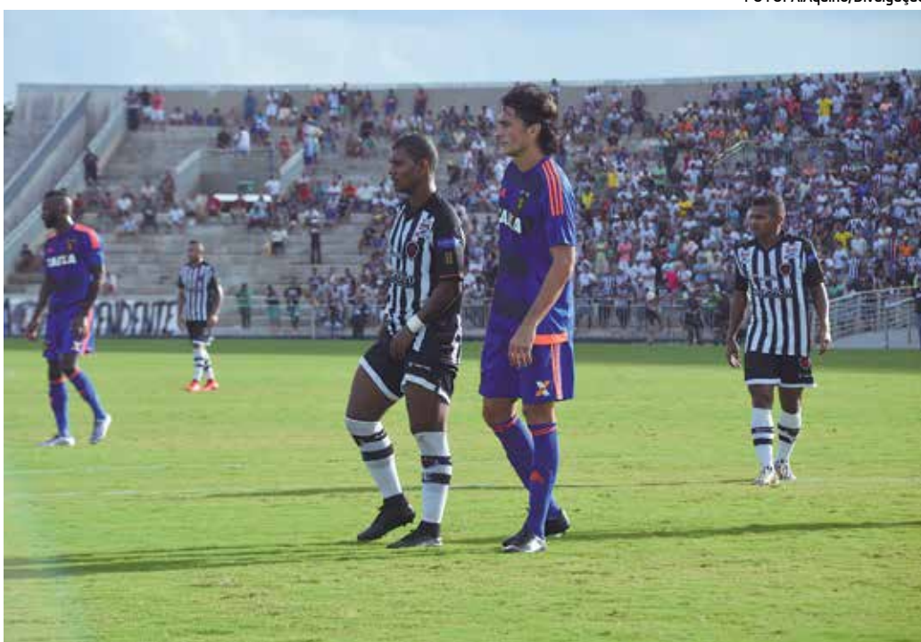
O Bota que joga contra o Sport, na última rodada, ainda tem remotas chances de classificação

O próximo jogo do Campinense será contra o ABC, de Natal. A partida está programada para a próxima quarta-feira, dia 23 de março, às 19h15, no Estádio Almeidão, em João Pessoa. Este jogo, anteriormente, estava programado para as 21h45, mas como a Raposa já está classificada e o jogo tornou-se um amistoso de luxo para ambas as equipes, a CBF resolveu antecipar o horário, atendendo a uma solicitação da TV Esporte Interativo.