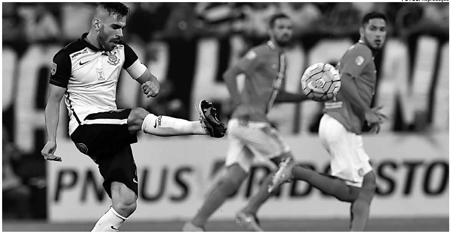
O Corinthians levou mais de 42 mil torcedores ao Estádio Itaquerão na vitória de 2 a 0 sobre o Cerro Porteño na última quarta-feira

Desde 2013 no Real, Isco custou cerca de R$ 120 milhões aos cofres da equipe da capital espanhola e se valorizou após vestir a 23 do Real Madrid. A Juventus, segundo o site "Calciomercato", pediu que o atacante Morata (ex-companheiro do jogador) convença Isco - que já teria exposto a sua vontade de sair - a desembarcar na Itália.