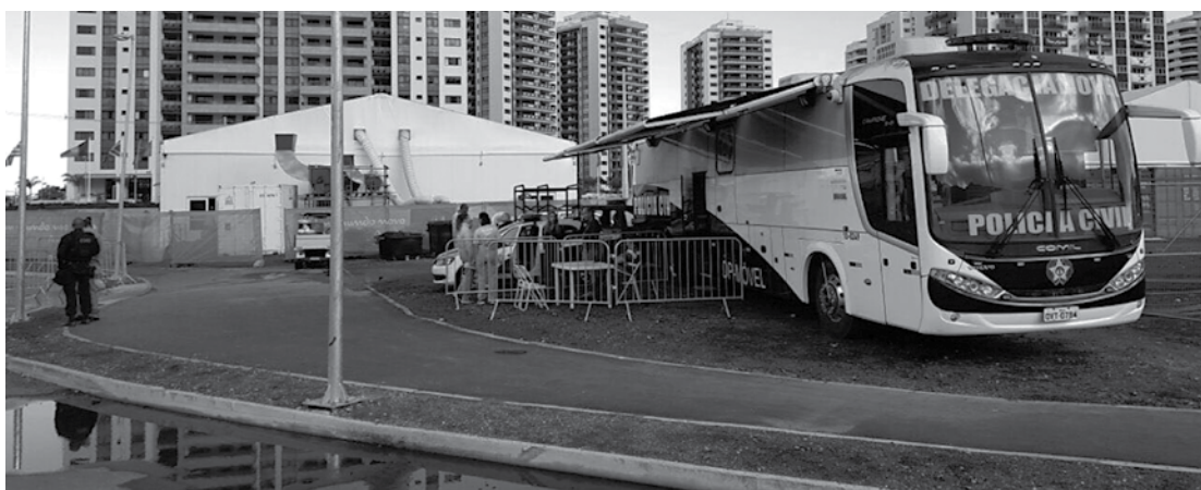
Delegacia móvel montada na Vila Olímpica que funcionou todos os dias durante os Jogos Olímpicos

Em balanço feito na última segunda-feira, no Comando Militar do Leste, Jungman falou sobre a atuação do Exército, da Marinha e da Aeronáutica no patrulhamento e na garantia da segurança do megaevento no Estado do Rio e nas outras cinco capitais onde foram disputados jogos de futebol. Ele disse que, inicialmente restrita a determi-