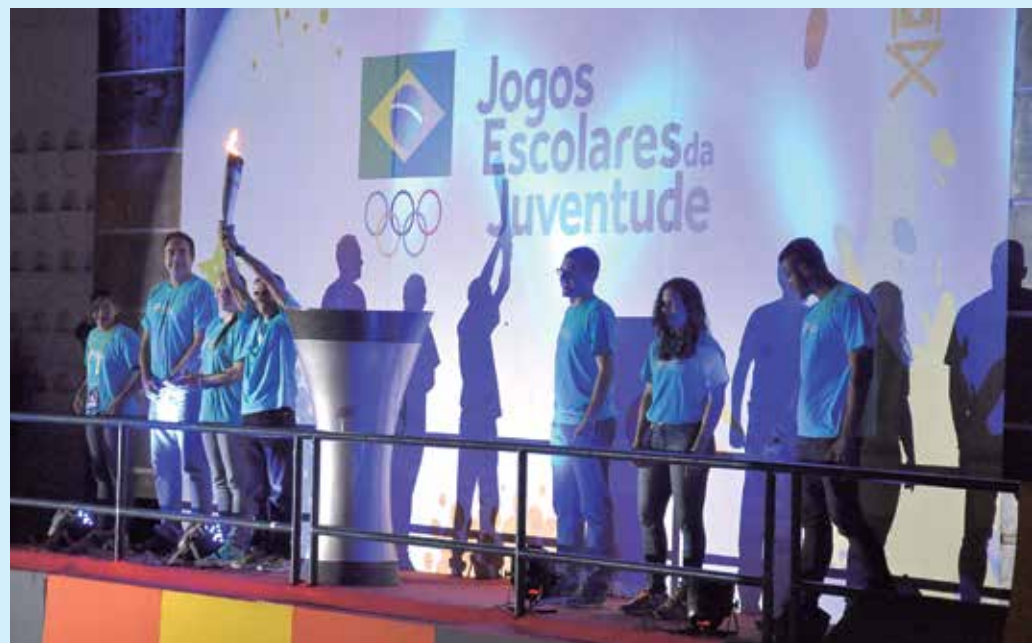
Vanderlei Cordeiro de Lima acendeu a pira olímpica dos Jogos Escolares da Juventude de 2016