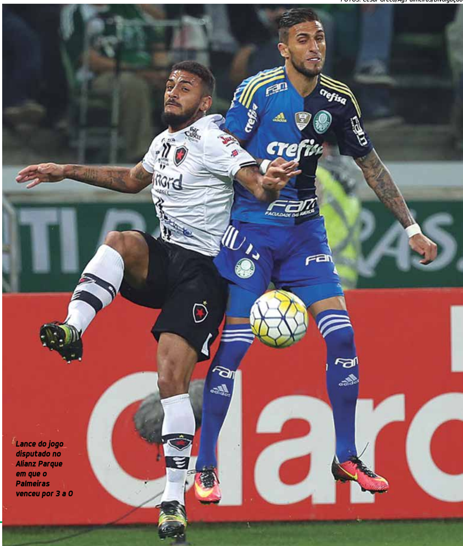
Lance do jogo disputado no Allianz Parque em que o Palmeiras venceu por 3 a 0