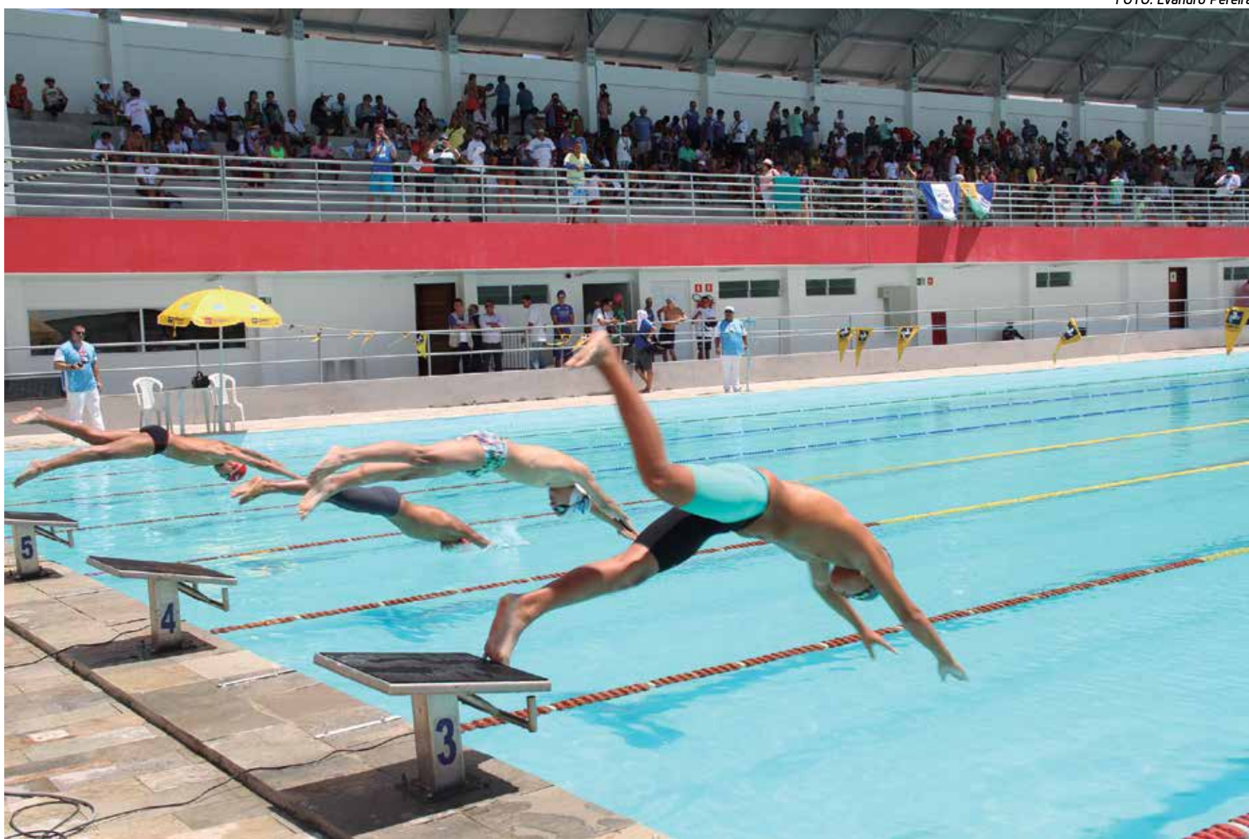
As provas de natação serão realizadas na piscina da Vila Olímpica Parahyba, no Bairro dos Estados, na capital e a Paraíba tem chance de subir ao pódio