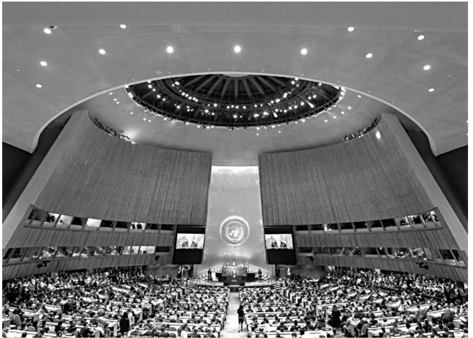
A 71ª Assembleia Geral da Organização das Nações Unidas foi aberta em Nova York, com a presença de vários chefes de Estado

O discurso ilustra o pouco progresso que foi feito no sentido de reconciliar os interesses divergentes entre os dois países. Há um ano, Obama usou o mesmo espaço para declarar que o presidente sírio Bashar Assad precisava deixar o poder, enquanto Putin fez um discurso avisando que seria um erro abandonar o ditador.