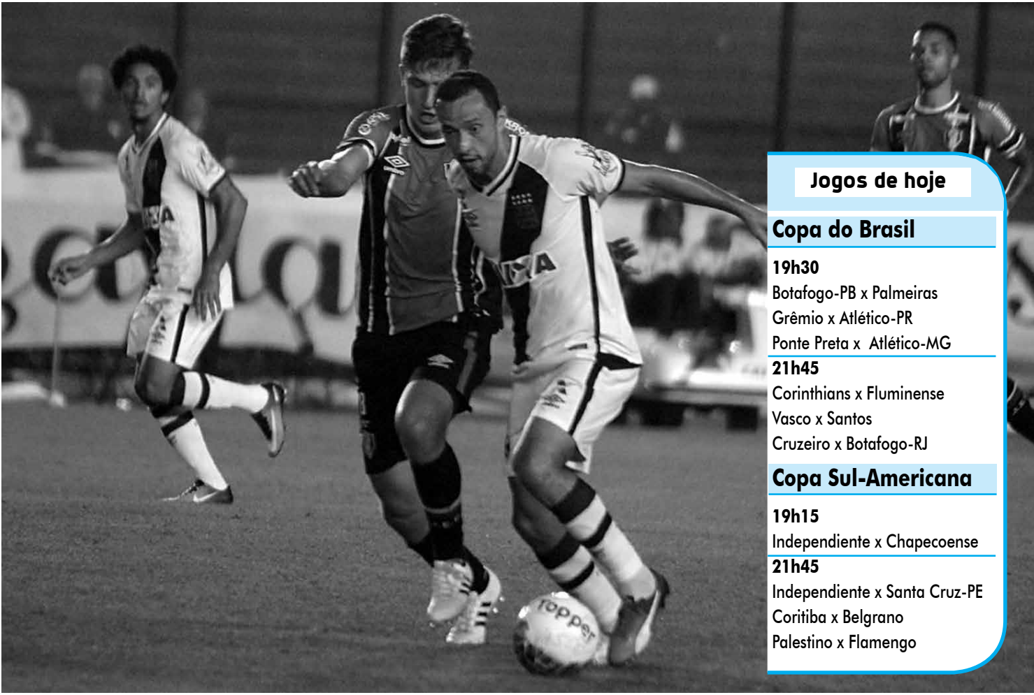
O meia Nenê, principal nome do Vasco, está convocando a torcida para empurrar o time no jogo decisivo contra o Santos em São Januário

“Tínhamos perdido um pouco a nossa identidade, que era intensidade do início ao fim. Ser protagonistas. Voltamos a fazer isso nos últimos dois jogos, e a tendência é continuar isso. Dar o máximo em cada jogo, até o fim do ano. O Vasco recebe o Santos em São Januário, às 21h45 pelas oitavas de final. Para avançar de fase, o Cruz-Maltino precisa vencer por 2 a 0. O resultado de 3 a 1 leva a decisão para os pênaltis.