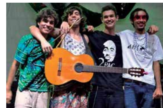
Grupo apresenta uma mistura de sons e ritmos

O lançamento do livro ocorrerá na sede do CRM (Conselho Regional de Medicina), situada à Avenida Dom Pedro II, nº 1335, às 20h e será promovido pela Academia Paraibana de Medicina.