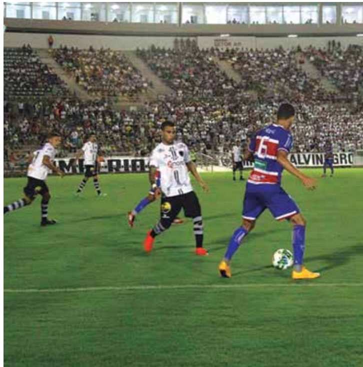
Botafogo só vai voltar a jogar pela Série C no próximo dia 30