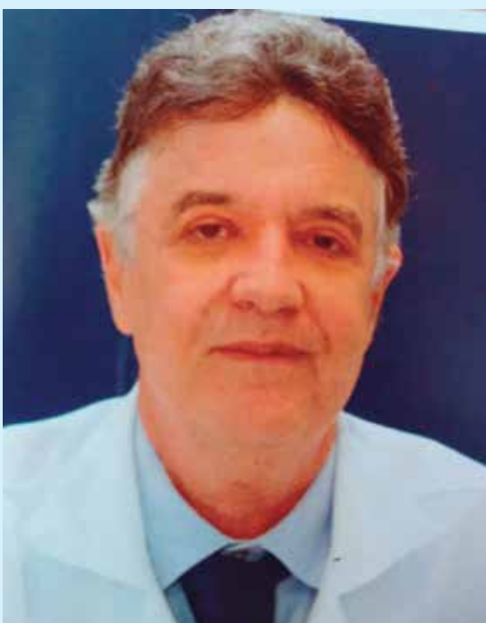
Lacerda foi destaque em transplante de órgãos

Na programação do lançamento está inserida uma reunião científica,