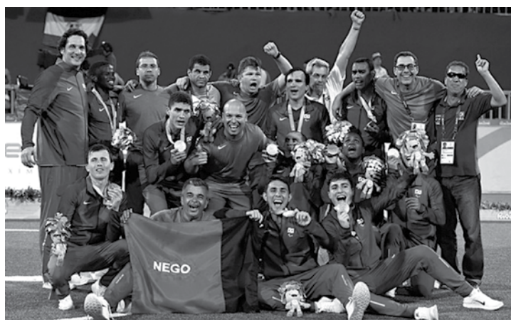
A bandeira da Paraíba presente no futebol de 5 que ganhou o ouro

Em terceiro, vêm empatados o Rio Grande do Norte e Mato Grosso do Sul, com nove medalhas. Os potiguares – com um ouro, seis