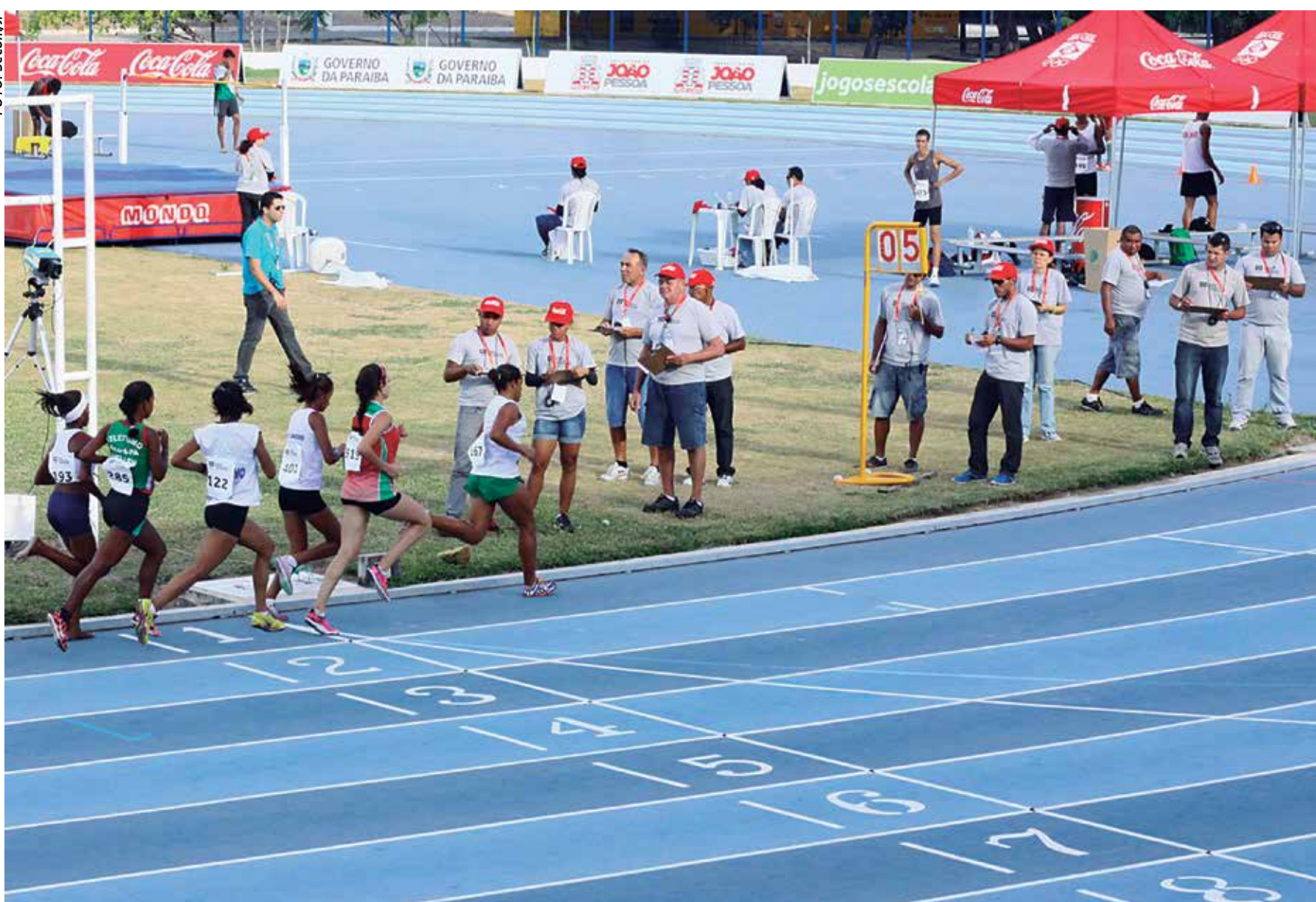
A pista de atletismo da Universidade Federal da Paraíba será palco, a partir de hoje, das provas dos Jogos Escolares da Juventude que foram abertos ontem