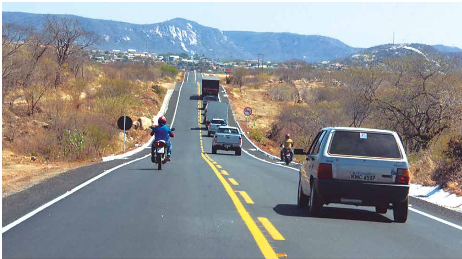
Restauração da PB-325, que liga BR-230/Jericó/Catolé do Rocha, é uma das obras do Caminhos da Paraíba, programa que contribuiu para a excelente classificação do Estado

Um dos fatores que contribuiu para o excelente desempenho foi o programa Caminhos da Paraíba, desenvolvido pelo Governo do Estado. A ação já foi responsável pela construção e recuperação de 103 rodovias que atendem a diversos municípios paraibanos, melhorando as condições de infraestrutura de transpor-