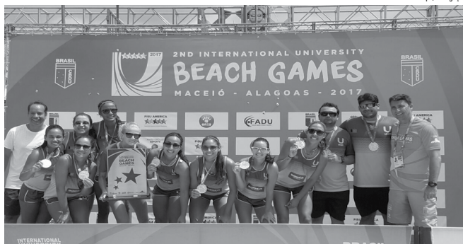
Equipe feminina do Unipê que ganhou o título de forma invicta de mais uma edição do II International University Beach Games

Tranquilidade para alcançar o bicampeonato. Assim o técnico dos times do Unipê destaca a participação da equipe masculina na competição. Ele ainda destaca a superação das atletas do feminino. "No masculino, ganhamos invictos e não tivemos dificuldades. Já no feminino enfrentamos partidas difíceis, como contra o Uruguai, mas mantivemos sempre o mesmo nível de comprometimento", destacou. Campeão nacional e mundial pela Seleção Brasileira, o jogador Gulliver Esteves ressaltou a importância dos jogos universitários. "É fundamental,