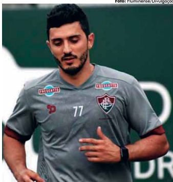
Marquinho está bem na vida e se prepara para disputar a Copa Sul-Americana