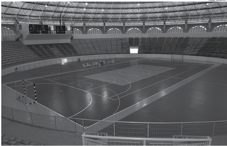
O ginásio Ronaldão, localizado no bairro do Cristo Redentor, está oferecendo inscrições gratuitas às aulas da rede pública em quatro modalidades