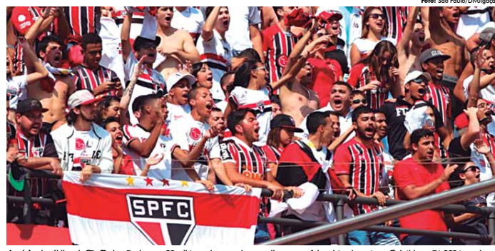
A média de público do São Paulo chega a 30 mil torcedores por jogo, melhor marca foi registrada contra o Corinthians: 51.869 torcedores

(71.232) são os outros clubes que ultrapassam a média de 70 mil torcedores na temporada. O Benfica, com média de 53.612 fãs, é o melhor português no ranking. O clube está na 10ª posição. A melhor marca francesa é do PSG (45.107), enquanto a Internazionale lidera para os italianos (40.164). A dupla, porém, perde para o dono da melhor média de público da MLS. Novato no principal torneio dos EUA e do Canadá, o Atlanta United ostenta média de 50.610 apaixonados.