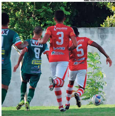
O Auto Esporte que perdeu para o Sousa, segue se arbor na rodada classificatória à segunda fase