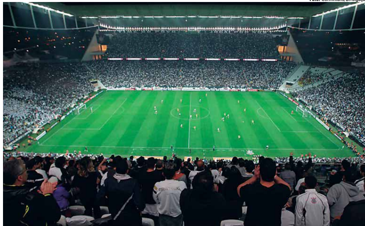
Corinthians se prepara como apoio de sua apaixonada torcida na estreia da Copa Sul-Americana diante do Universidad de Chile a partir das 21h45

Mais do que adicionar uma taça à sua coleção, o Corinthians vê a competição como uma oportunidade de faturar. O clube vem sofrendo com a brusca queda na média de público nas partidas na