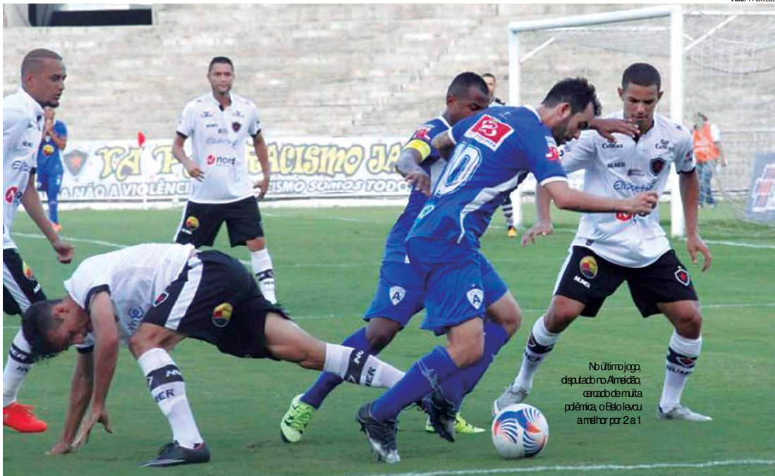
No último jogo, disputado no Arraialão, gerado de muita polêmica, o Belo levou a melhor por 2 a 1