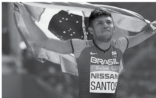
Paraibano é recordista mundial nos 100 e 200m categoria T47 e representa o país na competição em São Paulo

No total serão 181 atletas de atletismo, em provas de campo e pista, e 135 na natação. A competição deste ano ganha importância especial por ser um evento que antecede aos Mundiais das duas modalidades, em julho, em Londres, para o atletismo, e em setembro, na Cidade do México, para a natação. Desta forma, os atletas estarão em busca de índices em suas classes para conquistar vaga na seleção que vai representar o país nas competições mais importantes da temporada.