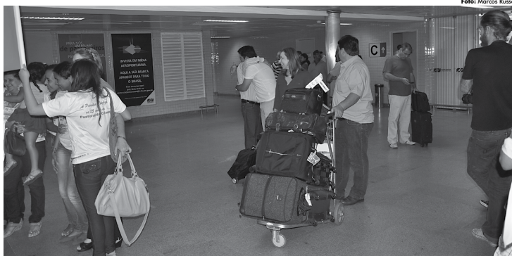
Cobrança de bagagens despachadas deveria entrar em vigor no dia 14 de março, mas foi suspensa por uma decisão da Justiça Federal em São Paulo

"Isso é uma injustiça absurda. Se for destacado do bilhete, como é nos Estados Unidos, eu posso ter o bilhete mais barato do que tenho hoje", aponta o representante das companhias aéreas. Ele cita como exemplo a redução nos preços das passagens desde que foi instituída a liberdade tarifária no país, há 15 anos.