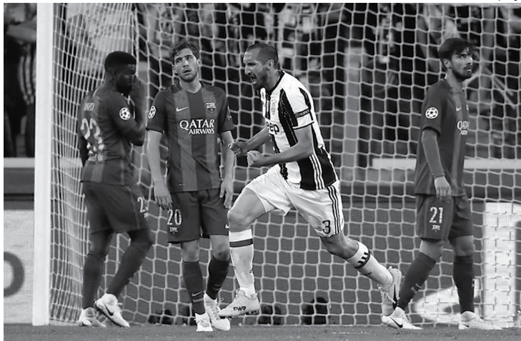
O atacante Higuaín é um dos destaques da Juventus. Ele marcou no jogo de ida a vitória de 3 a 0, mas precisa lutar para garantir a classificação

"Para Allegri, todos os jogos são iguais. Ele os vive e prepara da mesma maneira. Isto nos permite estar concentrados. Você não se acomoda e nunca deixa de estar atento. Este é o segredo de lutar para ganhar tudo" finalizou.