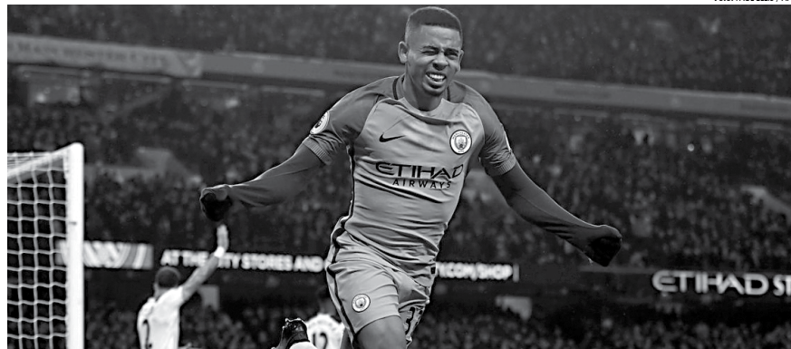
Gabriel Jesus foi transferido para o Manchester City no início do ano e está entre os 25 jogadores transferidos na janela aberta em 12 de janeiro e fechada no dia 4 de abril, segundo a CBF

No caminho inverso, de jogadores que vieram para o futebol brasileiro no TMS, foram 479 negociações, número também superior aos