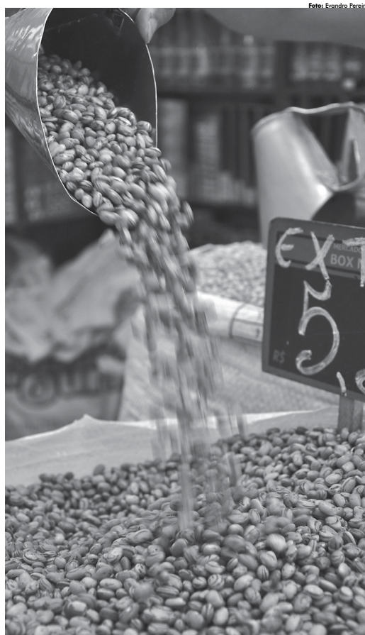
No Nordeste, a queda acumulada do feijão nos últimos 9 meses já é de 56%. O aumento já chegou a 154,9%.

As maiores altas foram registradas em Teresina (+3,9%), Natal (+3,5%), Recife (+3,5%), São Luís (+2,8%) e João Pessoa (+2,6%). A única retração ocorrida na região foi em Maceió (-0,5%).