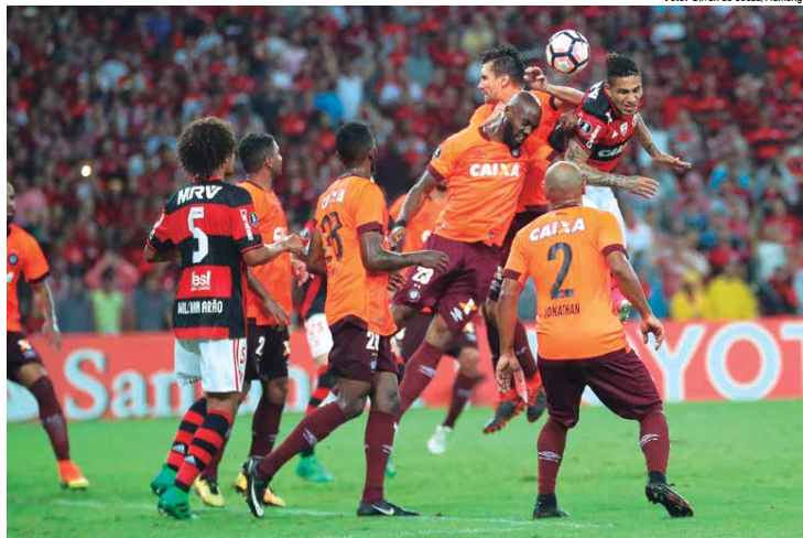
Flamengo e Atlético-PR se enfrentaram no Maracanã pelo jogo de ida da Libertadores com vitória carioca por 2 a 1 e hoje se reencontra a segunda partida

A Arena da Baixada foi inaugurada em 1999. Em 2011, foi fechada para uma grande renovação visando a Copa do Mundo. Recebeu três jogos da primeira fase do torneio em 2014.