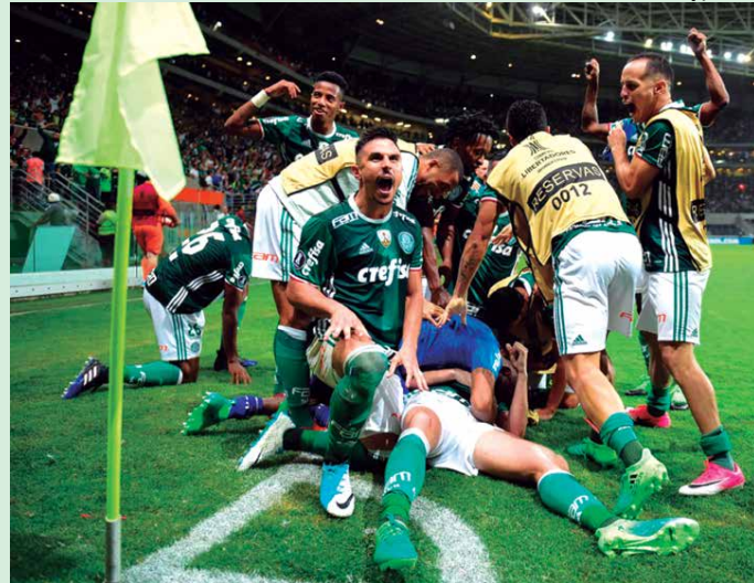
Encontro de Atlético disputado na Arena Allianz pela Taça Libertadores, o Palmeiras conseguiu vencer nos acréscimos o Peñarol por 3 a 2

"Vai ser um jogo diferente. A gente já tinha nos preparado para fazer um grande jogo, mas, infelizmente, lá foram dois dias chuvosos, que atrapalharam bastante a gente dentro de campo. Por ter uma equipe mais leve, tivemos que fazer muita jogada aérea. Aquela raivinha que ficou do primeiro jogo está guardada, para que a gente possa pressionar desde o começo e tentar fazer um gol antes dos 15 minutos e ter o controle do jogo, para fazer uma grande partida.