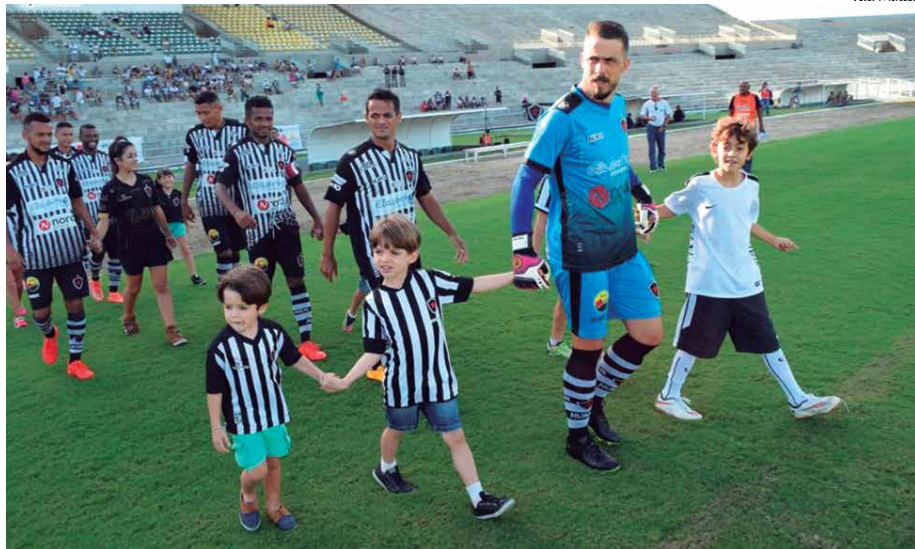
Desde 2013 o Botafogo-PB segue com calendário cheio na temporada e agora busca a reconquista do Campeonato Paraibano na disputa contra o Treze a partir do próximo domingo

O campeão assegurará de cara R$ 600 mil por estar na primeira fase da Copa do Nordeste, isto em valores de hoje.