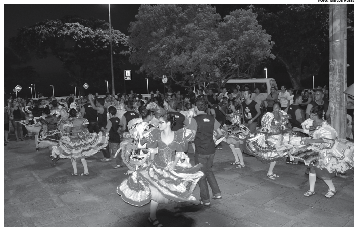
Projeto Brasil Junino divulga festas típicas do mês de junho na Espanha, Portugal, Itália e na Inglaterra como objetivo de atrair turistas

Segundo ele, o objetivo do instituto é diversificar a oferta turística no exterior com uma atração complementar aos principais destinos. “Paralelamente ao Brasil Junino, são realizadas ações institucionais voltadas para o trade turístico e para a imprensa especializada, fortalecendo as ações da Embratur para a comercialização e promoção do destino Brasil nesse mercado”, reforçou o diretor da autarquia. As festas juninas brasileiras, realizadas principalmente