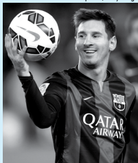
Messi chegou ao gol 500 aos 29 anos

Lionel Messi precisou de uma temporada e 172 partidas a mais no Barcelona do que Pelé necessitou no Santos para alcançar o gol 500 em jogos oficiais. O Rei do Futebol também era dois anos mais novo (27 a 29) quando conseguiu o feito - foi no longínquo ano de 1967. Já o argentino atingiu a marca no último domingo, quando marcou duas vezes na vitória por 3 a 2 contra o Real Madrid pelo Campeonato Espanhol.