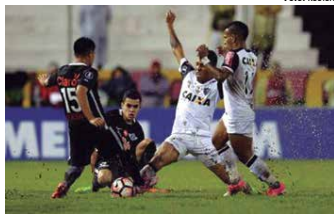
No jogo disputado no Paraguai, o time mineiro perdeu por 1 a 0