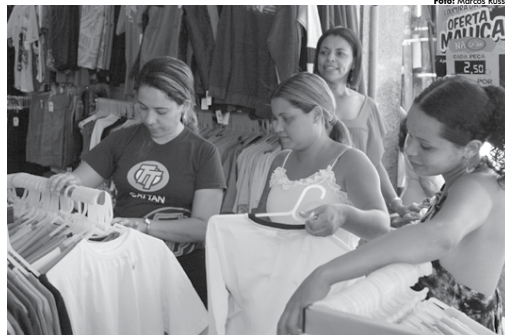
Vestúário foi apontado por pesquisa como o presente preferido dos filhos para presentear os pais