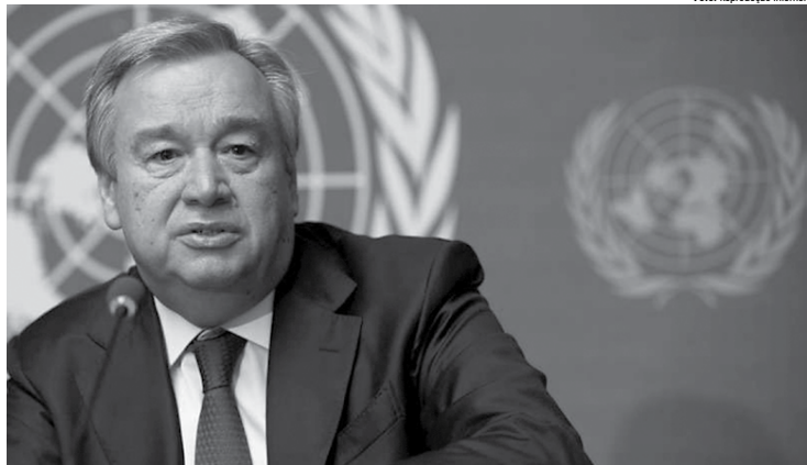
Secretário-geral da ONU António Guterres está preocupado com a situação na Venezuela, que se agrava por causa de medidas extremas de Maduro

Zeid Al Hussein fez um apelo às autoridades para que não agravem "uma situação que já é extremamente volátil" com o "uso excessivo de força, incluindo através de invasões domésticas violentas pelas forças de segurança que ocorreram em várias partes do país".