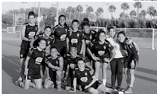
Jogadoras da Seleção Brasileira Feminina que segue fazendo jogos pelo Torneio das Nações nos Estados Unidos