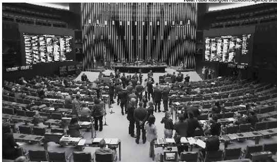
Avaliação da denúncia contra o presidente Michel Temer na Câmara por parte de 342 deputados registrados

Caso o plenário siga o mesmo entendimento da CCJ, o caso será suspenso e só poderá ser analisado pela