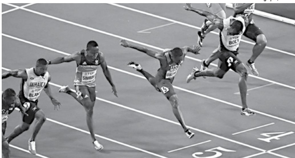
Velocista jamaicano Usain Bolt e atletas na chegada dos 100m rasos no Mundial de Atletismo da Coreia do Sul

Com o tempo de 9s95, Usain Bolt terminou em terceiro lugar e conquistou o bronze no Mundial, que está sendo disputado em Londres. Como já virou um costume nas corridas do jamaicano, ele teve um desempenho na largada pior que os rivais. Entretanto, dessa vez ele não conseguiu recuperar o primeiro lugar ao longo da prova, na fase de corrida. Com 9s95, ele acabou superado pela dupla dos Estados Unidos. Justin Gatlin foi ouro, com 9s92, e Christian Coleman aca-