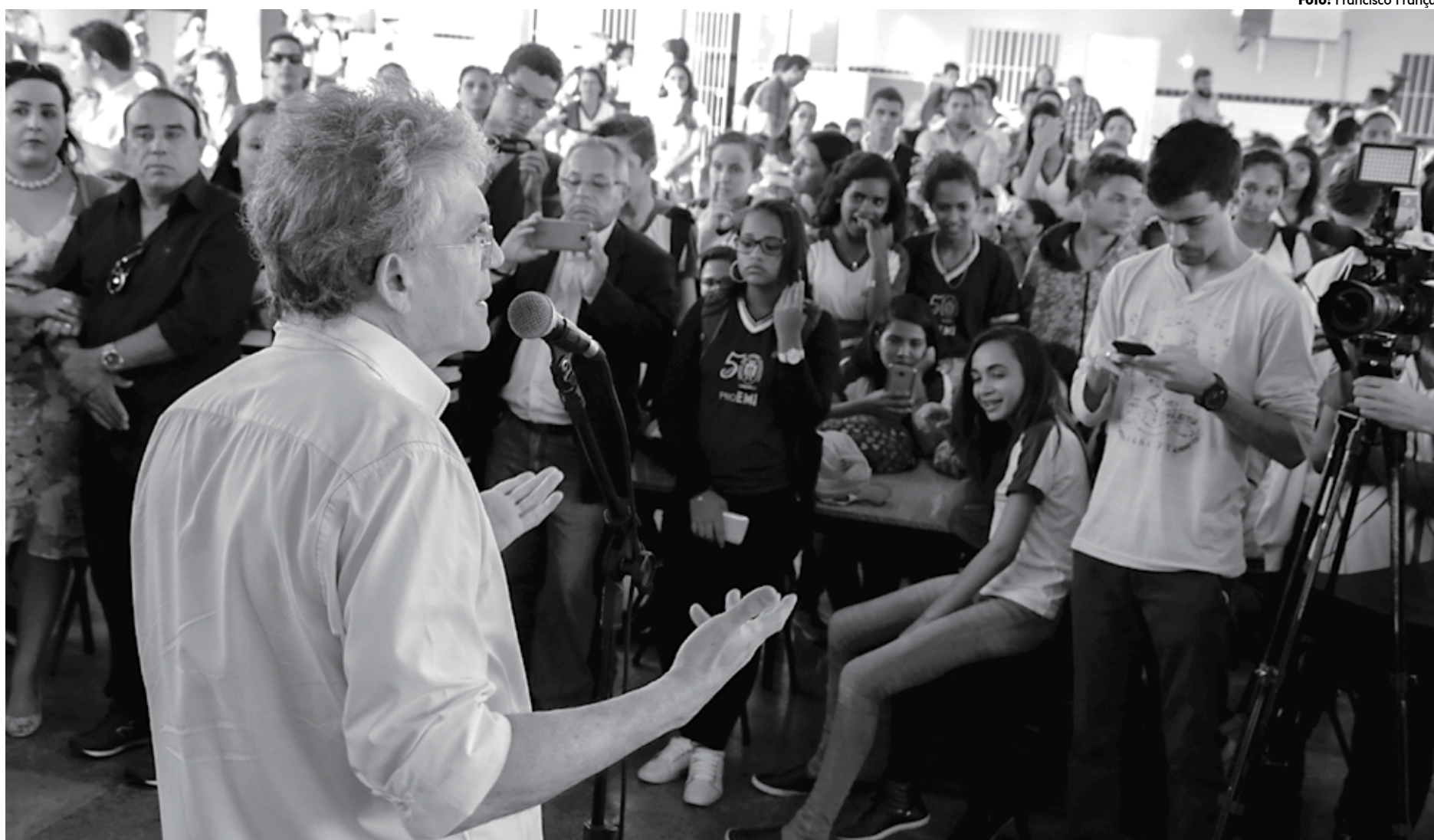
Governador ressaltou que a escola tem que ter um ambiente favorável e uma boa base pedagógica, além de equipamentos, laboratórios, ginásios para agregar conhecimento

O governador ainda lembrou que, na semana passada, lançou o aplicativo #EufaçãoEducação para dar ao estudante a oportunidade de avaliar as escolas da Rede Estadual de Ensino. “Todo estudante da Rede Pública vai poder baixar o #EufaçãoEducação e opinar sobre como está a alimentação, estrutura, ensino, enfim, sobre tudo