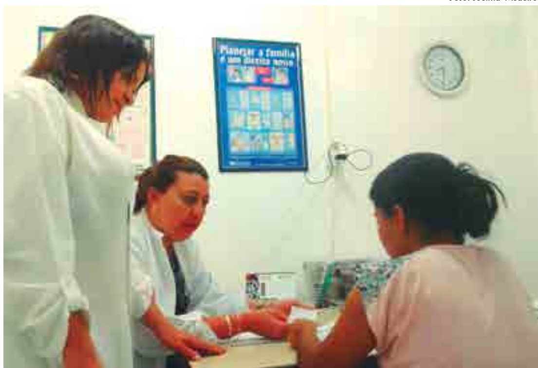
Equipe multidisciplinar do ambulatório de planejamento familiar da maternidade atendeu mais de 1.100 pessoas este ano

“Para que a mulher realize a laqueadura é preciso que atenda os critérios previstos na Lei nº 9.263/96, que trata