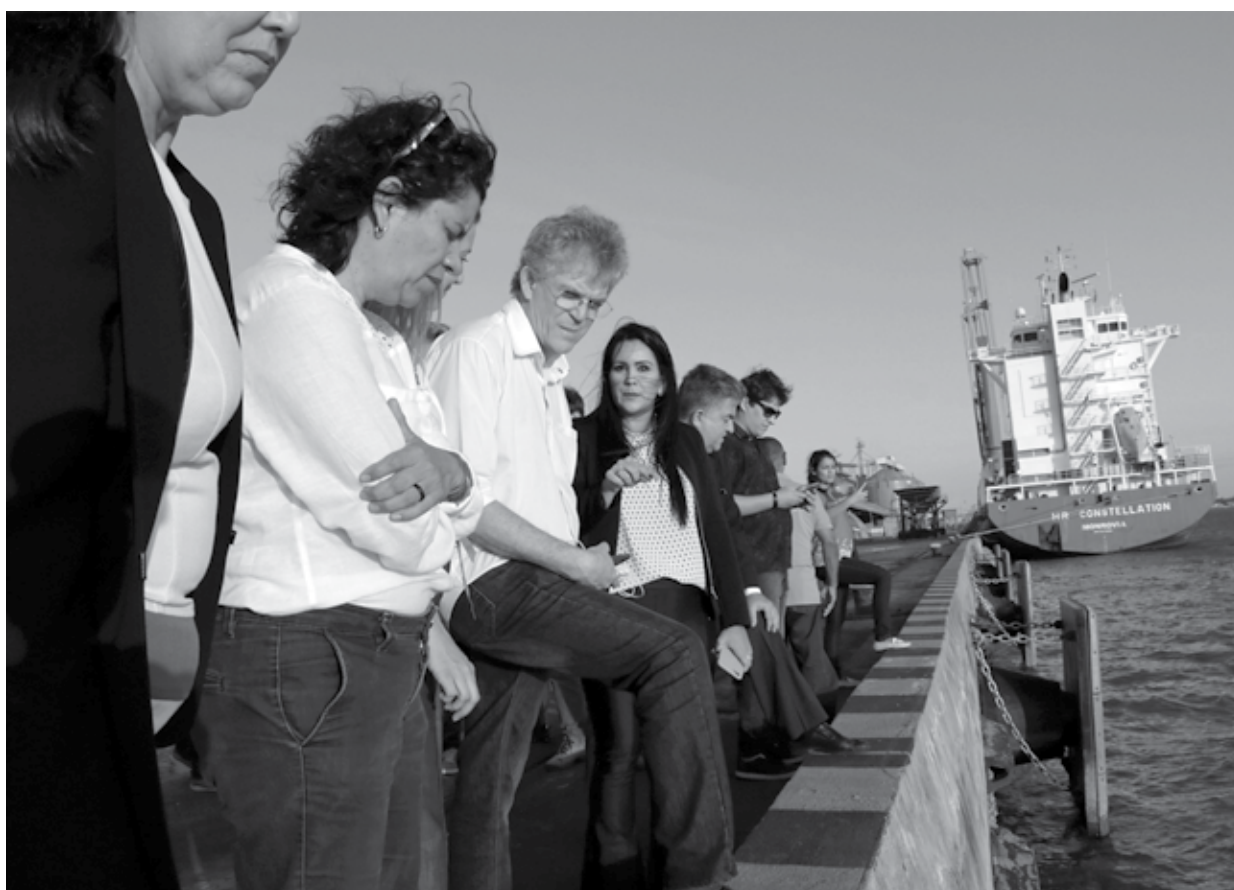
Governador ressaltou que, nos últimos 6 anos, foram investidos mais de R$ 10 milhões com recursos próprios em melhorias no Porto de Cabedelo

“O Berço 101 é o local onde atracam os navios com cargas de derivados de petróleo. Essa obra faz parte de uma série de ações de melhorias para que a gente possa trazer uma nova operação para o porto chamada Ship to Ship. Esse sistema operacional inédito significa que vão ficar dois navios atracados no Berço, onde o navio maior vai passar combustível para o navio menor e este, por sua vez, vai abastecer outros portos. Hoje, o Porto de Cabedelo movimenta, na parte de combustíveis, cerca de 50 milhões de litros por mês e a nossa expectativa é que passaremos, inicialmente, a fazer duas operações Ship to Ship por mês, cada uma movimentando 80