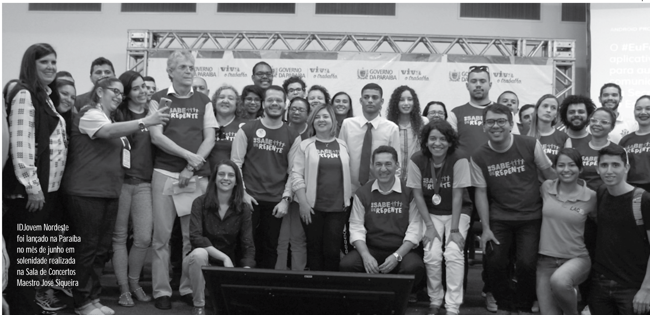
IDJovem Nordeste foi lançado na Paraíba no mês de junho em solenidade realizada na Sala de Concertos Maestro José Siqueira