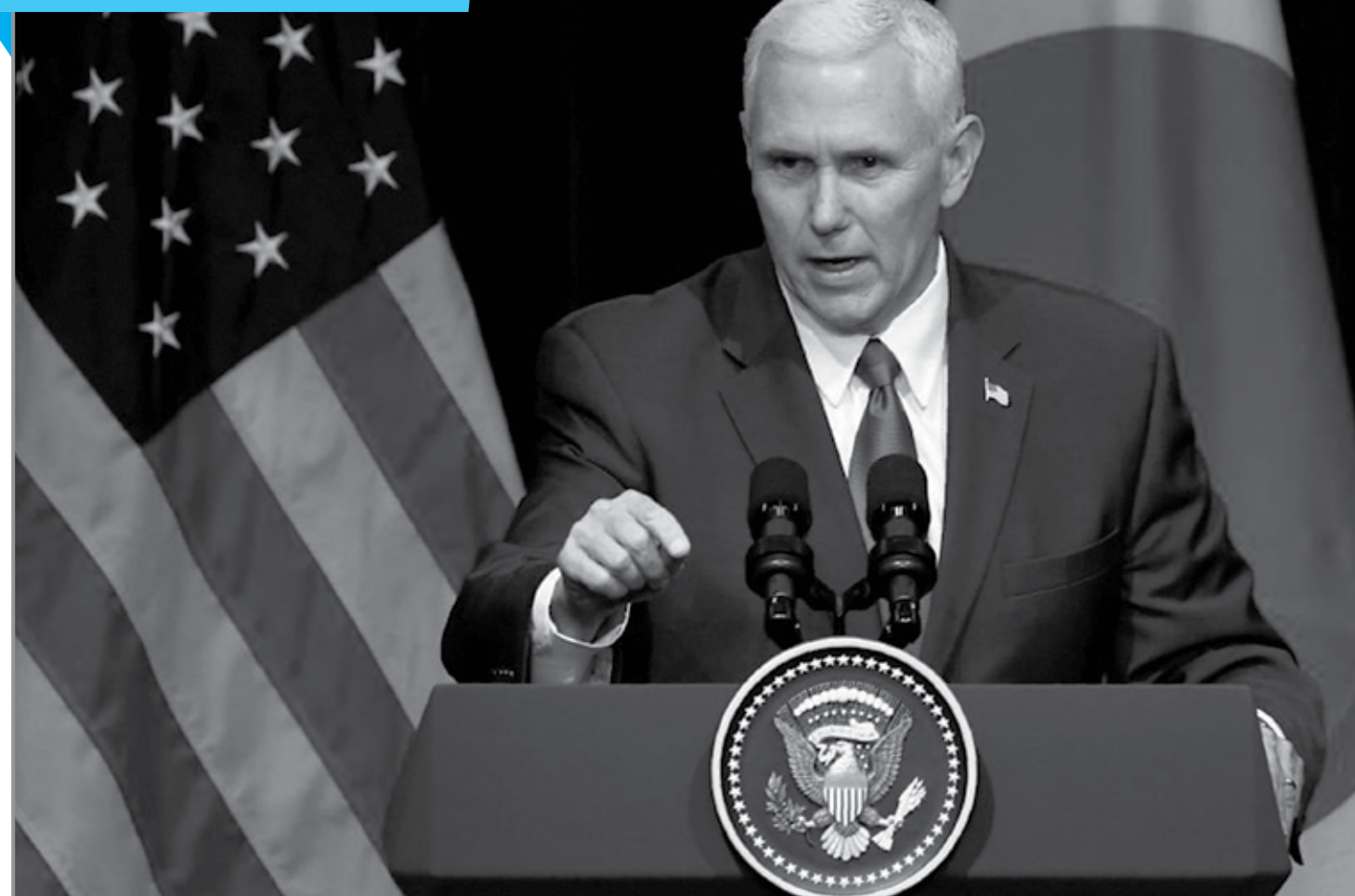
O vice-presidente dos EUA, Mike Pence, disse que "um Estado fracassado na Venezuela ameaça a segurança e prosperidade de todo o hemisfério"