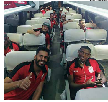
Vitória do Botafogo chegou ao Pará para a estreia na Copa do Nordeste, afirmou jogadores