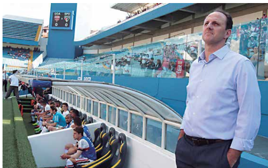
Treinador não teve muita sorte em sua estreia em jogos oficiais e viu o São Paulo perder para o Audax