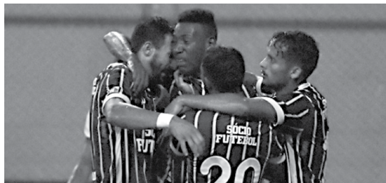
Após vitória de domingo, jogadores serão poupados da partida contra o Internacional, pela Primeira Liga