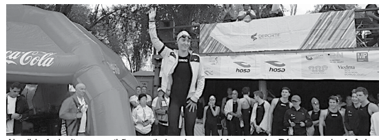
A brasileira fez brito na competição, garantiu um lugar no pódio, elevando o País a grande referência

A Itália também fez os dois primeiros lugares no masculino com Federico Vanelli (1h57m02s42) e Simone Ruffini (1h57m52s30). O terceiro posto ficou com o francês David Aubry (1h58m25s36). A próxima parada será em março, em Abu Dabi, nos Emirados Árabes.