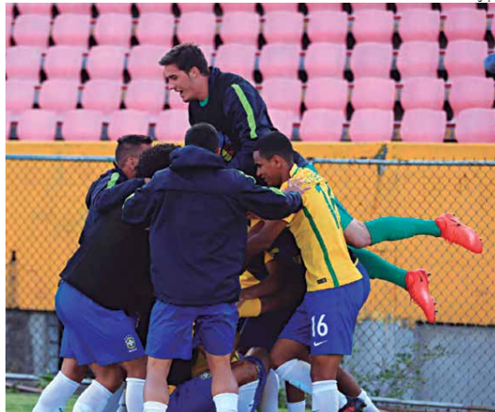
O gol mirrado, aos 43 minutos do segundo tempo, foi bastante comemorado pelos jogadores brasileiros

O jogo A partida começou com uma disputa grande no meio-campo e os 45 minutos iniciais não foram de muitas