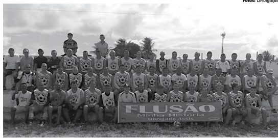
No último domingo, atletas e esportistas se reuniram em grande confraternização para a abertura do evento