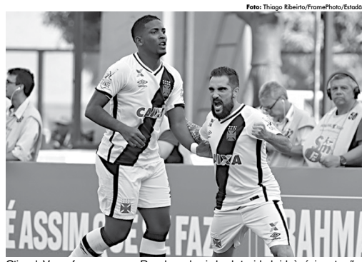
O time do Vasco se prepara para vencer o Resende, sendo vaiado pela torcida devido à péssima atuação

Marcelo perdeu a paciência com seus seguidores no Instagram no último domingo. O lateral-esquerdo da Seleção Brasileira e do Real Madrid postou uma foto parabenizando Neymar pelos 25 anos de vida. Acontece que Cristiano Ronaldo faz aniversário no mesmo dia e não recebeu qualquer referência de Marcelo. Os torcedores não perdoaram nos comentários. Marcelo não gostou e chamou eles de idiota.