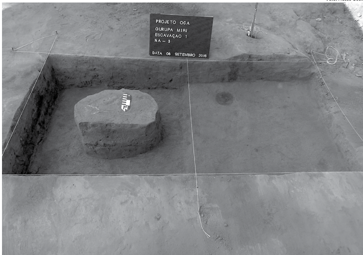
Repórter do Museu Goeldi está construindo uma base de dados sobre o local da tábua original de antigas populações que viveram na região

Os candidatos selecionados têm até o próximo dia 13 para apresentar à instituição de ensino documentos que comprovem as informações prestadas na ficha de inscrição. A perda do prazo ou a não comprovação das informações implicará, automaticamente, a reprovação do candidato. De acordo com o Ministério da Educação, o resultado da segunda chamada do programa será divulgado no próximo dia 20. Os alunos que não forem selecionados nessa etapa ainda terão a chance de participar da lista de espera, que deve ser divulgada nos dias 7 e 8 de março.