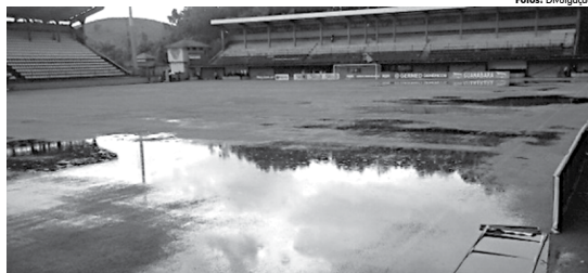
Fluminense venceu a Portuguesa por 3 a 0 com campo alagado devido às fortes chuvas que caíram no Rio

Os jogadores dos dois times se mostraram a favor da realização da partida, até mesmo por causa do calendário apertado. "Eles (os jogadores) têm que me dar uma bronca por não querer o jogo", brincou o treinador. "Tenho que colocar uma coroa de flores na cabeça de cada um, pois tomaram uma decisão muito forte. Falei que a partida ficaria igual na parte técnica. Eles jogaram e ganharam. Minha contribuição foi zero", afirmou.