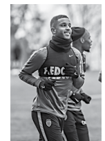
Atleta já treina no clube

O Real Madrid parece não ter aceitado muito bem o adiamento da partida contra o Celta de Vigo, pelo Campeonato Espanhol, que seria realizada no último domingo em Vigo. A revolta dos madrienhos com a não realização do evento, por conta dos fortes temporais que atingiram a região da Galícia e causaram danos no Estádio Balaídos, é tratada com desconfiança pelos galaticios e ganhou destaque nos principais jornais da Espanha.