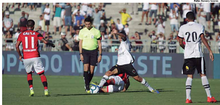
Em sua segunda partida pela Copa do Nordeste, o Botafogo de BR não deu importância à superioridade do Vitória e venceu os baianos por 4 a 2, no Arraô

Mas a ordem no Rubro-negro agora é esquecer a Copa do Nordeste e focar na estreia da Copa do Brasil. O adversário desta quarta é um grande time da Série A, a Ponte Preta. O campeão paraibano terá de vencer para conseguir passar para a segunda fase da competição. A derrota, ou um empate, elimina a Raposa da competição, já na primeira partida. (IM)