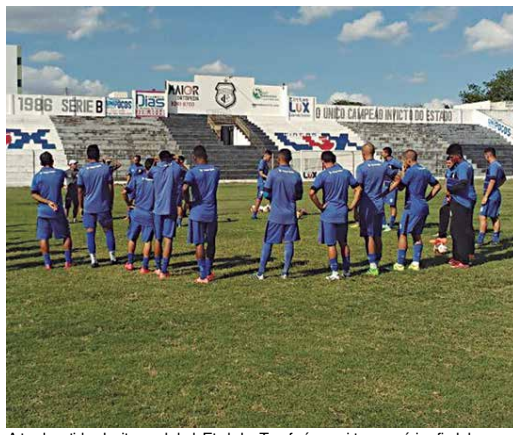
Antes da partida pela oitava rodada do Estadual, o Treze fará um amistoso no próximo final de semana

"Agora é continuar treinando forte e aguardar uma outra oportunidade de mostrar meu futebol. O treinador vai escalar quem estiver melhor no momento. Quando surgir a chance, vou agarrar de novo, com unhas e dentes, para conseguir ser titular da equipe, e poder ajudar ao Auto Esporte", disse o atleta.