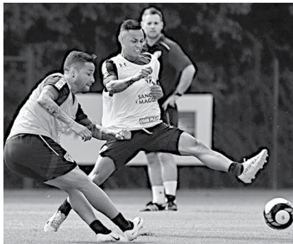
Tiagar paulista enfrenta o Moto Club, do Maranhão, em confronto de hoje à noite