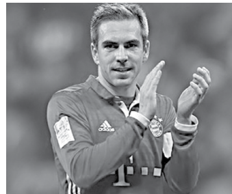
Capitão da seleção alemã na Copa 2014 surpreendeu com declaração