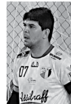
Velloso deixa o Taubaté SP

Há oito anos na presidência do Real Madrid, Florentino Pérez é praticamente uma unanimidade no clube como exemplo de boa gestão. No entanto, em algum momento, o dirigente deixará o cargo no clube e precisará de algum sucessor. E um dos candidatos pode ser um famoso tenista espanhol. Sim, tenista. Rafael Nadal, ex-número 1 do mundo e dono de 14 títulos de Grand Slam, disse em entrevista ao "Marca" que considera ser presidente dos galáticos no futuro.