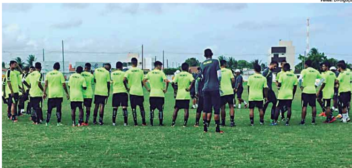
Botafogenses aproveitam folga na tabela de jogos para aperfeiçoamento de alguns jogadores ensaiadas, visando partida diante do Internacional-PB

Apesar da atuação fraca do Botafogo no Sertão, quando o time pouco criou em termos de chances de gol, o técnico Iltmar Schulle gostou do rendimento da equipe. "Acho que a equipe foi bem. Conseguiu anular bem a parte ofensiva do Paraíba, e saímos do Sertão com mais uma vitória, que nos deu uma maior tranquilidade e a liderança isolada. Agora teremos uma semana para recuperar a equipe, até o início do retorno", disse o treinador.