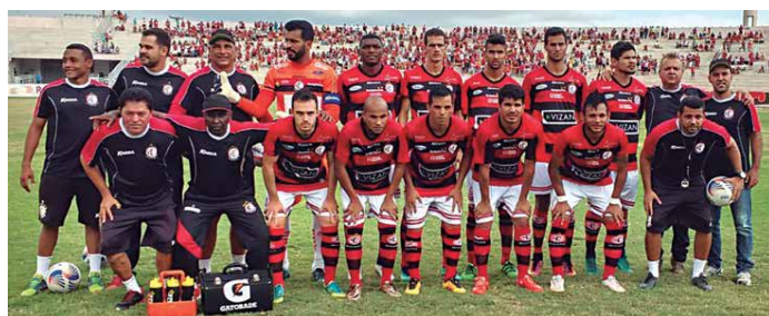
O Campinense Clube, vice líder do Estadual, se reapresenta ontem para dar início às atividades visando o jogo, como Náutico, na Arena Pernambuco

No Sertão, dois clubes vivem situações completamente diferentes. Enquanto o Sousa vem crescendo de produção, o Paraíba continua na lanterna da competição. Depois da vitória contra o Serrano, por 4 a 2, o Dinossauro pulou para a oitava posição, com 9 pontos, ultrapassando o CSP, que agora é o penúltimo, com apenas 8 pontos. Já o Paraíba perdeu em casa para o Botafogo, e permanece com apenas 6 pontos, na lanterna da competição. Na próxima rodada, os dois times se encontram, no Marizão, em Sousa. Será no dia 1 de março, às 20h30. Neste jogo, o Paraíba vai estreitar o técnico Neto Maradona, que substituiu Alexandre que pediu demissão, após a derrota para o Botafogo.