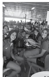
Seleção feminina de handebol de areia do Brasil.

Campeonato Mundial, que será disputado nas Ilhas Maurício ainda este ano. O Brasil, por ser uma das principais potências da modalidade, tem o claro objetivo de se manter no topo também nas categorias de base. No adulto, a seleção masculina é tricampeã, por isso, o trabalho com os mais jovens tem sido feito de forma intensa. Antes desta fase, as comissões técnicas observaram atletas no Campeonato Brasileiro e fizeram seleções regionais para chegar ao grupo que se apresenta agora.