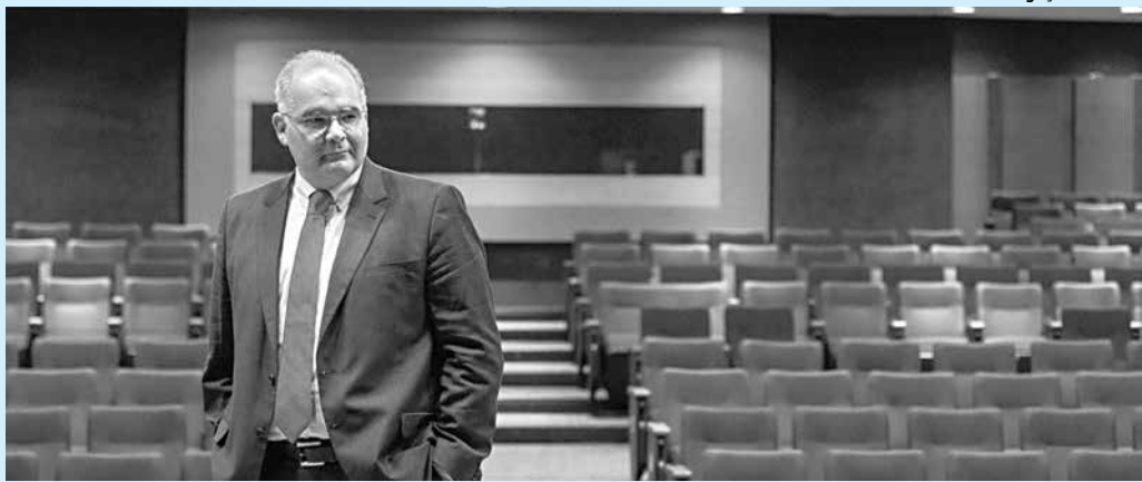
Procurador do Ministério Público de Contas da Paraíba vai integrar tribunal durante dois anos