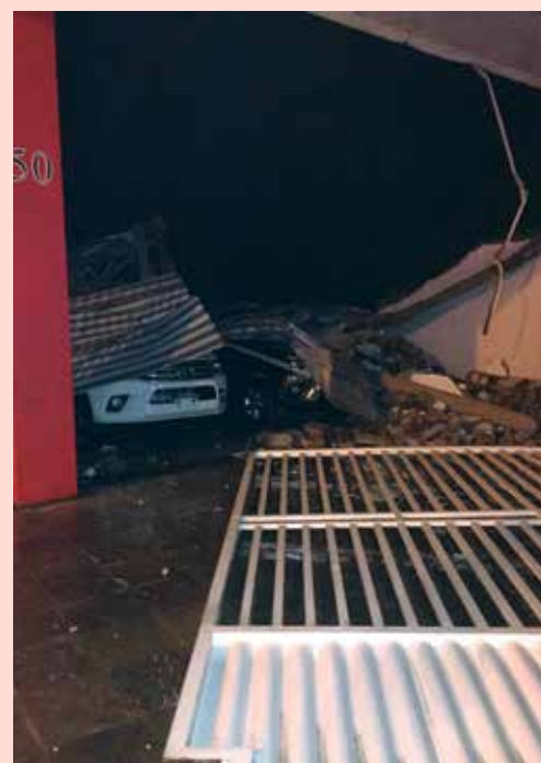
Ventos derrubaram teto de loja de veículos