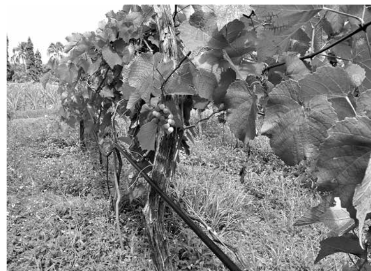
Emepa testa cultivo de uva para criar alternativa de renda na região

O objetivo é avaliar o desenvolvimento em produtividade da videira Isabel Precoce em condições pedoclimáticas da mesorregião