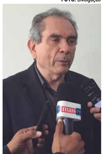
Senador se mostra confiante

Apontada como redenção do Nordeste, a transposição será a solução definitiva para o problema da seca que atinge mais de 12 milhões de nordestinos, em 390 muni-