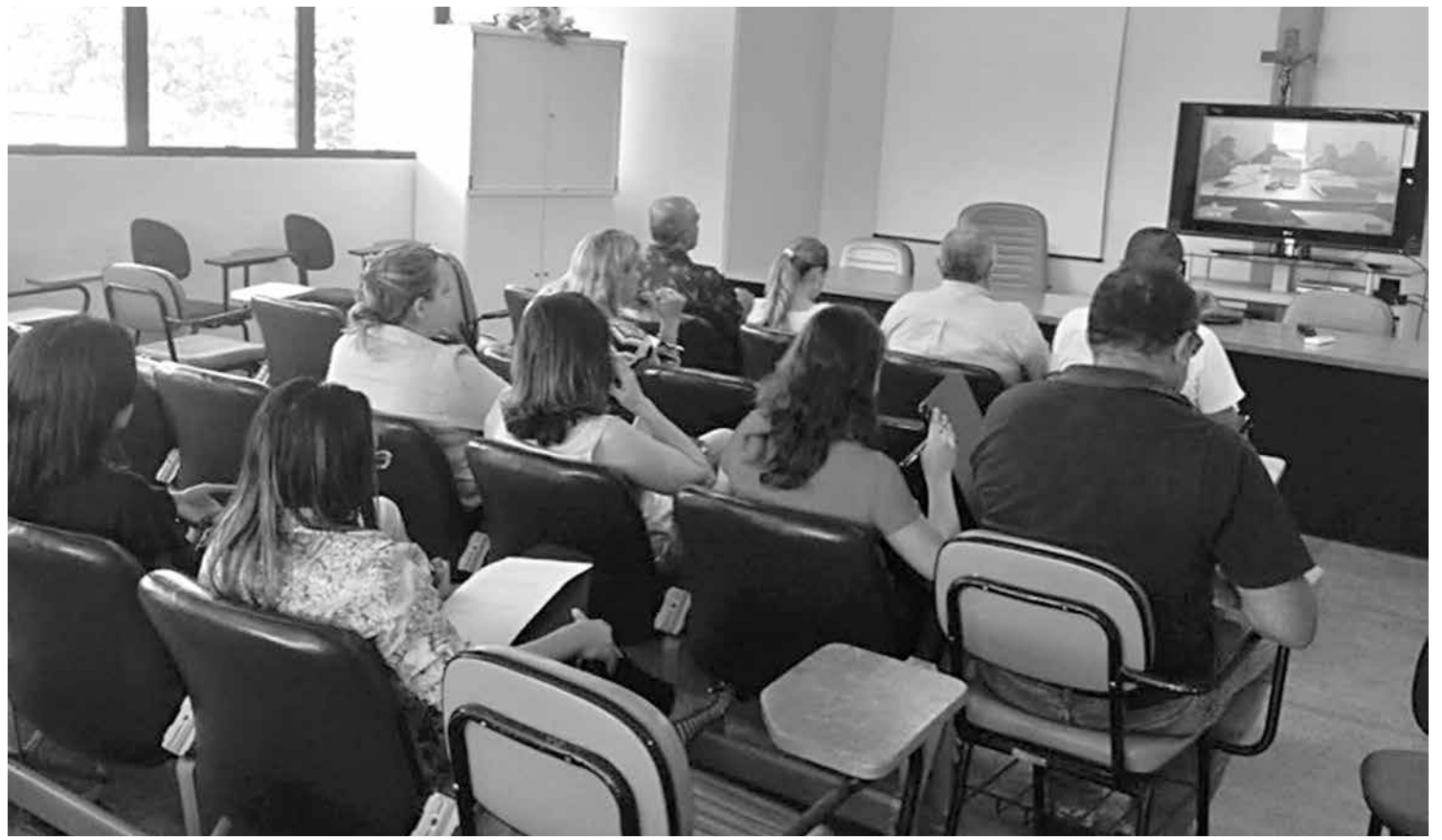
Primeira videoconferência de 2017 com a Sala de Situação Nacional e os estados do Nordeste foi realizada na última sexta-feira