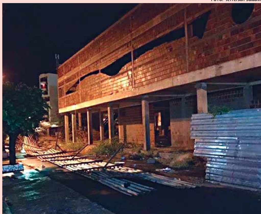
Tatames que cercam o prédio em construção que vai sediar o Teatro de Patos desabaram