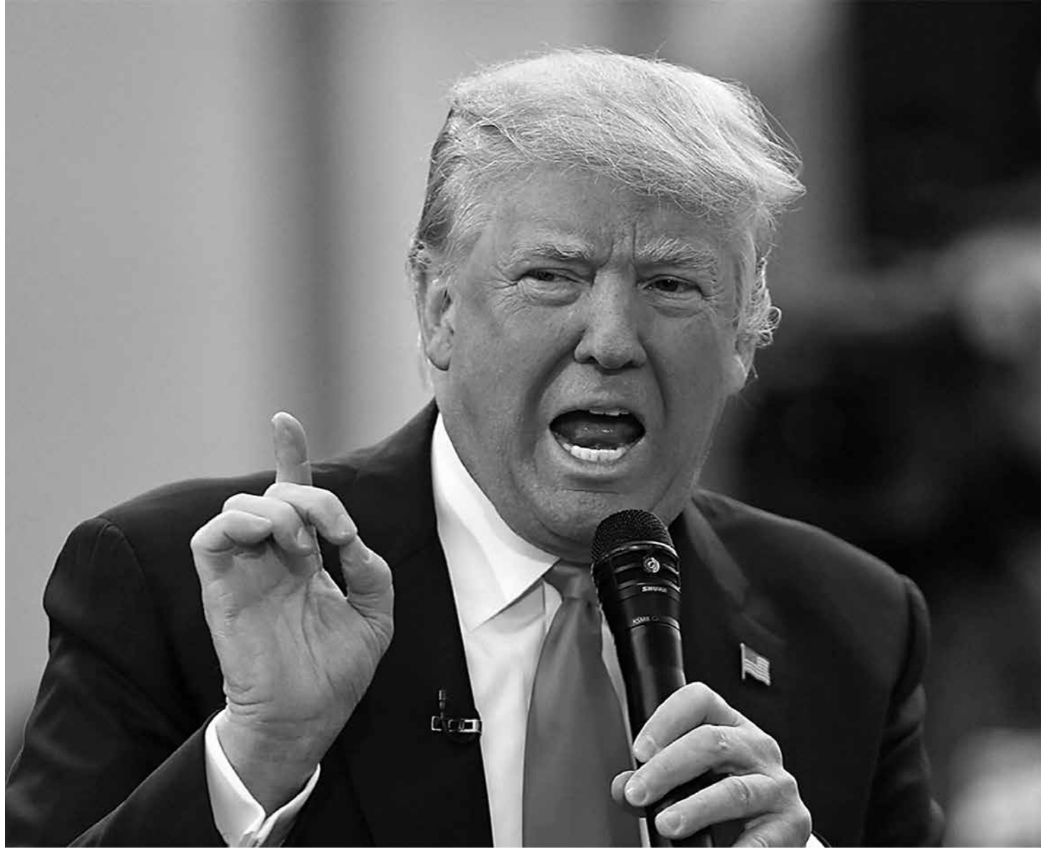
As nomeações do presidente eleito Donald Trump têm motivado críticas e polêmicas nos EUA até mesmo de seus correligionários

Os talibãs continuam com a sua campanha de ataques em todo o país, enquanto as negociações de paz fracassam