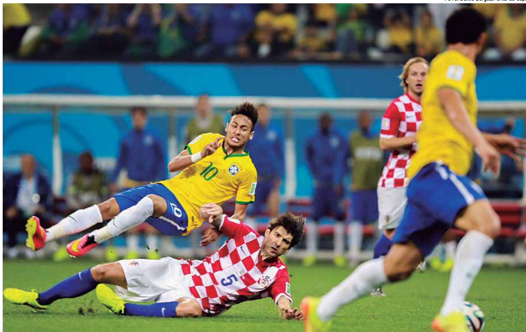
O Brasil, que participou de todas as Copas, não corre mais riscos de ficar fora, afinal o continente terá sete seleções a partir de 2026

A estimativa de receita da Fifa com o aumento de seleções em 2020 é de 12 bilhões de dólares