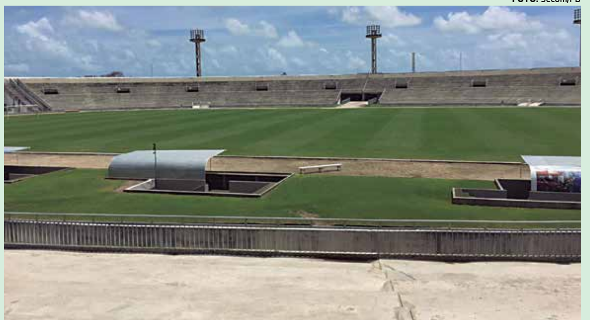
Gramado do Almeidaão parece um grande tapete verde e vem sendo bastante elogiado pela imprensa