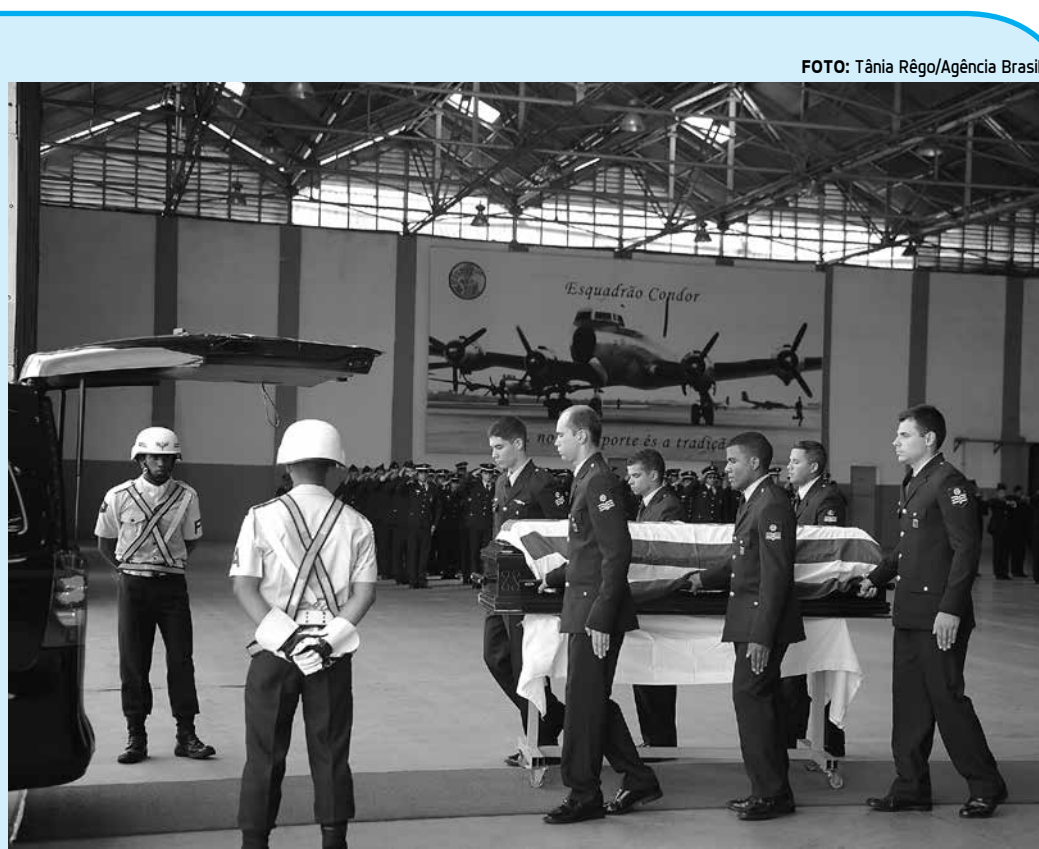
Cerimônia fúnebre do embaixador Kyriakos Amíridis aconteceu na Base Aérea do Galeão

Segundo informações da Caixa, a Carteira de Crédito Rural do banco ultrapassou R$ 7 bilhões de saldo em operações ativas. Para o ano-safra 2016/2017, que se encerra em junho de 2017, a Caixa deve superar o volume de R$ 10 bilhões.