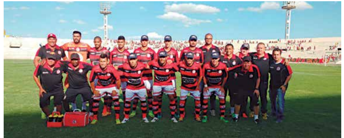
A equipe do Campinense que estreou com uma goleada diante do Serrano por 4 a 1 no último domingo

"A tendência é melhorarmos com a sequência de jogos, porque a equipe vai ganhando entrosamento e os jogadores