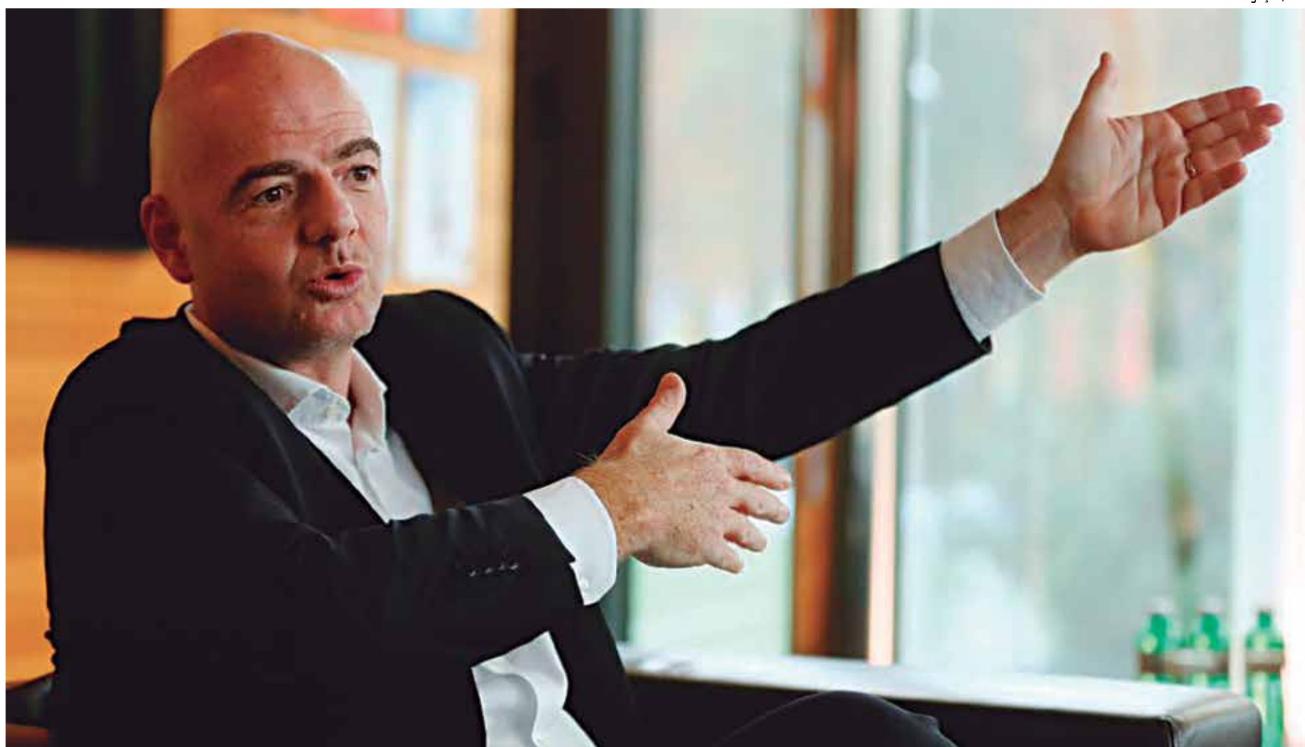
O presidente da Fifa, Gianni Infantino, mostrou força na reunião dessa terça-feira em Zurique e conseguiu aprovar a mudança que vai beneficiar todos os continentes

No Mundial da Rússia, que acontecerá em 2018, as receitas são estimadas em 3,54 bilhões de dólares (R$ 11,3 bilhões).