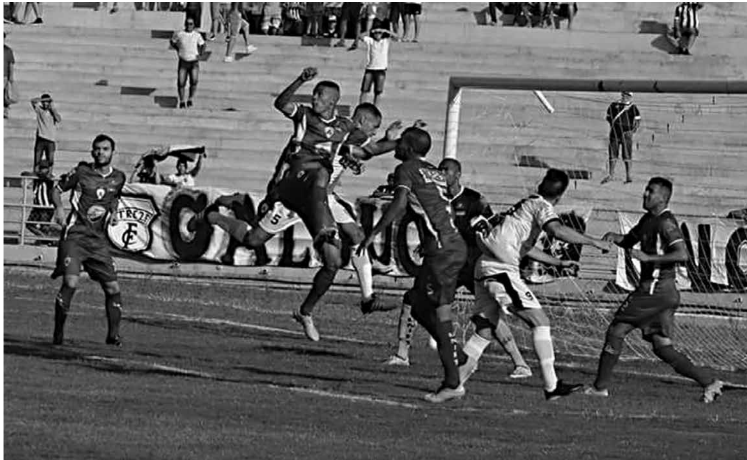
Na abertura do Campeonato Paraibano de 2017, o Treze venceu o Atlético por 1 a 0 e hoje faz seu primeiro jogo fora de seus domínios