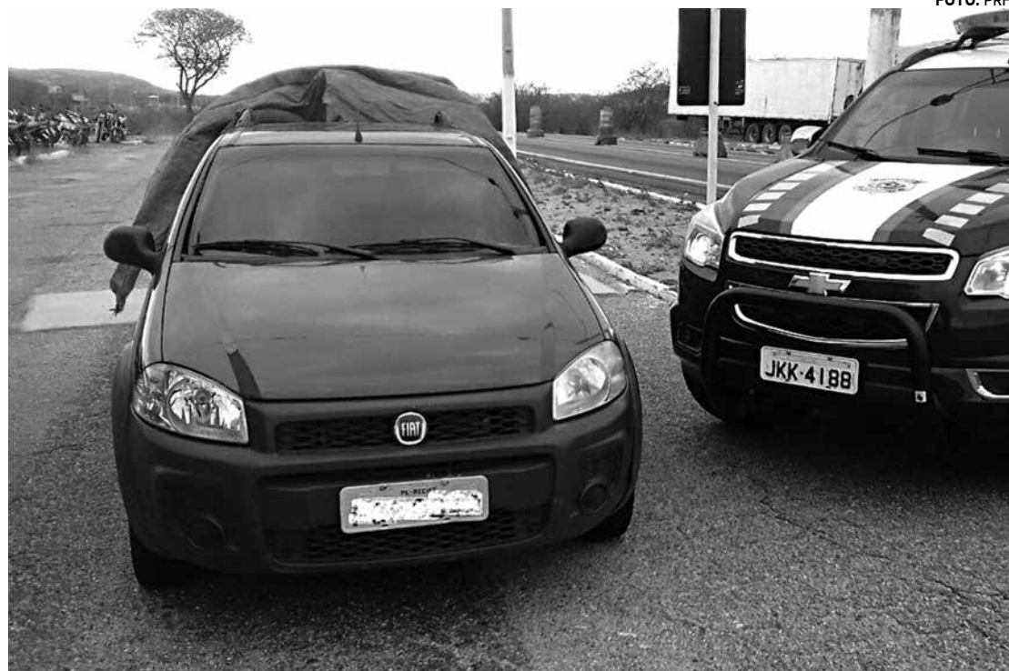
Fiat Strada transportava garrafas plásticas e não tinha espaço para criança, que viajava no assoalho

Os agentes perguntaram quem era a criança