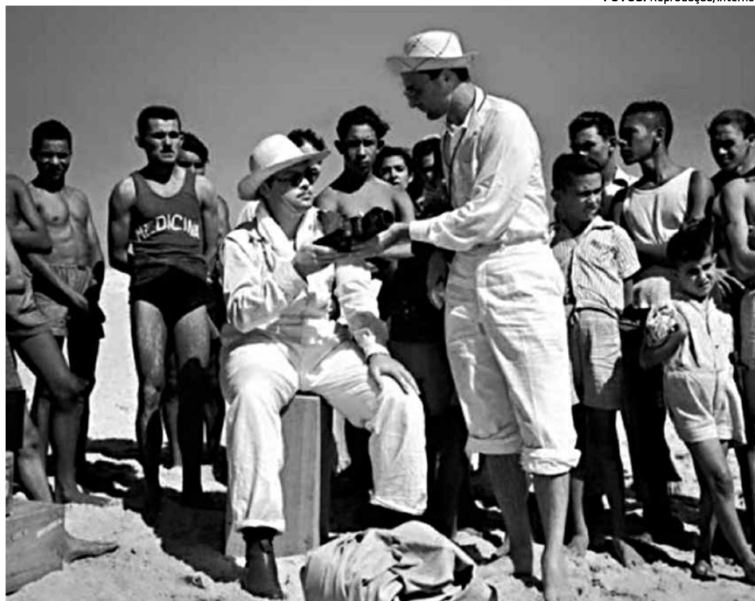
Cineasta Orson Welles durante a gravação da história dos jangadeiros cearenses, em Fortaleza

O Cine Diogo possuía um hall imponente, sala de espera em mármore de Carrara, moderno sistema de iluminação, palco com cortinas que se abriam ao som de gongos melódiosos e mutação de luzes coloridas, poltronas confortáveis, excepcional qualidade de projeção e refinado serviço de recepcionistas, tudo com o máximo requinte e qualidade.