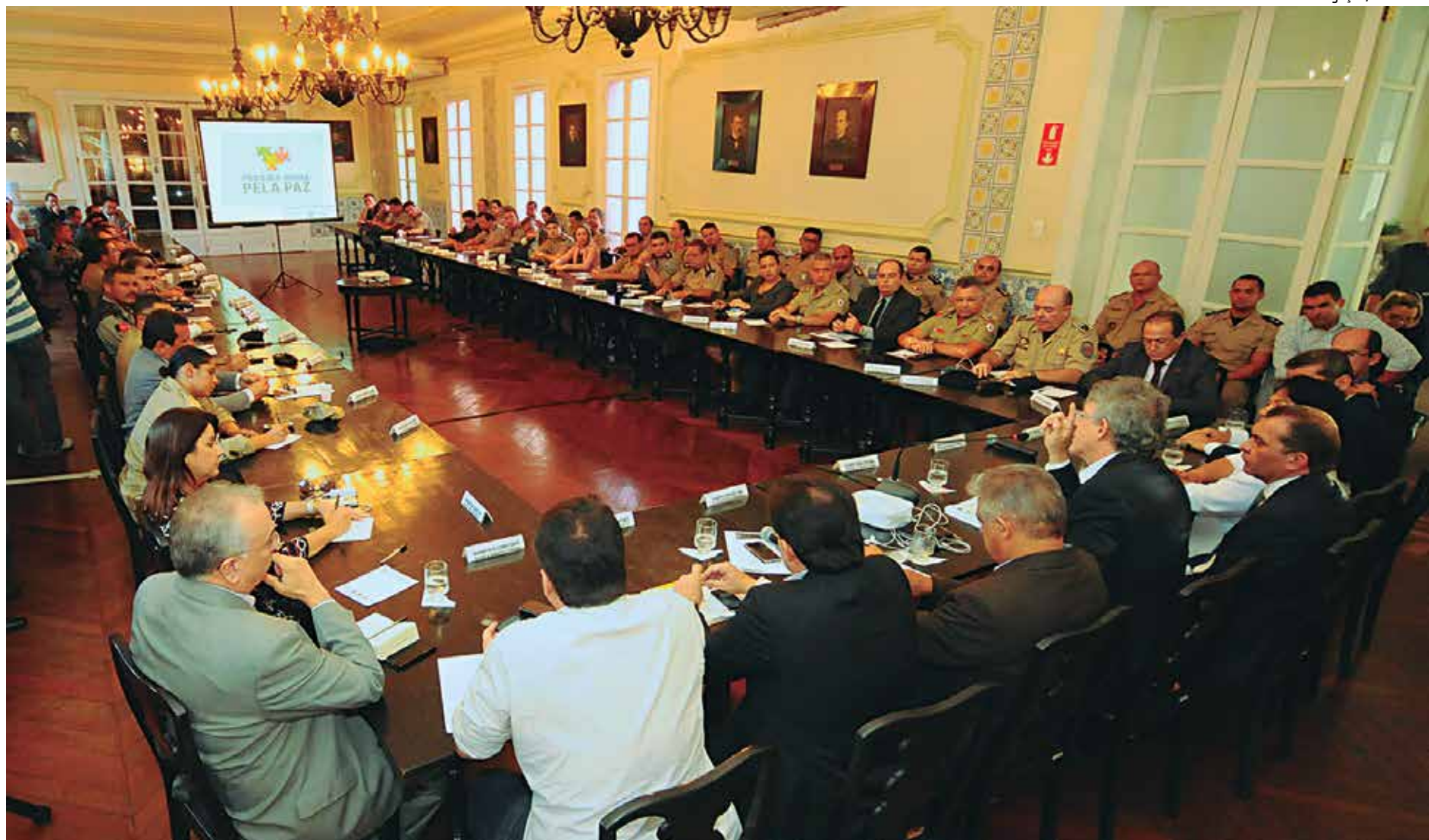
Com resultado apresentado ontem, a Paraíba passa a ser o único Estado do Brasil a atingir queda por cinco anos consecutivos, conforme Anuário Brasileiro de Segurança