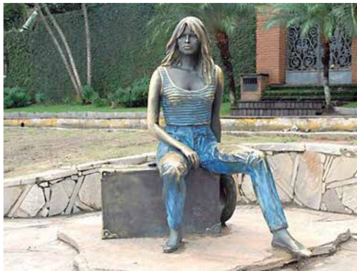
Brigitte Bardot é homenageada com estátua de bronze em Búzios

Algumas estátuas espalhadas pelo Brasil são um fator de atração de turistas, além de embelezarem monumentos e destinos brasileiros. A estátua do Laçador é uma delas e representa a tradição gaúcha para quem visita Porto Alegre (RS). Na Praça dos Três Poderes, em Brasília (DF), a obra Os Guerreiros - em homenagem ao Candangos -, simbolizam os construtores da capital federal que vieram de todas as regiões do Brasil e se tornaram cartão-postal da cidade. Ainda na capital federal, o Memorial JK, museu que preserva a memória do construtor da cidade, tem no gramado estátuas do casal Juscelino e Dona Sarah Kubitschek.