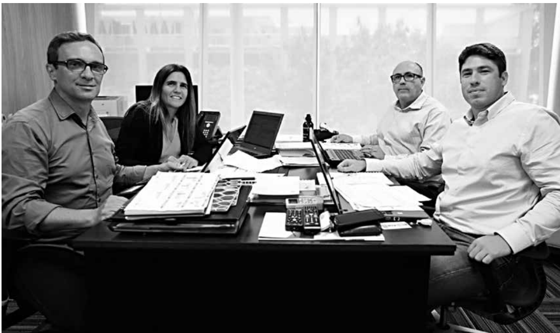
Comissão técnica da seleção feminina em reunião na CBF traçando novas metas para a temporada

dos 23 convocados, ou 21% do total, terminaram 2016 com o status de titulares em suas equipes.