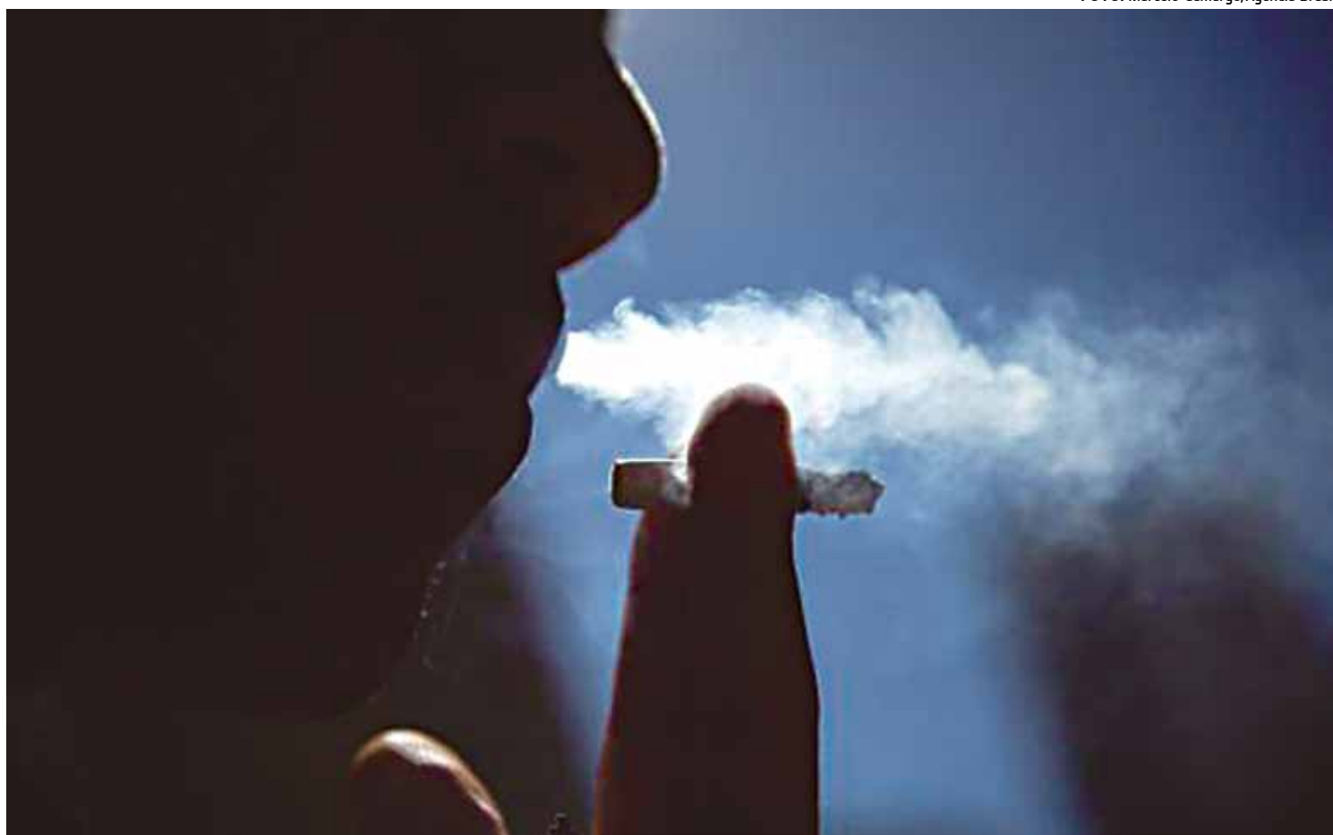
1,1 bilhão de fumantes têm até 15 anos de idade, 226 milhões são pobres em todo o mundo, afirma a Organização Mundial da Saúde