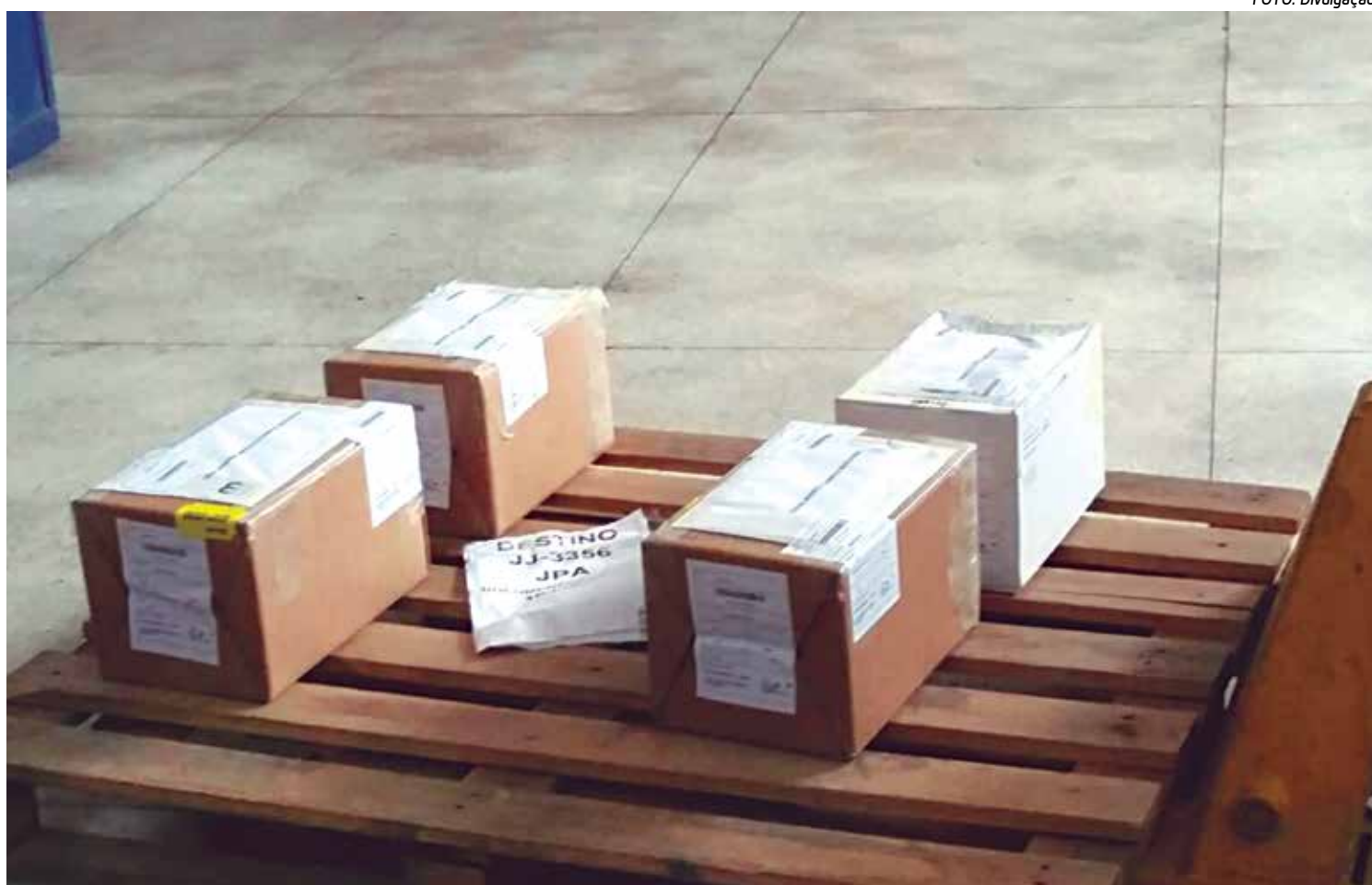
As urnas com as cinzas saíram de Madri na última segunda-feira, 18 dias após a cremação, chegando ontem em João Pessoa