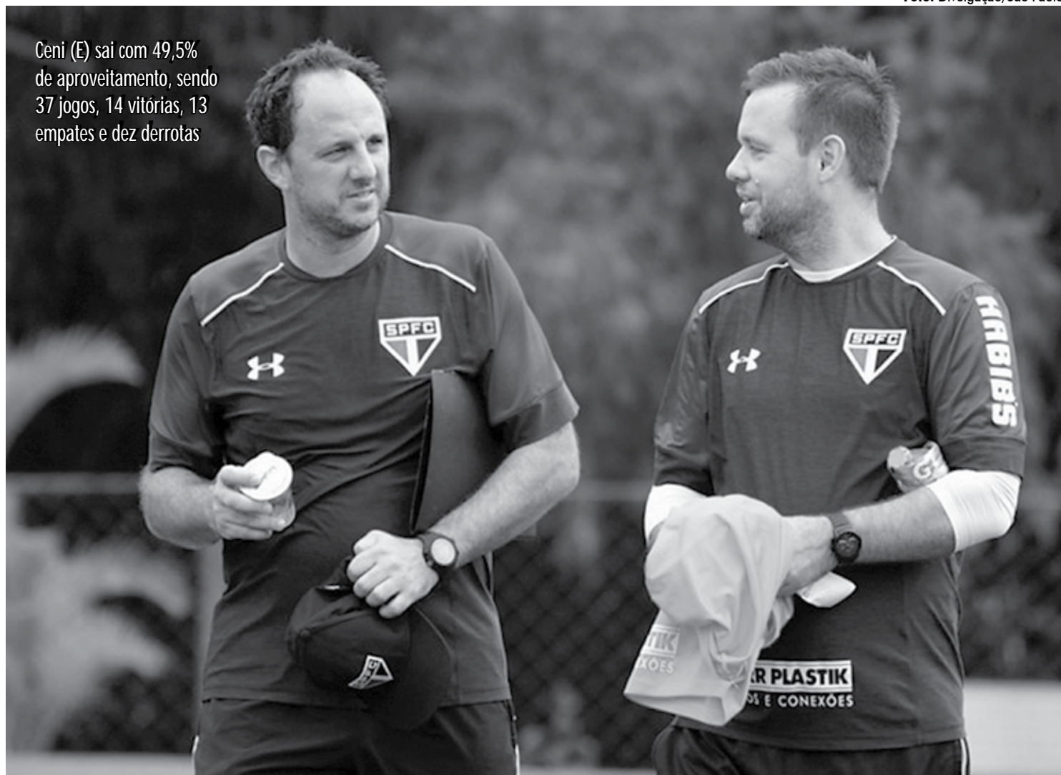
Ceni (E) sai com 49,5% de aproveitamento, sendo 37 jogos, 14 vitórias, 13 empates e dez derrotas

A demissão de Ceni se dá três dias após a saída de seu auxiliar, o inglês Michael Beale, que alegou problemas de adaptação ao Brasil para justificar seu pedido de demissão. É sabido, porém, que tanto Beale como Ceni estavam profundamente decepcionados