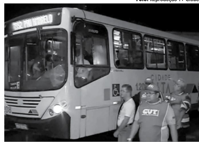
Sindicato pede manutenção do emprego dos cobradores e reajuste de 7%