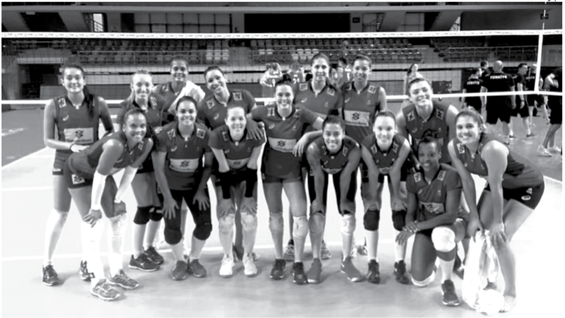
O Brasil viaja amanhã para Ancara, onde disputará a primeira etapa do Grand Prix de sete a nove de julho e o time verde e amarelo terá como adversários a Bélgica, a Sérvia e a Turquia

A central Carol se destacou e foi a maior pontuadora do confronto, com 13 acertos. A oposta Tandara, com 10 pontos, também pontuou bem pelas brasileiras. Pelo lado da Turquia, a atacante Nur foi a