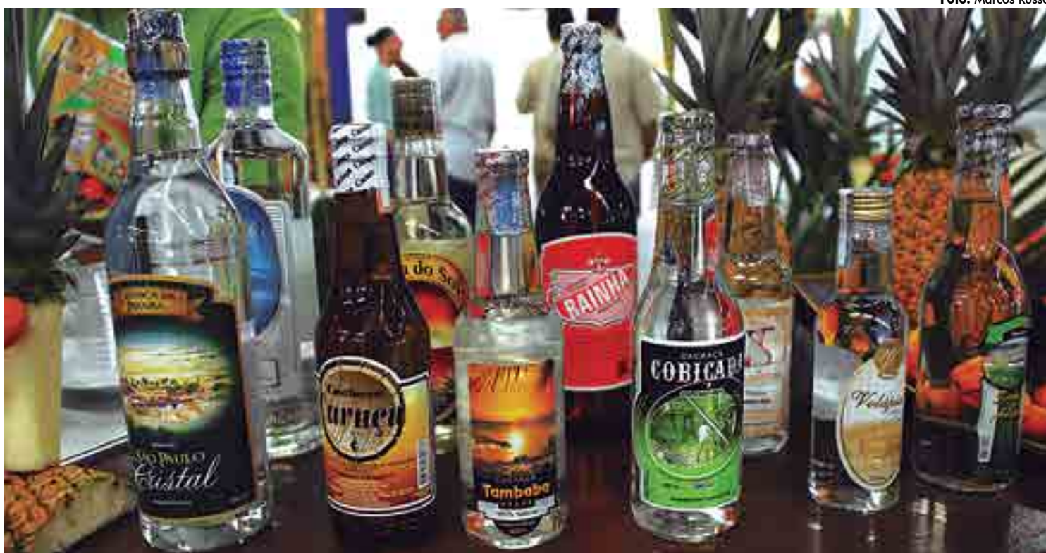
Maioria dos engenhos paraibanos utiliza micro-organismos próprios da cana-de-açúcar para efetuar fermentação natural da cachaça durante a produção

Mas não é só pelo sabor que as cachaças da Paraíba se distinguem. Hábitos de consumo adotados na região dão versatilidade à bebida e ampliam as possibilidades de combinações. "Costumes como apreciar a cachaça gelada ga-