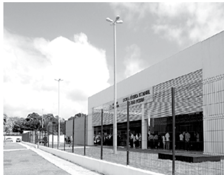
A Escola Cidadã Integral Técnica de JP foi a que teve maior número selecionados

Eles também vão receber seguro de saúde durante o período em que estiverem residindo no país de destino.