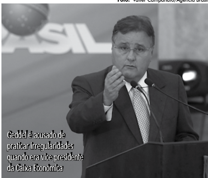
Geddel é acusado de praticar irregularidades quando era vice-presidente da Caixa Econômica

No pedido enviado à Justiça, os autores afirmaram que o político tem agido para atrapalhar as investigações. O objetivo de Geddel seria evitar que o ex-presidente da Câmara Eduardo Cunha e o próprio Lúcio Funaro firmem acordo de colaboração com o Ministério Público Federal (MPF). Para isso, tem atuado no sentido de assegurar que ambos recebam