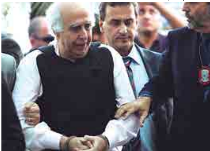
Ex-médico foi condenado a 181 anos de prisão por 48 estupros de 37 pacientes