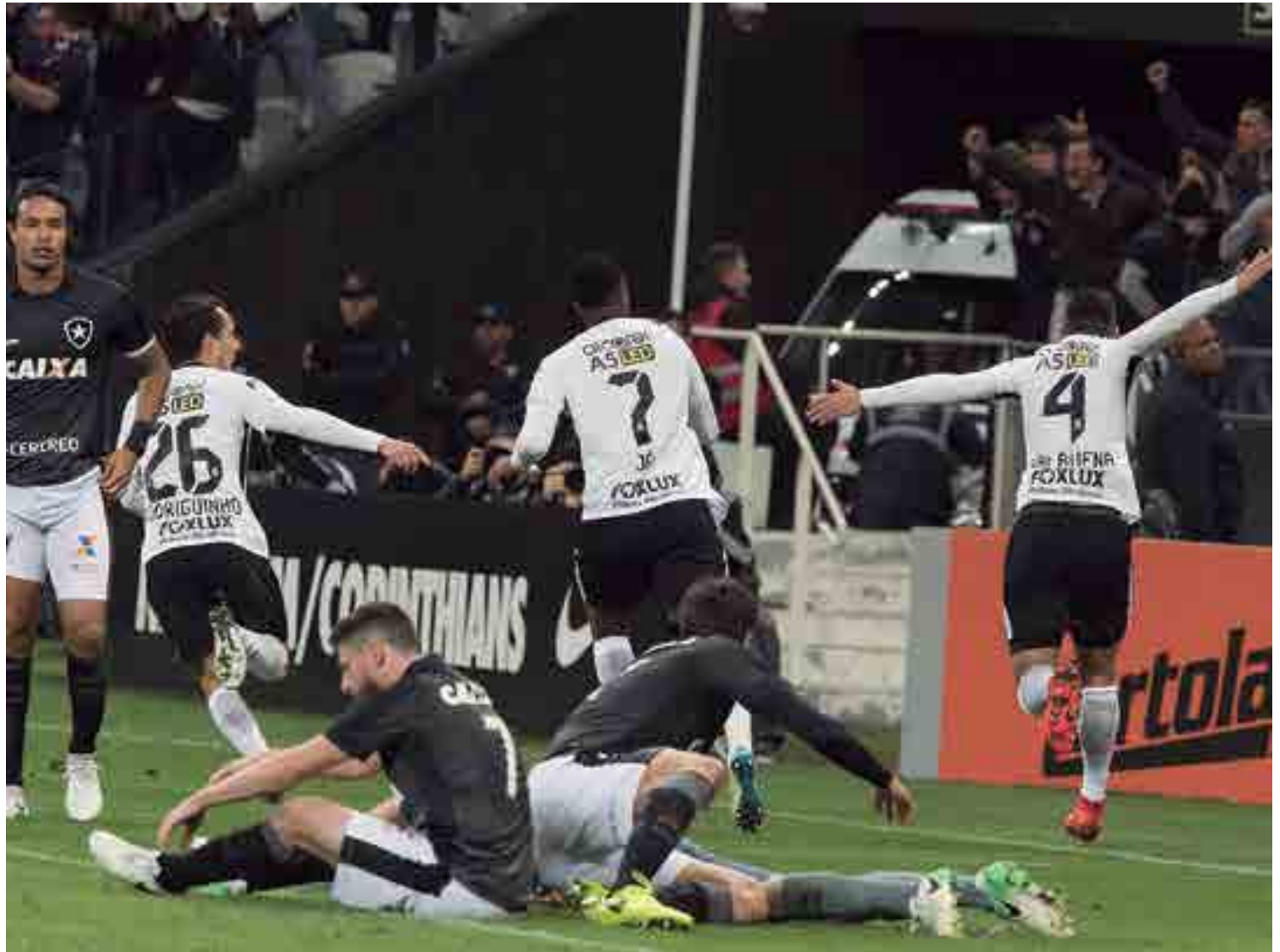
Gol e festa na Arena Itaquera: uma comemoração que já se repetiu 198 vezes e hoje pode chegar ao número 200 no jogo contra o Atlético-PR

“A motivação vem deles mesmo. Num campo cheio, televisão, já é motivante por si. Acho que o jogo mais complicado é contra o último. Mas em um campo bom, com todo mundo querendo ganhar, estádio cheio... o treinador tem que colocar as ideias em prática. Jogar no Atlético-PR é motivante. É mais fácil para o treinador do que contra o último” completou.