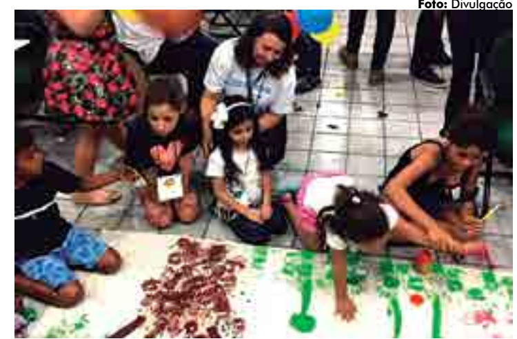
As crianças encerraram o dia de atividades confeccionando um painel ecológico

"A Sudema compreende que a educação ambiental é a ferramenta fundamental no processo de transformação e conscientização social sobre as questões ambientais. O nosso intuito é formar cidadãos esclarecidos sobre a importância da sustentabilidade e da preservação do meio ambiente. Visamos que as crianças e jovens abracem a causa e sejam os multiplicadores das boas