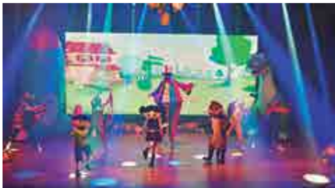
O Show da Luna remete às descobertas e brincadeiras das crianças