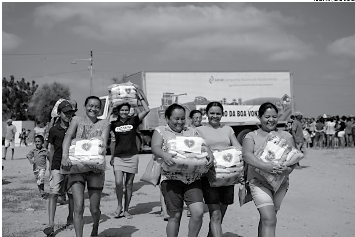
Objetivo é mobilizar a sociedade para fazer doações de alimentos e cobertores que são entregues a famílias que enfrentam seca ou baixas temperaturas

Um das iniciativas é a campanha Diga Sim!, por meio da qual a LBV mobiliza a sociedade a fazer doações e, mediante os recursos, entrega, neste período do ano, cestas de alimentos e cobertores para famílias que enfrentam a seca e as baixas temperaturas. A campanha, nesta edição,