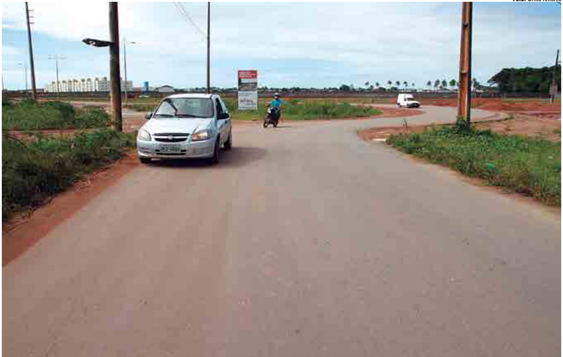
Com extensão de 9km, a obra rodoviária, quando concluída, vai beneficiar diretamente 300 mil pessoas da Grande João Pessoa, além dos turistas que visitam o Litoral Sul paraibano

Os serviços abrangem o trecho do entroncamento da BR-101/Bairro Gervásio Maia/Colinas do Sul/Valentina de Figueiredo/Muçumagro/entroncamento da PB-008, com uma extensão de 9 km em pista dupla de sete metros cada e mais can-