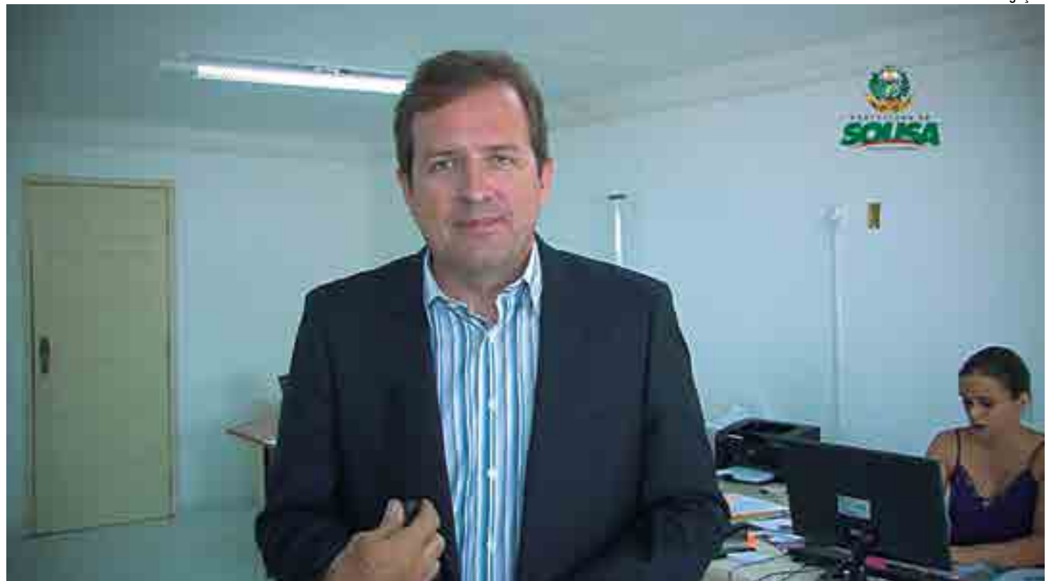
Prefeito destacou ainda que gesto serve também para afastar qualquer possibilidade de estremecimento na relação com o vice, que segundo ele, é cultivado pela oposição