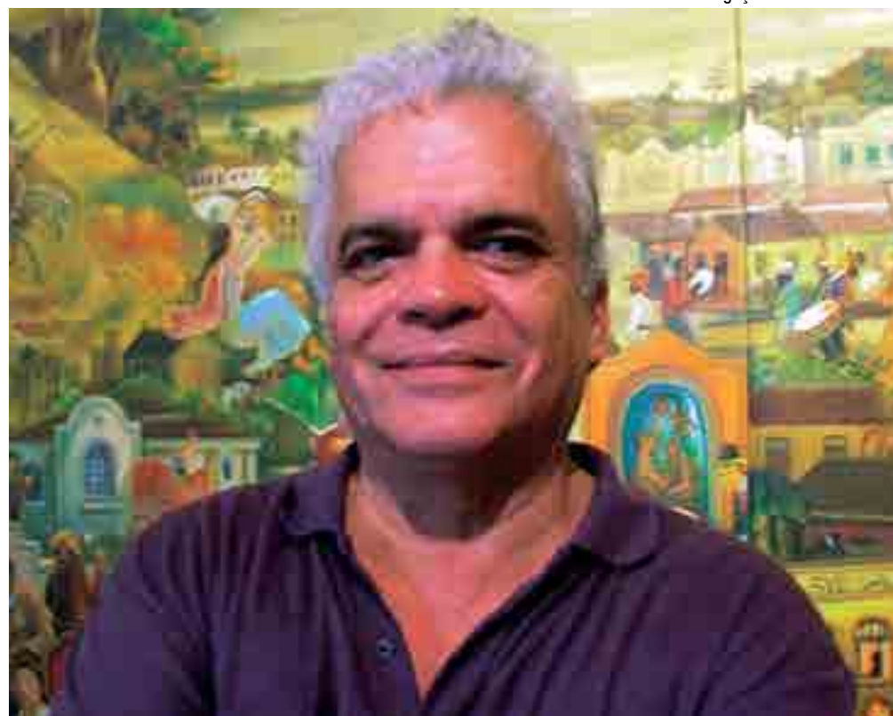
Mais de 50 obras de Flávio Tavares compõe a exposição intitulada "A Linha do Sonho", que já esteve em cartaz na Usina Cultural Energisa, na capital