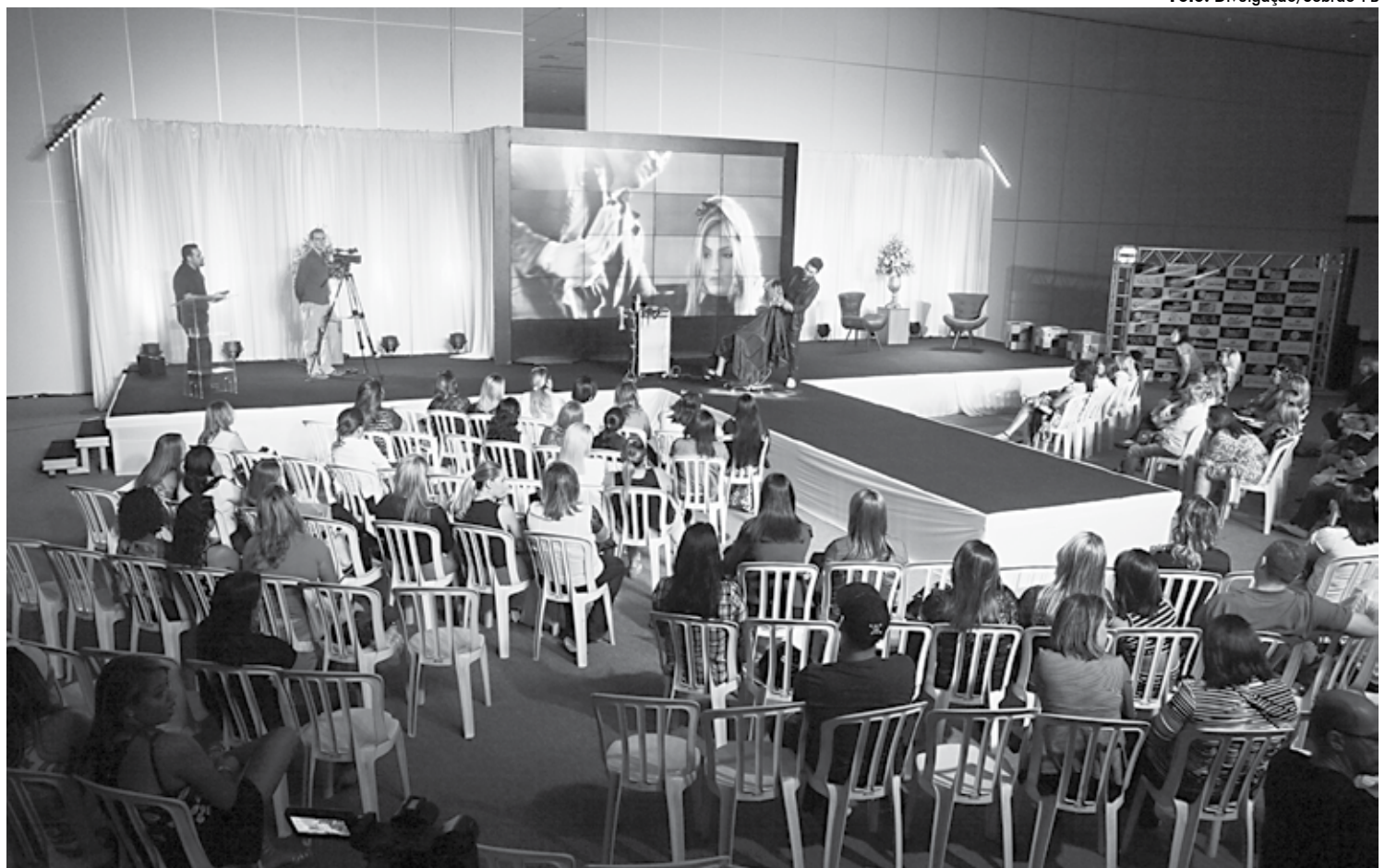
Feira da Beleza vai apresentar os mais recentes lançamentos do mercado em serviços como tratamentos do cabelo, barbearia, limpeza e massagem facial