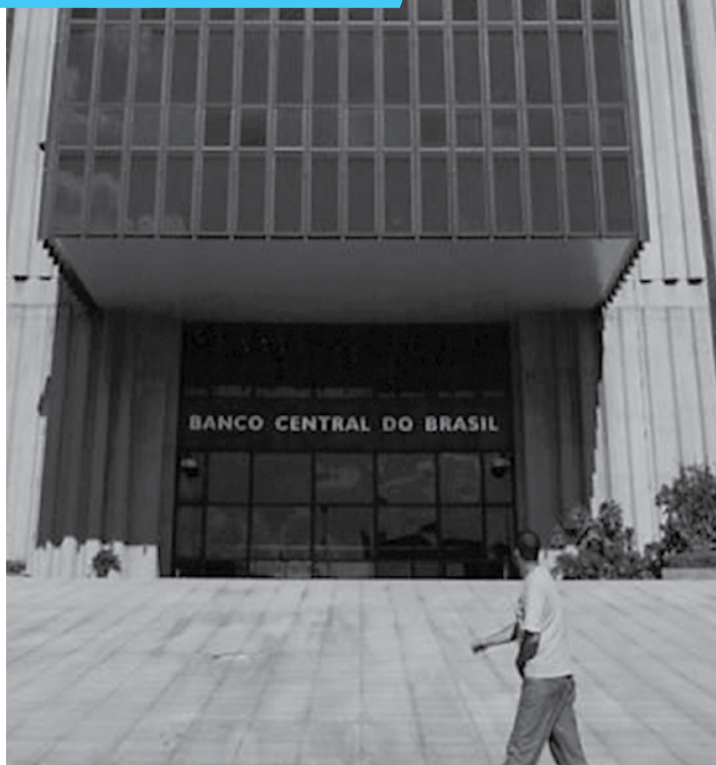
Banco Central divulgou estudo que apontou crescimento de 1,4% do PIB em meio à estabilização da economia