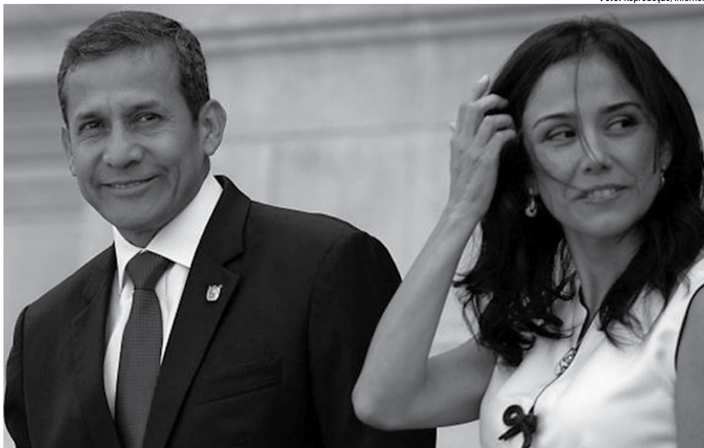
O ex-presidente Ollanta Humala e Nadine Heredia vão cumprir prisão preventiva por lavagem de dinheiro relacionada a doações irregulares de campanha