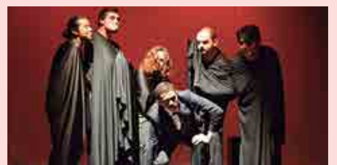
Espectáculo Vozes de uma Sombra, do grupo de teatro EmCena

O espetáculo é uma homenagem ao poeta Augusto dos Anjos, eleito paraibano do século. São sete atores em