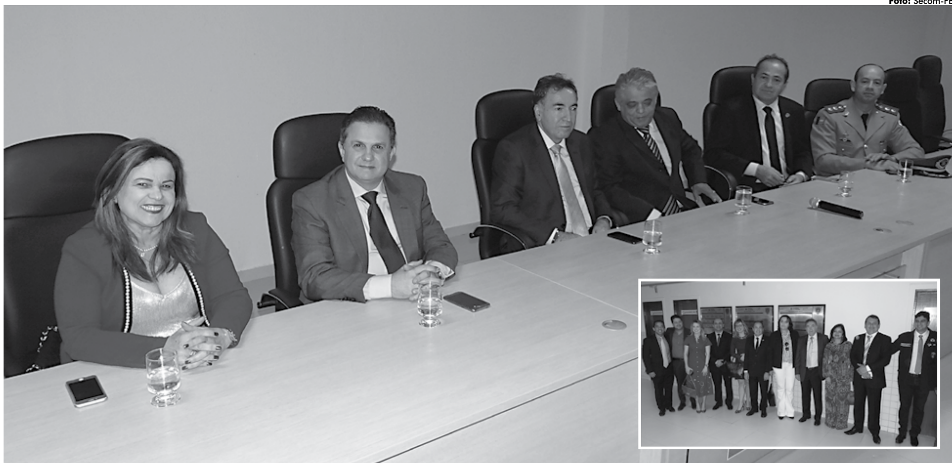
Secretário da Segurança e Defesa Social, Cláudio Lima (4º, da esquerda para a direita), na companhia de outras autoridades durante a solenidade de conclusão do curso na sede da Academia da Polícia Civil

As aulas foram ministradas na Acadepol, umas das instituições mais modernas do país em