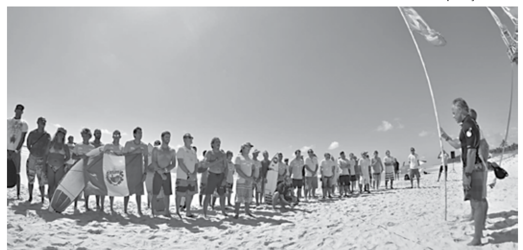
Atletas de vários Estados devem participar da competição em Baía de Maracáipe, na cidade de Ipojuca