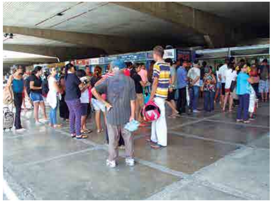
Na Paraíba, os destinos mais procurados pelos passageiros são os municípios de Campina Grande, Cajazeiras e Patos

De acordo com a administração do terminal, as escalas de horários serão mantidas e não haverá ônibus extras no período junino