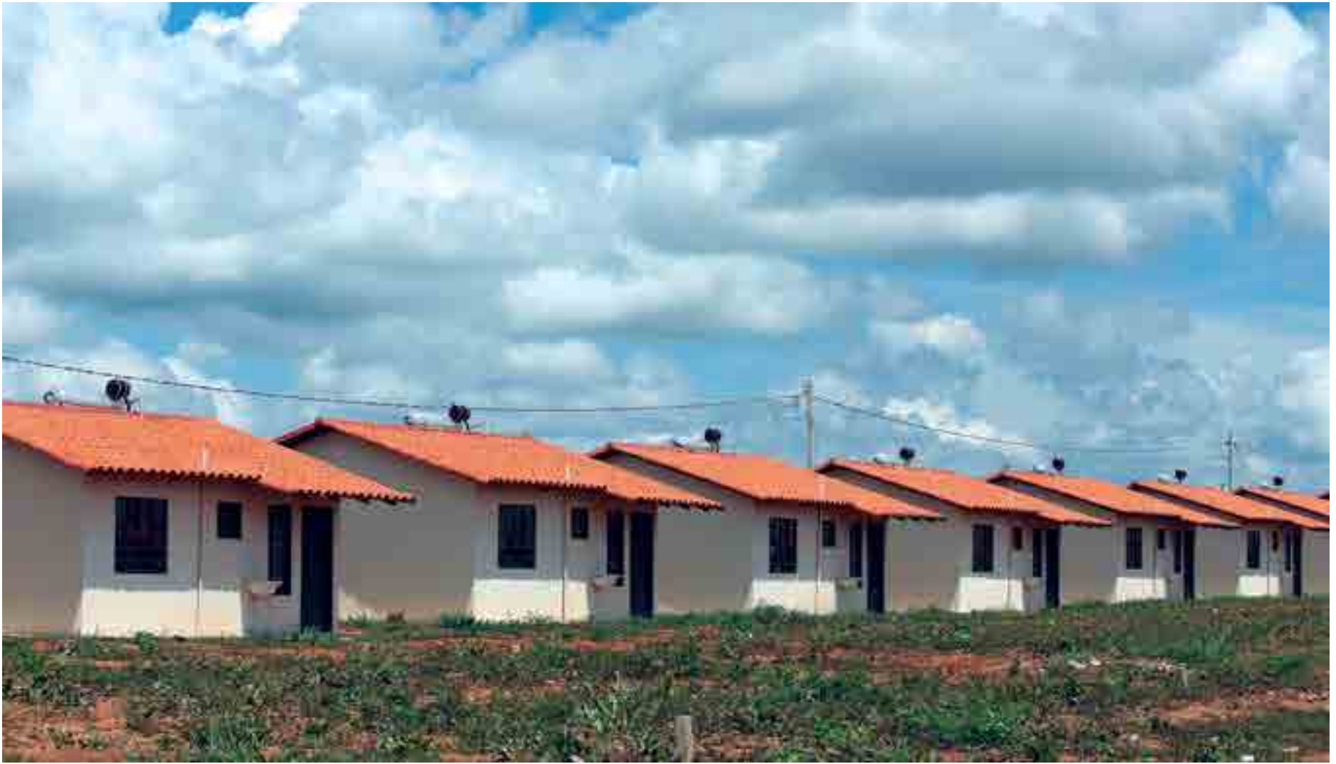
A linha Pró-Cotista para a aquisição de imóveis pela Caixa pode ser contratada por trabalhadores com pelo menos 36 meses de vínculo com o Fundo de Garantia do Tempo de Serviço (FGTS)

A linha Pró-Cotista pode ser contratada por trabalhadores com pelo menos 36 meses de vínculo com o FGTS. Também é preciso ter saldo na conta do FGTS de pelo menos 10% do valor do imóvel e estar trabalhando. A taxa de juros é de 8,66% ao ano.