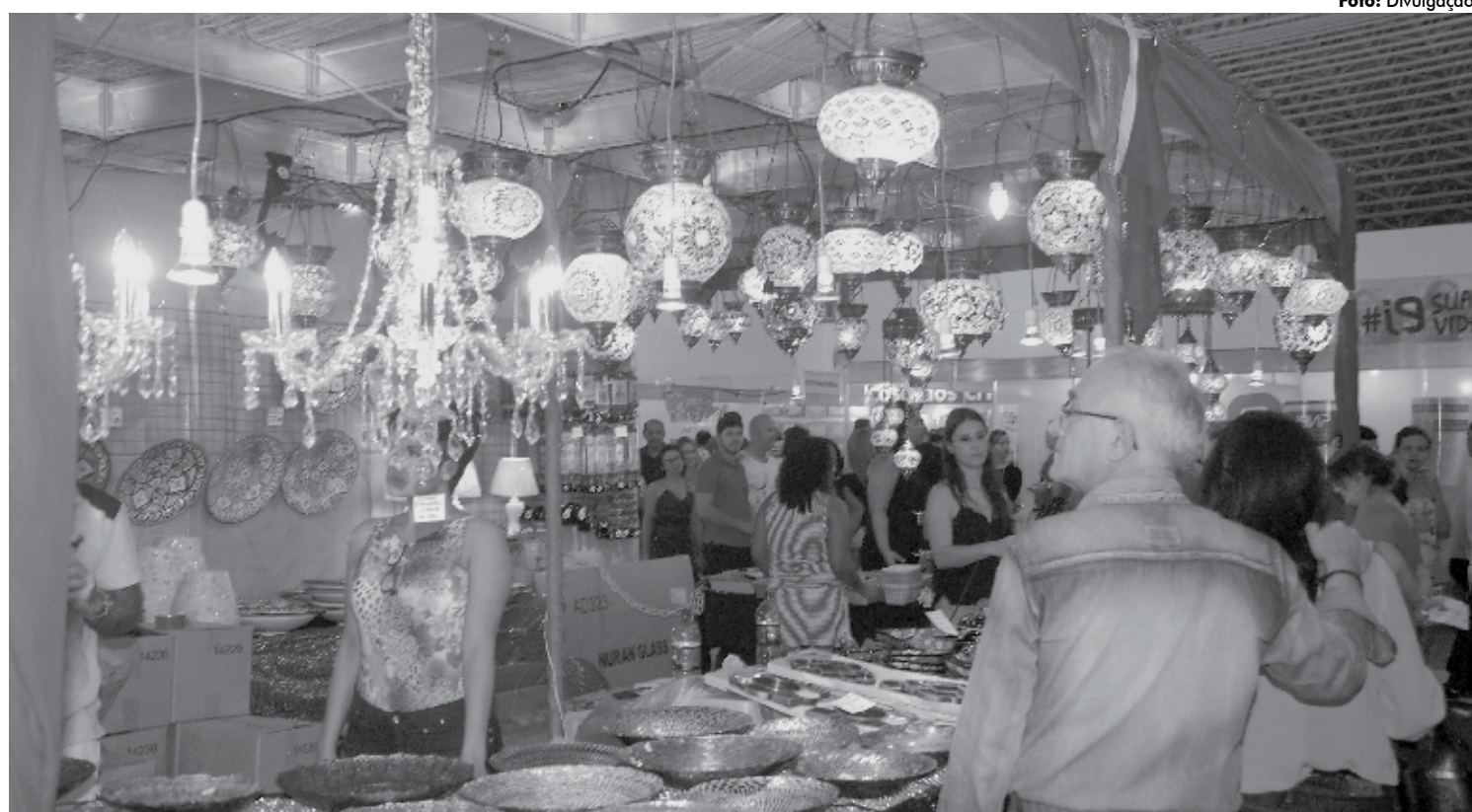
O artesanato internacional na Multifeira Brasil Mostra Brasil tem confirmados estandes da Índia, Turquia, Egito, Bolívia, Peru, França e Japão

A 23ª edição da Multifeira Brasil Mostra Brasil acontece de 14 a 23 de julho, no Centro de Convenções de João Pessoa, das 15h às 23h. Mais informações nos fones: 3042 5840, 988424445.