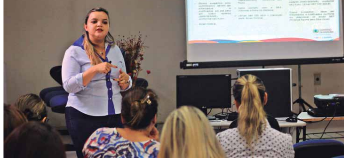
Participaram da qualificação aproximadamente 50 profissionais no auditório do Centro Formador de Recursos Humanos da Paraíba (Cefor-PB)