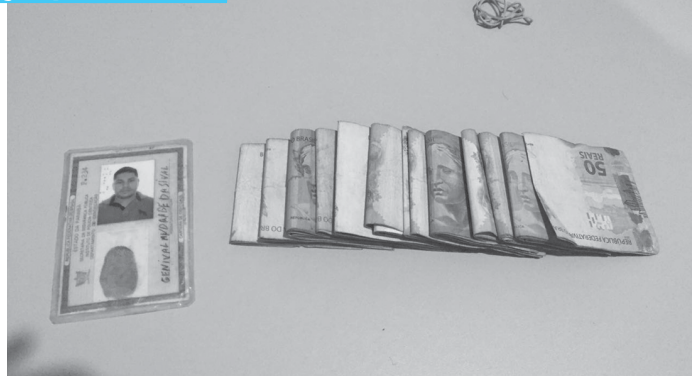
Quarta em dinheiro estava em poder do acusado, que na ocasião da prisão apresentou documento pessoal falso para as policiais militares