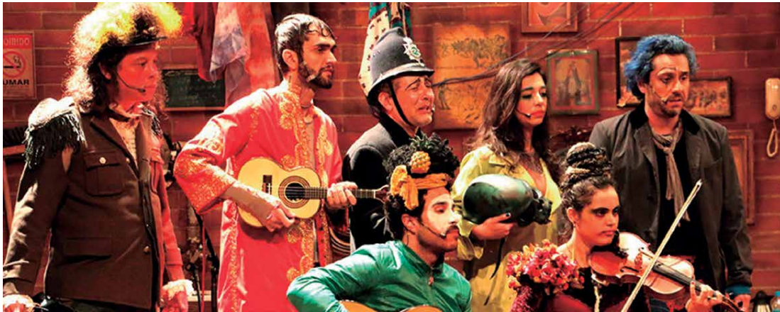
Os atores tramam o drama que retrata o cotidiano de artistas "mediocres", que esperam a oxalá para obter trêmicas e, nesse período, há espaço para divergências, perspectivas e conflitos nas sucessões e fracassos.