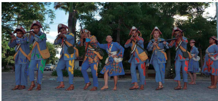
O coletivo de artistas já se apresentou em diferentes estados brasileiros e em outros países como Portugal, França, Espanha e Coreia do Sul