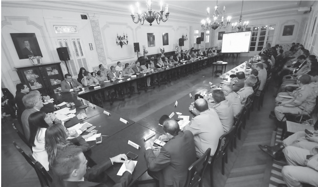
Ministros foram apresentados durante reunião de monitoramento no Palácio da Federação e confirmam a tendência de redução de crimes contra a vida no Estado desde 2011 quando foi implantado o programa Paraíba Unida pela Paz