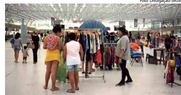
Evento de arte, artesanato, gastronomia, brechó, variedades e shows

A Feirinha é uma iniciativa da Fundação Espaço Cultural da Paraíba (Funesec) em parceria com o Programa de Artesanato da Paraíba (PAP) e tem como objetivo estimular a economia criativa, contando com adesões de artesãos paraibanos e de outros estados da região, a exemplo do Rio Grande do Norte e Pernambuco, que estiveram presentes em várias