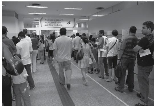
Maior número de queixas é relacionado a débito em conta não autorizado pelo cliente no Banco do Brasil

O BC informou que o ranking, disponibilizado há 14 anos, passará por mudanças. A primeira delas já está implementada: de bimestral a divulgação passará a ser trimestral. "Detectamos que a elasticidade maior quanto ao prazo permite uma massa