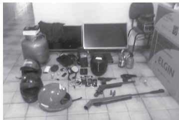
Foram apreendidas duas armas, armas e munições dos criminosos

Segundo informações, a Polícia Civil analisa novas provas obtidas e pode deflagrar uma terceira fase da Operação Gabarito.