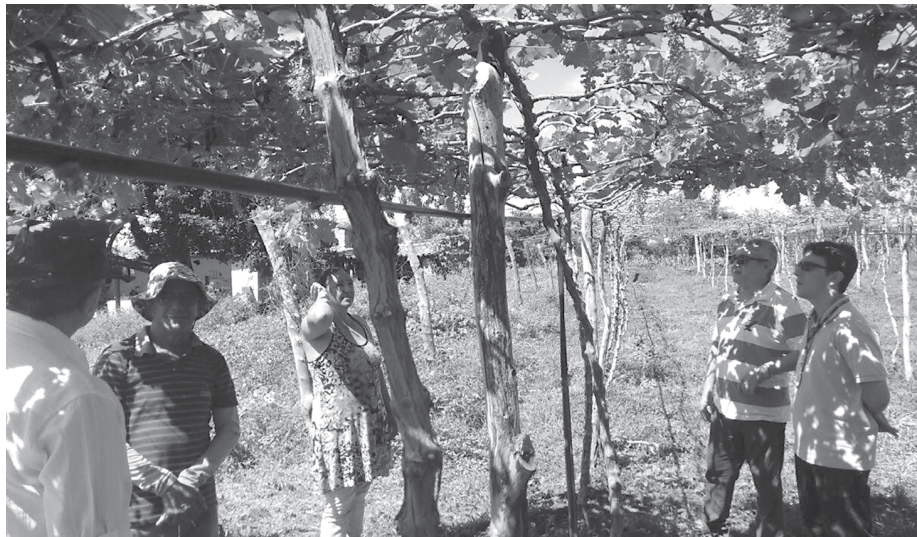
Agricultor trabalha numa área plantada de 0,6 hectare com uvas do tipo Itália e Rubi, utilizando o sistema latada de irrigação por gotejamento e vende produção na própria cidade

Toda a produção de uva é comercializada no município, mas já existe procura de consumidores de cidades vizinhas depois que tomaram