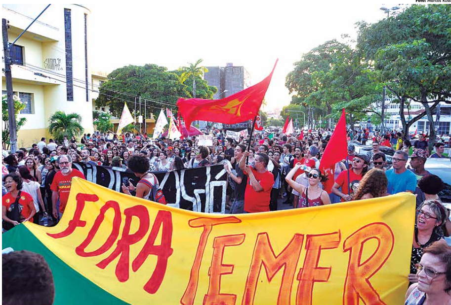
Centena de manifestantes de "Fora Temer, Diretas Já" reunidos às 16h na capital, em frente ao Liceu Paraibano e seguiram a caminhada das manifestantes até o porto do CamFes

Ainda ontem, a Presidência da República divulgou nota na qual informa que o presidente Michel Temer "jamais solicitou pagamentos para obter o silêncio do ex-deputado Eduardo Cunha". Em pronunciamento à nação ontem à tarde, Temer afirmou que não irá renunciar ao cargo e exigiu uma investigação rápida na denúncia em que é citado, para que seja esclarecida. "Não renunciarei. Repito não renunciarei", disse.