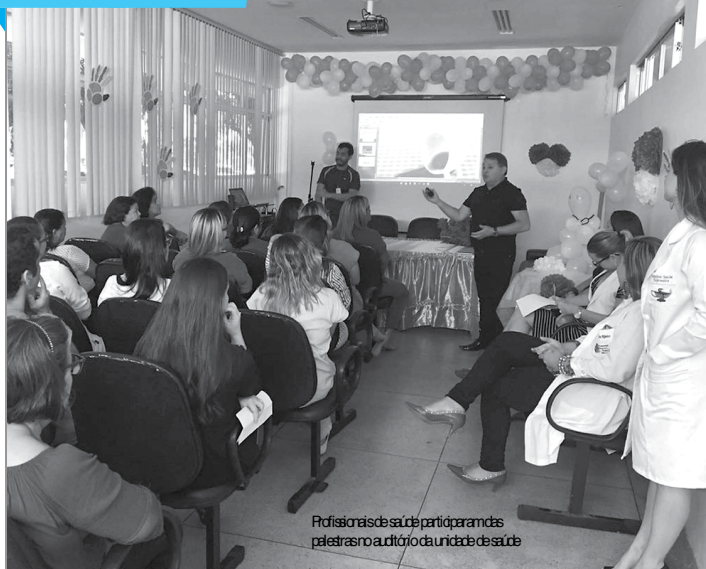
Profissionais de saúde participaram de palestra no auditório da unidade de saúde