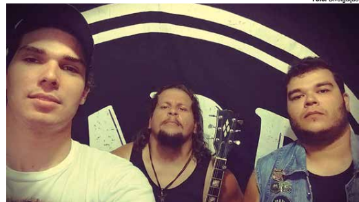
Formada em 2014, a banda Hard Tio, que já gravou um EP, vai se apresentar na Praça da Matriz