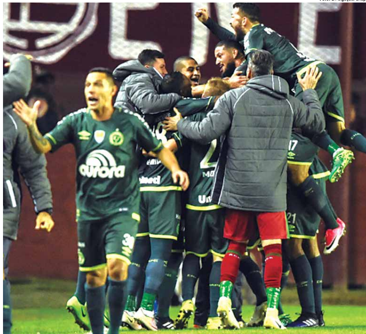
Jogadores do Chapecoense comemoram a vitória sobre o Lanús da Argentina, em jogo realizado na última quarta-feira pela fase de grupos da Libertadores