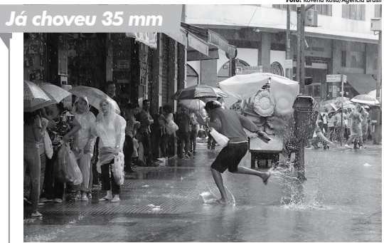
Centro de Gerenciamento de Emergências decretou estado de atenção para alertamentos nas regiões da capital

A Força Sindical também agendou um ato para amanhã, na Avenida Paulista, mas pela manhã, a partir das 11h, no vão-livre do Masp. Por meio de comunicado, a central sindical informou que o ato é contra as reformas trabalhista e previdenciária e por "uma solução democrática para a atual crise política e econômica" no país. Segundo a entidade, essa solução passa pela realização de "eleições gerais e democráticas".