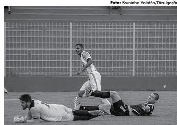
Otime carioca ganhou a primeira pelo Campeonato Brasileiro da Série C