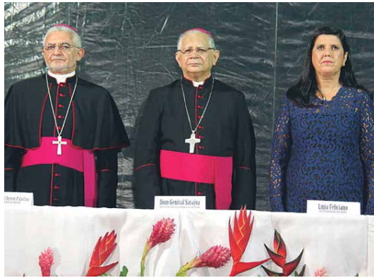
Arcebispo da Paraíba, Dom Manoel Delson, Dom Genival Saraiva e vice-governadora Lígia Feliciano

OS PROFESSORES de educação pública do Estado da Paraíba podem se inscrever até o dia 12 de junho para participar do Prêmio de Educação Fiscal. A promoção é da Associação dos Auditores Fiscais do Estado da Paraíba e serão premiados os três melhores projetos desenvolvidos por professores de escolas e universidades públicas da Paraíba, com o valor de R$ 2.000 para cada um deles.