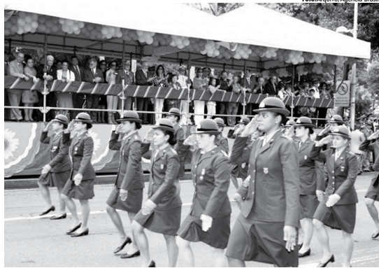
Em três editais, o Exército Brasileiro oferece um total de 1.100 vagas para cursos de formação de sargentos

As inscrições terminam em 20 de junho e devem ser feitas pelo site www.espcex.ensino.eb.br . A taxa é de R$ 90.