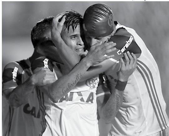
Jogadores do Flamengo comemoram uma das suas vitórias diante do Atlético-GO por 3 a 0 na segunda rodada

Os resultados obtidos na segunda rodada do Brasileirão da Série A da atual temporada, com os times cariocas, entram para a história da competição, haja vista que se trata da quebra de um jejum de cinco anos onde os quatro principais times do Rio de Janeiro fizeram bonito, não decepcionaram seus torcedores e, além do mais, conquistaram três pontos preciosos na competição que podem fazer a diferença, já que o Brasileiro da Série A apenas está começando e muitas águas ainda vão rolar ao longo das suas 38 rodadas a serem disputadas.