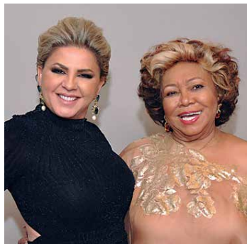
Bãtãria Ferreira e a cantora Alcione

SERÁ REALIZADO no dia 3 de junho no Ginásio Poliesportivo do Unipê o evento "PowerUnipê", com inscrições através do email powerunipe@hotmail.com no assunto "inscrição". Trata-se de uma competição de levantamento de potência, nas categorias feminina e masculina, que consiste na realização de três exercícios, que são o supino, o levantamento terra e o agachamento. A participação no evento é aberta ao público, desde atletas até as pessoas interessadas na modalidade.