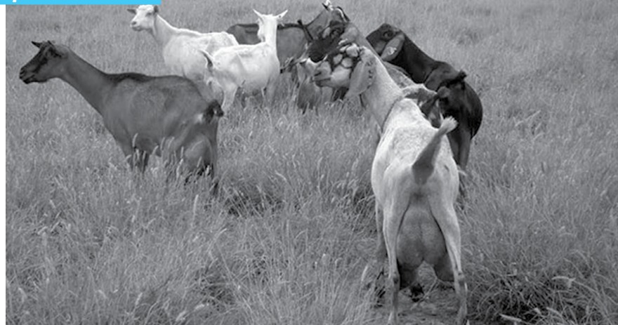
Pesquisa da Emepa-PB foi realizada nas microrregiões do Cariri Ocidental e Cariri Oriental, abrangendo nove municípios com potencialidade para a caprinocultura e ovinocultura