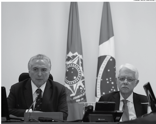
Temer disse que os novos projetos permitirão R$ 45 bi de investimentos em energia, transportes e saneamento

Durante a reunião, o Ministério de Minas e Energia apresentou uma proposta de licitação de 35 lotes de linhas de transmissão de energia em 17 estados, com investimentos de R$ 12,8 bilhões. O Ministério dos Transportes relacionou projetos de concessões em rodovias, ferrovias e portos.