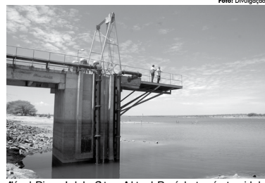
Além de Princesa Isabel, o Sistema Adutor do Pageú abastecerá outras cidades

Enfim, todos, a Paraíba e o Nordeste, sofridos ao longo de tantos séculos, merecem essa profusão de alvíssaras pelo muito que já fizeram pelo Brasil, com seus exemplos de trabalho honradez.