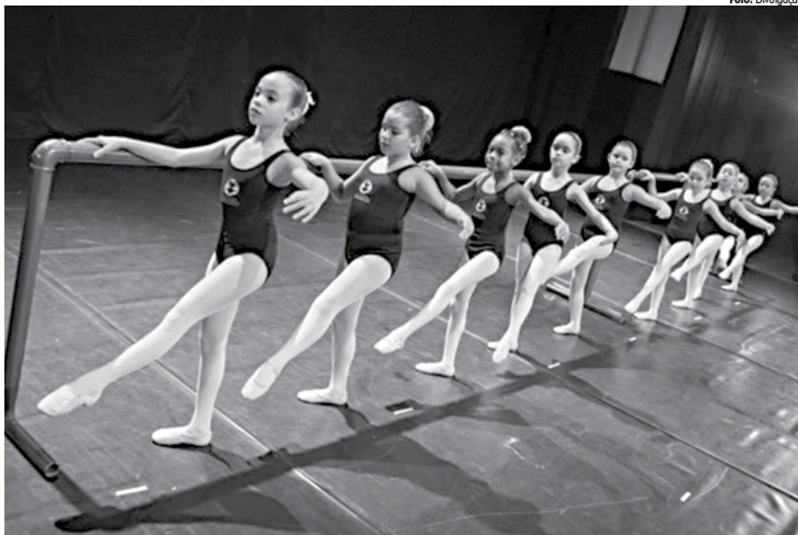
As aulas de ballet destinadas a crianças na faixa etária entre 7 e 11 anos estão incluídas nos cursos ofertados para este ano