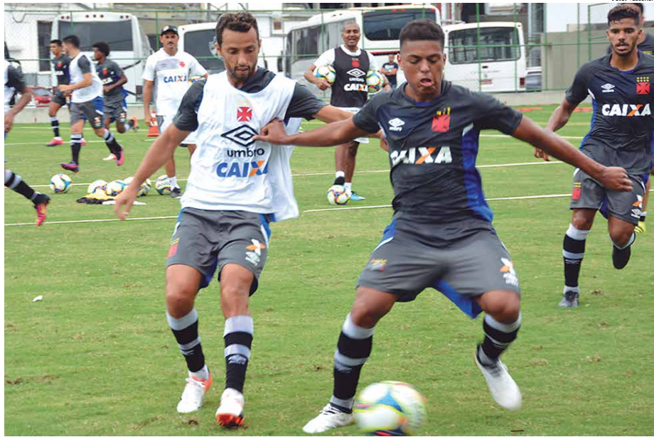
Último treino do Vasco para o jogo de ida mais contra o Vitória no jogo de ida pela Copa do Brasil em sua terceira fase. A volta está prevista para o próximo dia 16 no Barrage, em Salvador