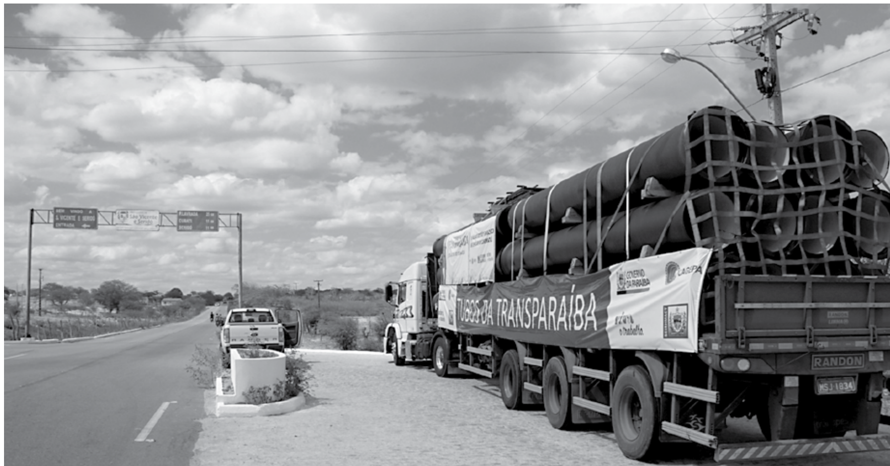
A TransParaíba também terá uma estação de tratamento e 21 estações de bombeamento e o sistema captará a água do Açude Boqueirão para abastecer 19 cidades