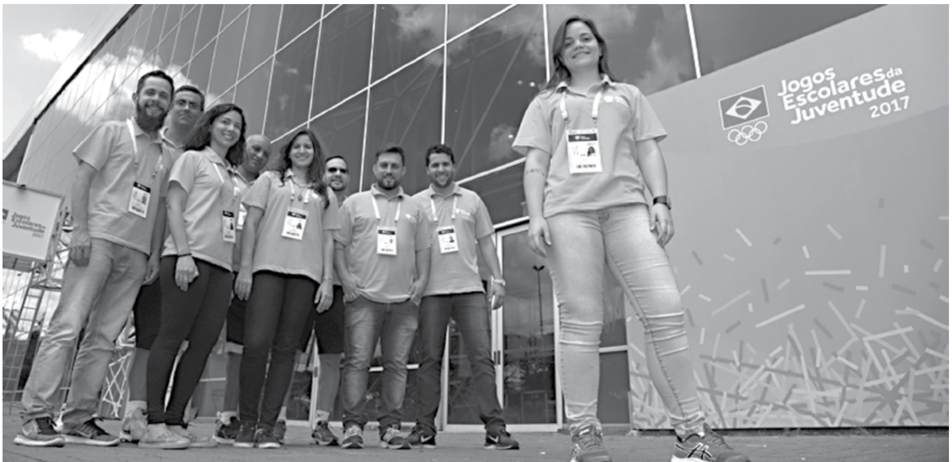
Muitos que já foram voluntários trabalham hoje como contratados da organização do evento. Os Jogos Escolares da Juventude começam amanhã e se estenderão até o próximo dia 25