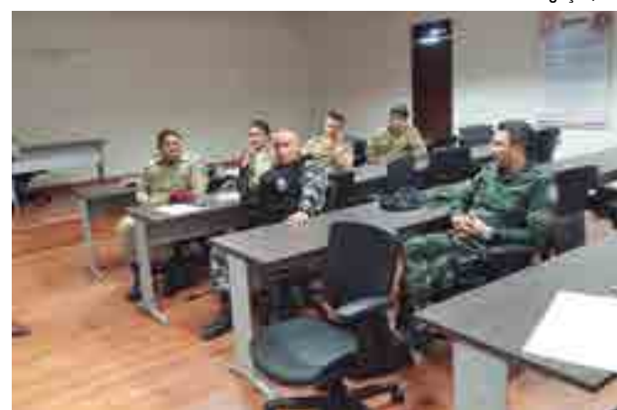
Forças de segurança trabalham para maior tranquilidade nos jogos

Um dos assuntos discutidos pelos integrantes foi retirar a grade que fica no meio da geral (lado sol) para ser deslocada para o lado direito (sentido BR), que seria utilizado pela torcida visitante. De acordo com a PM, o Almeidão tem capacidade para 22 mil pessoas, sendo que 10% é destinada a torcida de fora. A proposta foi lançada pela PM para facilitar a segurança dos times que tem o mando de campo e os visitantes.