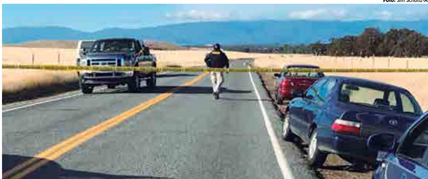
Estrada em Rancho Tehama foi isolada após o ataque em uma escola primária no norte da Califórnia, nos Estados Unidos, onde aconteceram as mortes