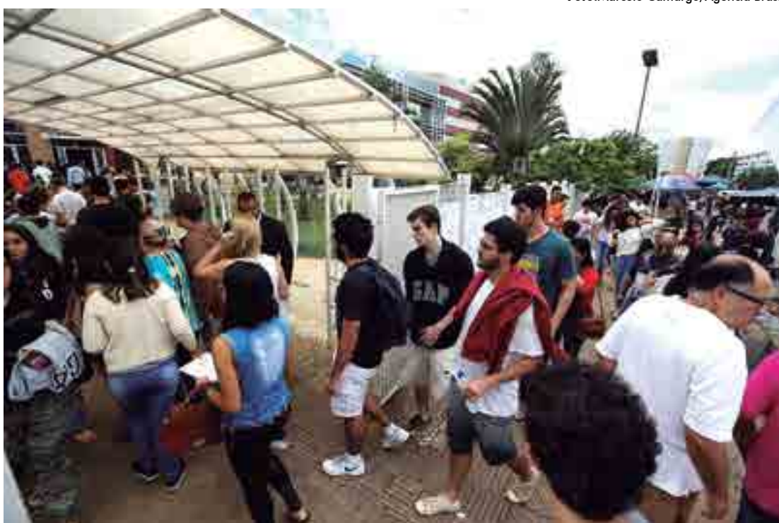
Bem-estar pessoal levaram 68% dos brasileiros a fazerem doação em dinheiro no último ano, aponta o Idis

Este ano o levantamento não avaliou o montante total doado pelos brasileiros, mas a pesquisa anterior, realizada um ano antes, chegou a R$ 13,7 bilhões. Quase metade dos doadores (49%) declarou ter doado para organizações religiosas, tanto para as igrejas diretamente quanto para projetos desenvolvidos por elas. Em seguida, aparecem doações a trabalhos dirigidos às crianças (42%) e aos pobres (28%).