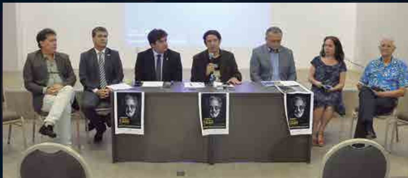
Representantes de diferentes segmentos culturais e apoiadores participaram do lançamento da programação da edição 2017