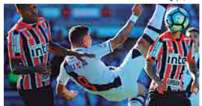
No domingo passado, o Vasco teve a grande chance, mas só empatou

"É trabalhar na mente. Nosso mental tem que estar forte. Não podemos entrar pensando que tem possibilidade. Temos que entrar e fazer nosso trabalho. Sabemos das nossas qualidades.