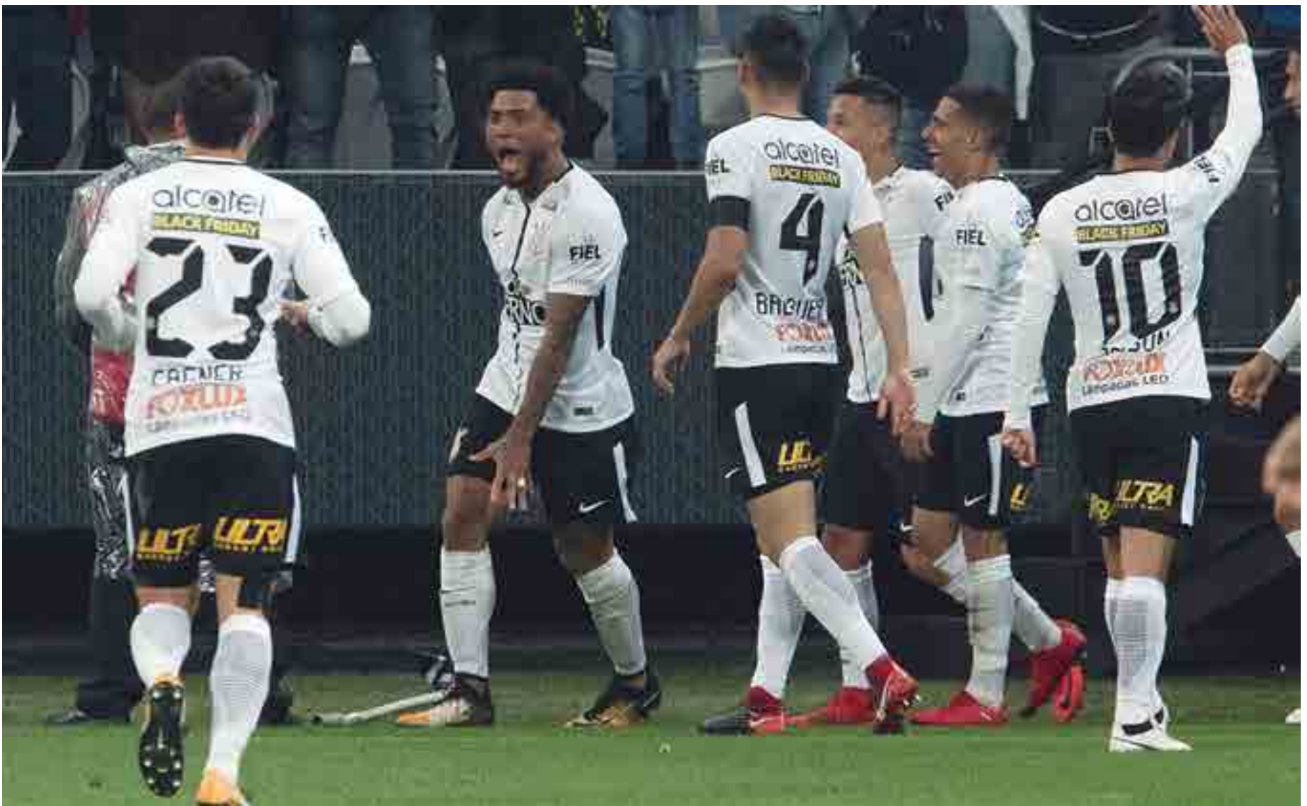
Os jogadores do Corinthians têm tudo para fazer a grande festa do título hoje de forma antecipada se conseguirem vencer o Fluminense a partir das 21h45 na Arena de Itaquera, em São Paulo

No ano passado, a CBF levou a taça para a Arena do Palmeiras no duelo contra a Chapecoense com a condição de só mostrá-la caso o time fosse campeão. A ideia era fazer o mesmo com o Timão. O Corinthians pode confirmar o título brasileiro e assim como aconteceu há dois anos, o Timão tem a chance de vencer o campeonato na rodada 35. Os campeões mais cedo dos pontos corridos com 20 clubes foram Cruzeiro (2013) e São Paulo (2007), ambos na rodada 34