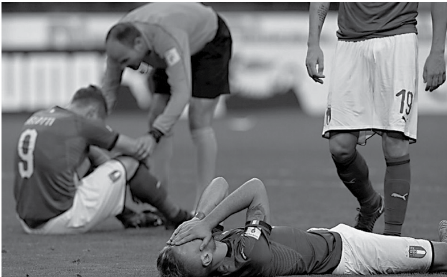
Jogadores da seleção italiana desolados e até consolado pelo árbitro após empate sem gols contra a Suécia, na maior frustração do futebol do país

A última vez que uma seleção que já tinha o título mundial em seu currículo foi ausente em uma Copa ocorreu em 2006, quando o Uruguai acabou eliminado na repescagem intercontinental. Contando só as europeias, a última que ficou de fora na condição mencionada foi a Inglaterra em 1974.