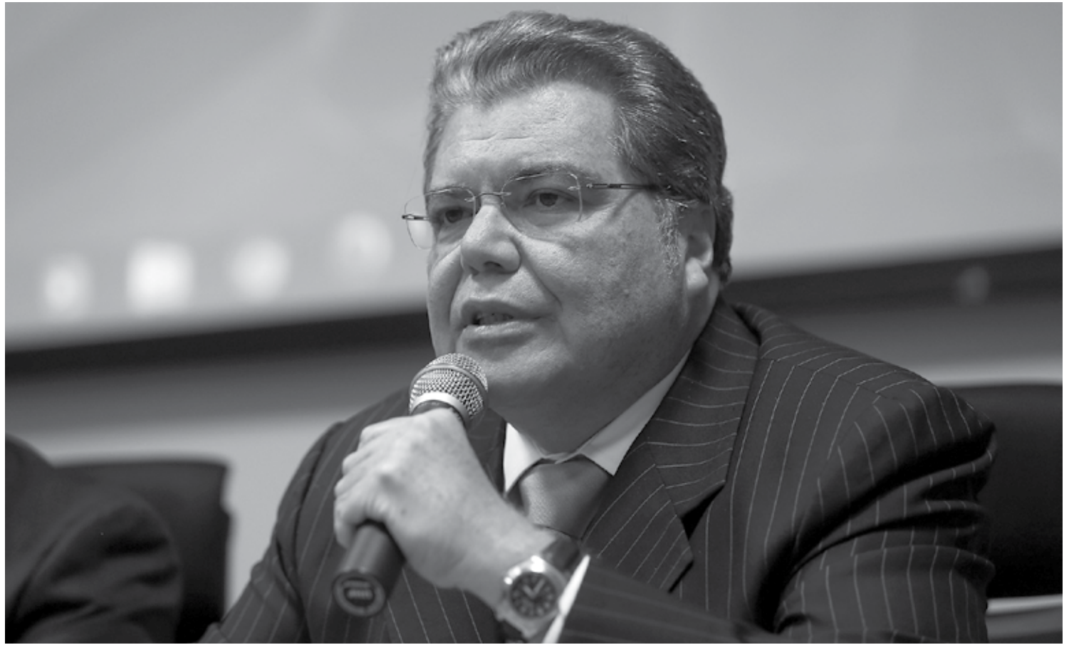
O ministro brasileiro do Meio Ambiente, Sarney Filho, advertiu que a questão do financiamento é essencial para ajudar nas mudanças climáticas

"Não temos tempo a perder. Quando maior for o pro-