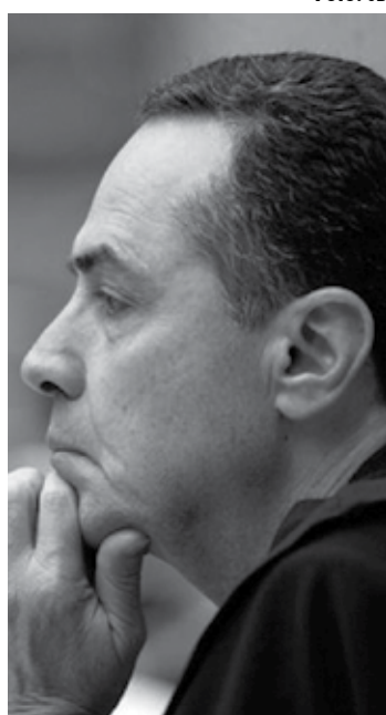
“Não passa pela minha cabeça”