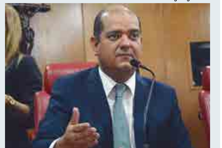
Vereador questiona lentidão nas obras e contradições na propaganda