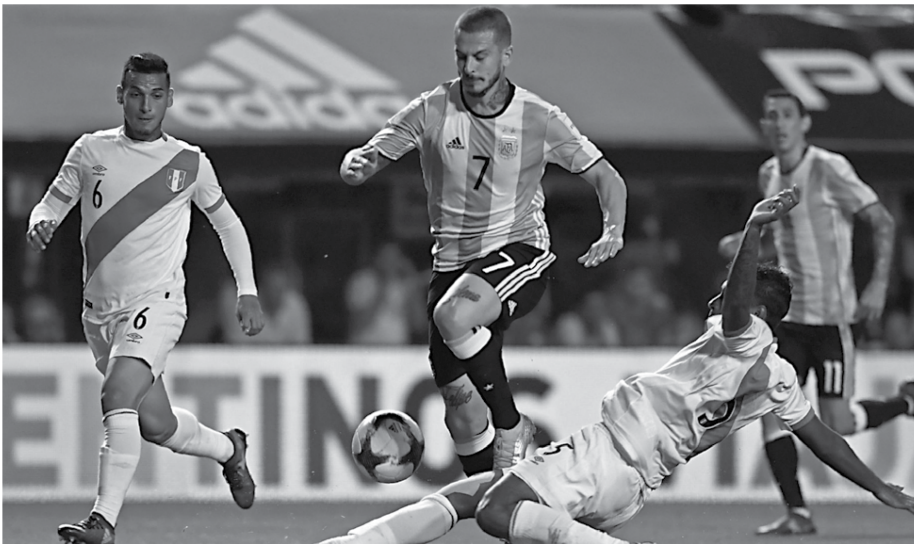
Atuando em seus domínios, a seleção argentina não conseguiu furar o bloqueio defensivo do Peru e o jogo terminou sem gols, deixando a equipe de Sampaoli fora da zona de classificação

A última rodada será contra o Equador, terça-feira, às 20h30, no Estádio Olímpico Atahualpa. Na mesma data, entram em