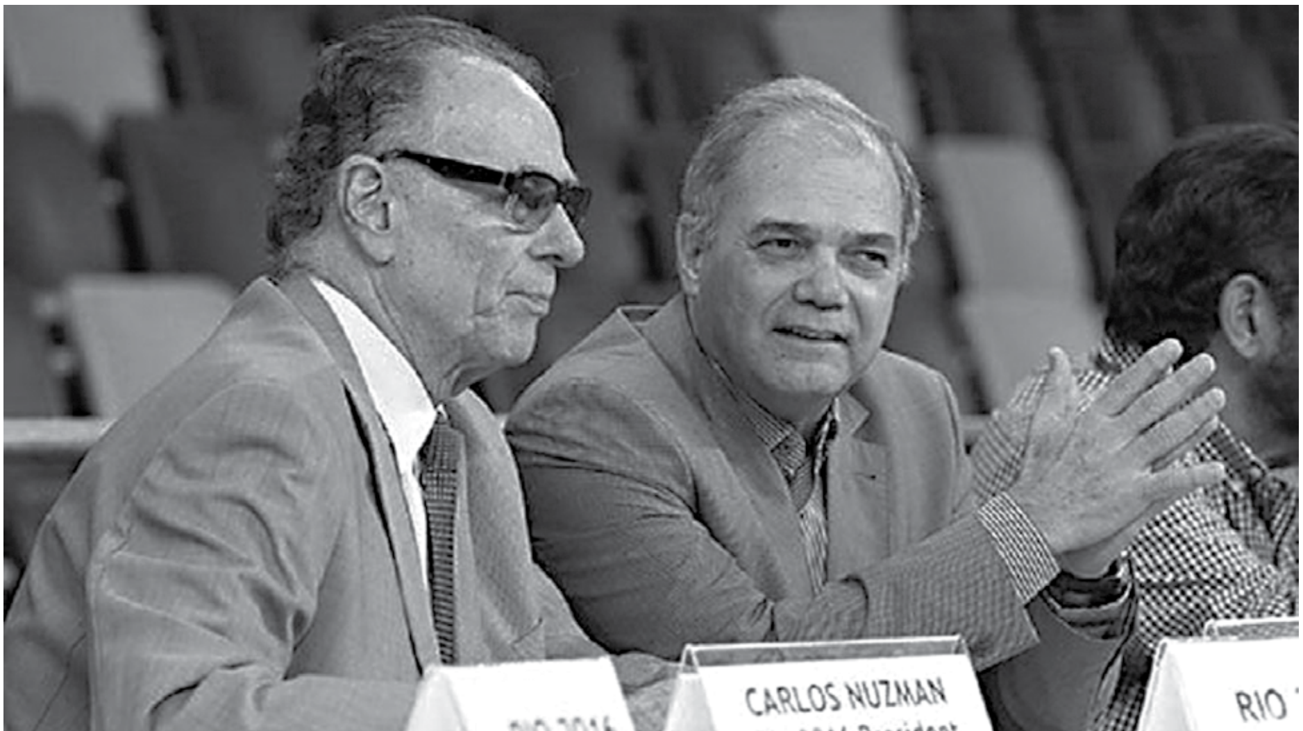
O presidente Carlos Arthur Nuzman, que está preso na Polícia Federal, e o vice-presidente Paulo Wanderley Teixeira, que assumiu interinamente o Comitê Olímpico Brasileiro na última quinta-feira

A Comissão de Ética do comitê internacional afirmou em comunicado que "tomou nota das alegações contra o senhor Carlos Nuzman, em particular com relação à votação para cidade-sede dos Jogos Olímpicos na sessão de COI em 2009, e sua prisão em 5 de outubro de 2017 por agentes brasileiros no âmbito de uma investigação criminal". "Considerando o atual