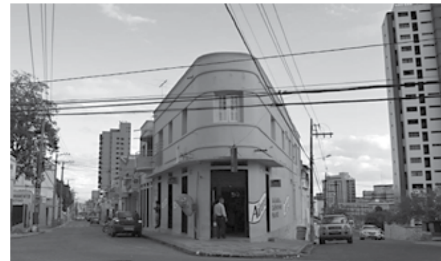
Ferro D'engomar, Av. Pres. Getúlio Vargas, Campina Grande