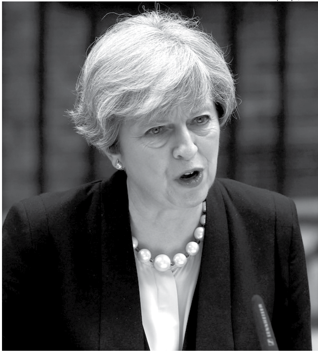
A primeira-ministra do Reino Unido, Theresa May se enfraqueceu politicamente após convocar eleições gerais em junho