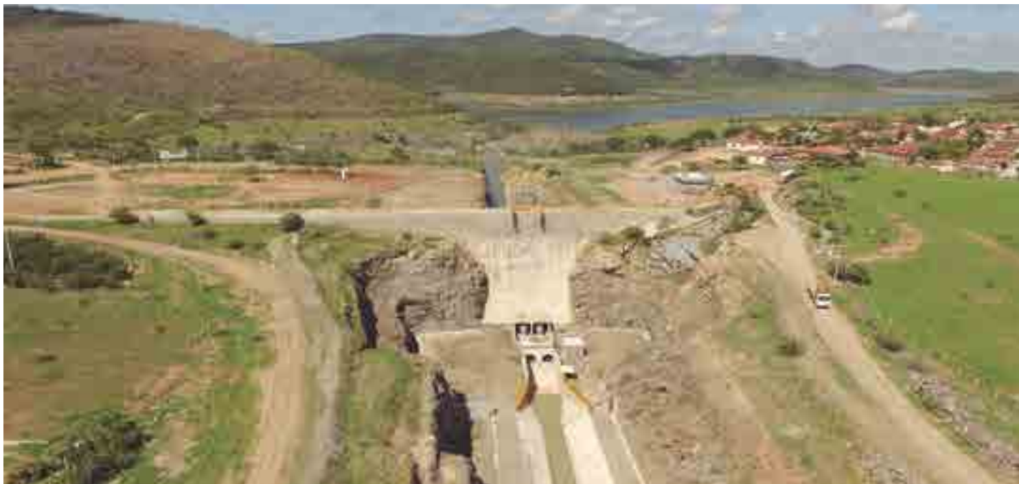
O Governo do Estado, através da Secretaria da Infraestrutura e Recursos Hídricos, em parceria com o Governo Federal, está investindo mais de R$ 1 bi na obra

“A obra do canal Acauã-Araçagi está com o Lote 1 concluído, estamos apenas nos retoques finais. Essa obra tem um significado importante para a Paraíba, pois permitirá que as águas do São Francisco, chegando através de Mon-