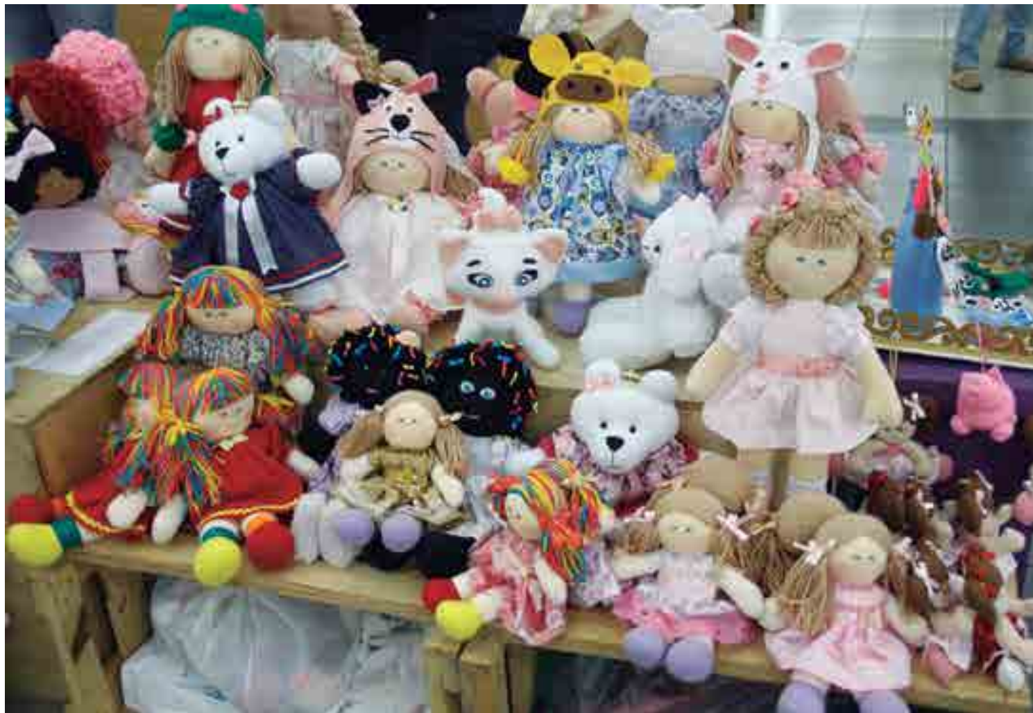
Feira oferece ao público infantil e infanto-juvenil um mundo mágico de piões, mamulengos, petecas e bonecos de pano que ainda fascina crianças e adultos

Ao todo, estão ligados diretamente à realização do evento 91 artesãos, oriundos das cidades de João Pessoa, Bayeux, Santa Rita, Remígio e Campina Grande, todos selecionados por edital público de chamamento. Além dos brinquedos, na Brincarte também estão sendo comercializados livros infantis, em parceria com o Sebo Cultural, e pinturas infantis confeccionadas pela artista plástica Sanantha Kama.