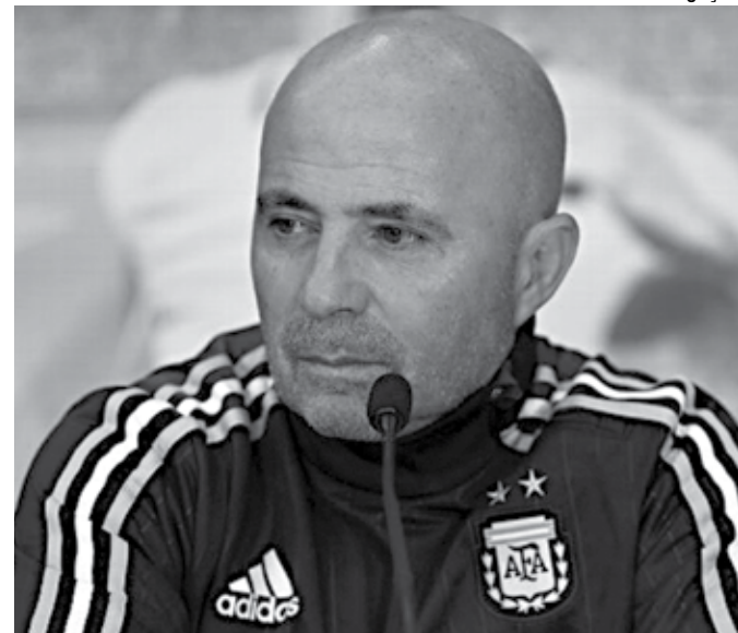
Sampaoli agradeceu o carinho da torcida e tem fé na classificação