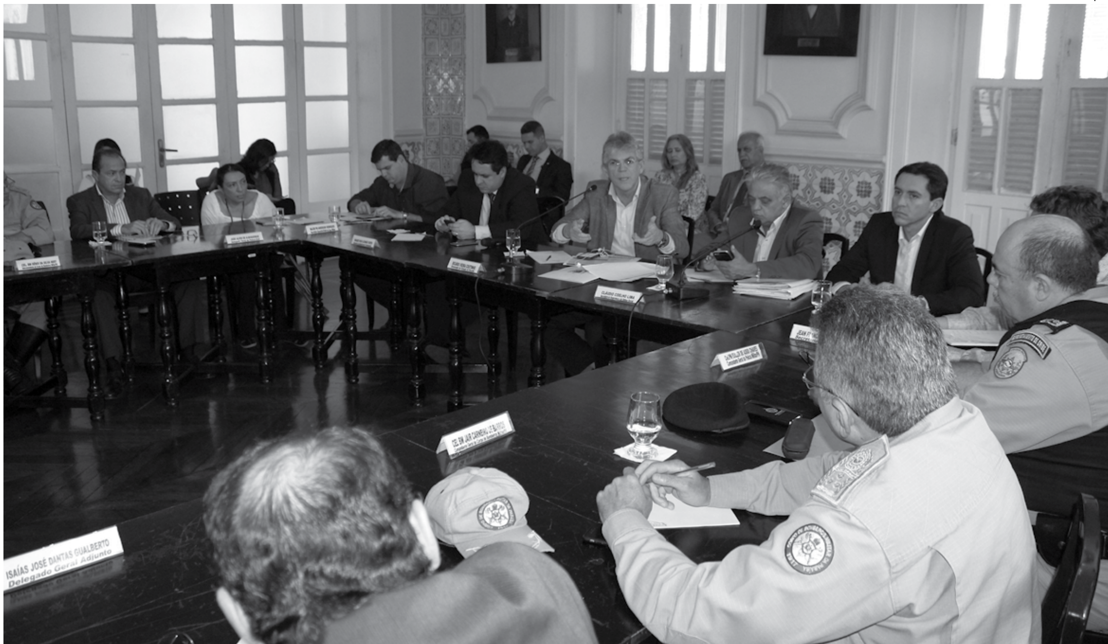
O objetivo do encontro foi avaliar os pontos estabelecidos nas discussões da primeira etapa e apresentar os avanços já conquistados do planejamento. Governador destacou o comprometimento do Estado em buscar melhorias em todas as áreas