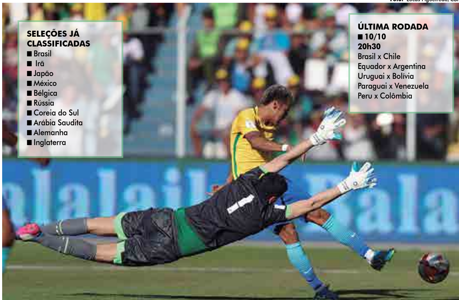
Neymar não conseguiu vencer o goleiro boliviano no empate sem gols na última quinta-feira. O Brasil é o único país sul-americano garantido na Copa