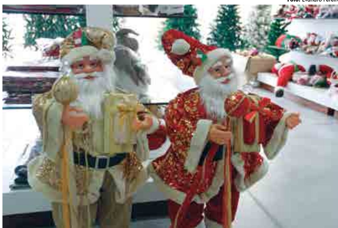
Bonecos de Papai Noel foram encontrados pela reportagem de A União por até R$ 3.500 nos estabelecimentos

A exemplo dos anos anteriores, as gerentes de lojas especializadas em decorações natalinas, existentes no