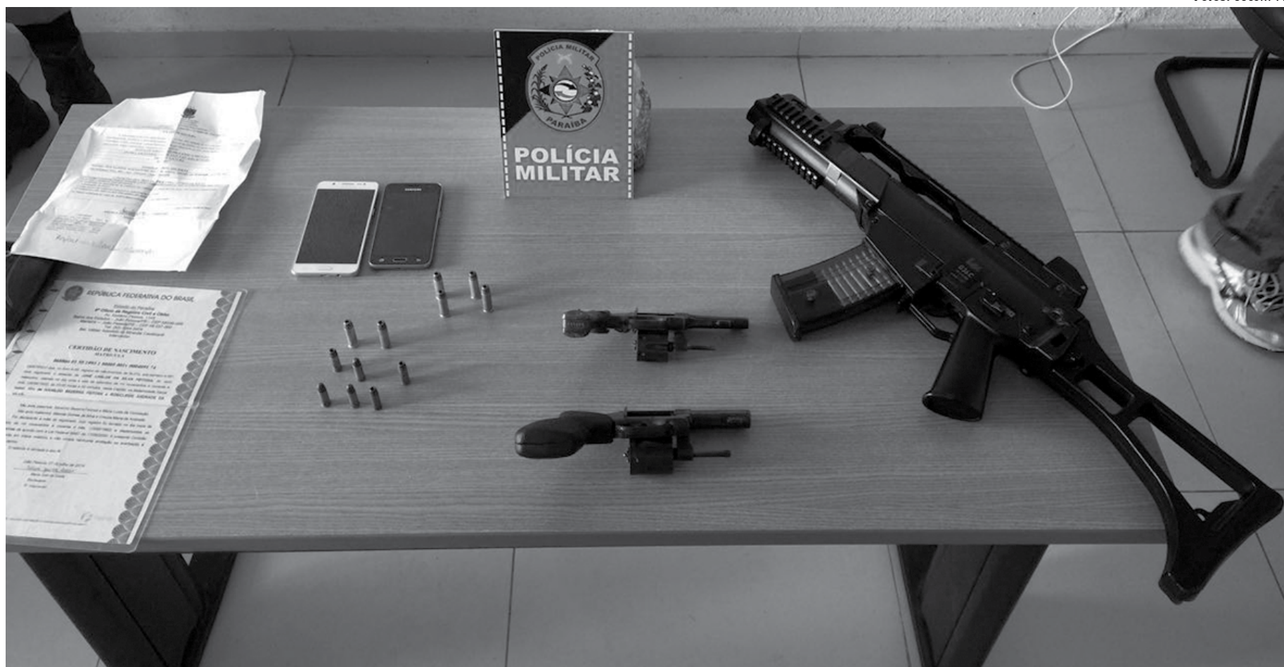
O simulacro de fuzil calibre 5,56, os dois revólveres e as munições foram levados juntamente com os acusados para a Central de Flagrantes, no Bairro do Geisel, na capital

Os três suspeitos e as armas apreendidas foram conduzidos à Central de Flagrantes, no bairro do Geisel.