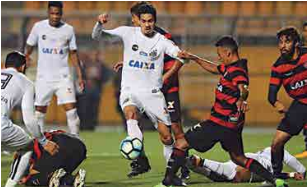
O time santista vem de um empate em dois gols contra o Vitória na última segunda-feira no Pacaembu