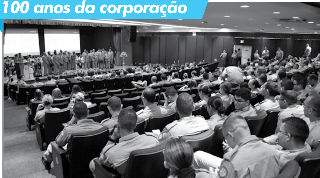
Bombeiros, autoridades e convidados assistiram ao concerto na noite da última terça-feira em João Pessoa