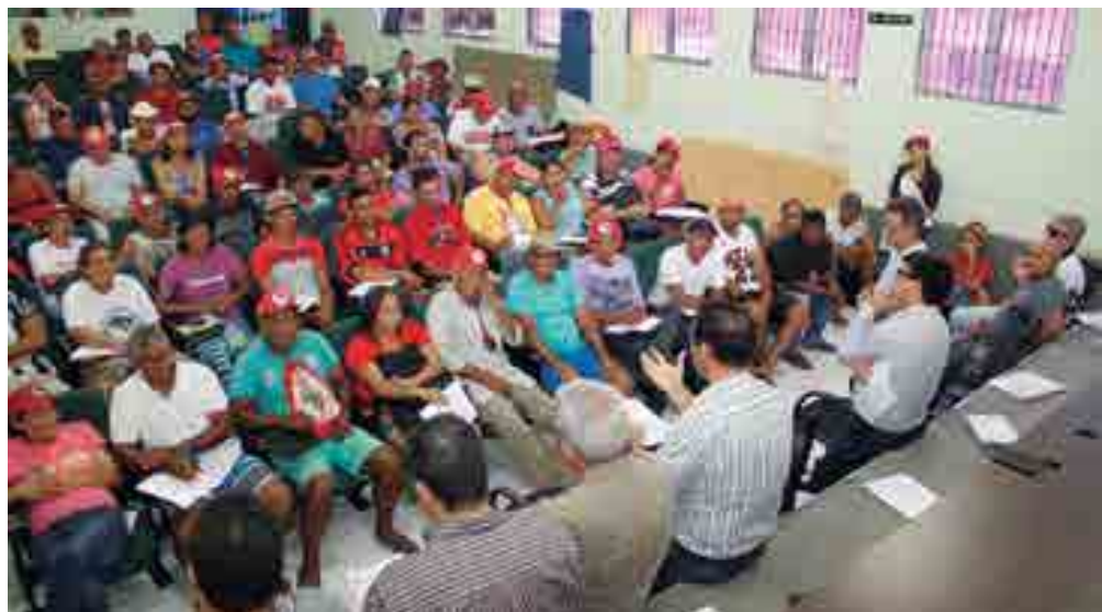
Direção estadual do órgão discutiu as reivindicações com coordenadores de assentamentos na Paraíba