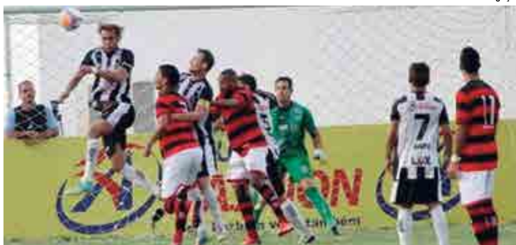
O Campeonato Paraibano ainda não tem data pra começar e a definição só deve acontecer na próxima terça

"É um ano atípico e precisamos conversar bastante para se chegar a uma fórmula de disputa e um regulamento, que sejam o melhor para todos. Desta forma, quero começar a discutir o assunto com os dirigentes de clubes, já no período da manhã. Depois, almoçaremos todos juntos, trocando ideias, e na parte da tarde, definiremos tudo", disse o presidente da FPF.