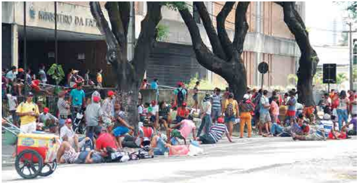
Trabalhadores rurais permaneceram em frente ao prédio do Ministério da Fazenda em protesto contra os cortes orçamentários nas políticas de reforma agrária

Ele disse também que hoje e sexta-feira os traba-