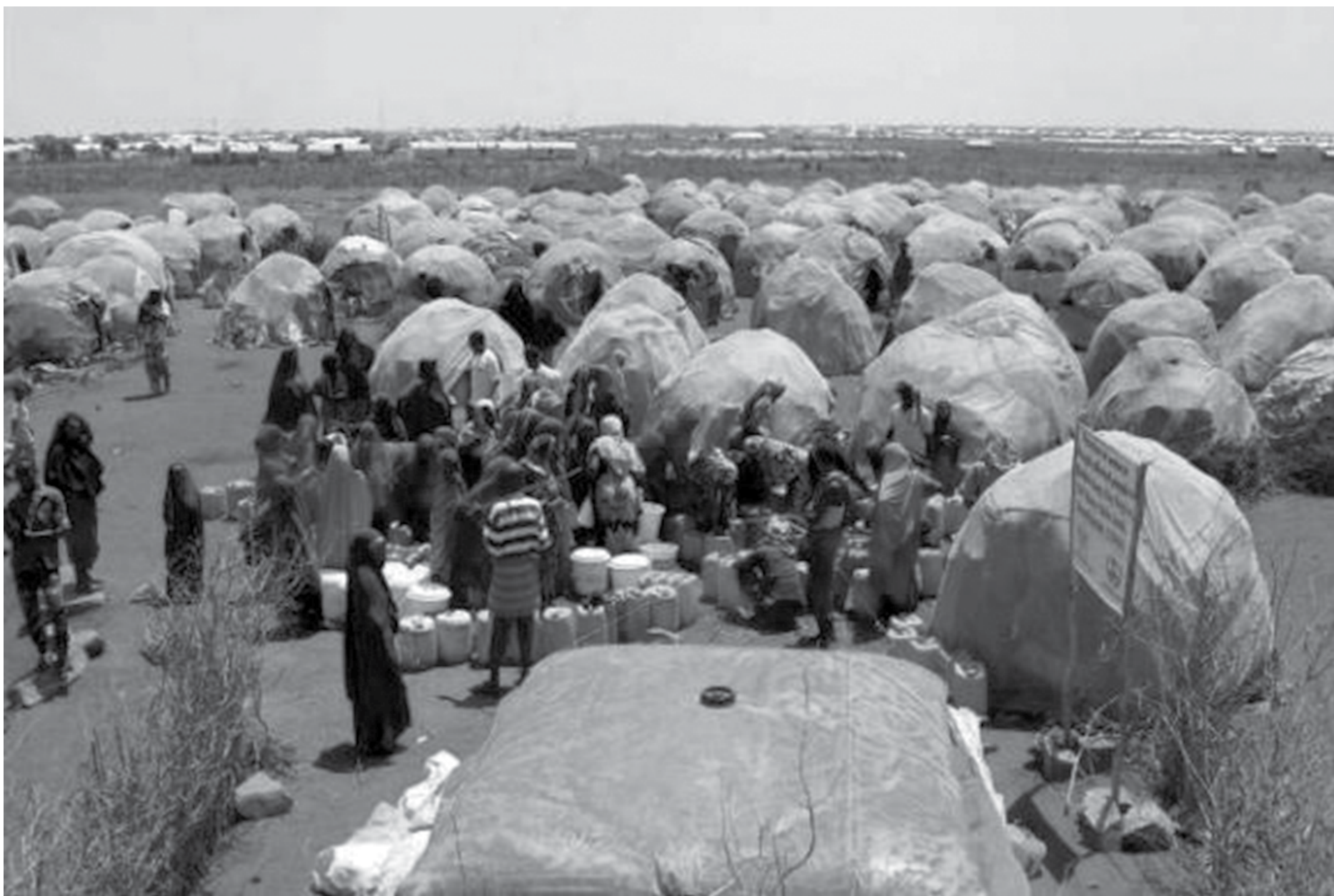
Acampamentos improvisados abrigam milhares de pessoas que deixaram suas casas em comunidades rurais onde não há mais água; em setembro cerca de 50 mil pessoas fugiram dos seus lares

“Os rios estavam secos, não havia nenhuma gota de água em nenhuma parte. Cavamos o solo para buscar água subterrânea, mas não encontramos nada”