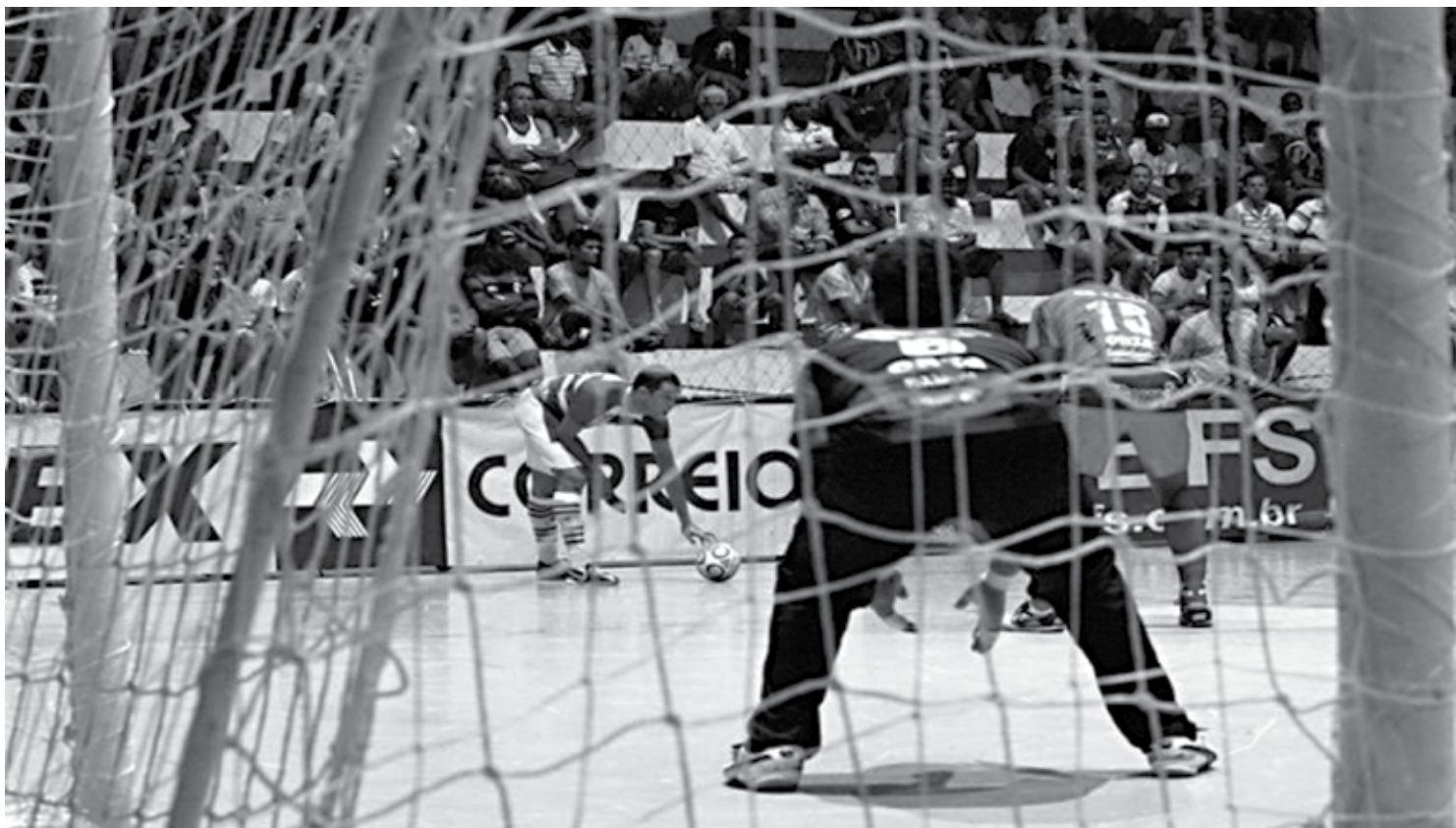
Brejo do Cruz e Lagarto voltam a se enfrentar, agora na cidade de Aracaju em busca de uma vaga na final da Liga Nordeste de Futsal neste sábado