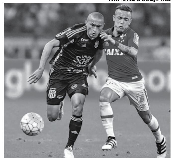
Jogador paraibano de 31 anos, hoje na Ponte, foi oferecido ao São Paulo