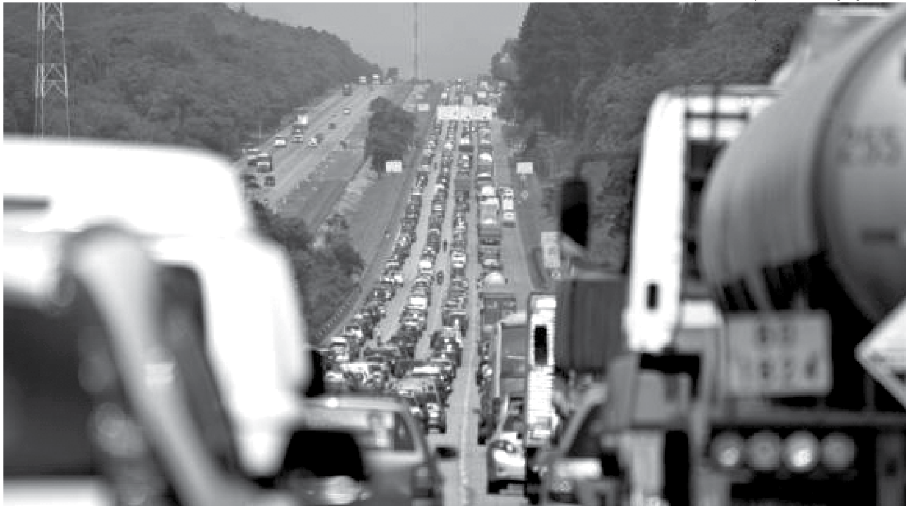
Nova forma de pagamento de débitos referentes a veículos deverá reduzir a inadimplência, já que o parcelamento no crédito gera compromisso entre o condutor e a administradora do cartão