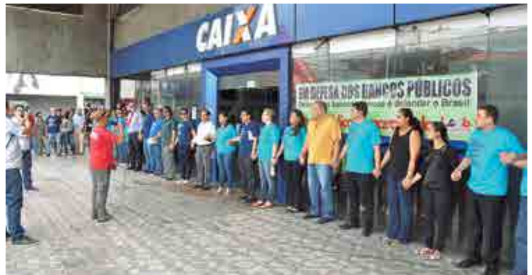
Representantes do sindicato e funcionários da Caixa participaram do protesto na agência Cabo Branco da CEF