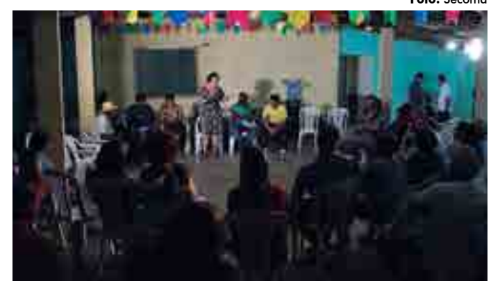
A última reunião aconteceu no Assentamento Dona Antônia