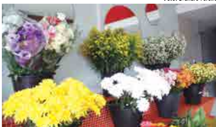
Flores do campo estão entre as mais vendidas nesta época do ano