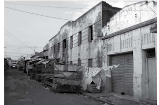
Fachada da antiga casa de jogos, construída no ano de 1937