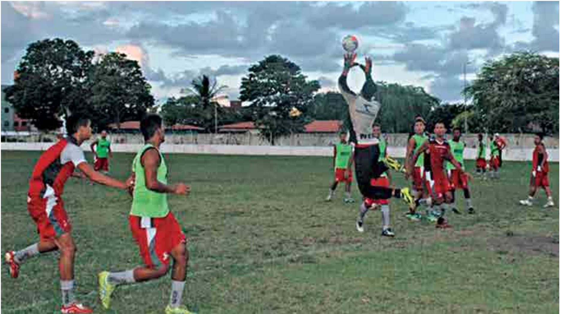
O campo do Auto Esporte vai ser palco nos próximos dias de um “peneirão” com o objetivo de revelar novos talentos que podem até ser aproveitados na equipe principal para o Paraibano 2018