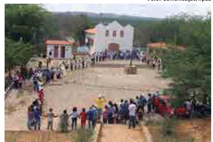
Ato lembra o fato histórico que é ignorado pela historiografia oficial

No momento que antecedeu a Romaria houve Encontro das Pastoreias Sociais do Nordeste, reunindo lideranças em busca da resistência materializada no exemplo do povo do Conselheiro. Ocorreu ainda uma sessão especial na Assembleia Legislativa da Bahia no último dia 26 e um evento em Paris para discutir o marco histórico do Sertão, fato este ainda pouco conhecido de muitos sertanejos baianos. Massacres e potencialidades - Durante a mesa de discussão realizada no dia 21, o