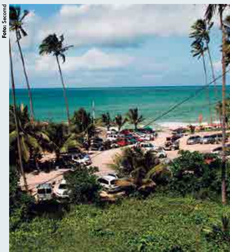
Mudança visa garantir o direito de livre circulação e preservar o meio ambiente

Começa hoje, na Praia de Coqueirinho, Litoral do município de Conde, o controle de acesso de veículos motorizados na região. Este controle de acesso tem como objetivo, garantir o direito de livre circulação de pessoas pela área e preservar o meio ambiente, já que uma parte da praia pertence a APA (Área de Proteção Ambiental) de Tambaba. O controle da entrada e saída dos veículos será feito pela Guarda Municipal diariamente, nos horários das 8h às 17h.