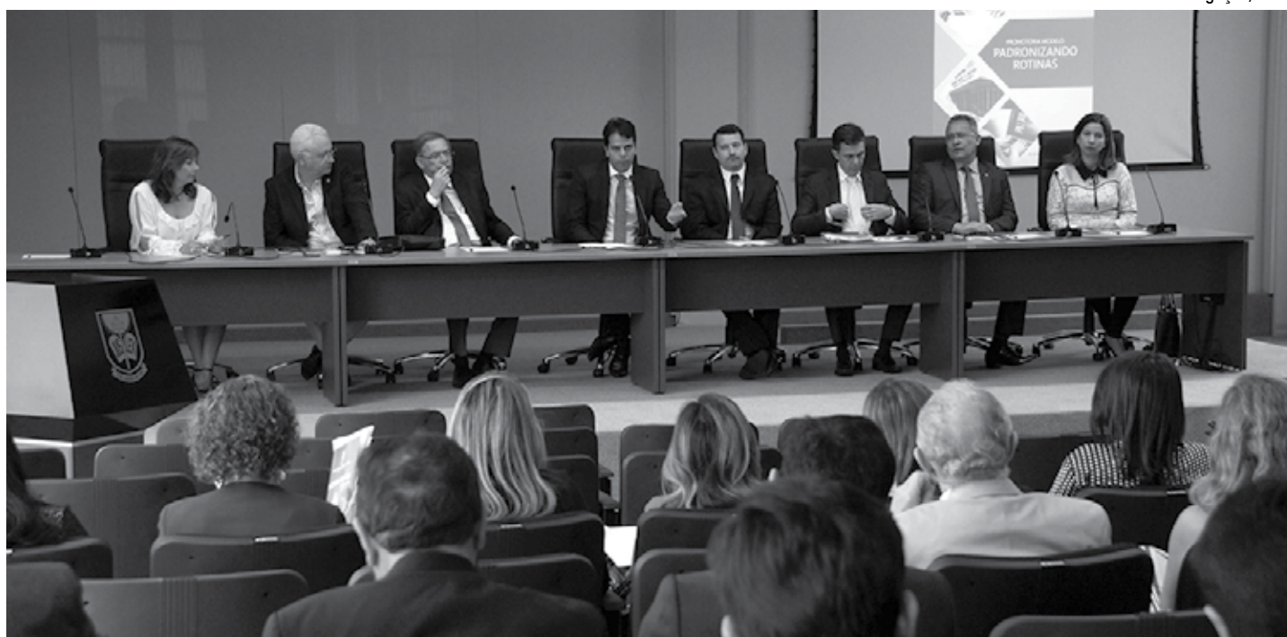
O procurador-geral de Justiça, Francisco Seráfico Ferraz da Nóbrega Filho, apresentou as linhas gerais traçadas pela gestão para o biênio 2017/2019

"Também estamos fazendo um diagnóstico geral do inventário real da instituição