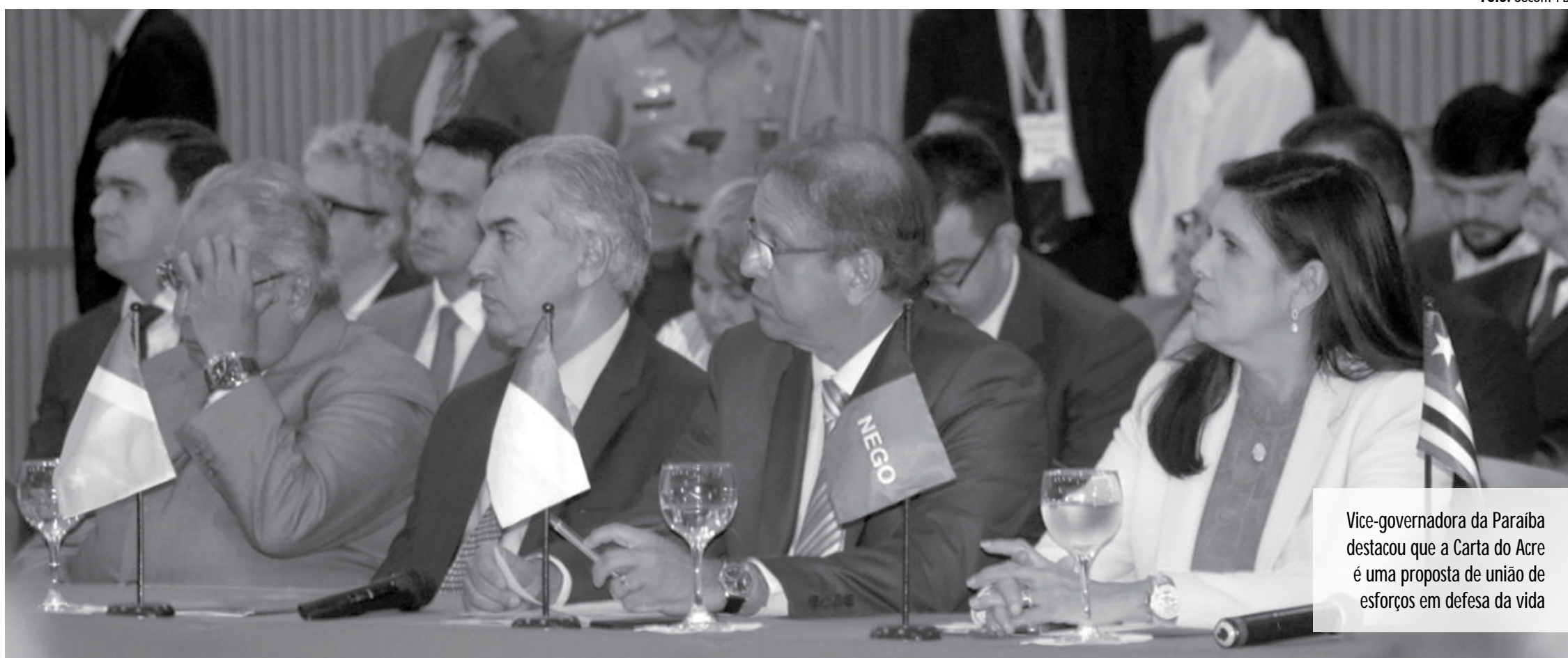
Vice-governadora da Paraíba destacou que a Carta do Acre é uma proposta de união de esforços em defesa da vida