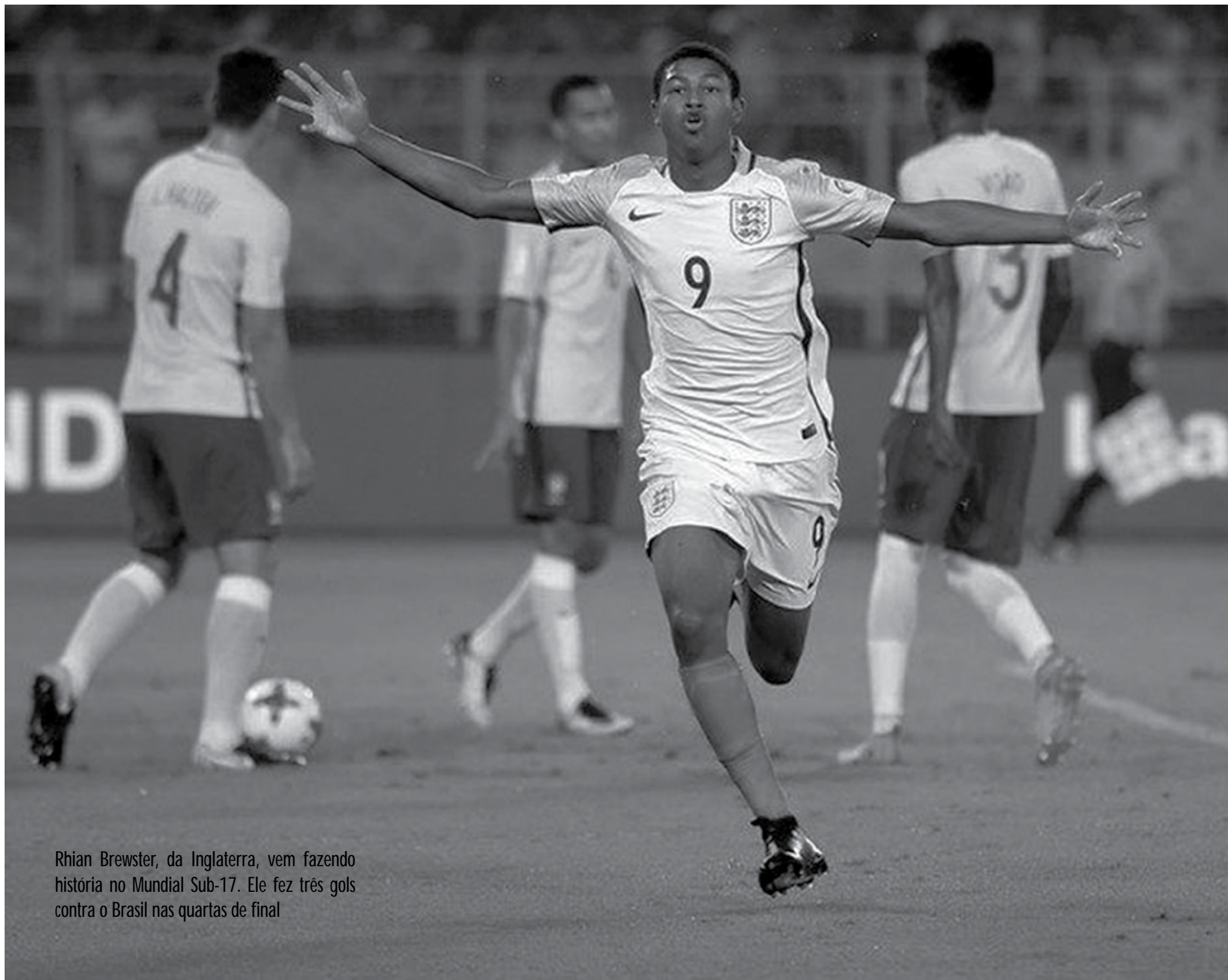
Rhian Brewster, da Inglaterra, vem fazendo história no Mundial Sub-17. Ele fez três gols contra o Brasil nas quartas de final