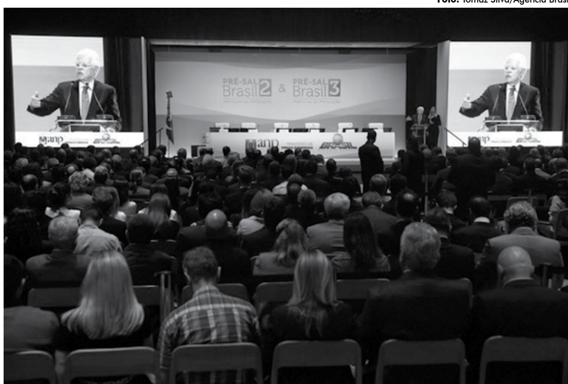
Leilões de blocos do polígono do pré-sal vão ainda propiciar R$ 760 milhões em investimentos nos próximos anos

Na 2ª Rodada de Licitação, realizada no fim da manhã de ontem, os blocos