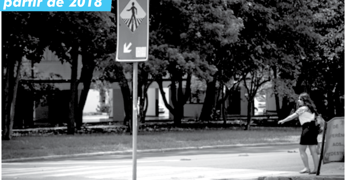
Entre as violações descritas, pedestres não podem cruzar faixas em viadutos e pontes e ficam sujeitos ao pagamento de multa no valor de R$ 44,19