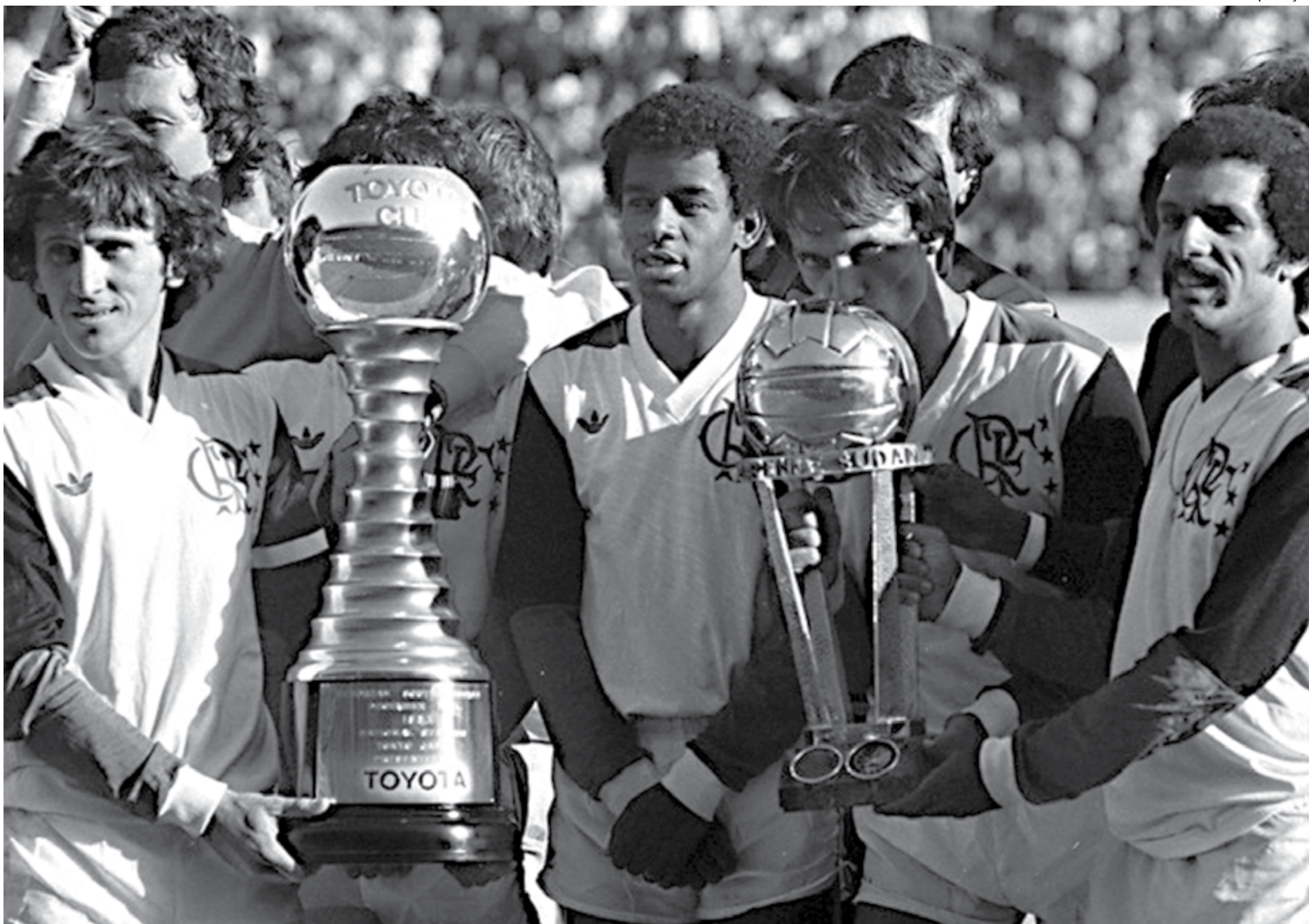
Os jogadores Zico, Andrade, Leandro e Júnior se consagraram no Japão pelo Flamengo que venceu o Liverpool, da Inglaterra, por 3 a 0, na Copa Intercontinental disputada em 1981

São Paulo é o clube brasileiro com mais títulos mundiais reconhecidos pela Fifa. São três contra dois de Corinthians e Santos