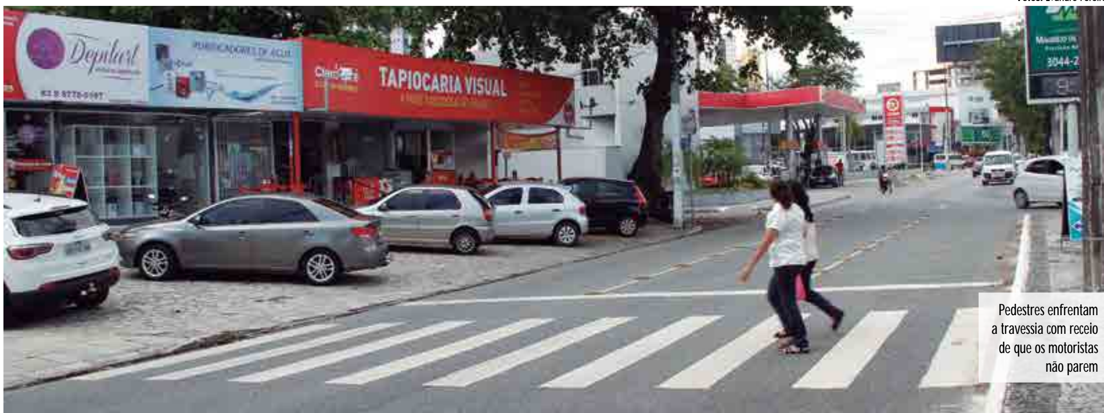
Pedestres enfrentam a travessia com receio de que os motoristas não parem