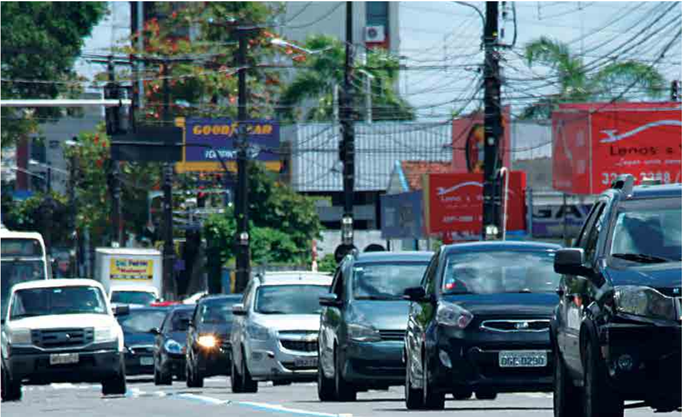
Reclamações pela falta de novas rotas para o trânsito são mais contundentes na entrada dos Bancários, no bairro José Américo, na Praça da Independência, no Retão de Manaíra e na rotatória do Altiplano, locais em que os motoristas sofrem todos os dias