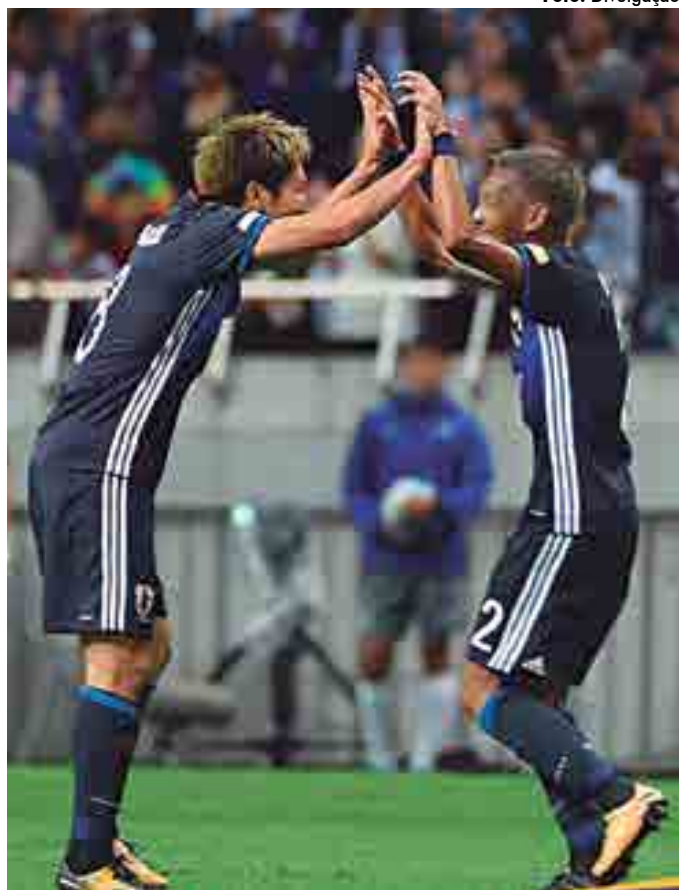
Jogadores japoneses comemoram gol na vitória sobre a Austrália

Com a vaga garantida, o Japão se junta à Rússia, ao Brasil e ao Irã como as únicas seleções classificadas para a Copa do Mundo.