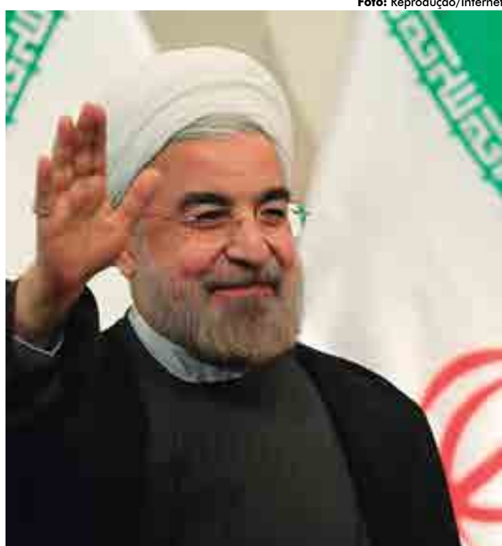
O presidente iraniano Hassan Rohani não descumpriu o acordo nuclear

A Aiea afirma que seus inspetores visitaram todas as instalações e fizeram medições de vigilância nos centros nucleares iranianos previstos no acordo, que limita as atividades atômicas do país por um prazo entre 10 e 25 anos. Em troca, as potências assinantes - Estados Unidos, Rússia, Alemanha, China, França e Reino Unido - suspenderam suas sanções