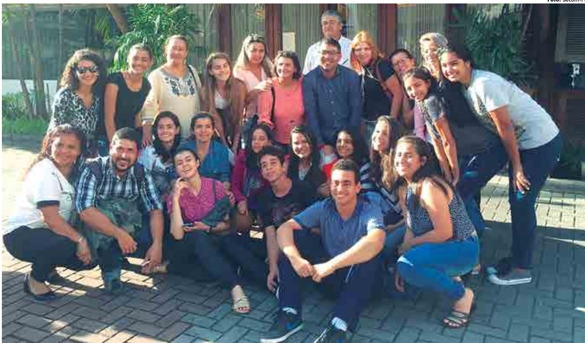
Os 25 estudantes selecionados para o intercâmbio em Portugal se encontram na fase final da retirada do visto para o embarque que contará com uma solenidade liderada pelo Governo do Estado

Os alunos selecionados para o programa participaram de uma seleção realizada em três etapas de caráter