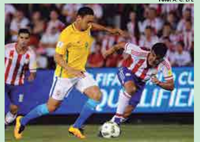
Os paraguaios entraram também na briga para sediar a Copa 2030

do General Pablo Rojas, do Cerro Porteño, foi reaberto depois de mais de dois anos de obra. “Nueva Olla”, novo pote em português, é atualmente o mais moderno do Paraguai. A expectativa é de que até o ano de 2030, o Estádio Defensores del Chaco, o mais importante do país, seja reformado.