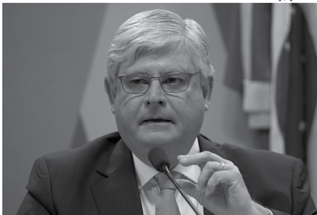
Procurador-geral da República, Rodrigo Janot, disse que as irregularidades "devem ser apuradas e devidamente sanadas"

A decisão do TCU foi tomada após o tribunal encontrar 578 mil indícios de irregularidades no pagamento de benefícios do PNRA. Os beneficiários suspeitos de estarem irregulares tiveram seus repasses suspensos até a devida regularização, ficando sem assistência técnica e financeira