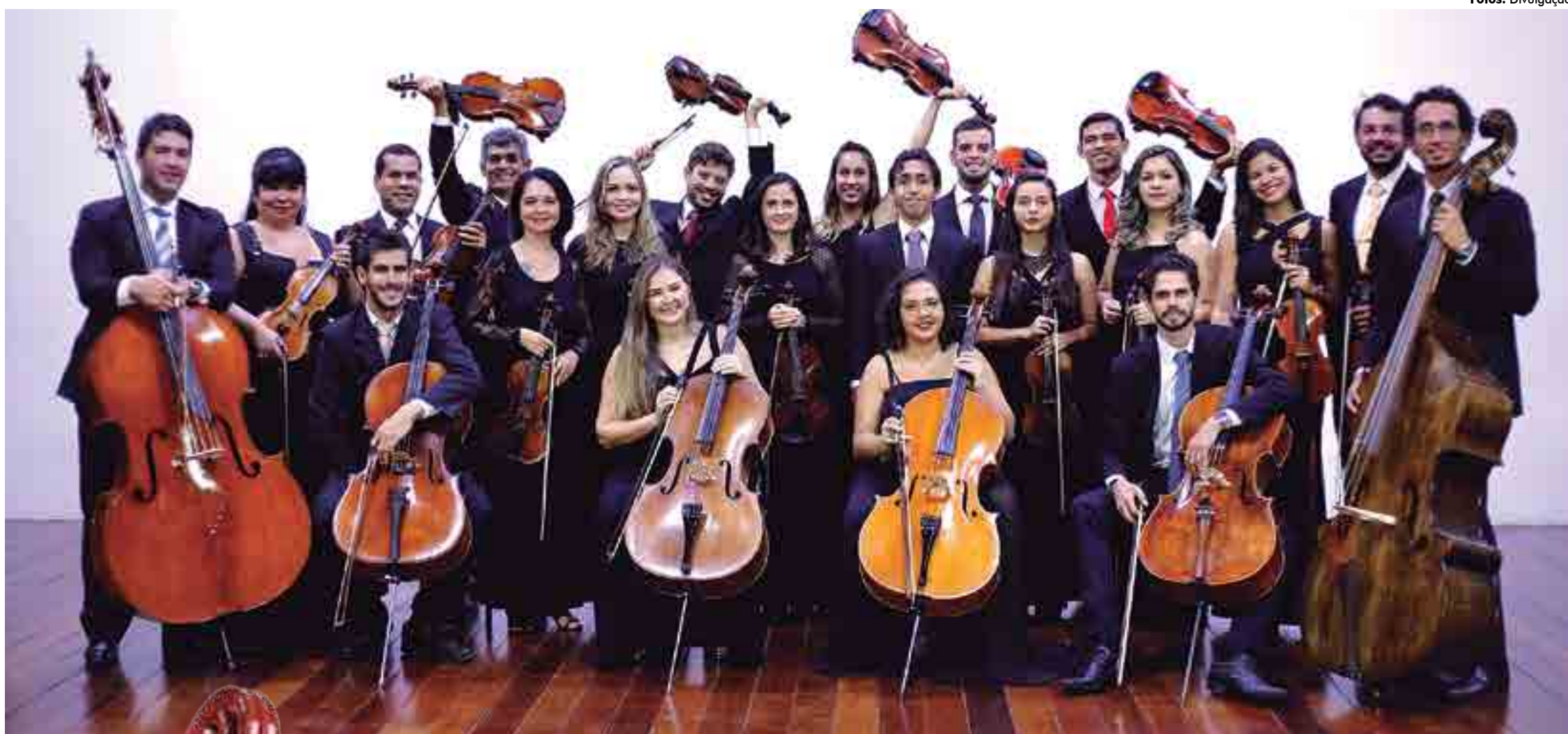
A Orquestra Sinfônica da Universidade Federal da Paraíba pertence ao Centro de Comunicação, Turismo e Artes e contribui para a formação de novos músicos e para o fomento da música erudita no Estado