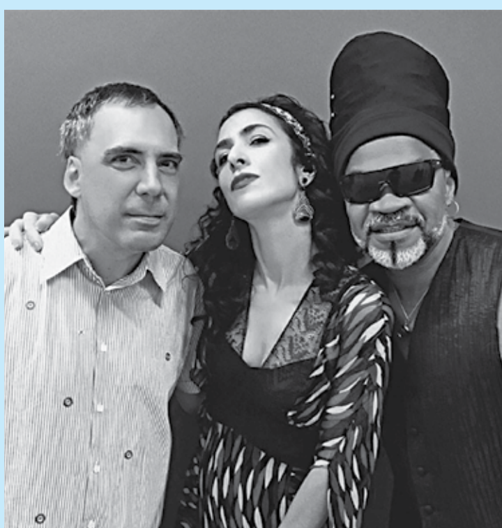
Arnaldo Antunes, Marisa Monte e Carlinhos Brown integram o grupo

O trio retorna à cena após passados 15 anos do lançamento do primeiro trabalho em CD e DVD, que na época superou a marca de três milhões de cópias e logo se tornou um fenômeno não apenas no Brasil, mas também em vários países do mundo, principalmente na França, Itália, Espanha, Portu-