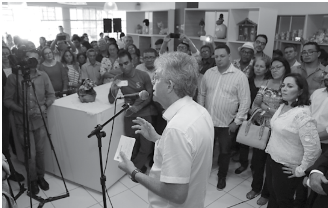
Governador destacou que a economia solidária é uma alternativa na qual as pessoas podem, juntas, produzir mais e melhor

Para o governador Ricardo Coutinho, a economia solidária é uma alternativa na qual as pessoas podem, juntas, produzir mais e melhor. "Esse é um ramo em que o Governo do Estado acredita e colabora para seu desenvolvimento. O EcoParaíba é importante para a agricultura familiar, para o artesanato, para os catadores de mate-