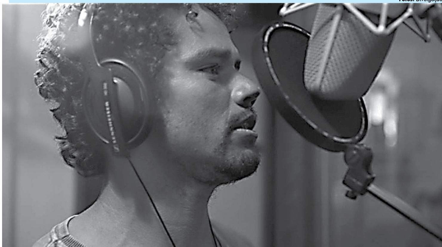
Album é produzido por Ney Matogrosso, que reconheceu o trabalho do pescador e percebeu o potencial artístico para a cena musical nacional