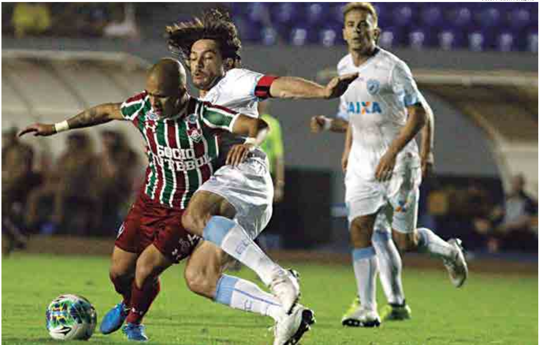
O Fluminense perdeu de 2 a 0 para o Londrina e agora foca as suas atenções no Campeonato Brasileiro e ainda na Copa Sul-Americana, onde vai enfrentar a LDU no próximo dia 14, no Rio

Já na Sul-Americana, o Fluminense encara a LDU nas oitavas de final. A primeira partida acontece no Maracanã, no