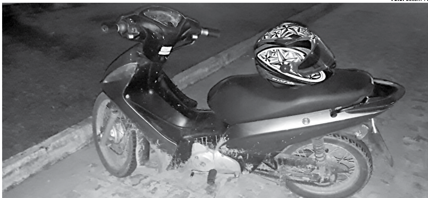
Motocicleta recuperada tem sistema de rastreamento por GPS, o que possibilitou os policiais da 6ª Companhia Independente chegar até ela