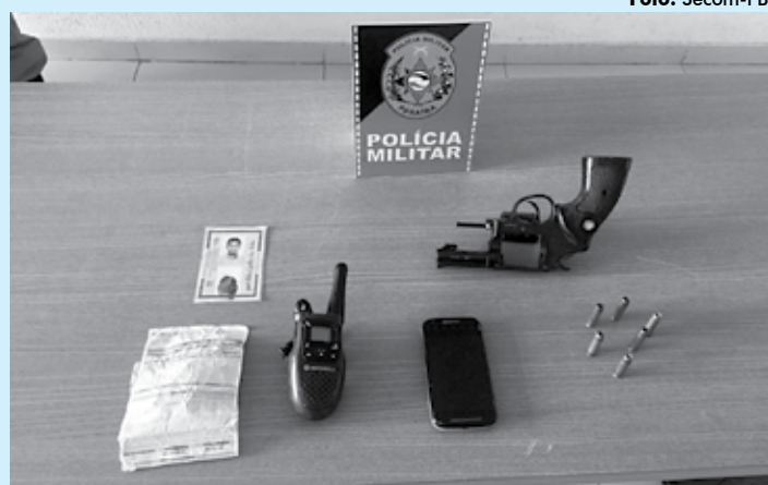
Rádior comunicador, telefone celular, munição intacta e um revólver 38

A Polícia Militar prendeu, na manhã de ontem, um homem que foi flagrado com um revólver calibre 38 e um rádior comunicador de baixa frequência, normalmente usado para falar em comunicações apenas de um ponto a outro não muito distantes.