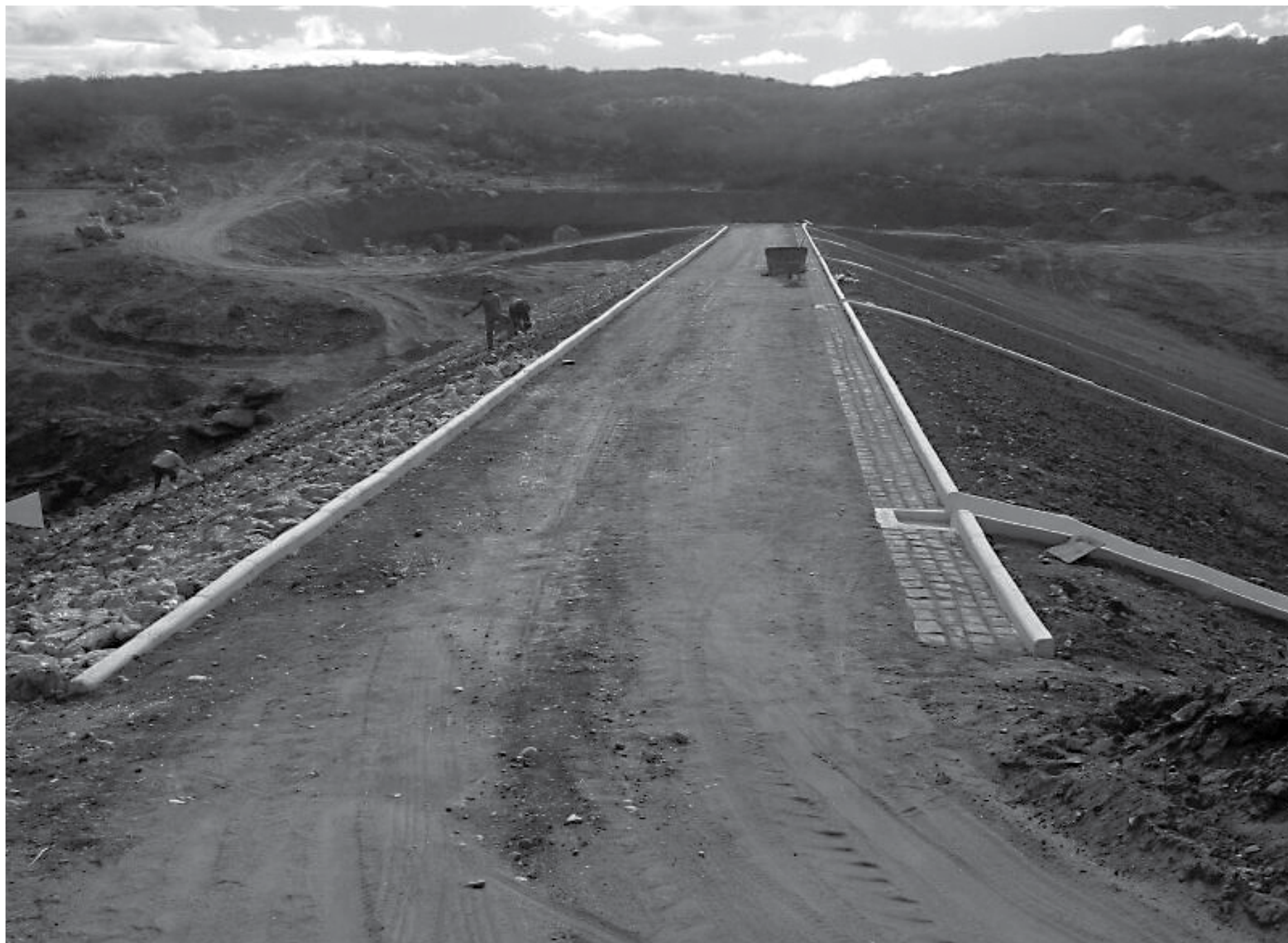
Sangradouro da Riacho Fundo, que é capaz de acumular quase 300 mil metros cúbicos, está 90% concluído, faltando apenas a construção do muro-guia das águas de sangria

"Após um importante programa de recuperação de barragens, que já recuperou 30 delas, e após a construção da barragem de Jandaia, em Bananeiras, e a reconstrução da nova Camará, o Governo indicou