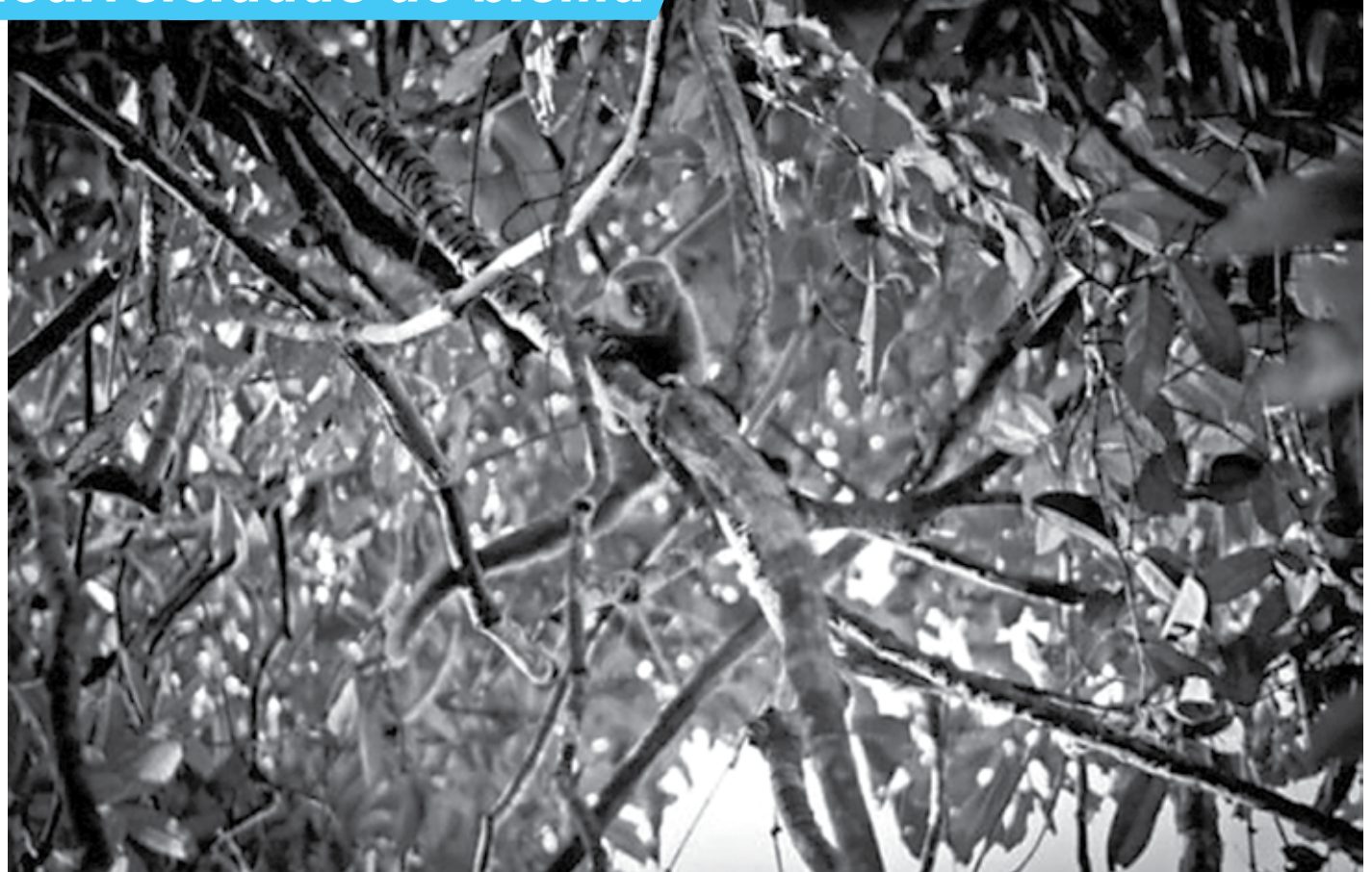
Macaco zogue-zogue-rabo-de-fogo foi descoberto numa expedição do WWF-Brasil em dezembro de 2010 ao noroeste do Mato Grosso