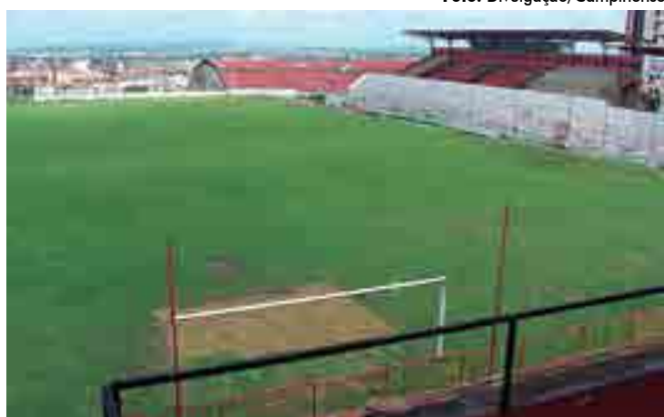
Estádio Renatão passa por reformas no gramado e nas instalações