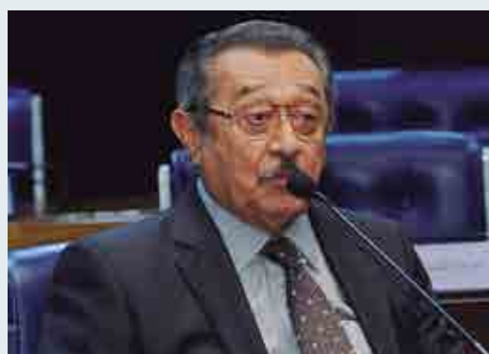
Senador destacou que eixo, no Canal de Piancó, poderá levar água ao Sertão da PB

O senador paraibano reconheceu a coragem do ex-presidente Lula, “que teve