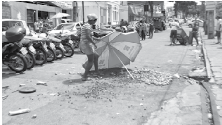
Ambulantes tiveram seus produtos jogados no meio da rua pelos fiscais