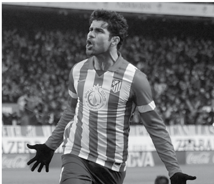
Diego Costa finalmente resolveu o seu problema contratual com o Atlético

De acordo com o jornal, o acordo foi fechado em 55 milhões de euros (R$ 205,24 milhões), mais 10 milhões (R$ 37,32 milhões) em bônus de produtividade. O contrato será até 2021.