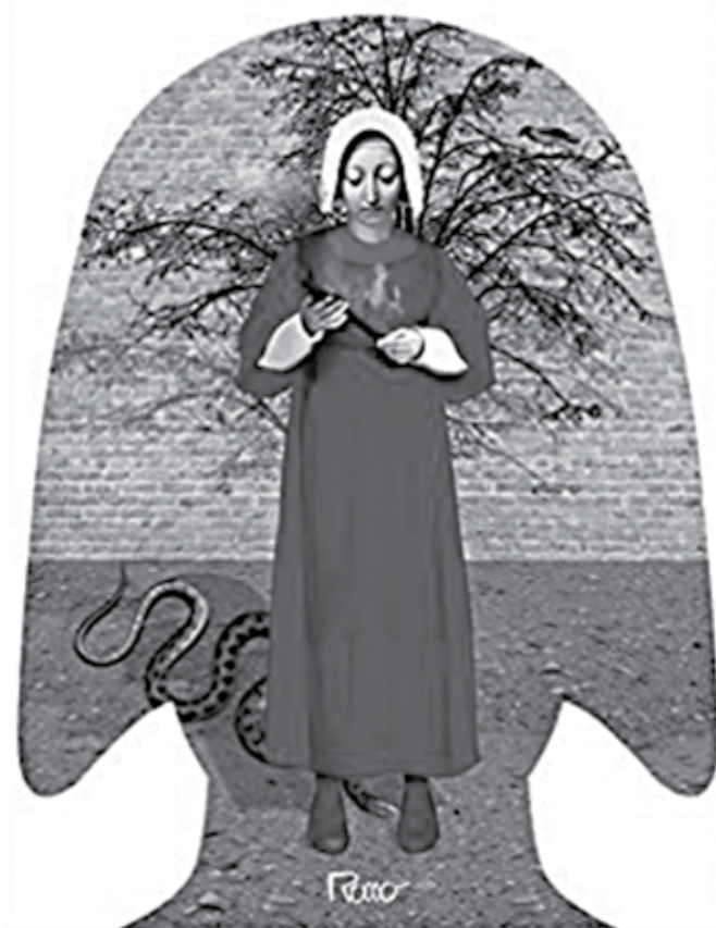
Capa da obra de Margaret Atwood, lançado em 1985