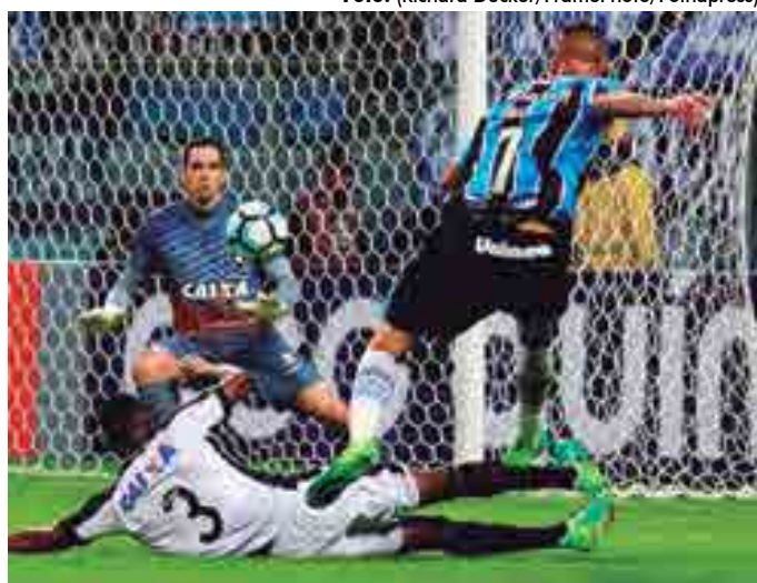
O Grêmio é o único time brasileiro ainda na Taça Libertadores

“Tenho mais de um mês para pensar. Vou tomar alguns chopos. Agora