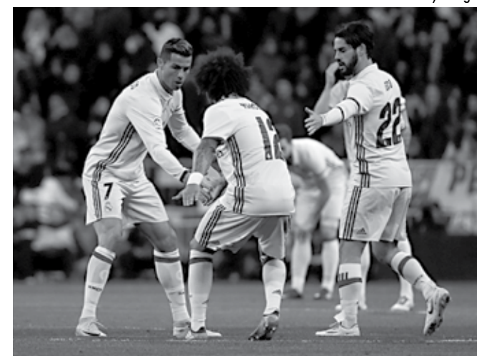
Jogadores do Real têm pouco o que comemorar no campeonato

Alguns números, acompanhados dos fatos mencionados acima, ajudam a compreender o quão negativa é a fase do time madrileno, que até venceu seus dois compromissos fora de casa, contra Deportivo La Coruña e Real Sociedad. No entanto, ainda não ganhou em casa. Depois de empates com Valencia e Levante, o time foi derrotado pelo Real Betis por 1 a 0 nesta quarta-feira, dia em que