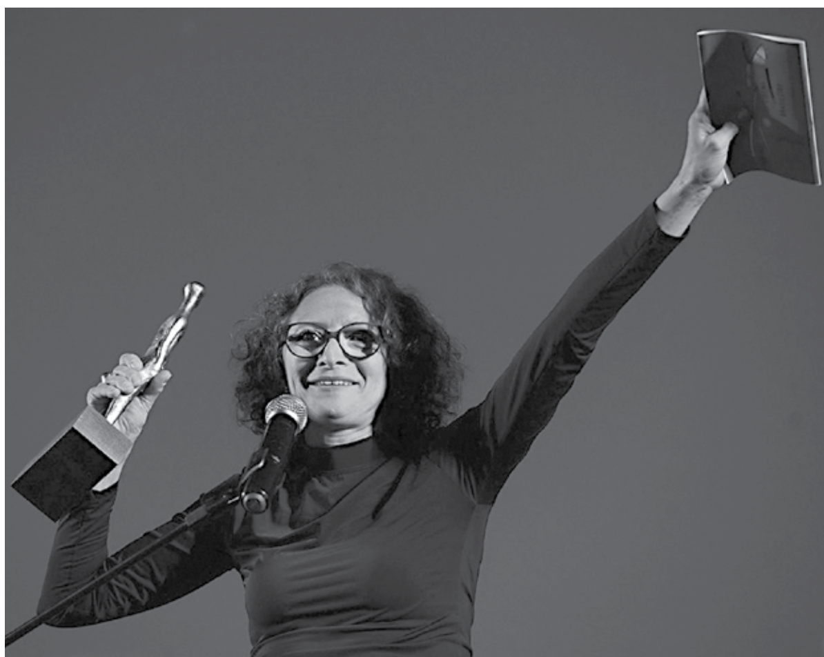
Marcélia contracenando com o também paraibano Zé Dumont, no filme 'A Hora da Estrela' (acima), lançado em 1985 e quando ganhou o prêmio de melhor atriz na edição do ano passado (lado)