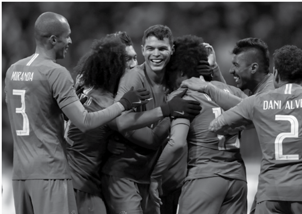
Jogadores comemoram gol sobre a Rússia em amistoso disputado no mês passado na terra da Copa de 2018

Liverpool (ING) x Roma (ITA) Quem vai ao jogo: Tite e Edu Gaspar