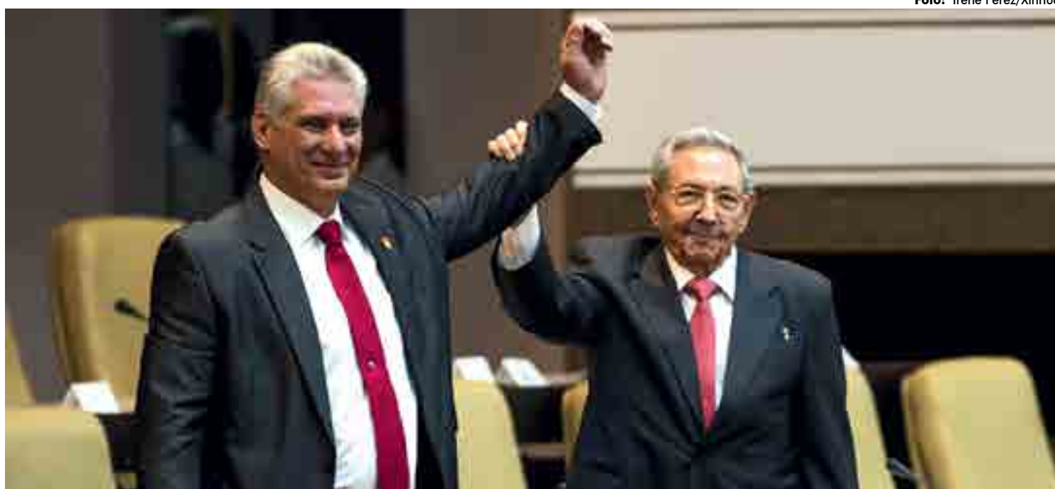
Raúl Castro (D) empossa Miguel Díaz-Canel como novo presidente da Cuba, primeiro civil a ocupar a presidência da ilha após o fim da era Castro

Lembrado por ser um dirigente que andava de short e de bicicleta, soube construir uma imagem mais renovada e moderna, defendendo o desenvolvimento da Internet e de uma imprensa