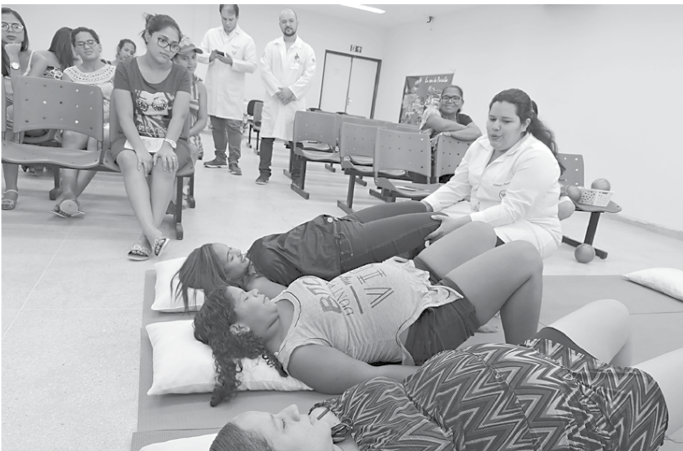
Mulheres foram atendidas por uma equipe multidisciplinar e participaram de treinamento com orientações de nutricionista, psicólogo e fisioterapeuta