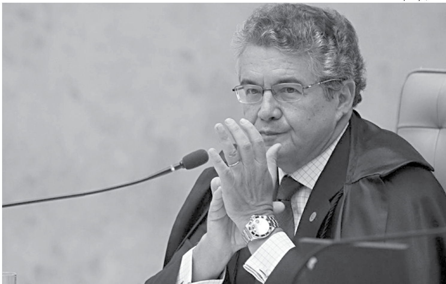
O ministro Marco Aurélio é o relator da nova ação declaratória de constitucionalidade que foi protocolado no Supremo Tribunal Federal pelo PCdoB

Outras duas ADCs sobre o assunto tramitam no STF, uma de autoria da Ordem dos Advogados do Brasil (OAB) e outra aberta pelo PEN (Partido Ecológico Nacional). O mérito de ambas ainda não foi julgado, mas Cármen Lúcia já indicou que não pretende incluí-las na pauta do plenário. Horas depois de o STF ter negado