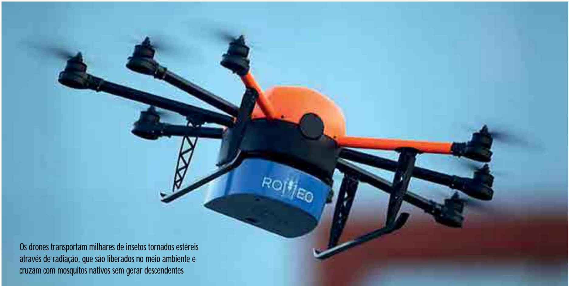
Os drones transportam milhares de insetos tornados estéreis através de radiação, que são liberados no meio ambiente e cruzam com mosquitos nativos sem gerar descendentes

A instituição foi escolhida pela agência de energia nuclear das Nações Unidas e é a primeira biofábrica do mundo a utilizar a tecnologia de raios-x para esterilização de insetos e controle biológico de pragas. O doutor em radioentomologia pelo Centro de Energia Nuclear Aplicada à Agricultura da Universidade de São Paulo (USP) e diretor-presidente