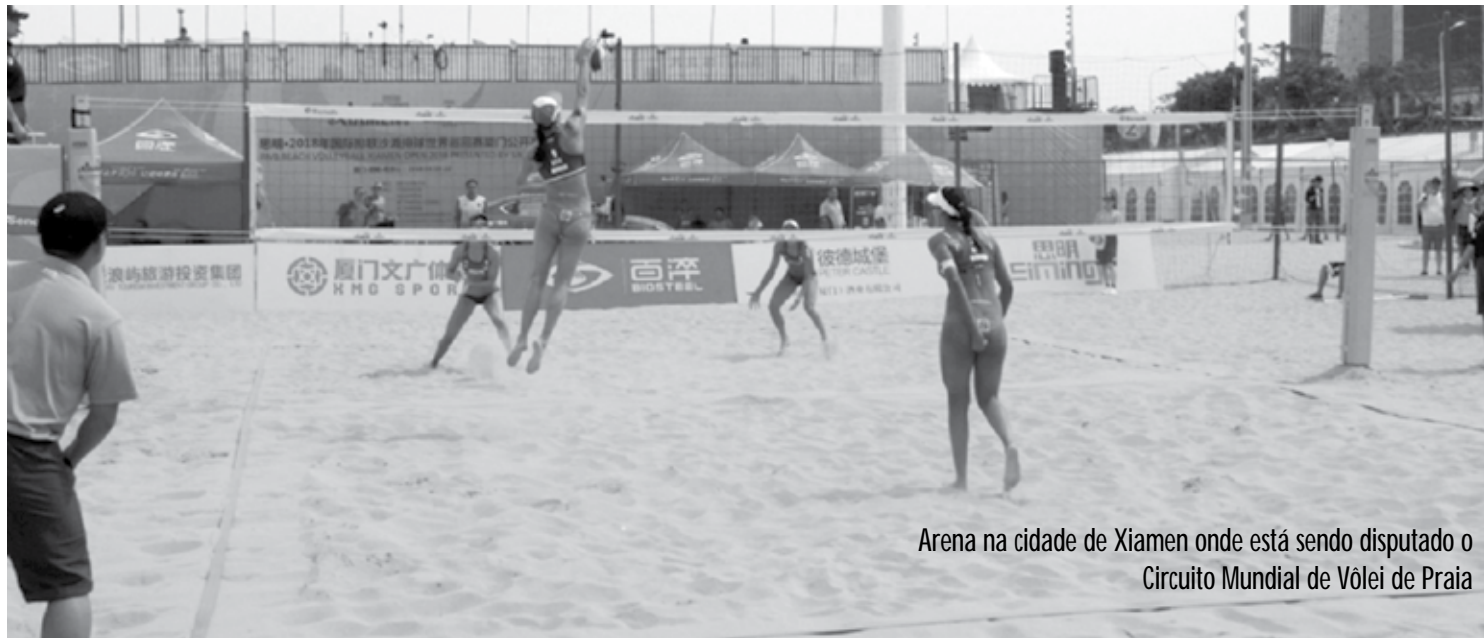
Arena na cidade de Xiamen onde está sendo disputado o Circuito Mundial de Vôlei de Praia